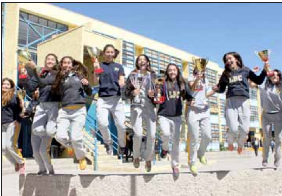
De una explosividad juvenil es de lo que estas jóvenes deportistas sanfelipeñas hacen derroche en cada juego que disputan.