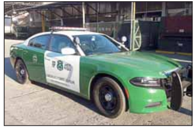
Tres patrullas fueron destinadas para su uso en carreteras de la provincia de San Felipe. Estos Dodge Charger pueden alcanzar grandes velocidades en caso de seguimiento a un vehículo que eluda el control policial.