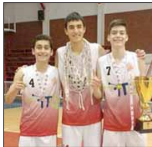
Tres de los mejores proyectos de San Felipe Basket integrarán la selección chilena U15.

Desde su club, el San Felipe Basket, salieron muchas muestras de satisfacción y orgullo al ver que su entrenador y tres jugadores tendrán la linda misión de representar a Chile vistiendo 'La Roja de Todos'.