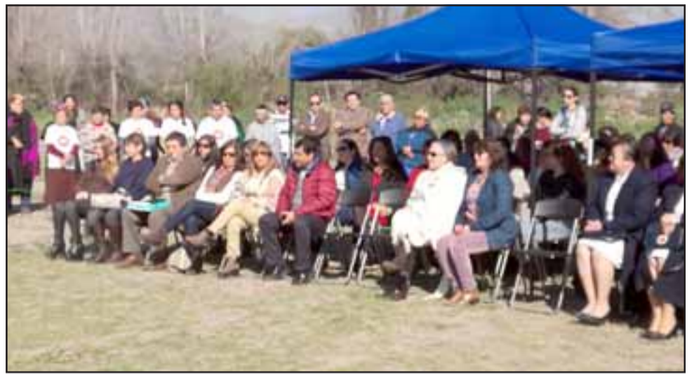
Se conmemoró el Día Internacional de la Mujer Indígena en la comuna de Calle Larga, jornada en la que se recuerda el asesinato de Bartolina Sisa.

Cabe resaltar que la Asociación de Grupos Originarios Indígenas Fütá Repü de