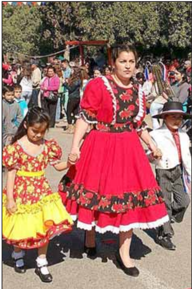
SIEMPRE PROTECTORAS.- Las profesoras también se engalanaron durante la actividad al lado de sus estudiantes.

Todo un festival comunitario de alegres momentos, fue la celebración del 252º Aniversario de Población El Asiento, pues todos los vecinos salieron a las calles para vivirlo con alegría.