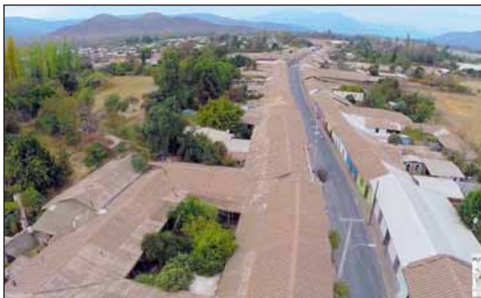
Vista aérea de calle Comercio de la comuna de Putaendo.

Específicamente, el edil de Putaendo explicó que esta extensión del área ur-