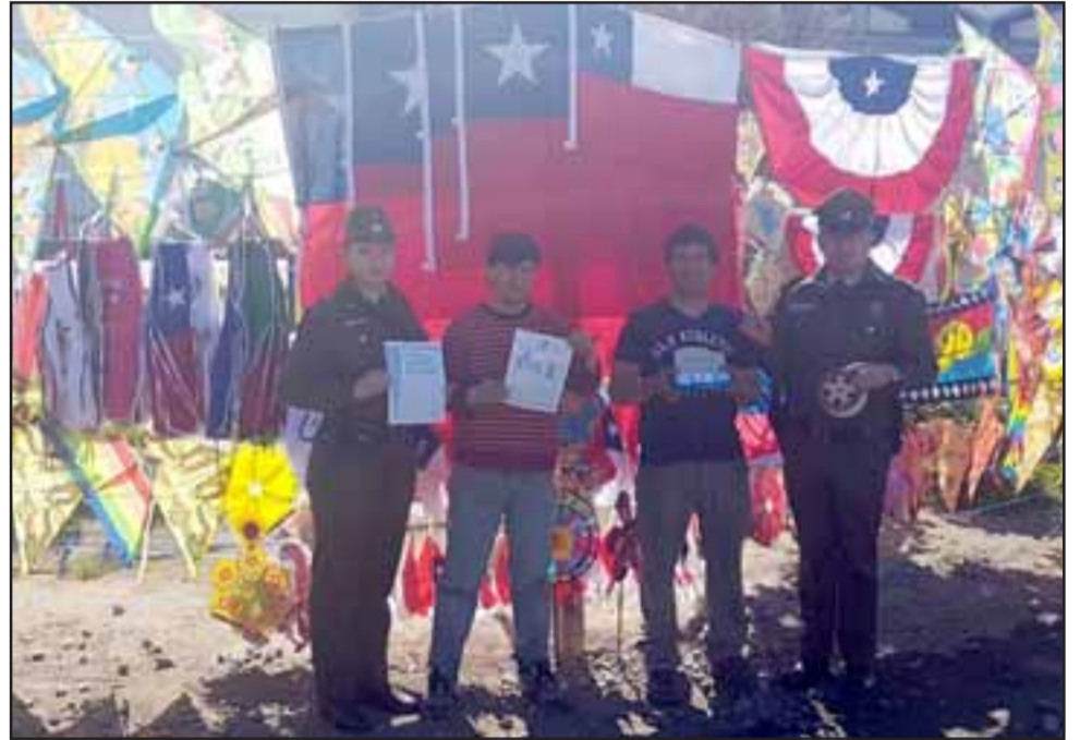
NO MÁS HILO CURADO.- Carabineros está coordinando con los comerciantes que venden volantines, para evitar que el 'hilo curado' se venda en la calle.