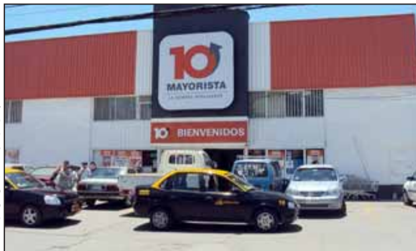
El Supermercado Mayorista 10 se ubica en calle Santo Domingo 111 en San Felipe.