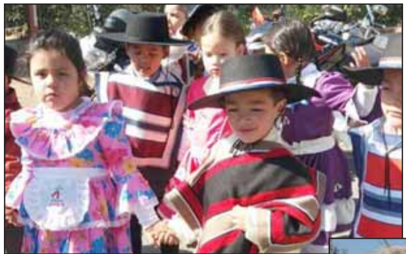
MUY GUAPOS.- Los niños de la Escuela José Bernardo Suárez también como anfitriones, desfilaron por las calles de su población.

Esta comunidad está conformada por unas 400 familias y en el sector viven al menos unas 1.200 personas. El Asiento es un pueblito conge-