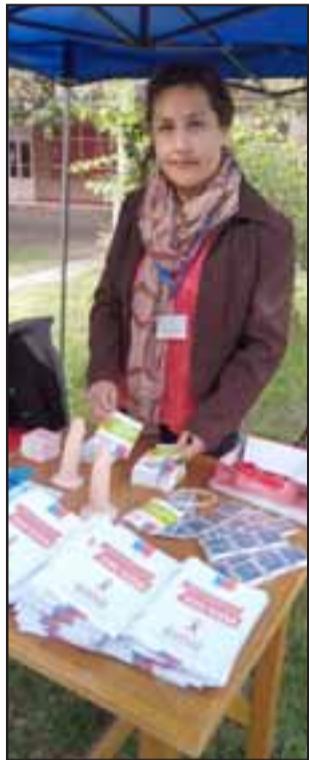
Conversatorio organizado por el SSA abordó temáticas tan importantes como Sexualidad Responsable y Prevención de enfermedades de Transmisión Sexual.

Un centenar de alumnos de 3° y 4° medio de distintos es-