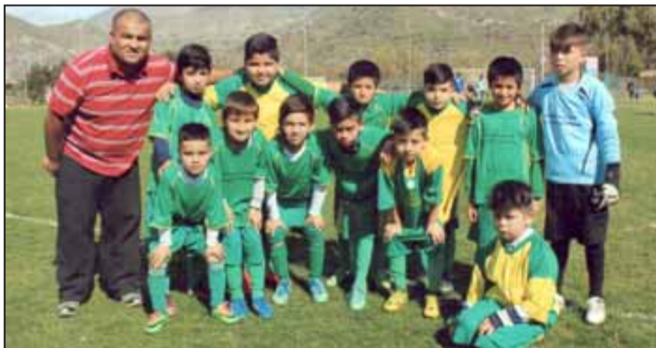
Estos pequeños defienden con mucho amor la camiseta del club Manuel Rodríguez.

Las imágenes que ahora compartimos con nuestros lectores, fueron captadas por el lente de nuestro colaborador Roberto Valdivia, el que, en una de sus tantas andanzas por las canchas y recintos deportivos de la zona, fue abordado por dirigentes, padres y apoderados del Manuel Rodríguez, para que el 'fotógrafo vacuna' retratará a sus pequeños.