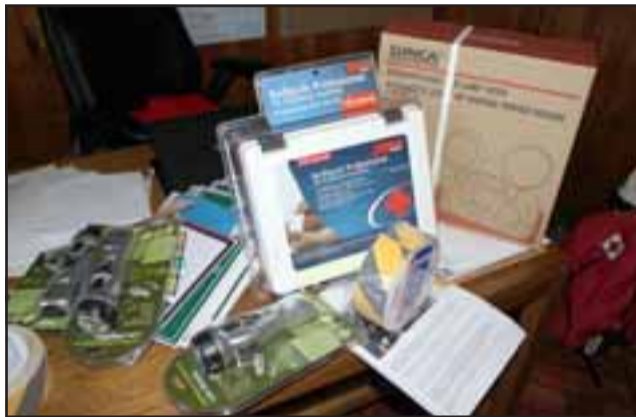
MUY VALIOSOS. - Los implementos de emergencia que estos kits tienen son de gran utilidad en casos de emergencias comunitarias o domésticas.

Esta semana culminó el programa 'Guardianes Ambientales', propuesta que inició en marzo y que es financiada y ejecutada por Caritas Chile, vinculada al Fondo Nacional de Cuaresma de Fraternidad del Obisado de San Felipe.