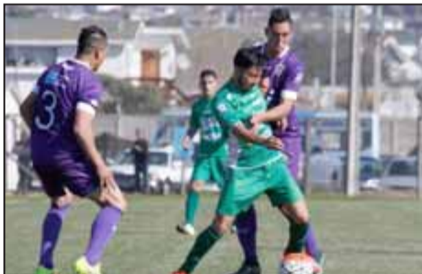
El conjunto andino hará mañana su estreno como local.

Sábado 10 de septiembre 15:30 horas, Colchagua – Santa Cruz 16:00 horas, Naval – Lota Schwager 17:00 horas, Trasandino – Melipilla 18:00 horas, Malleco – Independiente