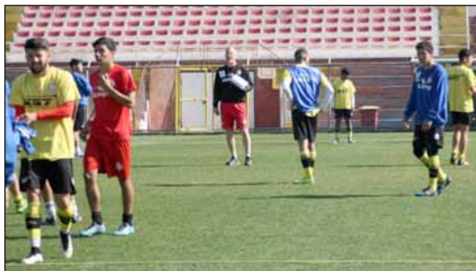
Luego de tres semanas el Uní volverá a la acción en el torneo de la Primera B.