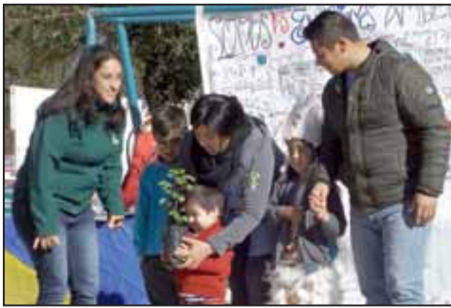
SIEMBRA UN ARBOLITO. - Cada niño de esta escuela recibió un arbolito para plantarlo en El Asiento, aún quedan más árboles para regalar a los vecinos.