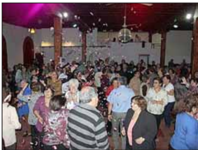
La actividad está programada a las 16:00 horas en La Casa del Rayuelero, en el sector de la Pirca, siendo convocado la totalidad de los clubes de adultos mayores. (FOTO REFERENCIAL)

"Tenemos los talleres, los clubes, los viajes, las jornadas de participación, todo ello apoyado por la oficina de organizaciones comunitarias, que hasta ahora ha sido un gran aporte a cada una de esas entidades de la comuna".