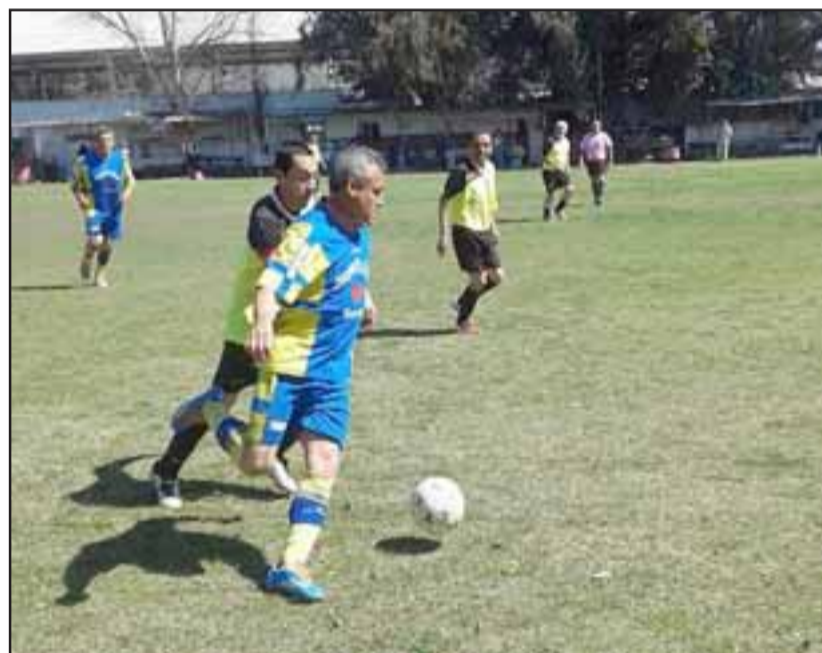
Una fecha en la que el puntero buscará seguir marcando supremacía es la que se jugará el domingo en la cancha Parrasía.