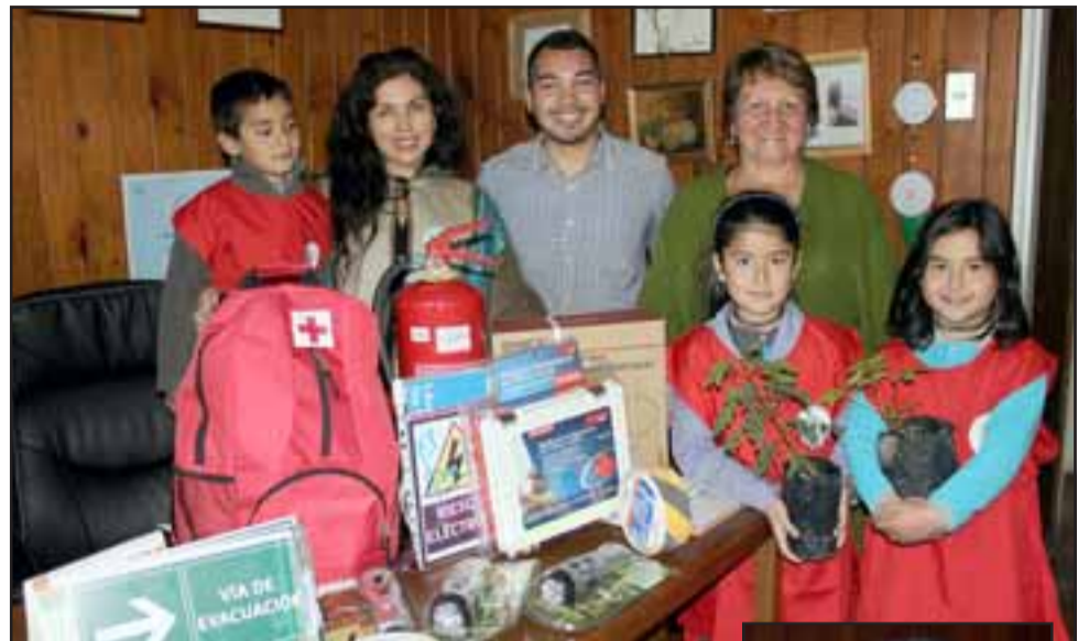
Personal de la Escuela José Bernardo Suárez, de El Asiento, muestran a Diario El Trabajo parte de los kits de emergencia donados por Caritas Chile.

«Este es un programa en el que 16 niños recibieron el título de 'Guardianes Ambientales', hoy estamos terminando con la entrega de nueve kits de emergencia a la escuela, recursos que comprometen vendas, alcohol y hasta linternas, agua y baterías, así como todo un paquete de recursos básicos a fin de enfrentar largos periodos sin agua o condiciones similares a las que imperan tras un terremoto, todo este trabajo también lo realicé con