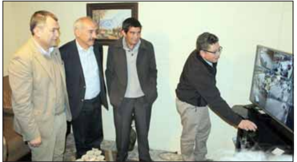
Vecinos de la calle Abdón Cifuentes del Barrio Las Acacias, quienes con el apoyo de la Municipalidad de San Felipe lograron implementar en su sector, un moderno sistema de cámaras de vigilancia cuyo monitoreo pueden hacer a través de su teléfonos celulares.

Por último, el jefe comunal extendió la invitación a la comunidad para que siga organizándose y generando iniciativas como la desarrollada exitosamente por los vecinos de Las Acacias.