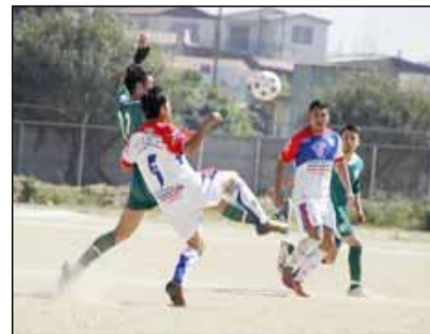
Este fin de semana se jugarán los partidos de revancha correspondientes a la primera etapa del Regional de honor del fútbol amateur.

16:30 horas, Panquehue – La Ligua Puchuncaví 16:30 horas, Calle Larga – El Belloto 19:30 horas, Villa Alemana – Santa María 16:30 horas, Rinconada – Forestal Alto 19:30 horas, Los Andes – Alejo Barrios 16:30 horas, Putaendo – Las Ventanas Domingo 11 de septiembre 18:00 horas, Rural Llay Llay – Llay Llay 12:30 horas, Algarrobo – San Esteban 16:30 horas, San Felipe – 16:30 horas, Artificio – Catemu