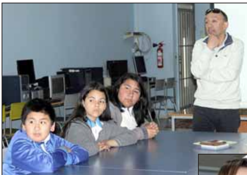
MUCHAS PREGUNTAS. - Los chicos uno a uno realizaron preguntas al director de Diario El Trabajo sobre periodismo.

El licenciado en Ciencias de la Comunicación, destacó que «esta es una experiencia muy gratificante para mí, me siento muy honrado el haber abierto estas jornadas o conversatorios en el marco de este aniversario, las