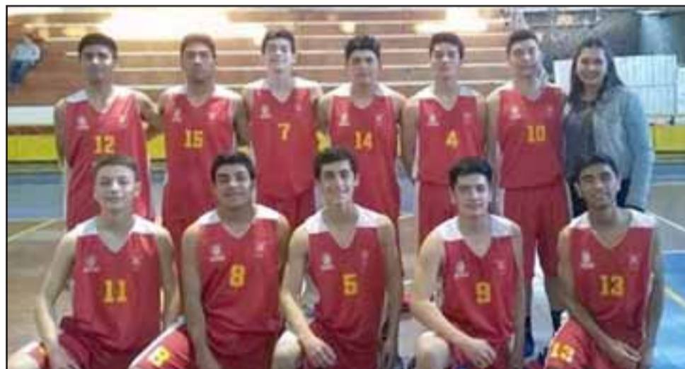
La selección U15 de San Felipe es candidata para quedarse con el Nacional Federado que desde hoy se jugará en el gimnasio del Mixto.