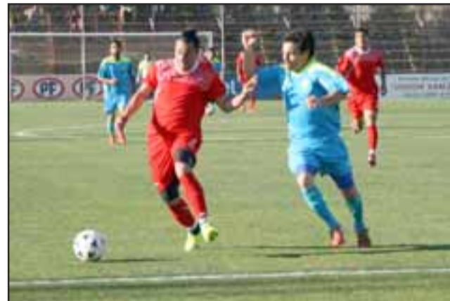
Seis a dos se impuso San Felipe a Puchuncaví en el duelo de revancha del torneo Regional amateur.