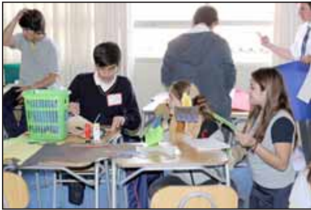
TALENTO MANUAL. - También hicieron talleres de manualidades, así, crearon figuras en papel, cartón y otros materiales.