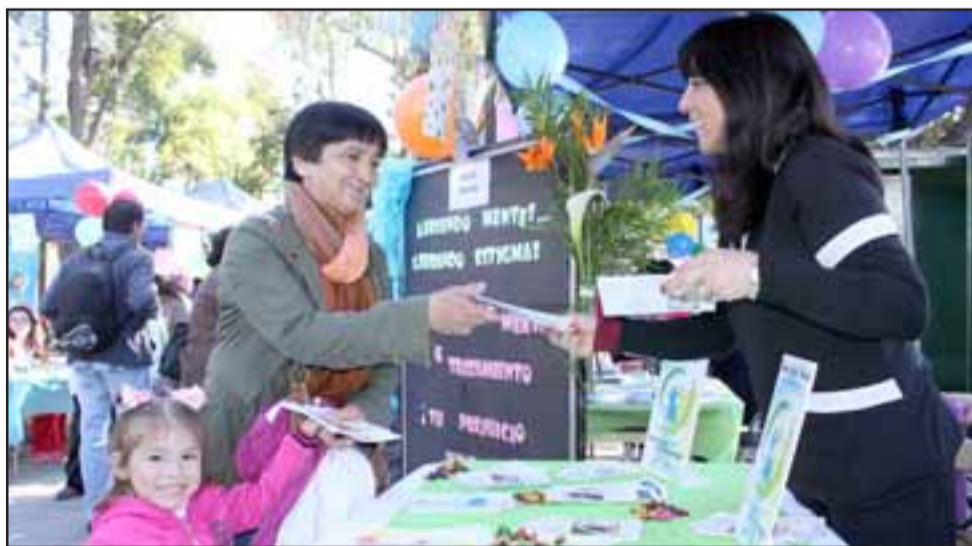
MUCHA INFORMACIÓN.- Grandes y pequeños se informaron sobre muchos temas de salud, recibieron información y charlas saludables.