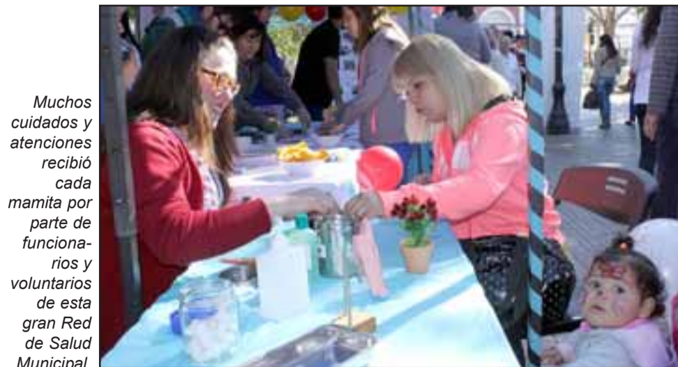
Muchos cuidados y atenciones recibió cada mamita por parte de funcionarios y voluntarios de esta gran Red de Salud Municipal.