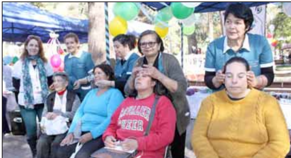
REGALONEADAS.- Las damas recibieron su buen masaje y otros mimos en esta masiva actividad.