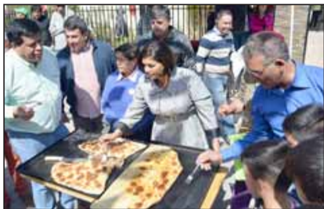
En la actividad se efectuaron juegos típicos; como el trompo, palo encebado, tirar la cuerda, el volantín más hermoso, la empanada más grande.

Finalmente el edil, agradeció a todos los que hicieron posible que esta actividad sea un éxito y manifestó sus deseos de que Santa María y el Valle del Aconcagua disfruten con mucha alegría pero también con responsabilidad, de unas felices Fiestas Patrias.