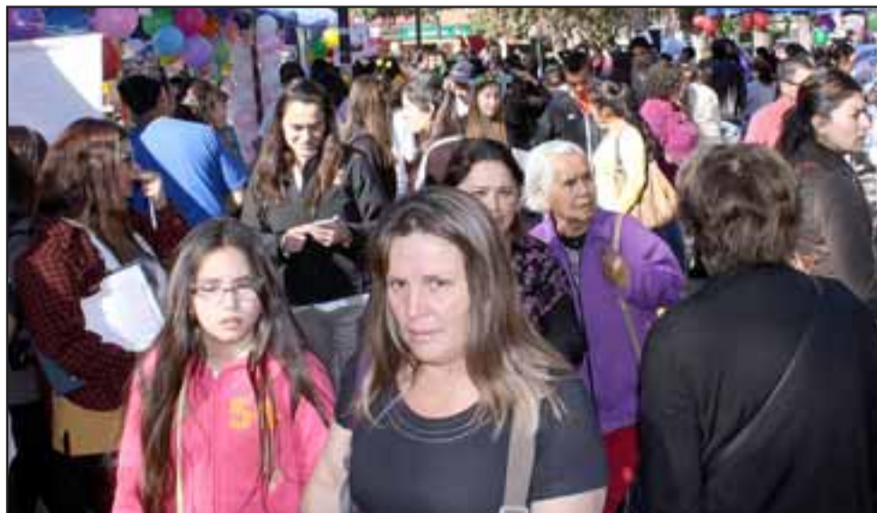
MASIVA CONVOCATORIA.- Como lo muestra esta gráfica, fueron casi 1.500 personas las que asistieron a esta feria de la salud.