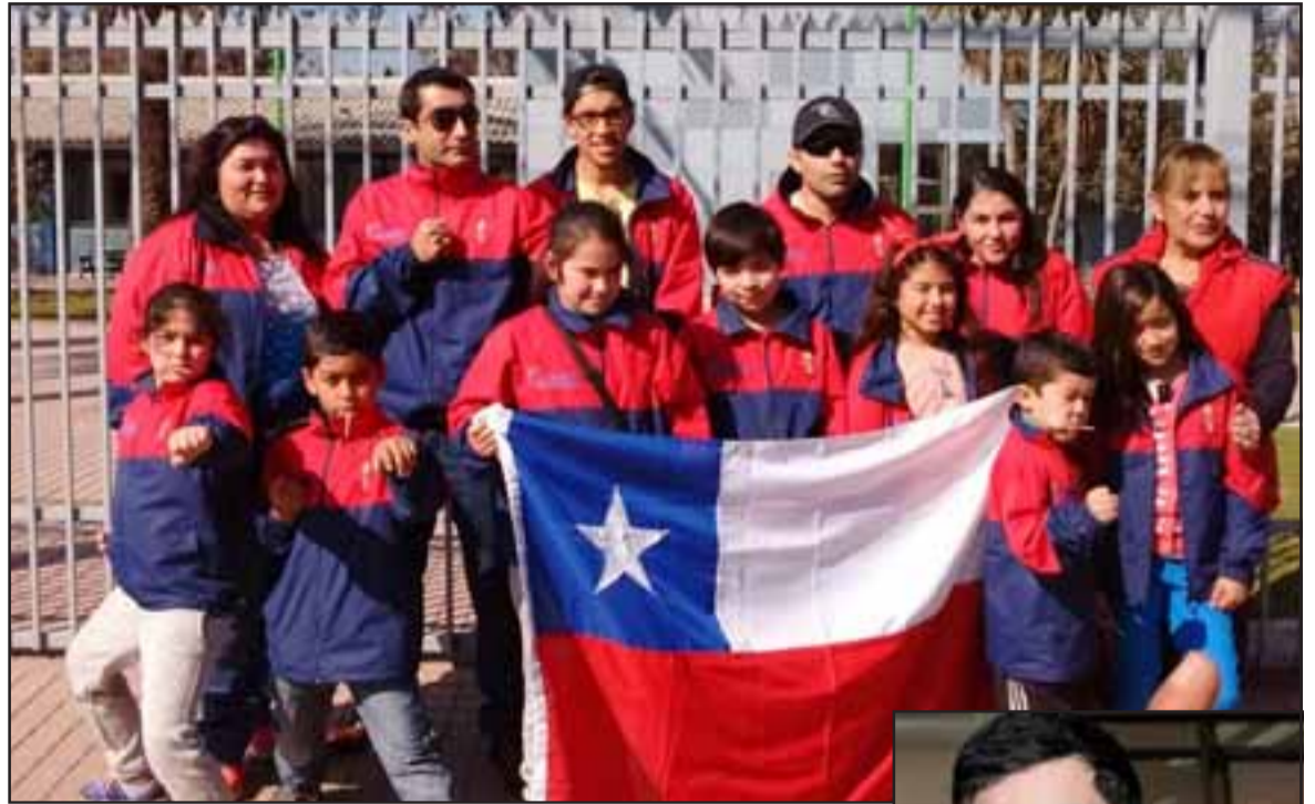
TRIUNFAN EN URUGUAY. - Aquí tenemos a nuestros campeones aconcagüinos, posando para Diario El Trabajo en Uruguay.