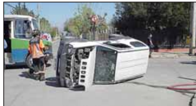
Los cuatro ocupantes del Suzuki resultaron heridos.

dos calles, razón por la cual se produjo esta violenta colisión.