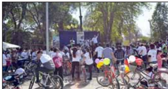
Con una masiva convocatoria entre asistentes y participantes, y recorriendo diversos sectores de la comuna terminando en la plaza de armas, se realizó la Cuarta Gran Cicletada Familiar de Santa María.