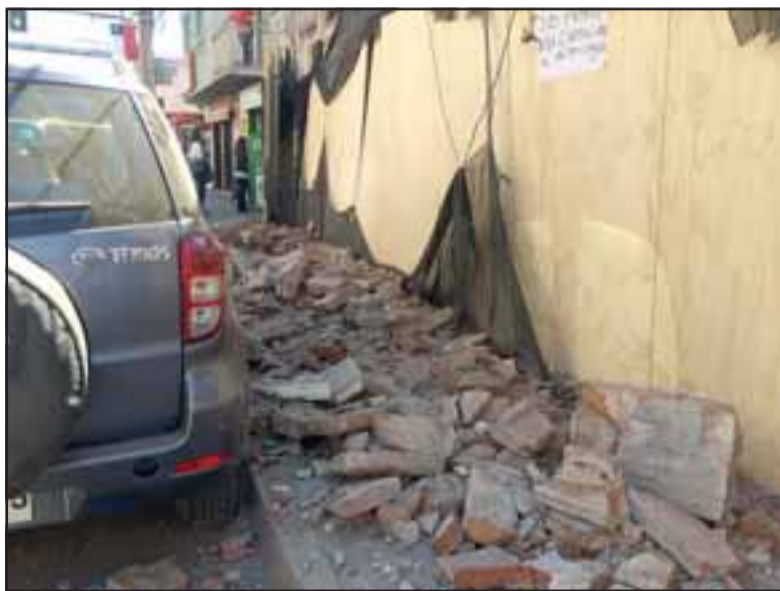
Los escombros cayeron hacia la vía pública de calle Prat tras el derrumbe que se originó en las faenas que se ejecutan en la construcción del nuevo centro comercial.