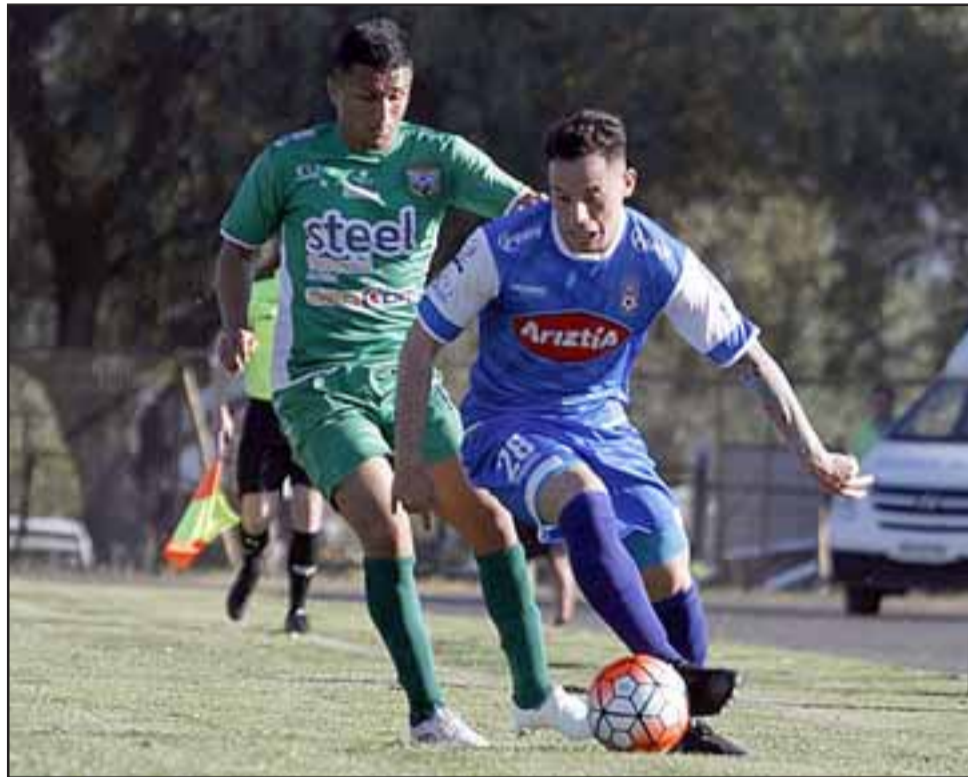
En el Regional de Los Andes, Trasandino sufrió un severo revés frente a Melipilla.

Barnechea 4 – Vallenar 2; La Pintana 1 – San Antonio 0; Colchagua 1 – Santa Cruz 2; Naval 1 – Lota Schwager 0; Malleco 0 – Independiente 3; Trasandino 0 – Melipilla 3.