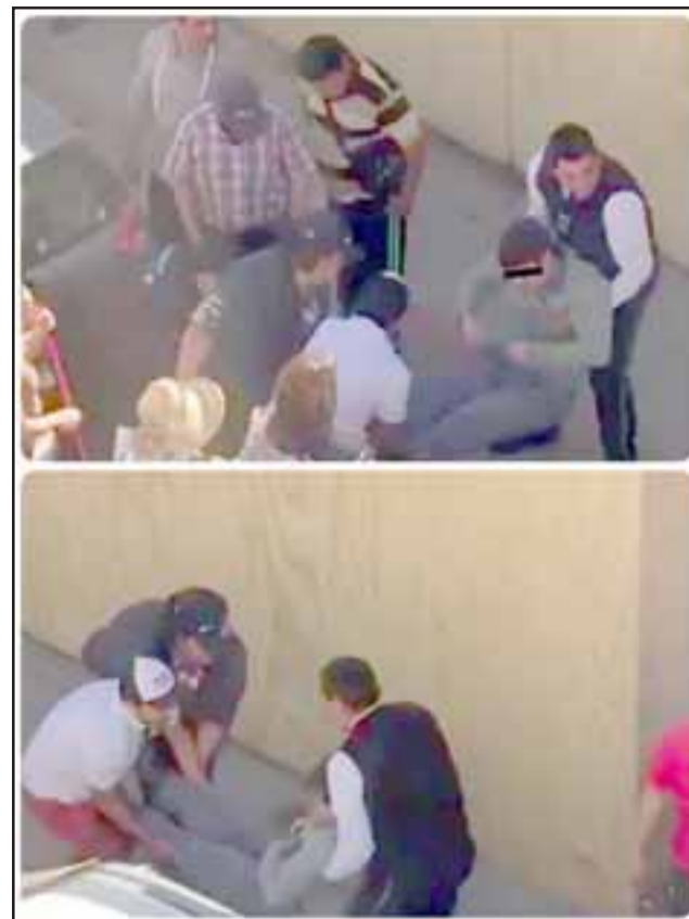
El escolar de 14 años resultó con cortes en el cuero cabelludo, siendo asistidos por transeúntes que lo trasladaron hasta un lugar más seguro a la espera de la llegada del Samu.