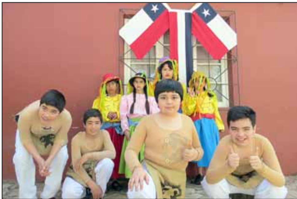
La actividad incluyó creativos cuadros de danza moderna y bailes nacionales, una degustación de gastronomía chilena, entre otras presentaciones.

El tema central de los números artísticos preparados para la ocasión, recreó el inicio de la identidad chilena, desde la llegada de Pedro de Valdivia y el choque cultural entre los antiguos pobladores del territorio chileno y españoles. El programa incluyó la presentación de la delegación de alumnos, que representaron a su establecimiento en el Segundo Campeonato de Cueca en Hijuelas.