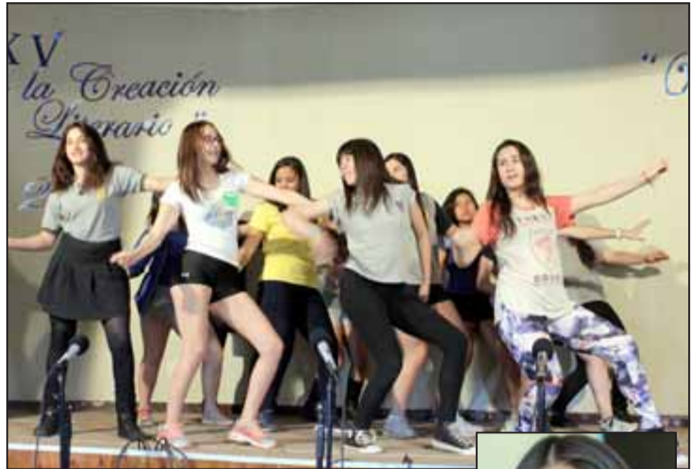
ELECTRIZANTES. - Los estudiantes realizaron dinámicos talleres de danza y teatro, en los que desarrollaron sus destrezas artísticas.

«Una experiencia muy gratificante, llegaron más de 15 colegios del valle, desarrollamos talleres de poesía, pintura, danza, teatro y música entre otras propuestas, pero este año como estamos cumpliendo un cuarto de siglo de realizar este encuentro de manera consecutiva, quisimos también celebrarlo en grande e invitamos al humorista, ac-