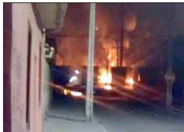
Pese a las cobardes agresiones, los bomberos combatieron el fuego custodiados por Carabineros pasada la medianoche de este domingo.