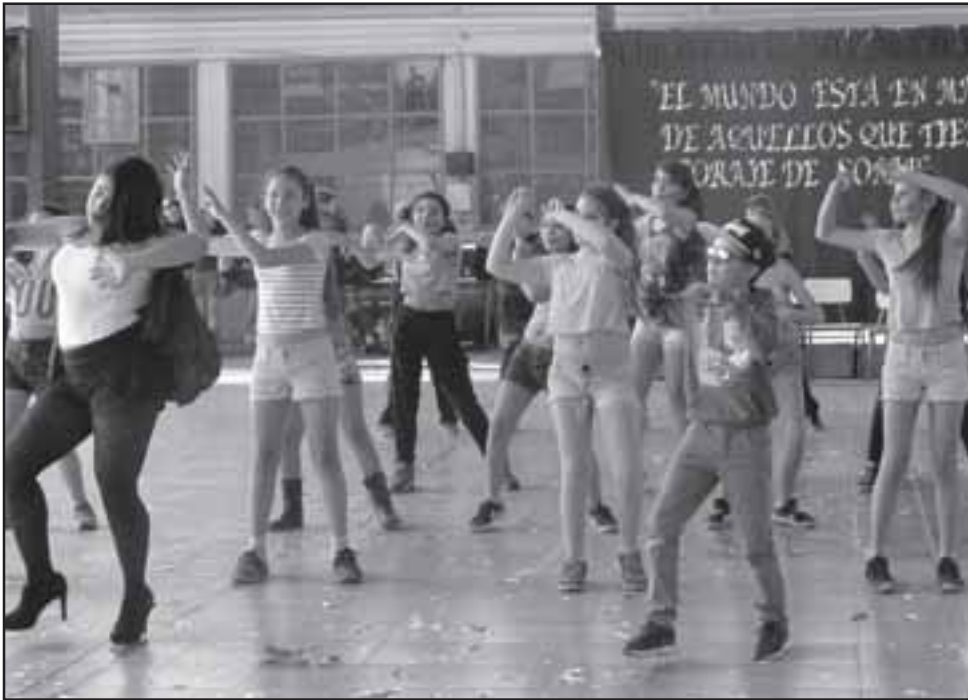
ZUMBA ZUMBA.- Las más jovencitas lo pasaron muy bien con las actividades al aire libre.

Muy felices se encuentra la comunidad educativa del Liceo Darío Salas, de Santa María, la que durante la semana del 5 al 10 de septiembre celebraron con diferentes actividades sus 111º aniversario. Para la ocasión, se organizaron diferentes actividades, las que en conjunto con profesores apoderados, asistentes de la educación y alumnos disfrutaron sanamente.