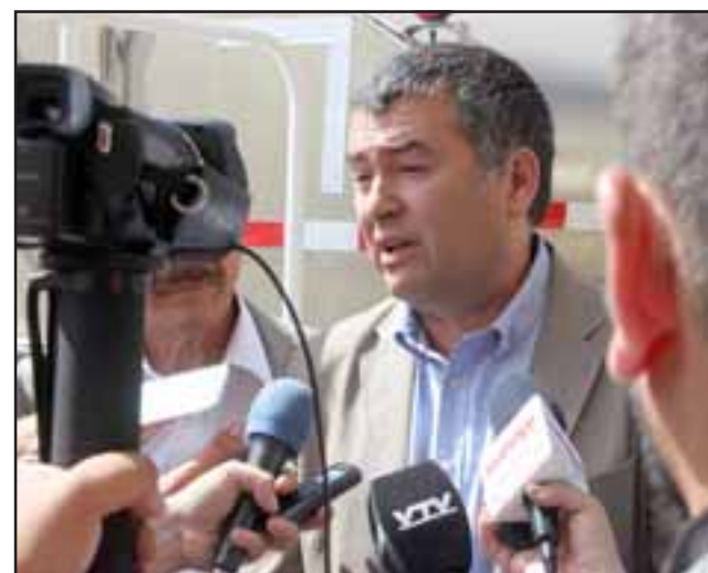
La máxima autoridad provincial entregó una serie de recomendaciones que buscan informar a la comunidad sobre los riesgos de estos delitos.

Prevenir delitos informáticos: cuando realice trámites importantes, verifique que se trate de sitios seguros ( https:// ); las entidades bancarias jamás le van a solicitar actualizar datos por teléfono o correo electrónico; si recibe un correo electrónico que solicite información de este tipo, verifique el remitente y contáctese de inmediato con su