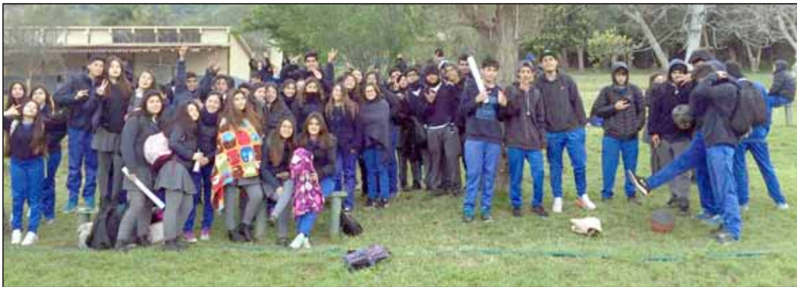
¿QUIÉN APUESTA POR ELLOS?.- Prácticamente toda la Media está solicitando un cambio de inspectora en el Verdoyham School de Llay Llay.

«Hay alumnos que llegan al establecimiento a las 7:30 aproximadamente (a veces antes). El colegio consta de dos portones, el primero lo abren a las 7:45 horas y el otro a las 7:40. Siendo que éste se debería abrir una hora antes del toque de timbre (8:00 horas); se realizan cobros indebidos (ya que es un establecimiento subvencionado); no imprimen trabajos dentro del establecimiento; el equipamiento de sala de computación es mínimo, la mayoría de los computadores están malos; hay falta de mobiliario, elementos de enseñanza y material didáctico; la inspectora, más la dueña y su hijo, inter-