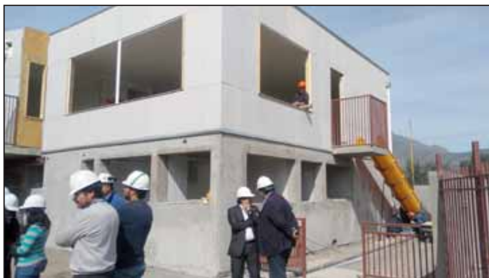
Nuevo Jardín Infantil de Villa Las Acacias, presenta el 78% del total de su obra.

conocer estos establecimientos, estarán abiertos desde el próximo año, así que pueden considerar la incorporación de sus hijos», enfatizó la máxima autoridad provincial.