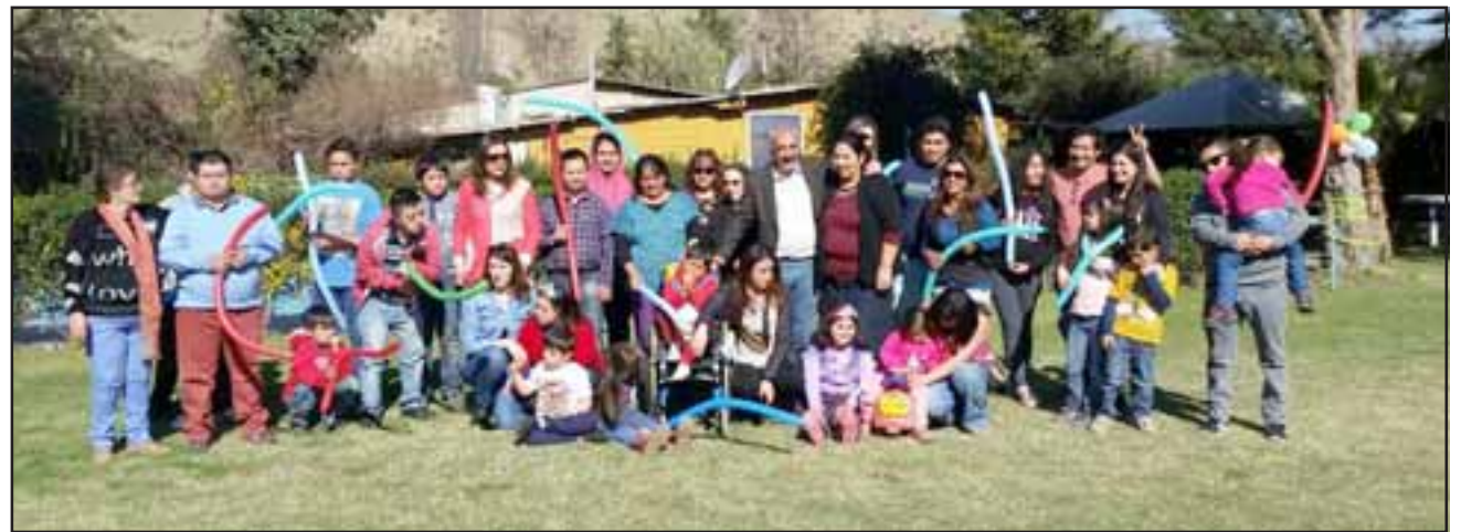
FOTO GRUPAL.- Todos los participantes de la actividad, posando felices para cerrar el emotivo momento vivido.