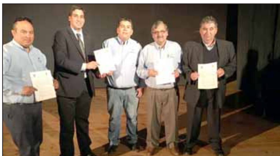
El acuerdo permitirá que quienes estén registrados en los clubes del fútbol amateur reciban descuentos en el valor de las carreras que imparte la casa de estudios en sus sedes de San Felipe y Los Andes.