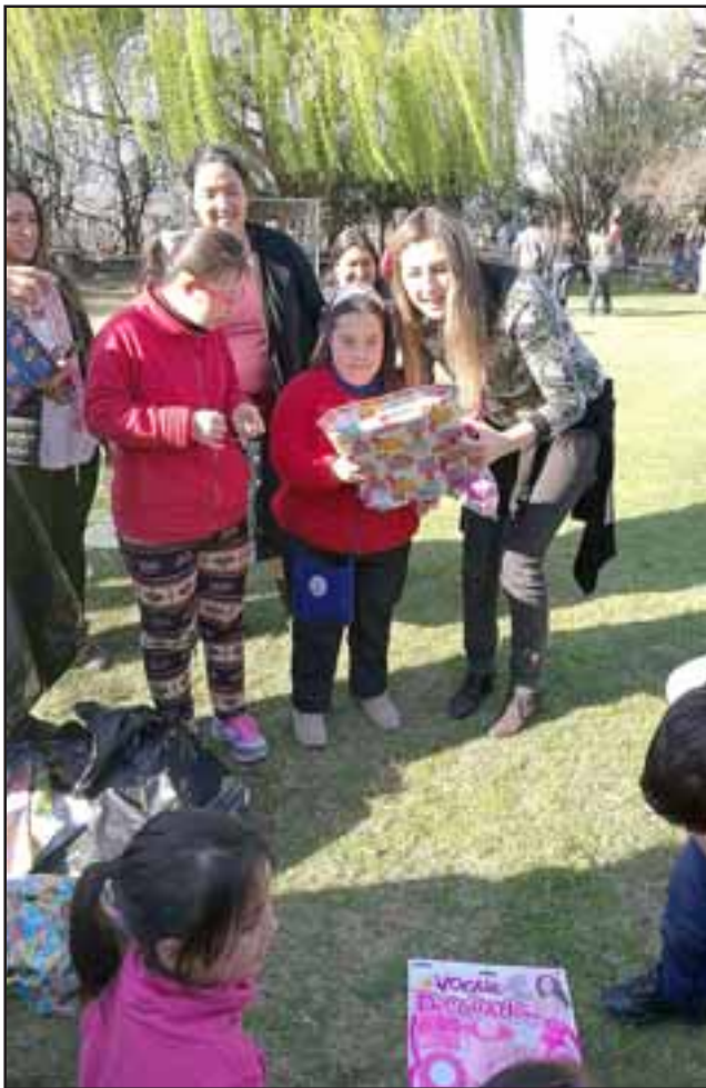
Integrantes de Banco CrediChile, haciendo entrega de obsequios a los pequeños de la Agrupación Down.

El fin de semana recién pasado, en nuestra bella comuna, se realizó una actividad recreativa donde integrantes de las sucursales de Banco CrediChile San Felipe y Los Andes, pudieron compartir junto a niños de Agrupación Down acompañados de sus padres y familiares.