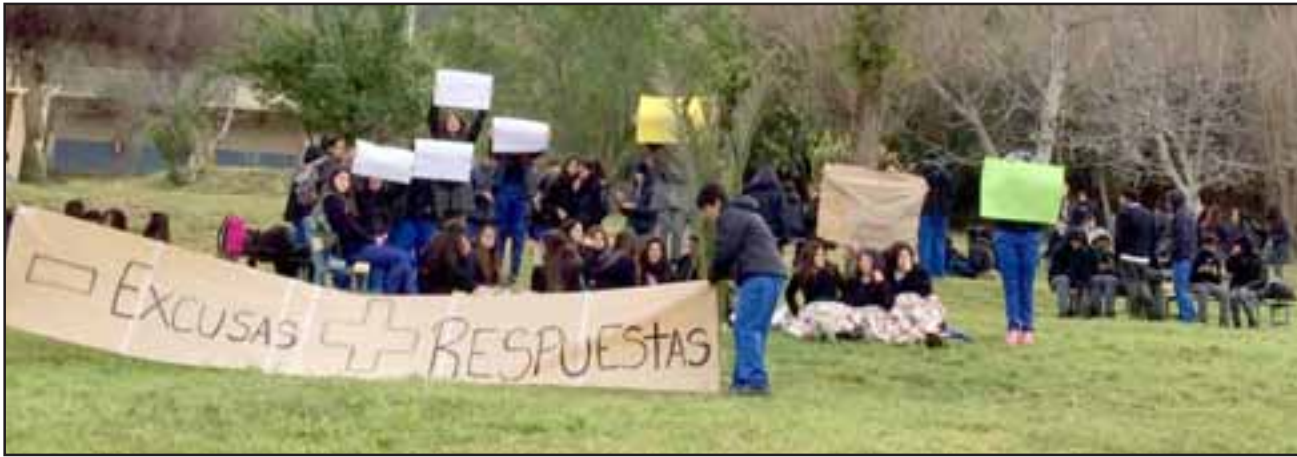
EN TOMA.- Todas estas pancartas fueron 'decomisadas' por los profesores, mientras que nadie pareciera querer dar apoyo a estos jóvenes estudiantes.

Ante esta situación y otras anexas ocurridas permanentemente, los alumnos de séptimo a cuarto año medio, cansados de este hostigamiento, de posibles persecuciones y vulneración de sus derechos, además de no estar de acuerdo con las respuestas dadas por el colegio a sus inquietudes sobre la violencia verbal y física