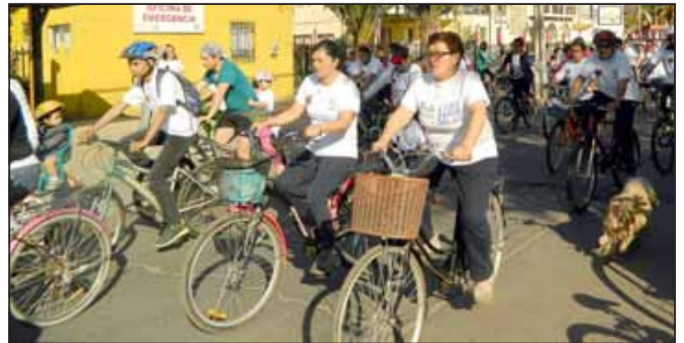
Vecinos de la comuna también disfrutaron de masivas cicletadas durante toda esta semana de aniversario.