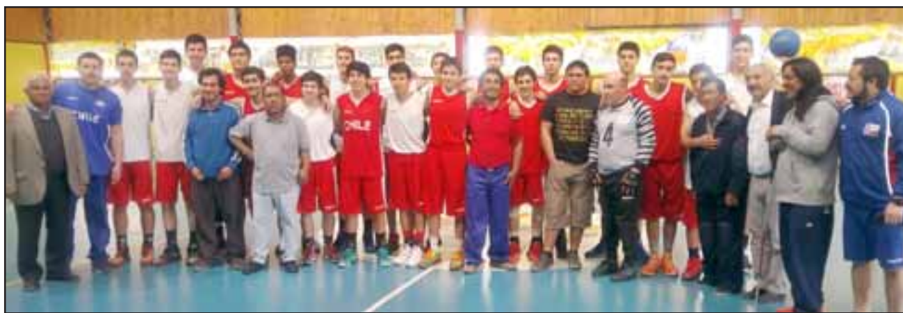
Selección Chilena de Básquetbol sub 15 compartió con participantes no videntes del taller municipal del Gol-Ball.