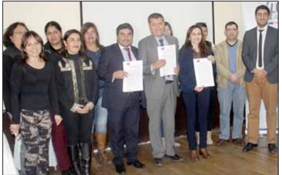
Programa piloto que a través de la creación de una Agencia u Oficina, permitirá potenciar el trabajo local en cuanto a la gestión del empleo, identificando oferta y demanda en la red de empleadores públicos y privados.