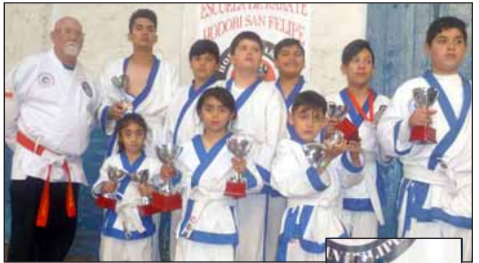
NUESTROS CAMPEONES. - Aquí tenemos a los campeones sanfelipeños con sus copas y medallas, luego que las ganaran en la gran Copa Bo-Ji-Tao , organizada en la Quinta Normal, Santiago.

deportistas, proceden también de talleres municipales de deporte de poblaciones como Algarrobal; el Liceo Politécnico y del Club Deportivo Marcela Sabaj.