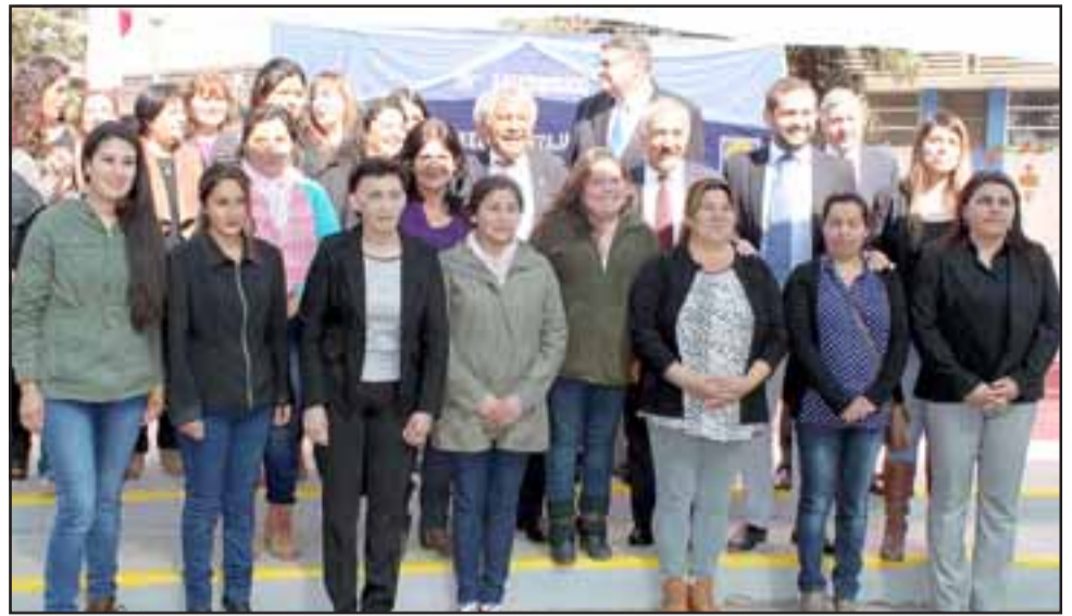
APODERADOS DE LUJO.- Apoderados de esta escuela recibieron distinciones especiales por su apoyo a las actividades y desarrollo de esta casa estudiantil.