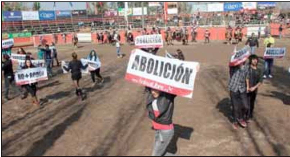
Este sábado a partir de las 11 de la mañana, frente a la Gobernación Provincial de Los Andes, se realizará una marcha contra el rodeo, dado que es considerado maltrato animal.

agrupación 'Animal Libre' campaña que busca terminar con los rodeos en el país.