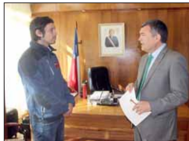
La máxima autoridad provincial, destacó la labor de los servicios públicos que han continuado con la solicitud de la presidenta Bachelet, en cuanto a la descentralización de los servicios públicos.

Las atenciones se realizarán cada dos semanas, iniciándose este próximo jueves 22 de septiembre, en el tercer piso del edificio consistorial, desde las 9:00 y las 12:30 horas.