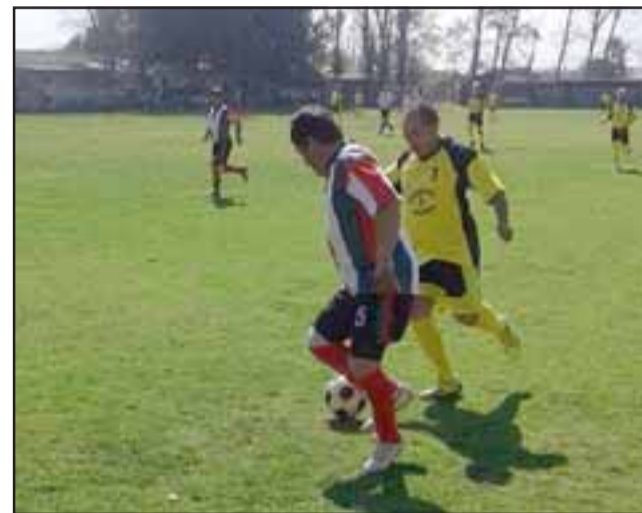
Los resultados que arrojó la décima fecha permitieron que varios equipos se aproximaran a los puestos de vanguardia de la Liga Vecinal.

Torneo Senior: 20 de Octubre 1 – Estrella Verde 4; 3º de Línea 3 – Magisterio 1; Derby 3 – Deportivo GL 3; Los del Valle 3 – Casanet 4.