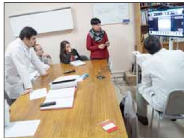
El recinto sanfelipeño es parte de este programa piloto, que entregará la posibilidad de conectarse mediante avanzados sistemas de interconexión digital, con imágenes, sonido y la posibilidad de incluir en la conexión a los equipos a los cuales está conectado el paciente, de manera de poder ser estudiado por los especialistas en Santiago.