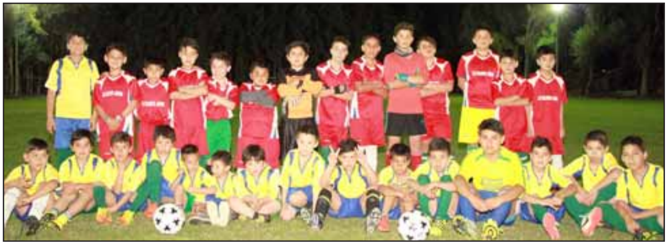
Los infantiles de la escuela de fútbol 'Talento Joven', quienes realizaron una breve exhibición deportiva, para luego jugar su correspondiente partido de fútbol en una cancha totalmente iluminada.

«Hace muy poco, el Gobierno Regional nos informó que se aprobó la adquisición de bombas para tranques acumuladores de agua para 12 clubes deportivos de Putaendo, en los que está incluido el Central. Son esfuerzos que también son frutos de los dirigentes,