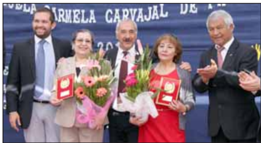
REGALO-NEADAS.- Algunas profesoras también fueron galardonadas por su entrega y trayectoria docente.