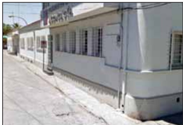
La Dirección de Servicio reitera su disposición y voluntad de continuar un trabajo conjunto con la Federación Fenats y todas las otras asociaciones gremiales existentes en Aconcagua. (Foto Referencial).

compromisos suscritos, no descartando volver a radicalizar el movimiento, tal como se hizo con la toma desarrollada hace un par de meses, al edificio del SSA.