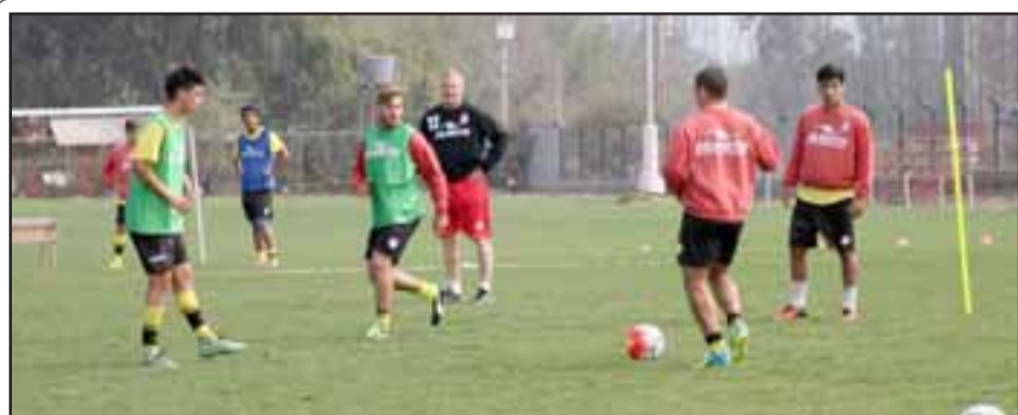
Para las 10 horas de mañana está agendado un encuentro amistoso entre el Uní y Melipilla.