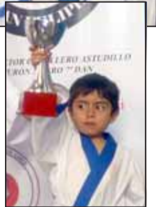
POR ESO ES EL MEJOR. - Aquí tenemos a este chiquitín, no hubo quién lo venciera en el torneo.