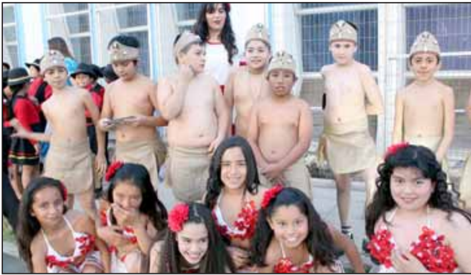
BAILES TÍPICOS.- Bailes pascuenses y de otras latitudes de nuestro país, fueron los que alegraron la jornada folclórica.