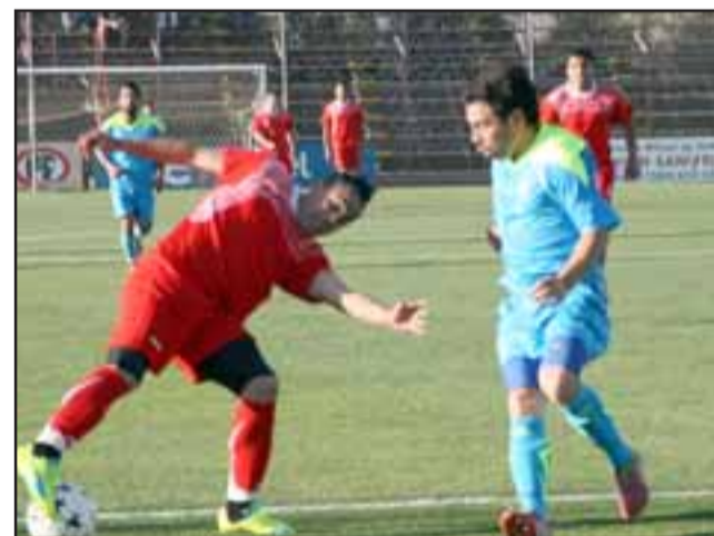
Ya quedaron definidas las llaves clasificatorias para la siguiente etapa del Regional de selecciones de honor.

que intervendrán los conjuntos aconcagüinos quedaron establecidas de la siguiente forma: