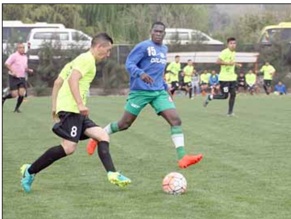
En un entretenido y productivo amistoso Unión San Felipe y Melipilla igualaron a uno.