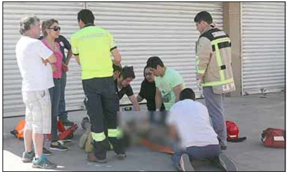
Pese a los esfuerzos de rescatistas de Bomberos y personal del Samu, la víctima falleció producto de un paro cardiorespiratorio.