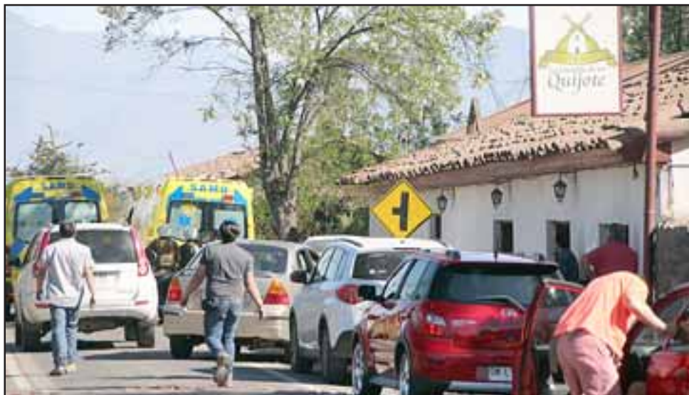
La honda explosiva dejó daños en el restorán donde compañeros de trabajo y clientes arrojaron al suelo al afectado que estaba totalmente envuelto en llamas.

na con alcohol y que permitiera mantener calientes alimentos. En ese instante, aparentemente el bidón de 5 litros de alcohol habría sido alcanzado por las llamas de una cocina, desencadenando una gran explosión que además de dejar