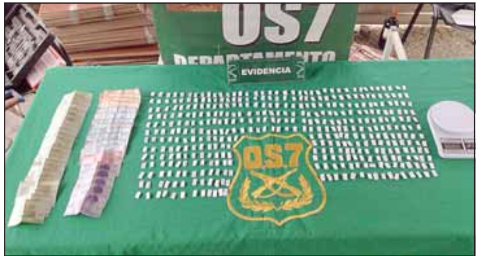
DROGAS EN LA TROYA: Un total de 425 envoltorios de pasta base de cocaína, dinero en efectivo y una pesa digital incautó el personal de OS7 de Carabineros de San Felipe en un domicilio del sector La Troya.

da comercializaban los alucinógenos a los adictos del sector, manteniendo denuncias de vecinos que daban cuenta de estos ilícitos.