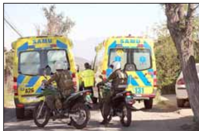
El trabajador fue trasladado en un móvil avanzado del Samu y escoltado por Carabineros hasta el Hospital San Camilo de San Felipe, donde quedó internado en la unidad de cuidados intensivos con diagnóstico grave.