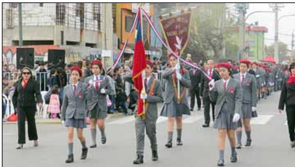
Como todos los años, la calle Balmaceda se inundó de estandartes, delegaciones, docentes, y un masivo público que empezó a llegar a partir de las 10.00 de la mañana.

ciudad, en el siguiente orden correlativo: Primera y Segunda Compañías del Cuerpo de Bomberos, Escuela Especial Brillo de Luna, las escuelas de lenguaje. 'Amanecer de colores', 'Mi pequeño mundo', 'Aliwen', y 'Rayito de sol'; las escuelas de educación básica rurales: 'Las Vegas', 'Las Palmas', 'Las Peñas', 'El Porvenir', 'Jorge Prieto'; y, el 'Liceo Politécnico B 15'.