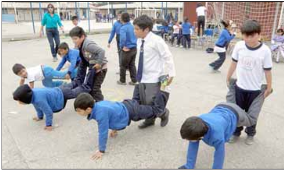
A JUGAR CHICOS.- Los pequeñitos jugando a la carretilla y otros juegos típicos.