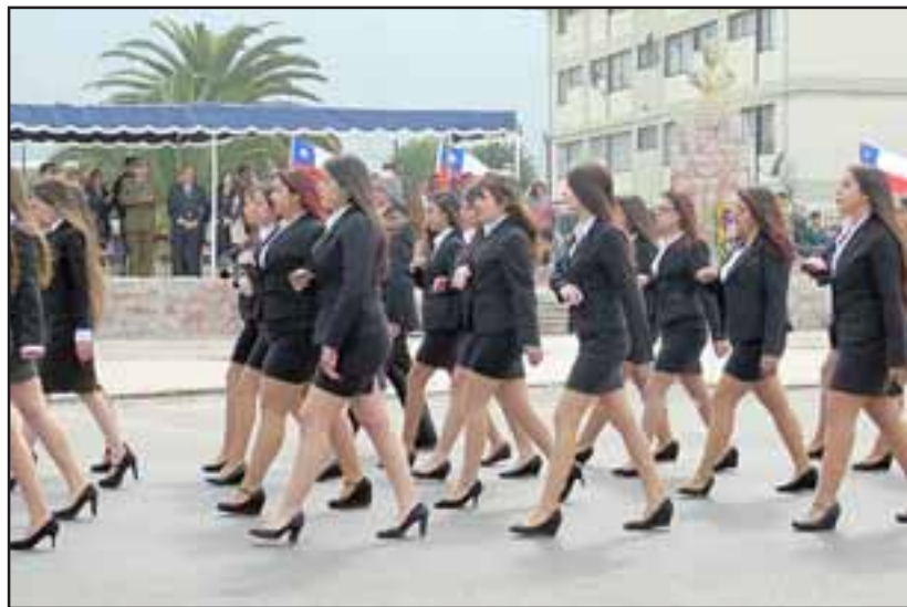
Escuelas, colegios y representantes de la sociedad civil, desfilaron ante la Tribuna de Honor, como las alumnas del Liceo Politécnico de Llay Llay.

En el primer bloque desfilaron, instituciones de la