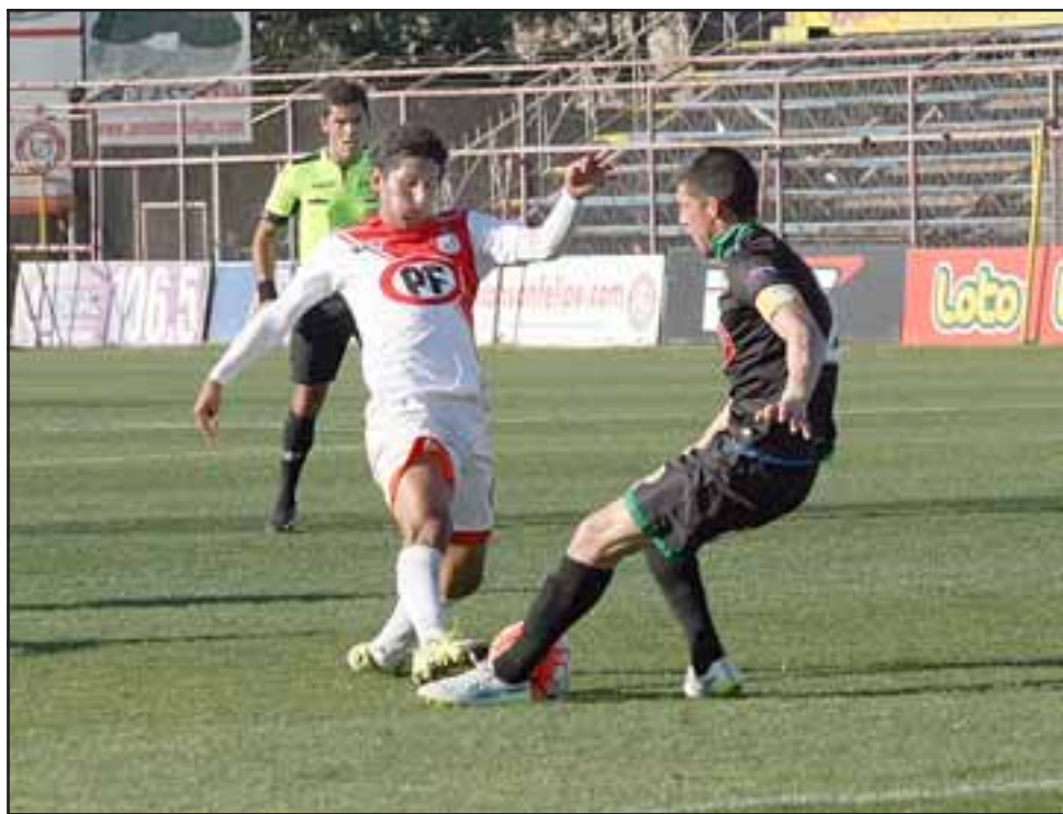
Después de un mes de ausencia el Uní regresará al estadio Municipal.