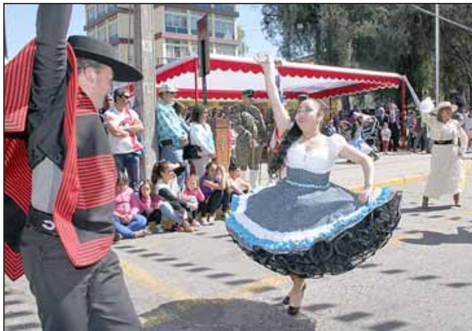
NUESTRAS BELLAS CHINITAS. - Con bellas chinitas y alegres huasos, así se vivieron las Fiestas Patrias en nuestra comuna, durante todas estas actividades.