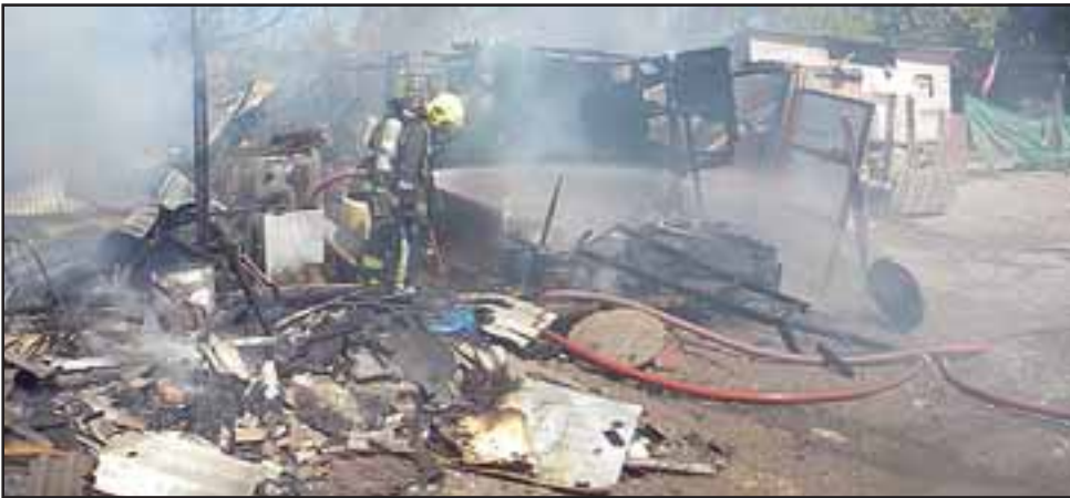
Un incendio de proporciones, destruyó por completo una vivienda de material ligero ubicada al interior del campamento de Bicicross.

Personal del departamento de Investigación de Incendio de Bomberos deberá realizar los peritajes para establecer el origen del fuego.