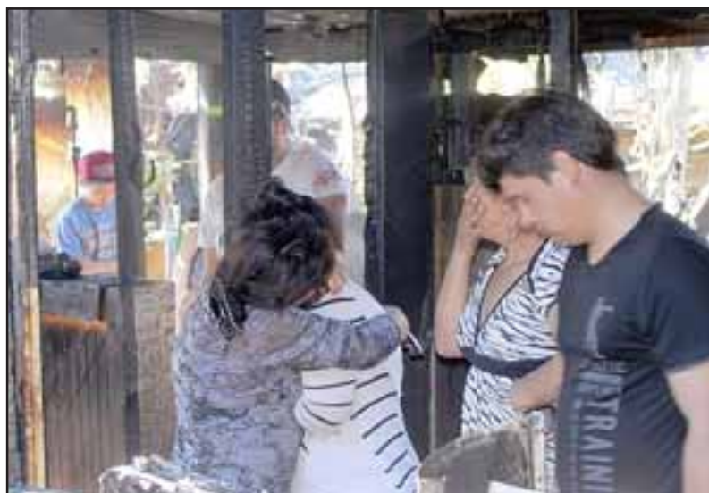
PODEMOS AYUDAR. - Esta es la mirada de la desolación, del dolor humano que estos vecinos viven y que sólo Dios, las autoridades y nuestros lectores podrán aliviar.

Algunos vecinos reportaron una explosión, otros aseguraban que esa explosión se habría generado en un horno de barro, lo que es difícil de creer, serán los especialistas de Bomberos, quienes deban finalmente establecer las verdaderas