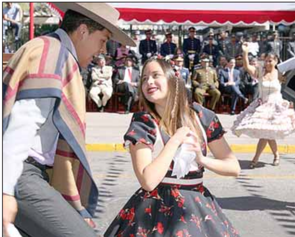
CHINAS ENCANTADORAS. - Esta bella sanfelipeña cautivó con sus pasos y candor a los presentes.