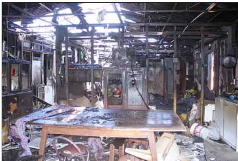
SIN NADA. - Así quedó el interior de esta casa, al igual que otra vivienda vecina, en donde se originó el infierno.

causas de esta nueva y lamentable tragedia en Panquehue.