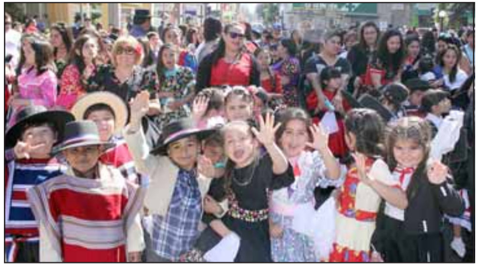
LISTOS PA' LA CUECA. - Como si fuera el 18, así vivieron estos pequeñitos la III Jornada Mil pañuelos al viento 2016.