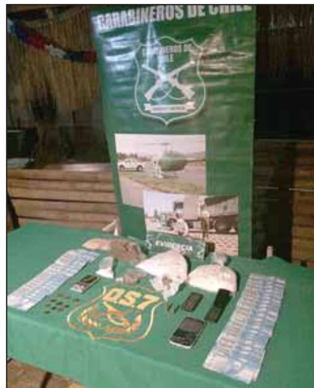
Más de 4.000 dosis de estas drogas fueron incautadas por el personal de OS7 de Carabineros, la noche de este jueves en la comuna de San Felipe.

tución uniformada se destacó este operativo policial que permitió retirar de circulación más de 4.000 do-