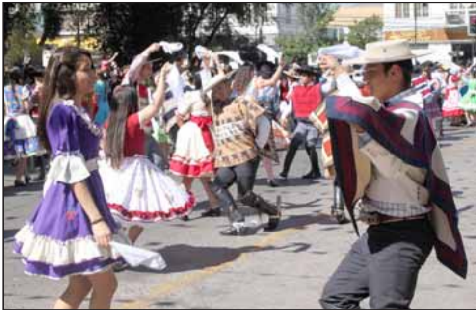
HONORES A SAN FELIPE. - Jóvenes, niños y adultos en general se dieron cita en el corazón de nuestra ciudad para rendir honores a nuestra ciudad.