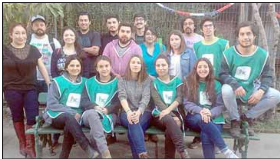
NUEVO FRENTE DE ACCIÓN SOCIAL. - Ellos son los profesionales de esta nueva ONG, la que se encargará de trabajar hombro a hombro con varios frentes de nuestras poblaciones.

«Aquí estamos hablando de que todas las semanas estamos visitando a estas personas postradas, pues algunos de los proyectos que trabajan con el Adulto Mayor, no siempre atienden esta etapa de este grupo etéreo. Nosotros de momento estamos recibiendo recursos que se canalizan por ahora en Hogar de Cristo, buscamos también la forma de brindar apoyo en este Hogar, para que los