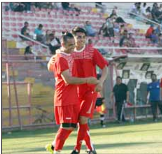
La selección de honor de San Felipe consiguió igualar en el partido de ida ante Petorca.