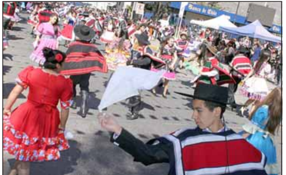
MIL PAÑUELOS Y MÁS. - Fueron más de 1.000 pañuelos los que este fin de semana giraron al viento de la primavera que vivimos en nuestro país.