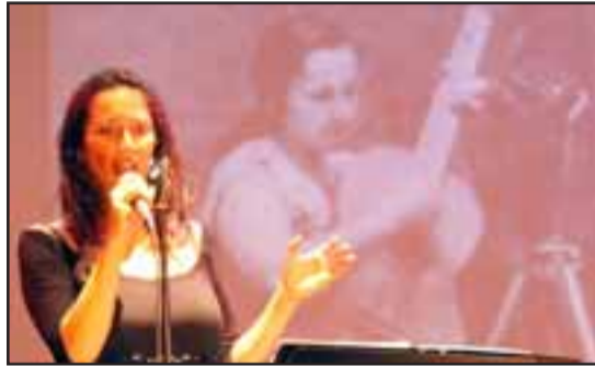
SIEMPRE IVALÚ.- Así brilló Ivalú, con la imagen de Violeta al fondo, en este homenaje especial a Parra.

Un cálido concierto para celebrar los 100 años del nacimiento de Violeta Parra, los que se