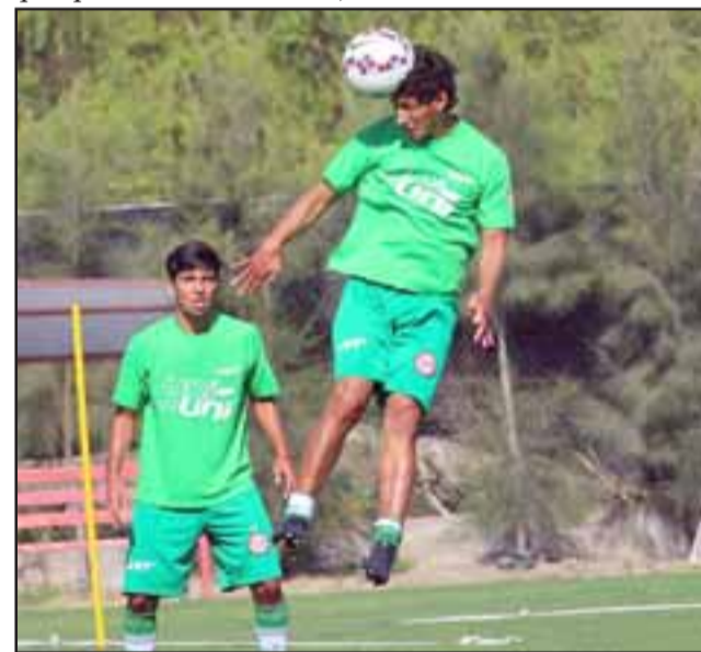
Unión San Felipe enfrentará esta tarde a Ñublense en el estadio Municipal.