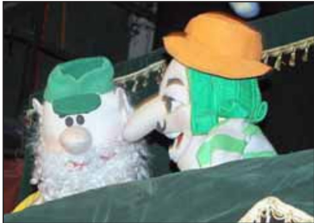
SIEMPRE LOS VILLANOS. - Aquí tenemos al villano del cuento, intentando engañar al abuelito de la historia.

Toda una emocionante aventura, es la que vivieron cientos de niños sanfelipeños en el teatro municipal de San Felipe, tras la presentación de la obra teatral de títeres 'El osito Totito y el Abuelito Rolansueño', que la Compañía de Teatro de Títeres Hermanos Olmos, presentó en coordinación con el Departamento Municipal de Cultura.