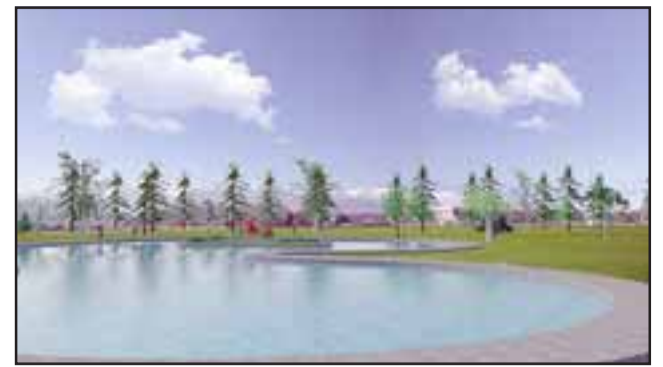
Imagen de maqueta virtual del Gran Parque Público que implementará Eugenio Cornejo en su período alcaldicio.

Asimismo Cornejo indicó que «en este proyecto se ha contemplado la habilitación de estacionamientos para 250 vehículos en zona de transición calle-parque, lo cual no sólo permite el acceso expedito a quienes visiten este gran pulmón verde, sino que a la