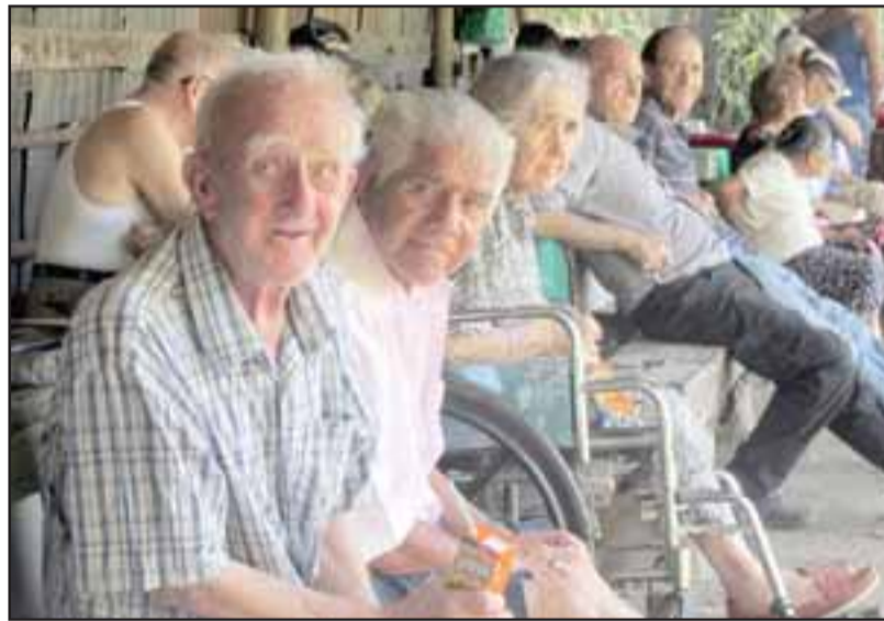
ABUELITOS FELICES. - Regularmente estos abuelitos realizan paseos gracias a este nuevo y efectivo voluntariado.

MANUALIDADES Y ARTE. - Según explicó Reinoso, Hogar de Cristo opera en parte gracias al 55% de los donativos generales que se reciben de la ciudadanía y el comercio.