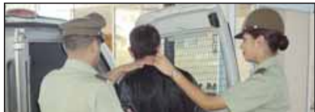
El sentenciado deberá cumplir una pena de 5 años y un día de cárcel por el delito de robo en una vivienda de San Felipe.