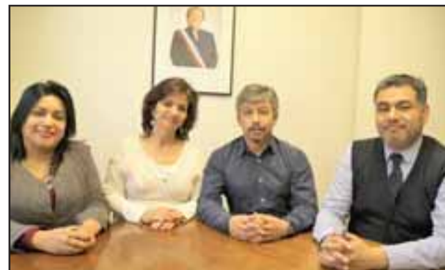
La Dirección del Servicio de Salud Aconcagua destacó dicho trámite legislativo, afirmando que este es uno de los acuerdos más importante en la historia de la salud pública chilena capaz de avanzar con un compromiso de Gobierno asumido con los gremios del sector salud.

En este sentido, el Servicio de Salud resaltó que esto es producto del gran acuerdo alcanzado con ocho gremios nacionales de la salud y que contribuirá finalmente a mejorar las condiciones del trabajo para dar una atención más digna y de calidad a los usu-