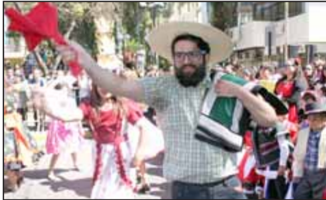
PROFE BAILARÍN. - Este profesor no aguantó las ganas de bailar cueca y por algunas horas lo vimos disfrutando de esta jornada folclórica tan especial.

Las cámaras de Diario El Trabajo , tomaron registro de esta actividad, en la que peques y grandes, bailaron su mejor cueca frente a las autoridades educativas. Es importante señalar que los profesores de esta casa, estudiantil también participaron de estos bailes tradicionales.