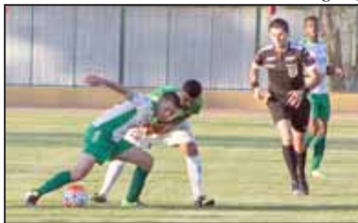
El equipo andino se impuso a Deportes Vallenar por la cuenta mínima.

San Antonio 0 – Melipilla 0; Santa Cruz – Malleco 0; La Pintana 2 – Barnechea 3.