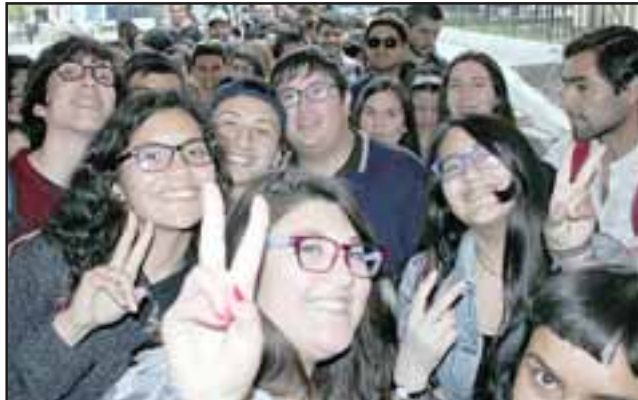
LOCOS POR DËNVER.- Aunque fue de noche el concierto, desde horas de la tarde los fans de Dënver hacían fila para poder ingresar al teatro.