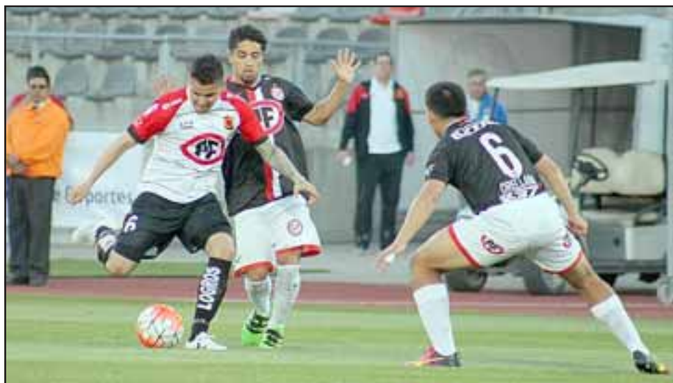
En otra presentación en la que nuevamente quedó al debe, el Uní se inclinó por la cuenta mínima ante Rangers en Talca.