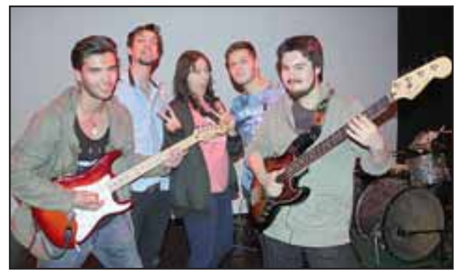
SUBSTANCIA MARINA.- Ellos son la Banda Substancia Marina, de Santiago, agrupación que calentó el ambiente para la entrada de Dënver.