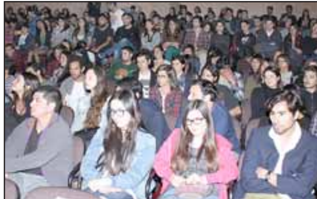
FIEBRE MUSICAL.- Cientos de aconcgüinos se dieron cita este viernes en el teatro municipal para ver a su banda regalona.