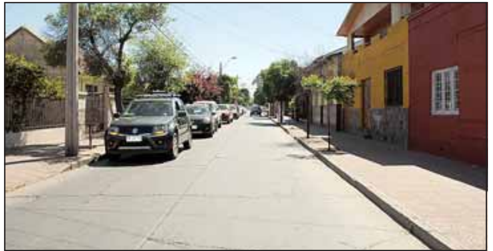
El proyecto, considera la reposición en hormigón de 20 centímetros de grosor, del tramo que comprende desde Avenida Argentina hasta Avenida Chacabuco, la instalación de soleras y baldosas.

El proyecto, considera la reposición en hormigón de 20 centímetros de grosor, del tramo que comprende desde Avenida Argentina hasta Avenida Chacabuco, la instalación de soleras y baldosas, además