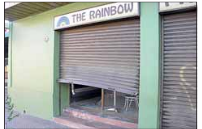
Los maleantes habrían utilizado una herramienta para forzar los candados y levantar la cortina.

Asimismo, la SIP quedó a cargo de las diligencias para establecer si estos mismos delincuentes fueron los que hace algunos días ingresaron a robar al local de Foto Stereo en calle Esmeralda, donde se usó el mismo modus operandi de forzamiento de la cortina metálica.