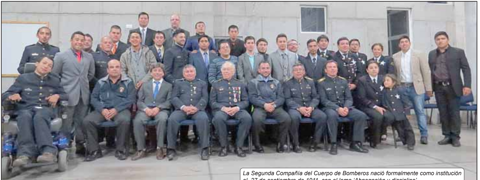
La Segunda Compañía del Cuerpo de Bomberos nació formalmente como institución el 27 de septiembre de 1911, con el lema 'Abnegación y disciplina'.