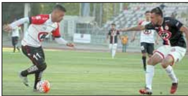
Al Uní le está costando mucho sumar unidades fuera de casa, situación que se reflejó en el duelo con los piducanos.

Estadio Fiscal de Talca Árbitro: Patricio Blanca