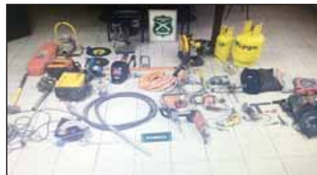
Estas son las herramientas recuperadas por Carabineros valuadas en $6.500.000.

Resumiendo, Carabineros logró la detención de uno de los involucrados, tratándose de un menor de