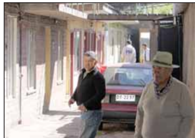
La mujer arrendaba una habitación en un cité ubicado en avenida O'Higgins 116 de la comuna de San Felipe.

"No existe participación de terceras personas, la investigación nos señala que ella tuvo intentos anteriores de suicidio por temas de índole de salud mental, estaba en tratamiento psiquiátrico. La mujer perdió la vida tras asfixia por ahorcamiento, el cuerpo fue hallado por el propietario del cité en un espacio desti-