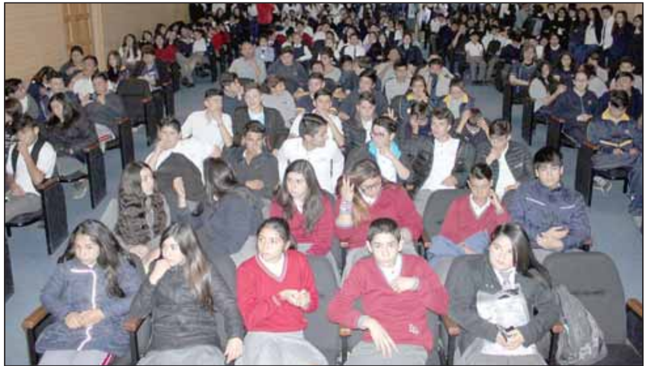
TEATRO LLENO.- Así de lleno estaba ayer el teatro municipal de Santa María en esta jornada especial de 'Mil científicos mil aulas', que anualmente realiza Explora en todo Chile.

¿POR QUÉ SEGUIR EL CAMINO SI PUEDES CREAR EL TUYO?