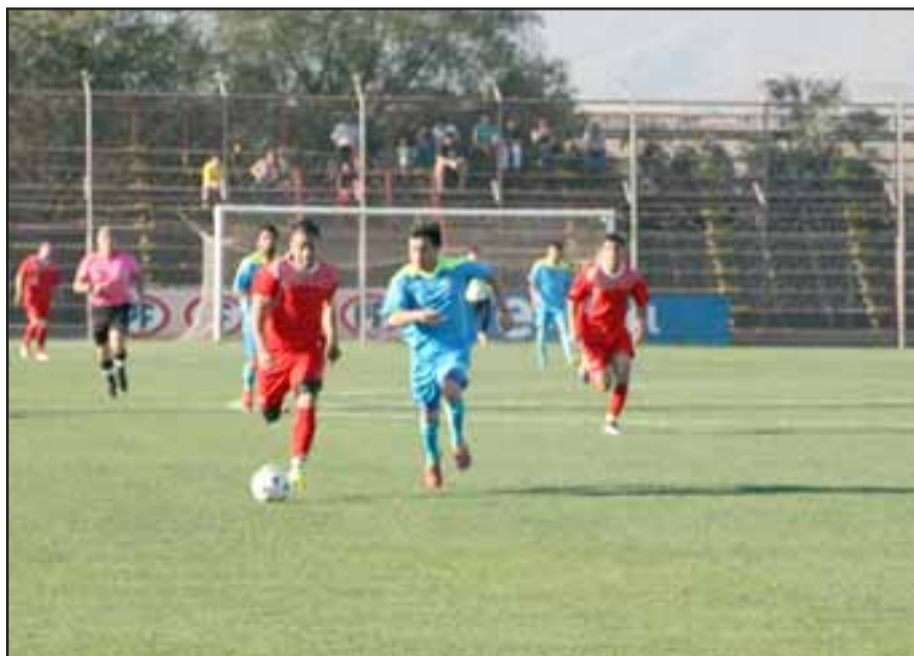
San Felipe no pudo hacer pesar su condición de local y fue eliminado del Regional de Honor.

mos ganar de visita y dejar atrás esta derrota, confío en que podremos recuperarnos".