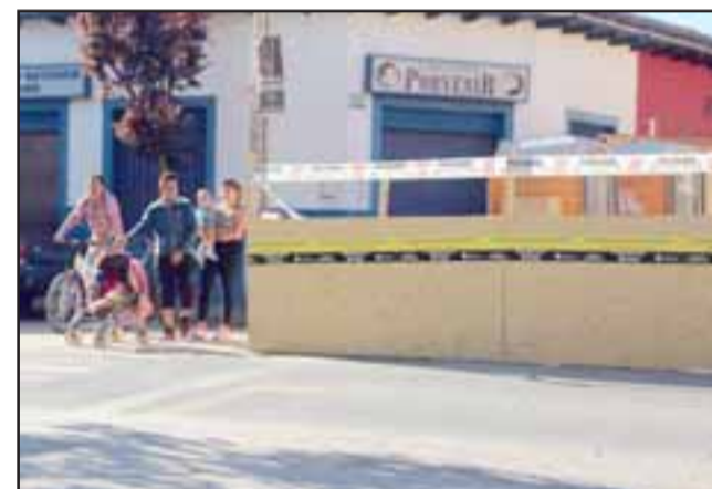
Un ‘punto ciego’ que obstaculiza la visual de automovilistas hacia calle San Martín pone en riesgo a peatones que tienen preferencia por la ubicación de un ‘paso de cebra’ en el cruce hacia el principal paseo público de Putaendo.

quienes han tenido mayor precaución al circular por calle Camus, sin embargo ya han sido tres las personas que han estado cerca de ser atropellados por otros conductores, por lo que la preocupación hoy está centrada en aquellas personas