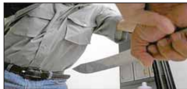
La riña se produjo la tarde de este domingo en el sector Porvenir Bajo de Llay Llay resultando un hombre apuñalado en el tórax. (Foto Referencial).