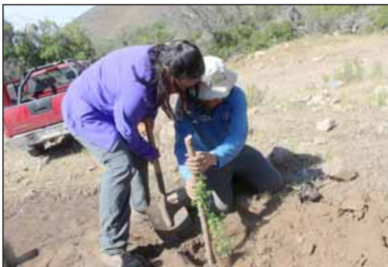
Desde muy temprano y en el marco de la celebración del Día Nacional del Medio Ambiente, 20 entusiastas voluntarios, plantaron 100 árboles nativos en el Santuario de la Naturaleza Serranía del Ciprés, en la comuna de San Felipe.

En la misma línea, recalcó que se realizarán nuevas campañas de arborización en la zona, ya que la recuperación definitiva de los puntos siniestrados “será una larga tarea. Son trabajos proyectados a largo plazo, por lo que necesitaremos el apoyo de toda la comunidad y estamentos pú-