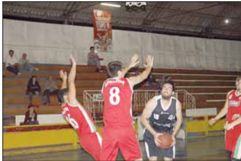
El quinteto pratinos debutó con una derrota en la Libcentro Pro.