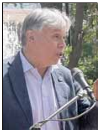
El ministro de Agricultura, Carlos Furche, llegó hasta la comuna de Putaendo acompañado de autoridades de gobierno de distintas reparticiones públicas para concretar la entrega de un bono de $390 millones para proyectos de riego y drenaje.

PUTAENDO.- El ministro de Agricultura, Carlos Furche, llegó hasta la comuna de Putaendo acompañado de autoridades de gobierno de distintas reparticiones públicas para concretar la entrega de un bono de $390 millones para proyectos de riego y drenaje.