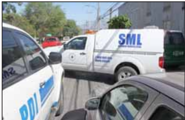
El cuerpo fue levantando la mañana de este lunes por personal del Servicio Médico Legal de San Felipe para la autopsia de rigor.