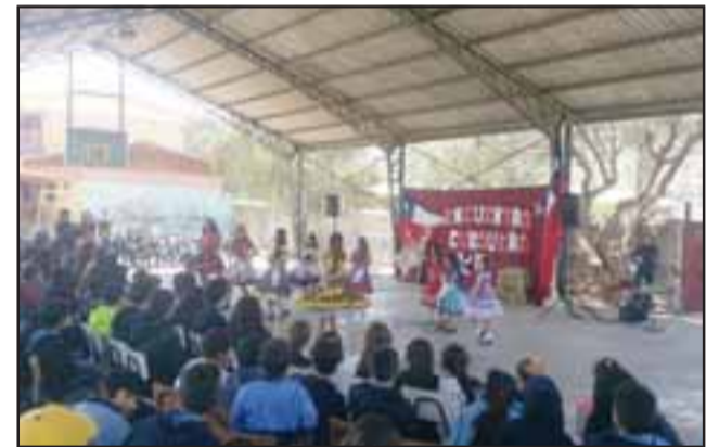
Como una manera de destacar los valores patrios durante todo el año, y de finalizar las actividades relacionadas al mes de septiembre, el pasado día viernes, la escuela 21 de mayo realizó un gran encuentro de cueca.

trabajo técnico especial, mancomunado con la arquitecto de la Daem para cambiar nuestro rostro, y tener un entorno más motivante para nuestros estudiantes", sostuvo el directivo.