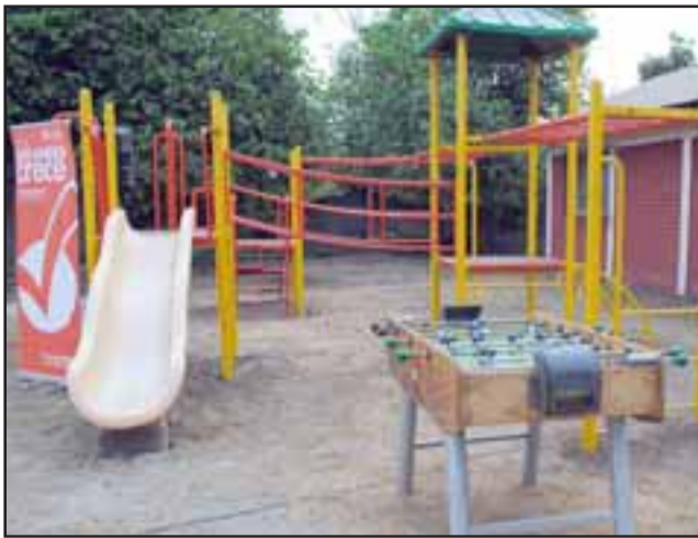
Inauguran a los remozados juegos infantiles e instalación de máquinas de ejercicios en la sede comunitaria del sector de Calle Sur.

LOS ANDES.- El mejoramiento de los espacios públicos, ha sido uno de los ejes de gestión del municipio andino durante los últimos años. Gracias al trabajo de los vecinos de Calle Sur, del municipio y de la Subsecretaría de Desarrollo Regional, se logró dar inauguración a los remozados juegos infantiles e instalación de máquinas de ejercicios en la sede comunitaria del sector.