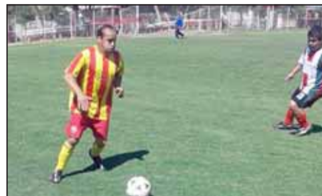
El torneo reunirá a jugadores que ya pasaron la barrera de los 55 años.

19:30 horas, Andacollo – Carlos Barrera 20:30 horas, Tsunami – Unión Esfuerzo 21:15 horas, Barcelona – Hernán Pérez Quijanes