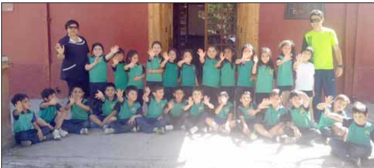
Cerca de 20 actividades que se realizarán durante la semana y en la que estarán participando los distintos cursos del establecimiento, contempla la iniciativa es desarrollada por el departamento de Ciencias del establecimiento.

"Planificamos trabajar en robótica, en la hora del código, para lo que solicitamos a los participantes de diferentes escuelas que quieran estar presentes, se puedan inscribir en la escuela, tendremos una interrelación con el Ciem a través de un picnic literario, charlas sobre el cuidado del medio ambiente, el trabajo de monitores con los niños