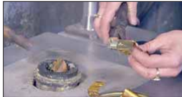
Cerca de 31 gramos de trozos de láminas de oro fueron recuperados por la PDI desde una compra venta de San Felipe, tras comprobarse el hurto de este metal desde la Joyería Acron de calle Prat 631. (Foto Referencial).

Asimismo hasta el momento la PDI ha logrado recuperar 31 gramos de oro de propiedad del comerciante afectado, avaluados en un millón y medio de pesos, lo que podría aumentar en los próximos días de acuerdo a