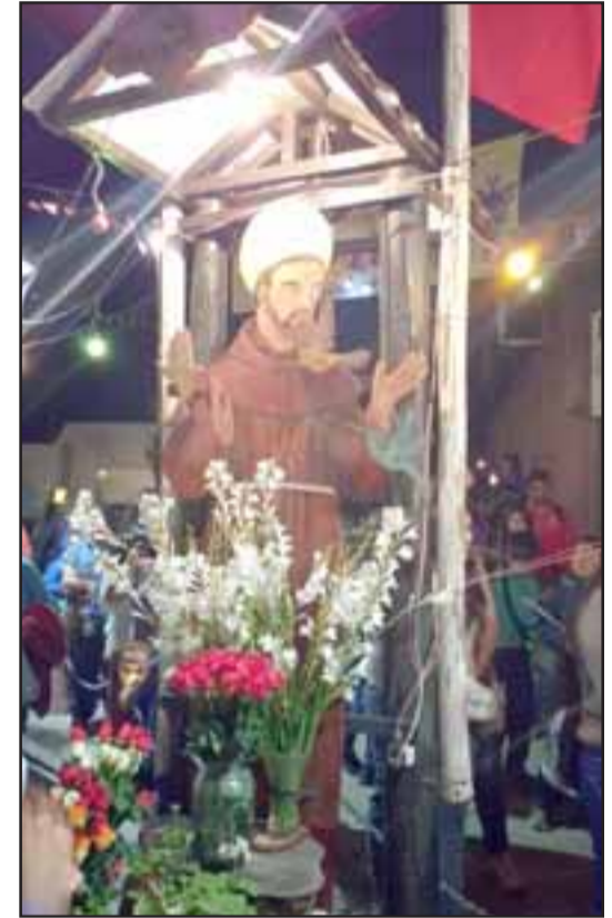
SANTO REGALÓN. - La imagen de San Francisco de Asís fue llevada en andas por sus fieles.