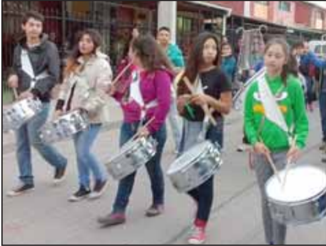
BANDA ESCOLAR. - Los anfitriones de la jornada, mostraron la potencia de su banda escolar por las calles de su población.