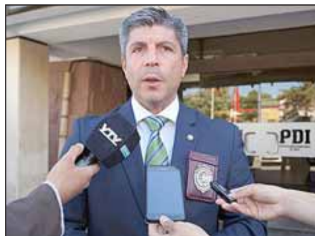
Subprefecto Guillermo Gálvez, quien destacó que producto de lo exitoso se los procedimientos se han podido incautar gran cantidad de cannabis sativa, cocaína base y cocaína, siendo esta última la que más se ha decomisado en los diferentes procedimientos.

Agregó que producto de ello, la mayor incautación de droga se ha producido en la ruta 5 norte y no en Los Libertadores, “ya que hay que pensar que estos gru-