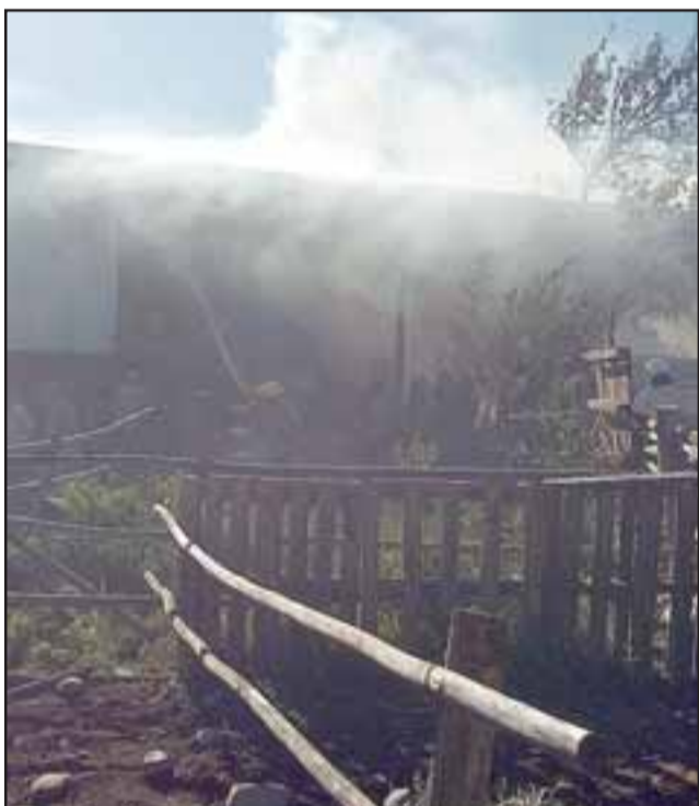
El galpón que albergaba cerca de dos mil fardos de pasto fue consumido por completo por el fuego que se desató en la tarde de ayer martes en el sector Quebrada Herrera de San Felipe. (Foto: @Preludioradio).