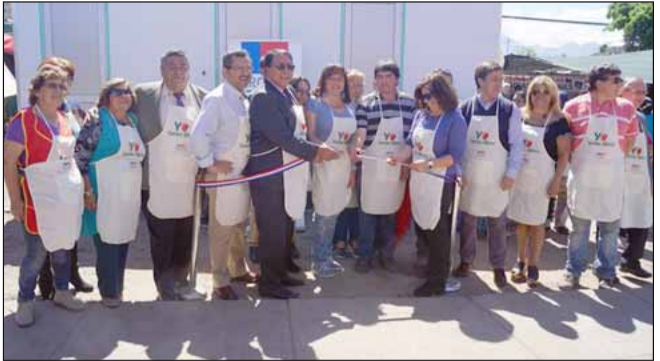
Gracias a recursos aportados por Sercotec, los 57 locatarios de la feria libre de Los Andes pudieron habilitar nuevos servicios higiénicos.

El presidente de la Asociación Gremial de Ferias