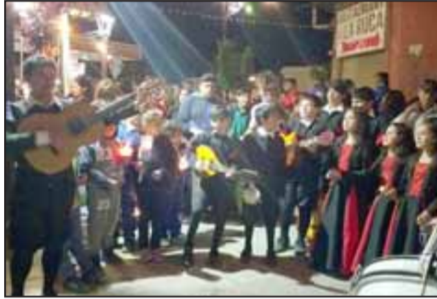
LA ESTUDIANTINA. - Aquí Tenemos a la asombrosa Estudiantina que participó de la actividad.