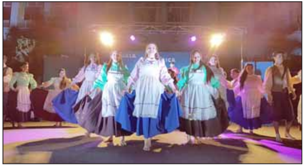
Ballet folclórico Municipal de Catemu, se lució en su Gala, donde los bailarines, junto al grupo folclórico que acompaña sus presentaciones, sacaron aplausos de pie de parte de los asistentes.

Además de la gran oferta de eventos gratuitos a disposición de la comunidad ofrecidos por el Municipio.