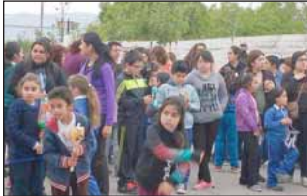
GRAN FAROLADA. - Así lucieron los faroles que en manos de estos niños desfilaron por los cerros y calle principal de Curimón.