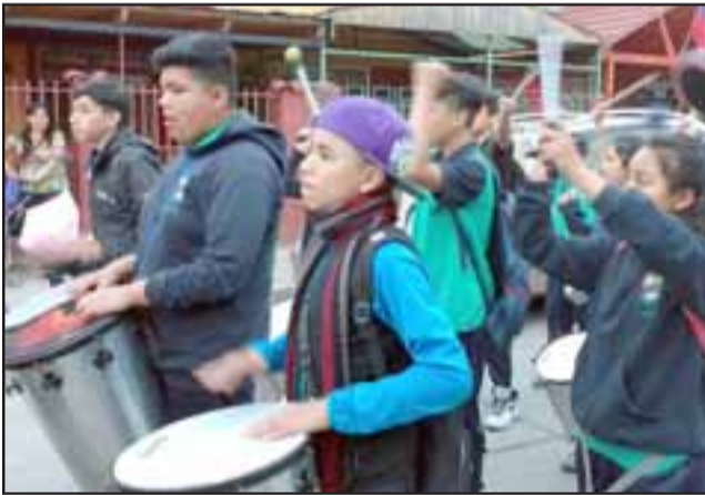
SIEMPRE LA MANSO DE VELASCO. - Esta grandiosa batucada de la Escuela José Manso de Velasco, es la que alegró las calles y cerros el lunes por la tarde