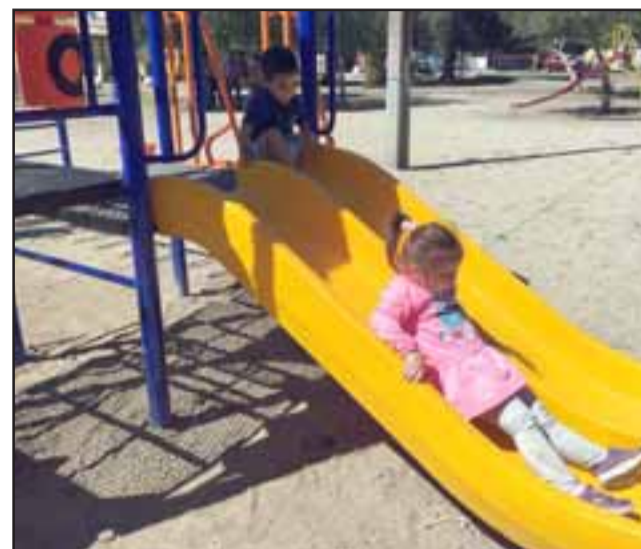
Felices jugaban estos pequeños, en las nuevas instalaciones de juegos infantiles que fueron emplazados en la Plazoleta 3 de Agosto de la PAC.

El seclpa, Claudio Paredes resaltó que este sector no es el único favorecido con iniciativas de este tipo, por lo que en lo sucesivo se invertirán casi 90 millones de pesos para juegos infantiles en diversas plazuelas de la comuna, entre las cuales destacan las de Villas San Camilo, La Estancia, Departamental y Población Puente.