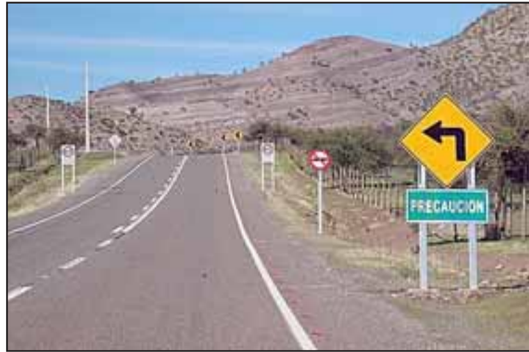
Una preocupante situación alarma a automovilistas y Carabineros, ya que al menos han ocurrido dos casos de asaltos en medio de la carretera que une Putaendo con Cabildo, justamente en el tramo donde no existe cobertura de telefonía móvil.

El primero de los asaltos ocurrió hace un par de semanas, cuando un hombre que pidió reserva de su identidad por razones de seguridad, se dirigía desde Putaendo hacia Cabildo junto a su familia, momento en que se encontró con