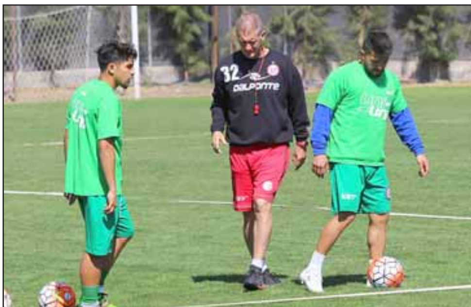
El equipo albirrojo jugará el sábado un partido amistoso ante la Unión Española.

El pleito amistoso entre hispanos y sanfelipeños, es posible debido a que este fin de semana estarán suspendidos los torneos de las series A y B de la ANFP, debido a la fecha clasificatoria para el Mundial de Rusia 2018.