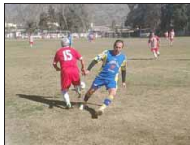
Todavía son muchas las diferencias de nivel entre los equipos que compiten en la Liga Vecinal.

Carlos Barrera 0 – Villa Argelia 0; Andacollo 2 – Hernán Pérez Quijanes