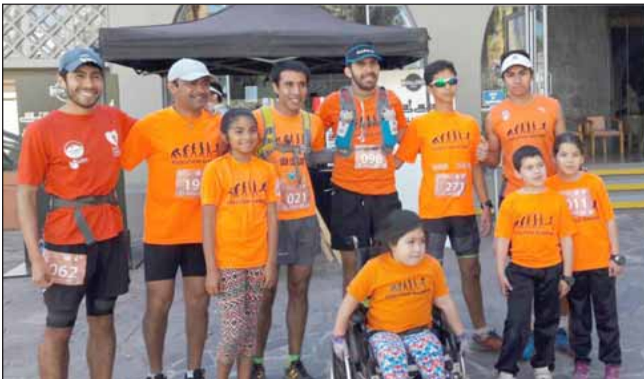
Los Evolution Runners, brillaron con luz propia en el Trail Run Termas El Corazón.