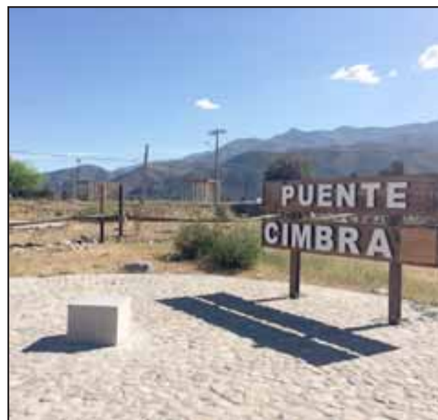
El Puente Cimbra, fue el primer viaducto que logró unir los sectores de Granallas, Quebrada de Herrera, Vicuña y Guzmanes con el centro de Putaendo.

El plato fuerte de la jornada será la reconocida 'Banda Conmoción', que invitó por intermedio de sus redes sociales a todo el Valle de Aconcagua.