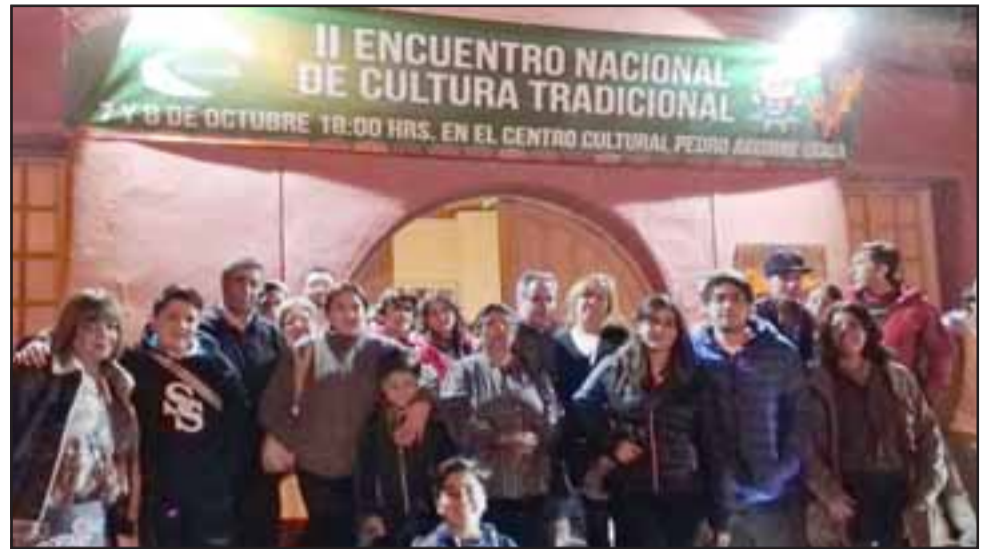
Los vecinos que han asistido hasta el sector Pocuro, corresponden a la Villa El Carmen y de las poblaciones Santa Rosa y Manuel Rodríguez, disfrutaron de la exposición sobre el presidente Pedro Aguirre Cerda, de carruajes en miniatura, ‘fragmentos’ y de una documentada charla sobre astronomía y se finaliza con observaciones, a través de los telescopios dispuestos para la ocasión.

Las delegaciones de vecinos que hasta el momento han asistido hasta el sector de Pocuro, corresponden a la histórica Población Santa Rosa, a la Villa El Carmen y la Población Manuel Rodríguez, quienes han podido conocer la exposición permanente sobre la vida y obra del presidente Pedro Aguirre Cerda, las exposiciones transitorias de carruajes en miniatura, la exposición ‘fragmentos’ del Museo de la Memoria y los DDHH. Además, los vecinos presencian una documentada charla sobre astronomía y se finaliza con observacio-