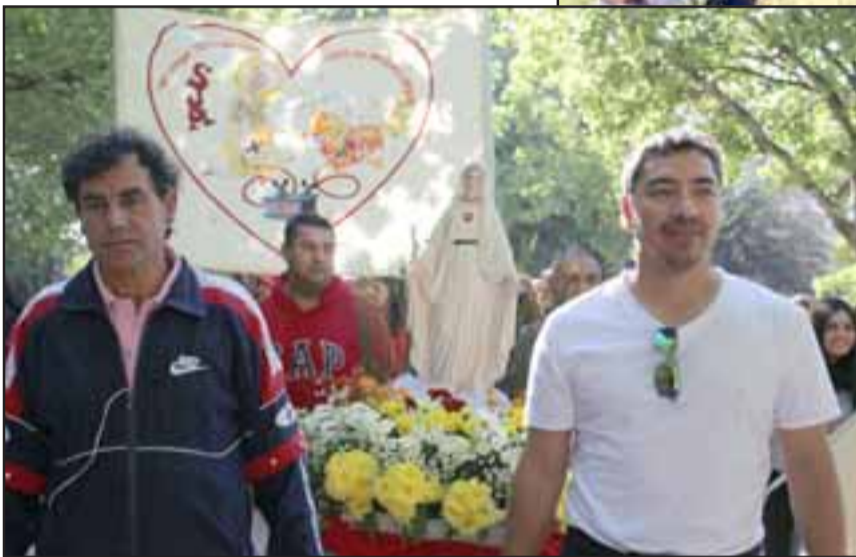
FEA TODO TERRENO.- Esta imponente imagen fue llevada en andas por sus fieles creyentes.