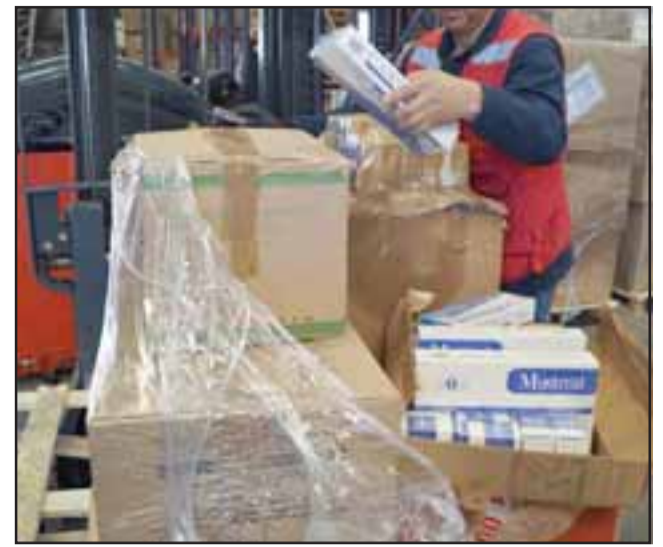
Detectives de la Brianco Los Andes, incautaron más de un millón y medio de Dólares en cigarrillos de contrabando que eran transportados en un contenedor de 40 pies proveniente del norte del país.