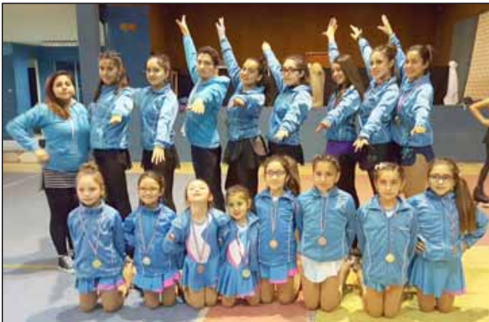
NUESTRAS ESTRELLAS.- Ellos son nuestras estrellas viajeras del patinaje artístico, grupo que brilla siempre con luz propia.