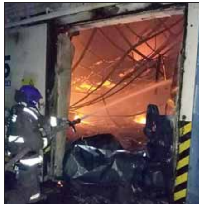
Un arduo trabajo realizó personal de Bomberos participando todas las unidades de la provincia de San Felipe en el combate de las llamas en el frigorífico Exser.