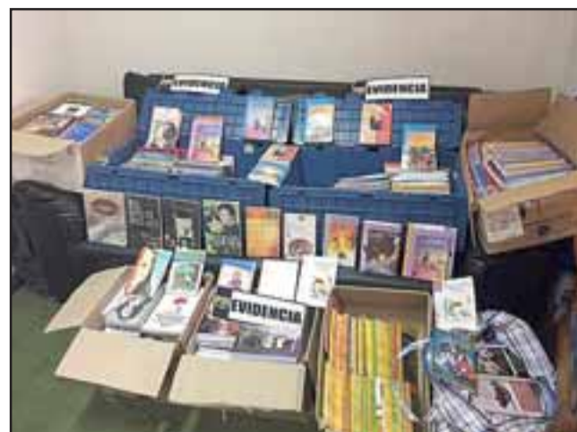
Oficiales de la Brigada de Delitos Económicos de la PDI de Los Andes en el marco del plan 'Júpiter' desarrollado por Interpol en sus países asociados, incautaron mil 40 libros falsificados de diferentes editoriales que eran comercializados por una mujer en pleno centro de Los Andes.

El subcomisario mencionó que a nivel internacional, desde aproximadamente 10 años a la fecha, Interpol ha organizado a todos los países socios para combatir este flagelo de la piratería que afecta la propiedad intelectual y genera grandes pérdidas a la industria, "por lo que nosotros una vez al