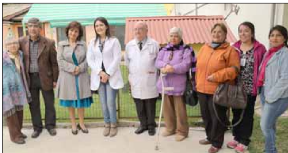
Acompañadas por representantes de la comunidad, las autoridades hicieron los anuncios en el hospital San Francisco de Llay Llay, establecimiento que recibirá más de 200 millones de pesos para la reposición del Jardín Infantil y la adquisición de un equipo radiológico.

Llay Llay destaca en esta inversión con la renovación del equipo de rayos del hospital, lo que mejorará la calidad de los exámenes imagenológicos, como por ejemplo, las radiografías de tórax. Este equipo es una inversión de $ 140 millones, los que junto a los $ 76 millones de inversión