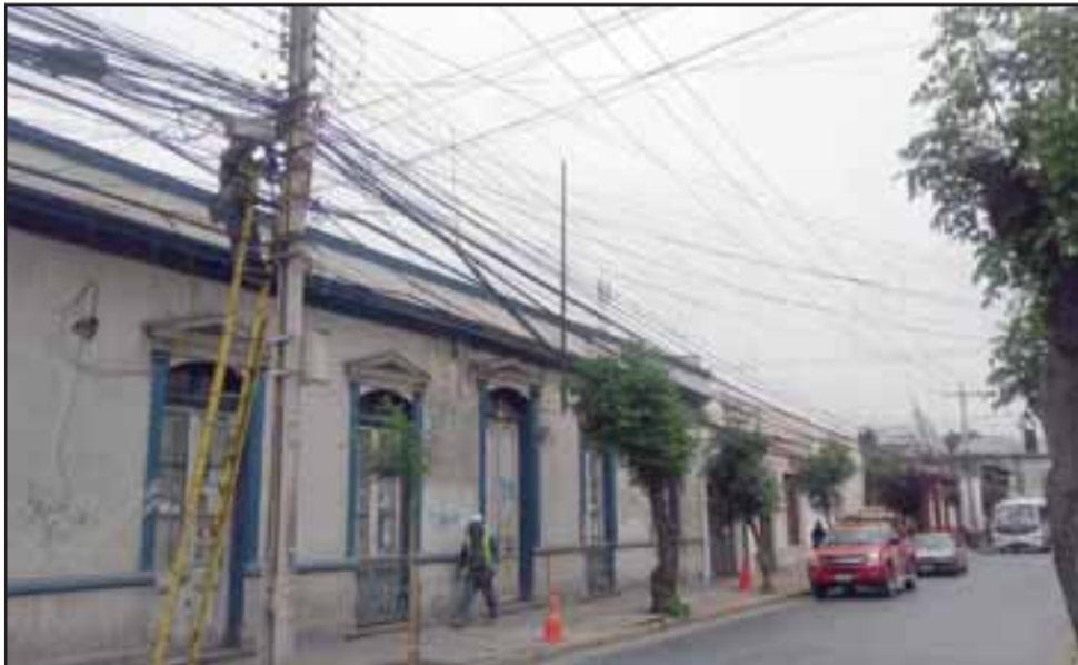
Se estima que alrededor de un 70 % de los cables visibles entre poste y poste, están sin uso, por lo que serán retirados durante los próximos días.