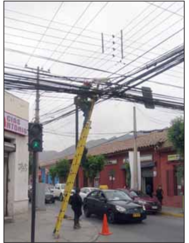
Este es el panorama que se aprecia en la esquina de Merced con Traslaviña.