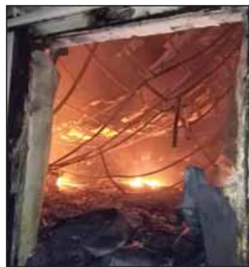
Cuatro cámaras del frigorífico resultaron calcinadas por completo tras el voraz incendio desatado en la madrugada de ayer miércoles.