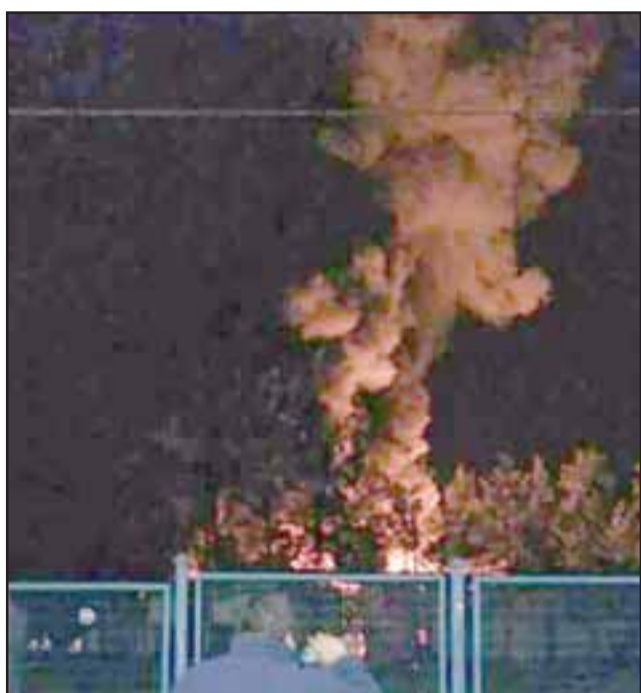
La inmensa columna de humo era visualizada desde distintos puntos de la comuna de San Felipe.

‘El Zafrada’ fue detenido por Carabineros: