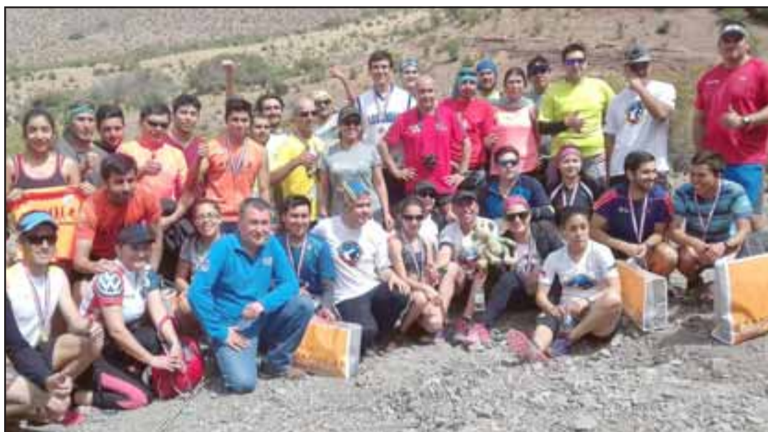
TRAIL RUNNING.- Decenas de running's aconcaquíinos se dieron cita en Cajón del Zaino, para participar en este importante evento deportivo.

do hombres y 15K experimentado hombres, la búsqueda de patrocinadores fue lo más difícil de la programación, aun así logramos obtener ayuda de muchos más este año», explicó Catalán a Diario El Trabajo . Roberto González Short