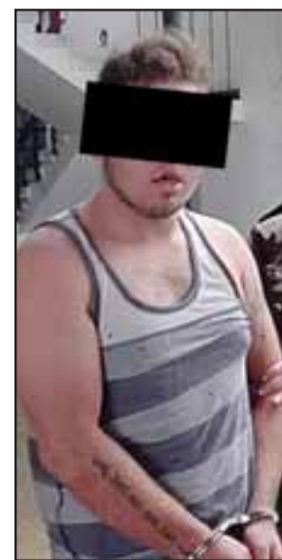
La tarde de este martes, Carabineros detuvo al antisocial en la población Los Araucanos de San Felipe, acusado de robo por sorpresa.