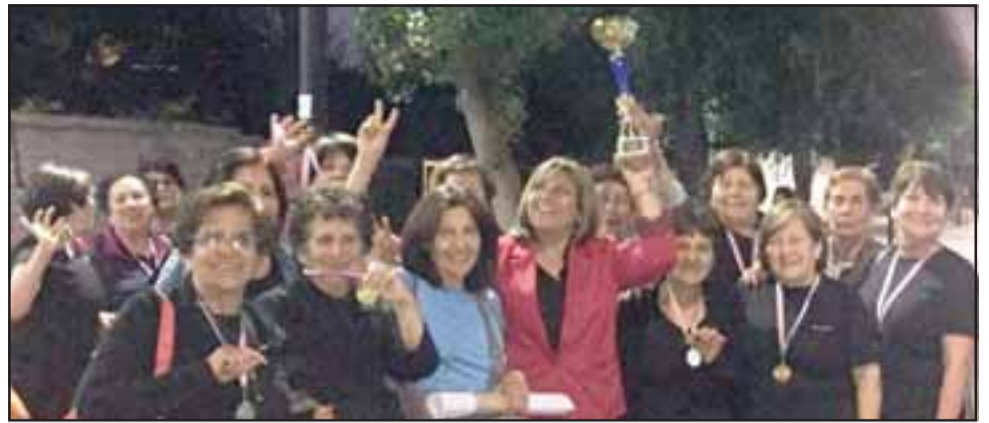
LOS CAMPEONES. - Con alegría se adjudicaron el primer lugar del IX Campeonato de Fitness, Aeróbica, Step y expresiones coreografías de danza y bailes para el Adulto Mayor, que se realizó en Cerrillos, de la Región Metropolitana.