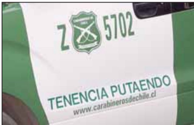
El hecho ocurrió mientras personal policial procedía a fiscalizar el móvil. El conductor fue detenido bajo los cargos de homicidio frustrado.

El sujeto fue detenido bajo los cargos de homicidio frustrado contra Carabineros en servicio.