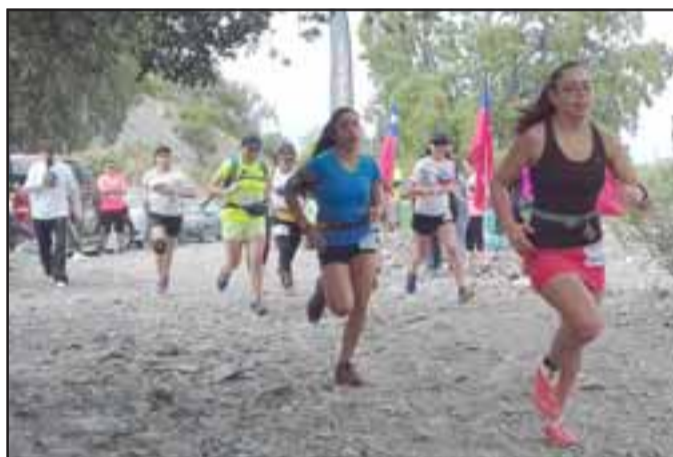
ELLAS TAMBIÉN.- Aquí tenemos a las chicas, ellas tampoco se quedaron atrás y compitieron con gran profesionalismo.

Hombres 15K: Luis Valle, con 52 minutos y 36 segundos.