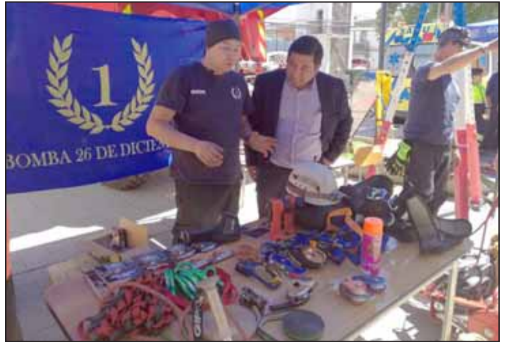
Con éxito se desarrolló la Expo Emergencias 2016 en Los Andes, actividad efectuada en el marco del programa Gobierno Presente, impulsado por la Gobernación Provincial de Los Andes.

La autoridad agregó que, entre las exhibiciones realizadas durante el Gobierno Presente, estuvieron