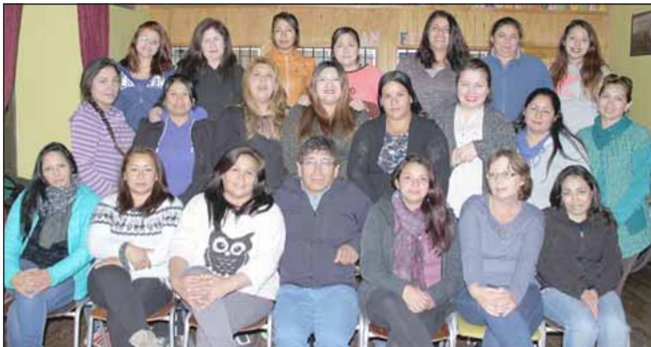
AÚN HAY CUPO.- Ellas son las vecinas que se están capacitando para trabajar, el llamado es a unirse al equipo.

gado, en las primeras tres fases se les paga media jornada, pues es de 8:30 a 13:30 horas de lunes a viernes, pero en la fase final, en terreno, ahí recibirá la jornada completa, creo que son más de $300.000», agregó Díaz a Diario El Trabajo .