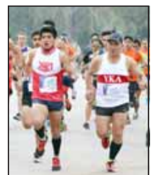
El atleta máster hará la distancia de los 10 k en Chicureo.

medición para ver si los entrenamientos y el trabajo que he realizado ha surtido efecto, porque además hice una dieta para recuperar mi peso de 65 kilos, así que debería andar bien en los 10 kilómetros", afirmó el atleta máster del club YKA, que en Chicureo, no quiere ser solo uno más de los 1500 competidores que ya confirmaron su participación en dicho evento.