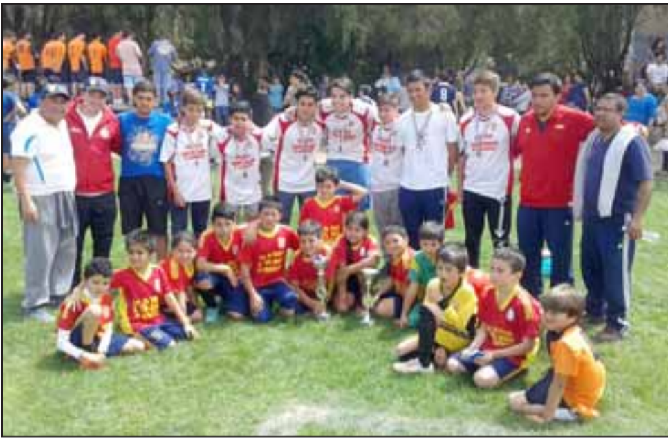
GENERACIÓN DE LUJO.- Vemos de pie y con uniforme blanco, a la selección juvenil U17 del Colegio Santa María de Aconcagua.