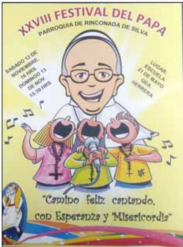
En Escuela 21 de mayo se desarrollará una nueva versión del Festival del Papa.