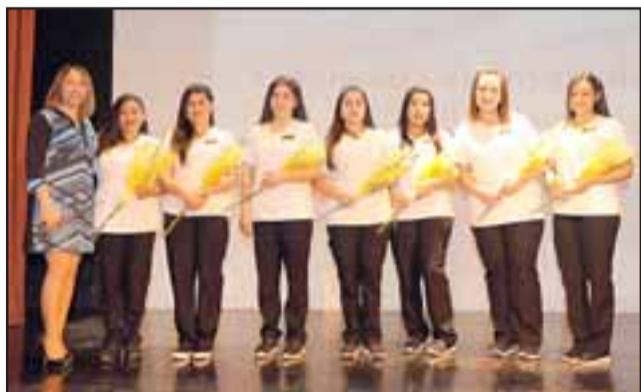
Parte de las 36 alumnas de Fonoaudiología que comenzaron a usar sus uniformes.