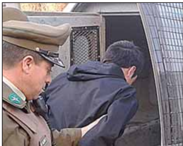
El imputado de 16 años de edad fue conducido hasta tribunales por este delito para ser requerido por la Fiscalía. (Foto Archivo).

Una estudiante de 14 años de edad, sufrió el robo de su teléfono celular en los momentos que efectuaba una llamada a su madre, mientras circulaba por avenida Maipú en San Felipe la tarde de este miércoles, momentos en que un precoz delincuente menor de edad aprovechó la ocasión para robar el móvil de las manos de la adolescente y escapar hacia otras arterias, siendo capturado en flagrancia por la SIP de Carabineros.