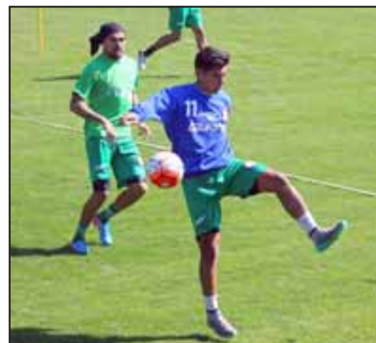
El mismo día de su cumpleaños el Uní enfrentará a Unión La Calera.