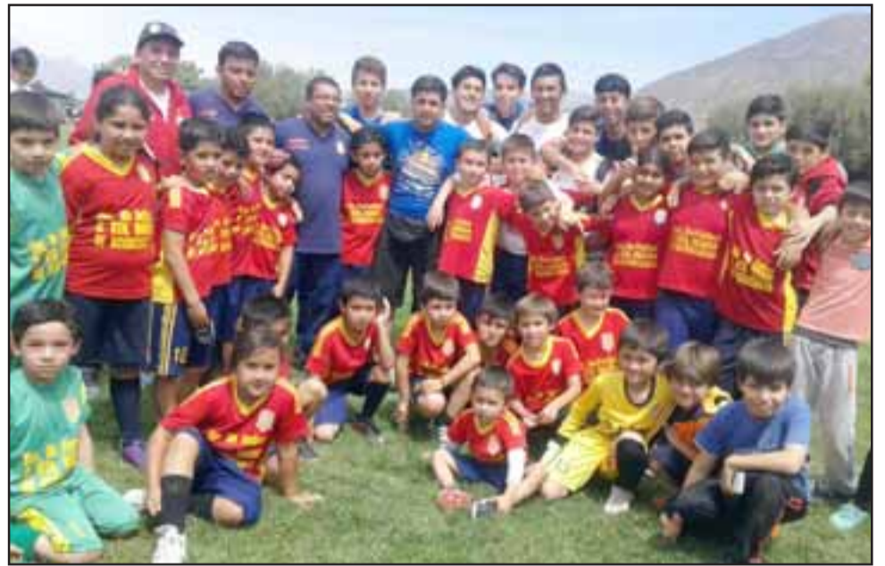
LOS CAMPEONES.- Ellos son nuestros bicampeones, participantes del Campeonato Roberto Barraza.