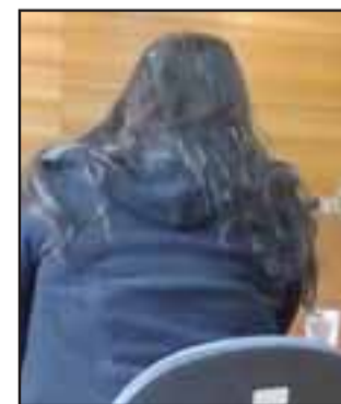
La mujer, quien no registra antecedentes penales anteriores, pasó a disposición del Tribunal de Garantía de Los Andes, por el delito de tráfico de estupefacientes.