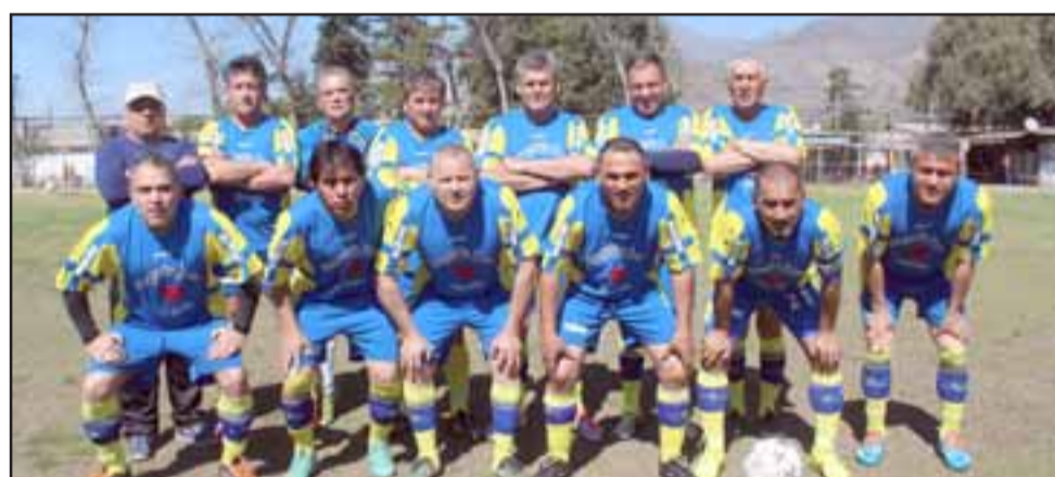
Tsunami es uno de los animadores del actual torneo de la Liga Vecinal.