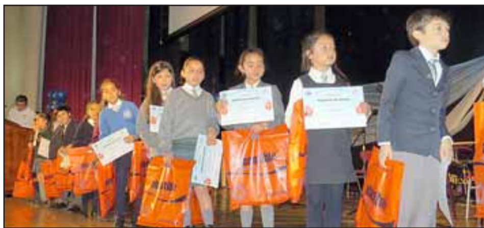
Felices se encontraban los Mejores Compañeros de cada escuela llayllaína al recibir su diploma y premios, siendo distinguidos con tal honrosa mención.