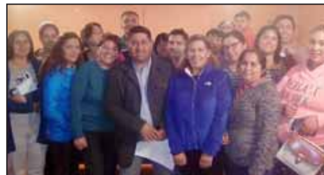
Familias del Comité Valle Curimón llevaban más de 3 años esperando a que la empresa consultora los postulara a los recursos Serviu para ampliar sus casas.

las personas, los vecinos y vecinas sólo piden ser escuchados, tomados en cuenta y ser orientados. Todo lo demás lo ponen ellos y ellas. He sido testigo de muchas iniciativas como ésta. Las familias -especialmente las más humildes- no quieren 'regalos ni favores', quieren participar y trabajar por mejorar su calidad de vida ¿y qué piden?: sólo que la autoridad las trate con respeto y los acompañe en el camino para conseguir sus objetivos. Esa es la manera más digna de avanzar y concretar sueños comunes y, para eso yo he estado, estoy y estaré disponible, ojalá desde el Concejo Municipal, ya que desde allí, como concejal, tendré más herramientas e información para seguir trabajando juntos, codo a codo, con todos y cada uno de los comités que me necesiten, no sólo para ampliaciones, sino para pavimentos participativos, paneles termosolares, mejoramiento de la vivienda y su entorno, efi-