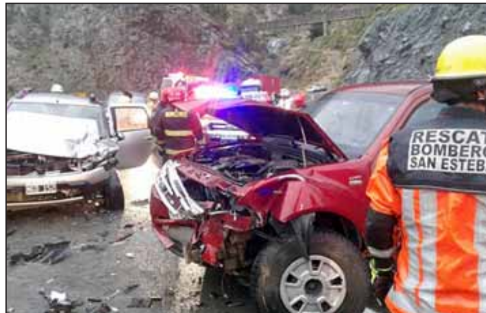
Una colisión frontal entre un auto argentino y una camioneta con patente chilena, se produjo la tarde del sábado en el camino internacional, dejando como saldo dos personas lesionadas.

Pero este no fue el único accidente ocurrido la tarde del sábado debido a la intensa lluvia, ya que a la misma hora se produjo una colisión por alcance entre tres buses con peregrinos que regresaban del santuario de Auco, resultando siete personas con lesiones menores.