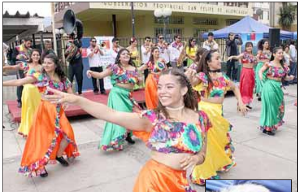
LA GRITONA. - Aquí tenemos a los chicos de Comparsa La Gritona, de Valparaíso, agrupación artística que presentó su trabajo en esta Feria Migrante.

«Cuando en una comunidad se invita a la población migrante a presentar públicamente su cultura, tradiciones y gastronomía, implica un reconocimiento