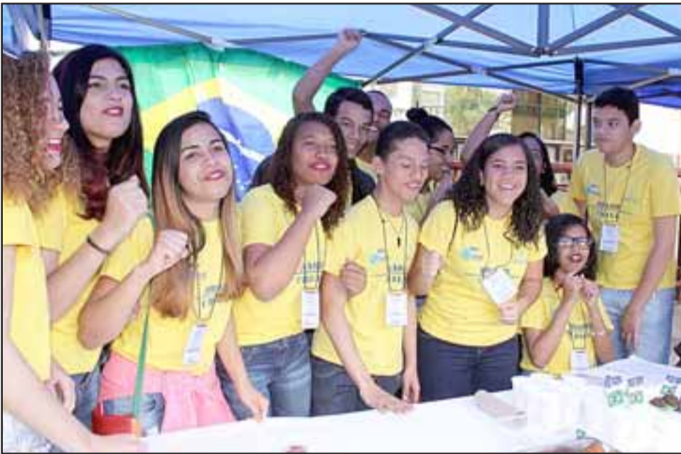
CARIOCAS. - Aquí tenemos a los jóvenes brasileños, ellos también presentaron sus comidas típicas en la Plaza Cívica.

al desarrollo que tiene este intercambio de interculturalidad, de la misma forma que ocurrió durante el siglo pasado, el programa Migrantes es generado por el Consejo Nacional de Cultura, quienes hemos vivido en otros países sabemos que todo lo positivo de las culturas migrantes en nuestro