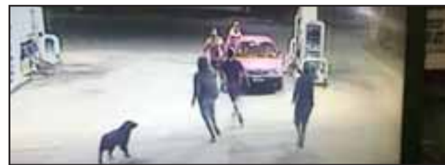
El momento que los cinco delincuentes van ingresando hasta el servicentro Shell fuertemente armados a eso de las 21:00 horas del pasado jueves.