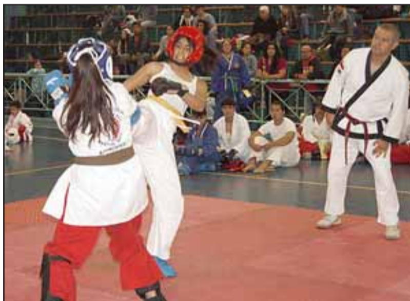
Competidores de distintas edades y categorías estuvieron presentes en la octava edición de la Copa de la Hermandad.