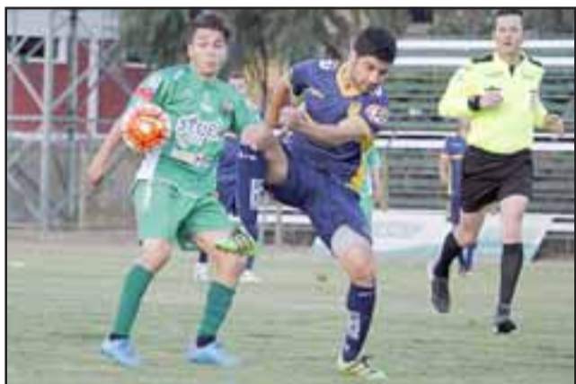
El viernes Trasandino obtuvo su primer triunfo como local al imponerse por 1 a 0 a Barnechea. (Foto: Patricio Aguirre).

Lota Schawager 0 - Colchagua 0; Melipilla 2 - La Pintana 1; San Antonio 1 - Valledor 0; Malleco 0 - Naval 2.