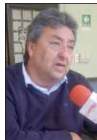
Jorge Jara Catalán, alcalde subrogante de San Felipe.

De acuerdo a lo manifestado por el abogado, en caso de que el gremio concrete su