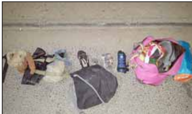
Foto especies 1: Parte de las especies que recuperó la policía uniformada que fueron extraídas desde un departamento.