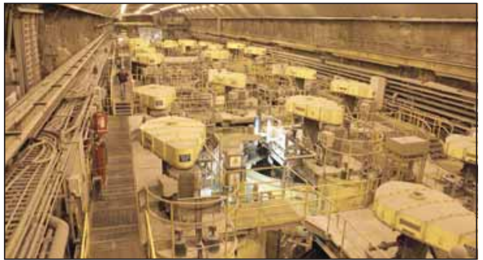
La organización sindical, manifiesta que existe un incumplimiento grave en el artículo 34 del Decreto Supremo de Seguridad Minera, de parte de las mismas exigencias que hace Codelco a sus trabajadores y que va en desmedro de las correctas operaciones de la División Andina.

Minera y no se tenga que esperar alguna consecuencia mayor para que la empresa reaccione ante esta situación.