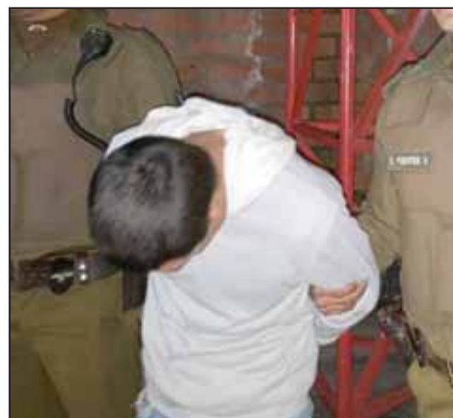
El imputado de 39 años de edad fue detenido por Carabineros de la Subcomisaría de Llay Llay.