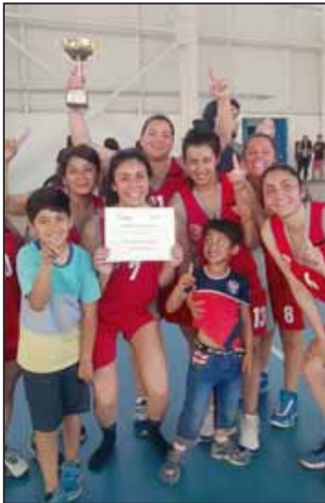
Los equipos adultos de Frutexport cosechan triunfos tanto en damas como en varones.