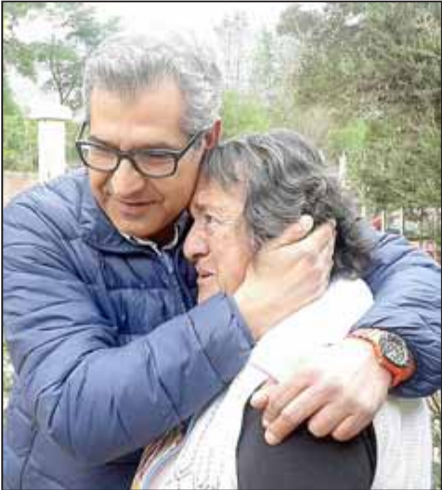
EMOTIVO.- En algunas ocasiones los sanfelipeños fueron emotivos con el político de 45 años, cuando él les visitó en sus casas.