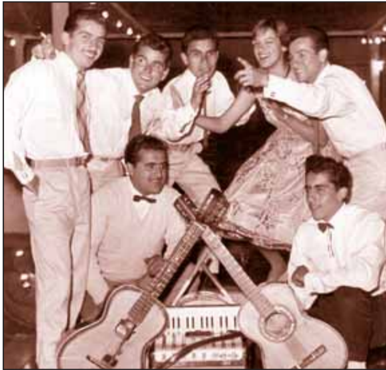
Aquí tenemos a esta desequilibrante chiquilla con Los Agricolan Rochels, banda de los años sesentas.

- "Dejé de cantar públicamente en 1965, luego que viviera yo varios años de popularidad y éxitos en el valle. Cantaba yo en muchos eventos, me tenía que adaptar a las bandas locales que existían esos años, como es el caso de Los Rochels Agricolan y Los Reales".