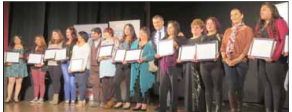
Un total de 127 hombres y mujeres de la ciudad del Viento Viento, recibieron de manos del gobernador Eduardo León, sus respectivos diplomas de los cursos de Soldadura, Bodega y Maestría en Cocina impartidos por Sence y el Programa +Capaz.