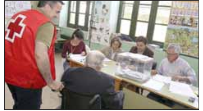
La filial de Cruz Roja San Felipe, entrega un listado de recomendaciones para que los electores tomen en cuenta al momento de concurrir a sus respectivos recintos de votación. (Foto Referencial).