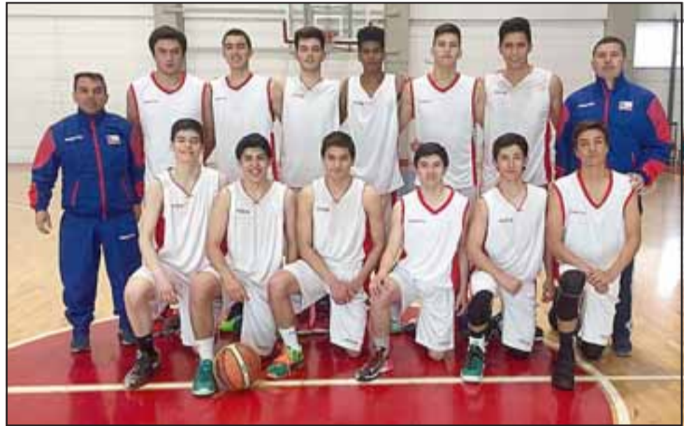
La selección chilena U15 tiene dentro de sus filas a dos jugadores y el entrenador de San Felipe Basket.

Cuatro seleccionados en distintos equipos, habla a las claras del trabajo profesional que se está haciendo en San Felipe Basket que, en un corto tiempo a nivel de menores, pasó a convertirse en uno de los principales clubes chilenos.