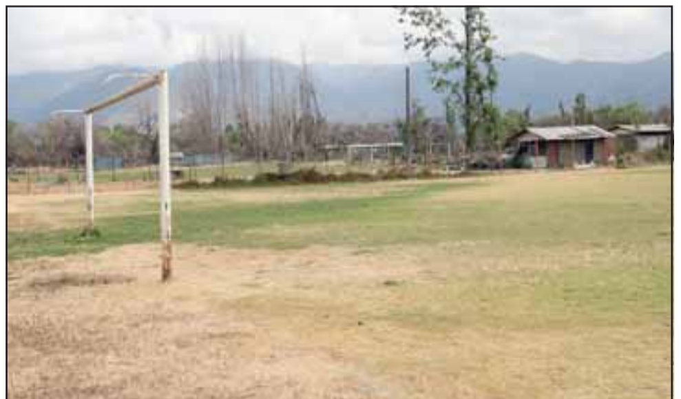
En el complejo Las Tres Canchas se realizará el sábado un torneo en el que participaran las series terceras de cada club sanfelipeño.

Pero no solo los hombres han dado satisfacciones, ya que las mujeres del Frutexport hicieron suyo un torneo que pocos días atrás se realizó en la comuna de Cate-