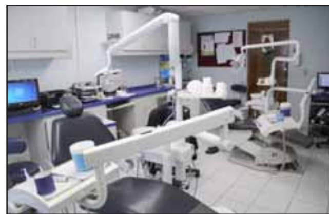
Hoy viernes 4, sábado 5 y lunes 7 de noviembre el Centro de Salud Familiar Valle de Los Libertadores, no atenderá ningún tipo de atención odontológica, debido al recambio de módulos dentales al interior del recinto.

«Solo cuatro personas no han podido ser ubicadas, ya que no contestan su teléfono. Por lo tanto, se hace