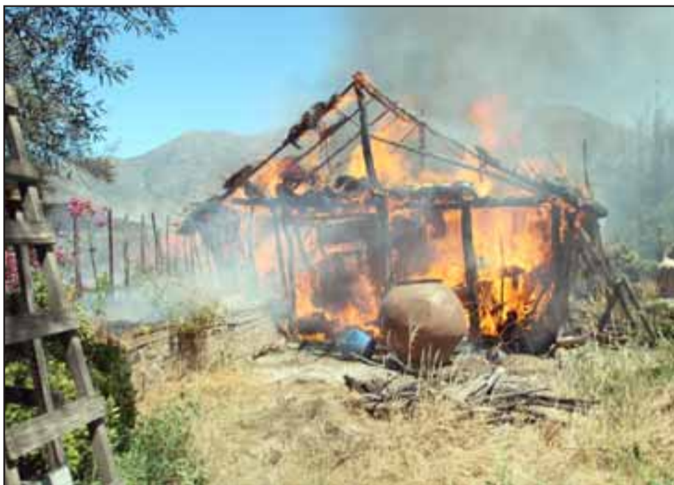
El viento empeoró la situación, ya que rápidamente las llamas comenzaron dispersarse por todo el inmueble, reduciendo a cenizas la estructura donde se guardaban materiales agrícolas. (Foto de Patricio Gallardo).