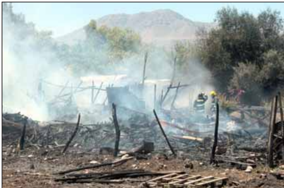
TODOS DESTRUIDOS.- Al final del incendio sólo quedaron escombros y cenizas en la propiedad.