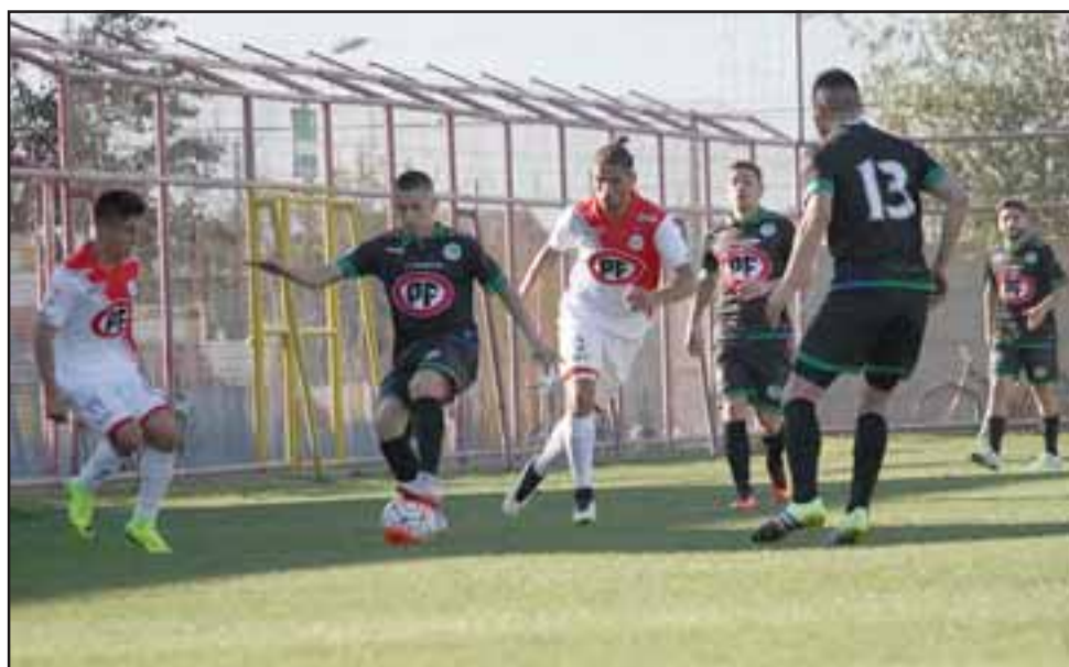
Los hinchas que adquieran sus entradas con anticipación obtendrán un importante descuento para el próximo duelo del Uní en el Municipal.

-Alimentos para mascotas Vitoko (Traslaviña al llegar a Artemón Cifuentes)