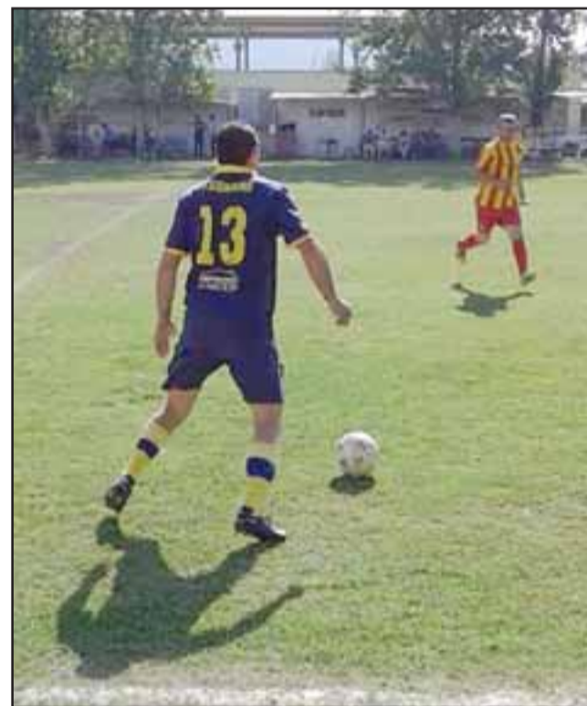
Otra fecha favorable para el puntero es la que se jugará el domingo en Parrasía.

El caminar sólido y tranquilo que PAC ha mostrado hace ya bastante rato en la cancha Parrasía, no debería sufrir variaciones debido a que este domingo asoma en su horizonte Los Amigos, una escuadra que parece no tener los argumentos futbolísticos suficientes como para amagar el poderío del mejor equipo de la Liga Vecinal.