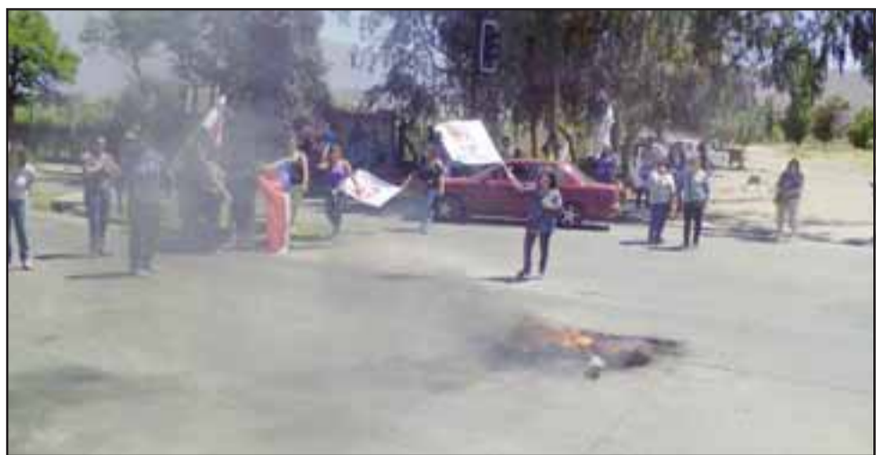
Trabajadores del Hospital San Camilo quemaron un neumático frente al establecimiento.

Respecto de cuáles son las acciones a seguir, el dirigente aseguró que las movilizaciones continúan hasta que el Gobierno se muestre dispuesto a negociar y presente un nuevo proyecto de reajuste salarial para los trabajadores, mientras tanto, “la instrucción que tenemos es parar hoy y mañana (ayer y hoy), mañana nos juntaremos con la marcha que realiza la coordinadora No + AFP, que acá en Aconcagua está convocando a juntarse a las 11 de la mañana en la esqui-