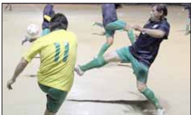
Los cuartos de final del Regional Súper Senior, cuenta con la presencia de dos selecciones del valle de Aconcagua.