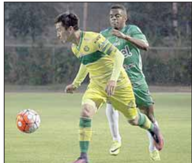
Ante el colista de su zona, el quipo de Los Andes buscará quedarse con los tres puntos.