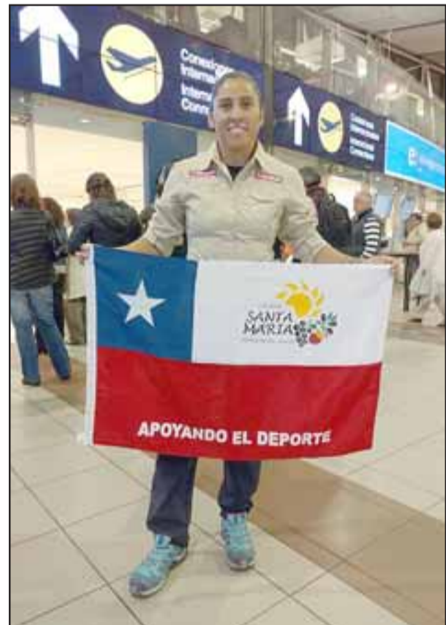
La atleta viajó durante la madrugada del jueves rumbo a Australia.