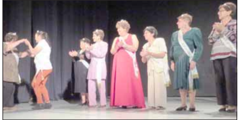
Las reinas lucieron muy bellas y felices, cada una representó a un club. Un ramillete de bellezas que subió al escenario a compartir su chispa y simpatía con los asistentes al evento.