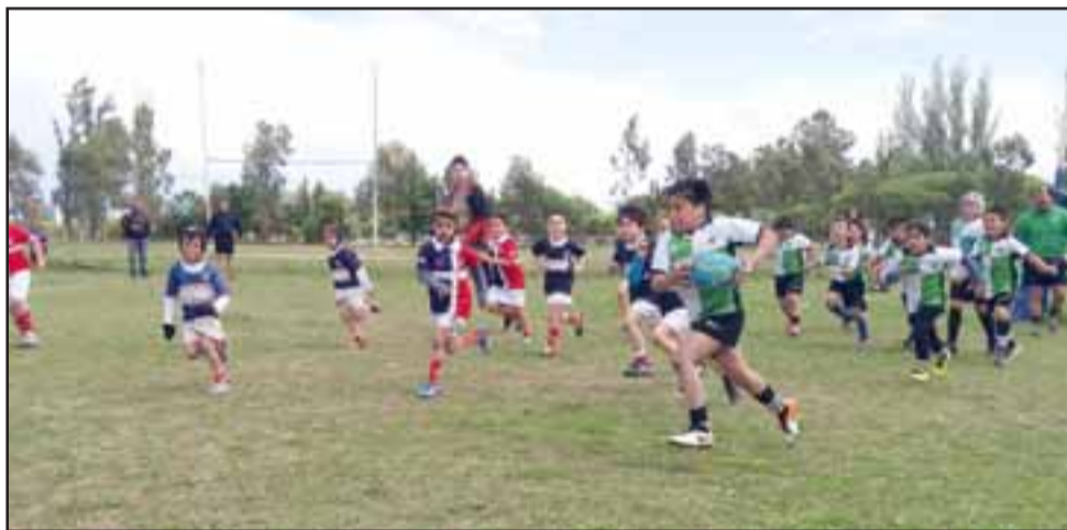
La serie infantil de Halcones Rugby, los queridos Pichones disputaron encuentros contra equipos argentinos, aprendiendo más sobre este deporte y creando lazos de amistad y compañerismo entre ellos y con niños de los equipos rivales.

Finalizada esta gran experiencia deportiva y de amistad de los niños Pichones, los dirigentes locales agradecieron a todos quienes les acompañaron y gestionaron para que este viaje resultara impecable y fuera posible.