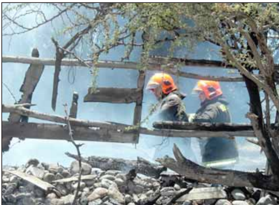
SIEMPRE ELLOS.- Los bomberos debieron emplearse a fondo para poder controlar la situación.