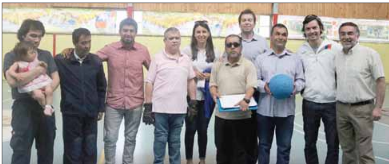
CONDORES DE ACONCAGUA.- Nace el primer club de las provincias de San Felipe y Los Andes, constituido formalmente por ciegos para el desarrollo del goalball, deporte paralímpico.

«Es un logro importante y sin lugar a dudas nos van a representar muy bien -a San Felipe y al Aconca-