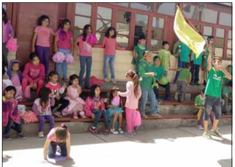
ALIANZA VERDE.- Aquí tenemos también a los chicos de la Alianza Verde, ellos tampoco se dejaron intimidar por la alianza rival.