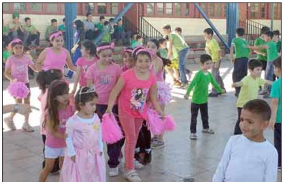
ALIANZA ROSA.- Aquí tenemos a los estudiantes de la Alianza Rosada, quienes lucharon en todo momento por ganar las competencias.