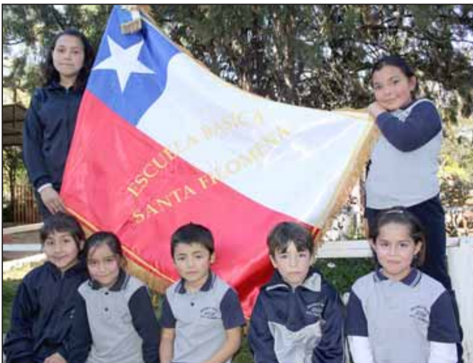
NUEVO ESTANDARTE.- Estos Alumnos muestran a Diario El Trabajo el nuevo estandarte de su escuela, el que está siendo estrenado en estas actividades.