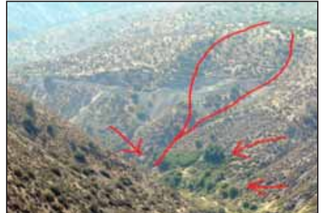
Informes técnicos avalan que funcionamiento de faena Minera Nueva Esperanza podría afectar a la zona de napas del acuífero que alimenta de agua a los vecinos de sectores El Zaino, Jahuel y Santa Filomena, en la comuna de Santa María. (Foto Referencial).