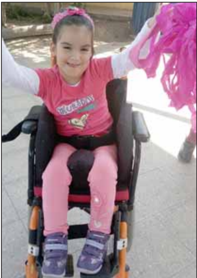
SIEMPRE OPTIMISTA.- El estar en silla de ruedas no le impidió a esta pequeñita el vivir con alegría el aniversario de su amada escuela.