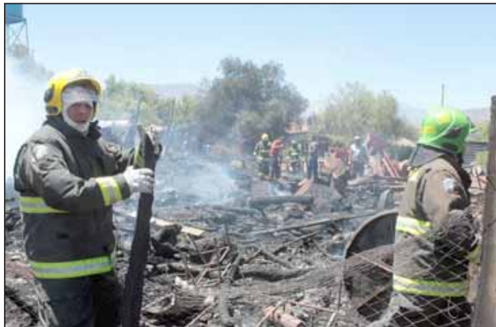
HASTA EL FINAL.- Estos héroes sanfelipeños al final debieron remover todo el escombros de la propiedad a fin de evitar que el fuego reviviera.