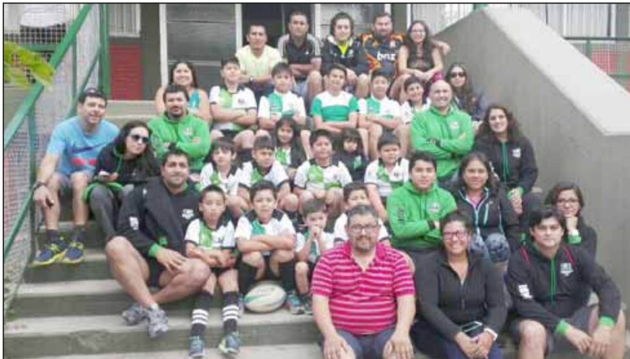
Pichones de Calle Larga junto a sus padres y apoderados.

Al final de la jornada, la satisfacción de haber realizado una excelente participación deportiva y humana compartiendo con culturas distintas, pero de unión en torno al Rugby, llena de orgullo a quienes fueron par-