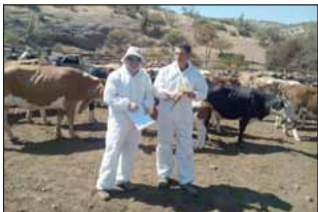
El programa Trazabilidad Animal, que implementa el SAG a nivel nacional, consiste en construir un historial de los animales de interés pecuario, registrarlos e identificarlos.

LLAY LLAY.- Bastante aceptación ha tenido en Llay Llay el programa 'Trazabilidad Animal' que está implementando el Servicio Agrícola y Ganadero a nivel nacional.