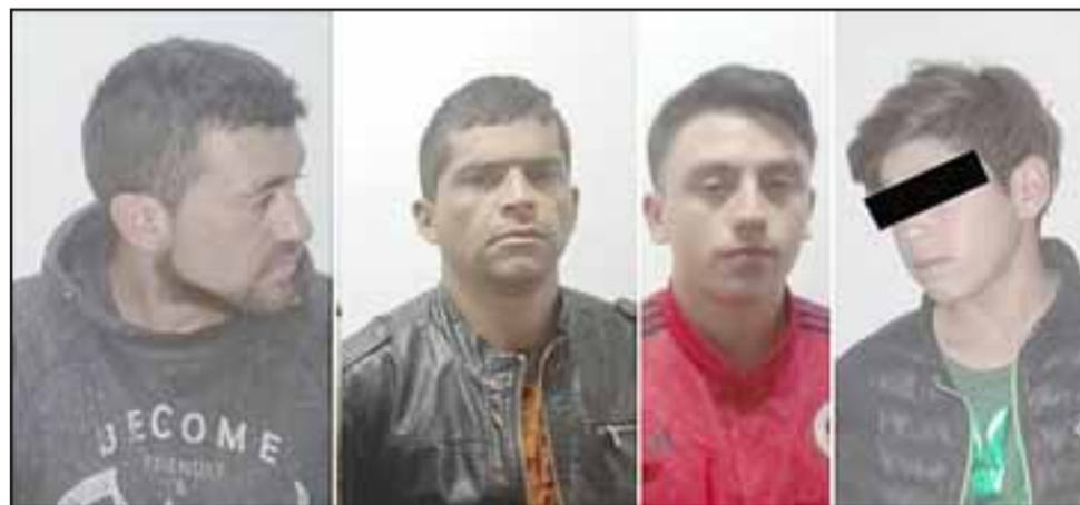
Los imputados fueron detenidos por Carabineros la madrugada de ayer domingo en avenida Chacabuco de San Felipe, uno de ellos un menor de 14 años de edad.

Personal de Carabineros, al concurrir al local comercial, observaron que faltaba un panel del cielo raso, divisando a cuatro sujetos que huían por la avenida Chacabuco, los cuales fueron interceptados sin especies, pero reconocidos por el