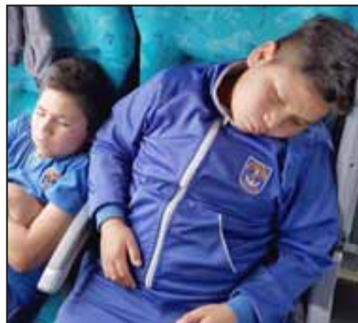
SIN ENERGÍA.- Los chicos regresaron agotados y muy relajados, sabiendo que el nombre de su escuela ahora es muy conocido en tierras del sur.