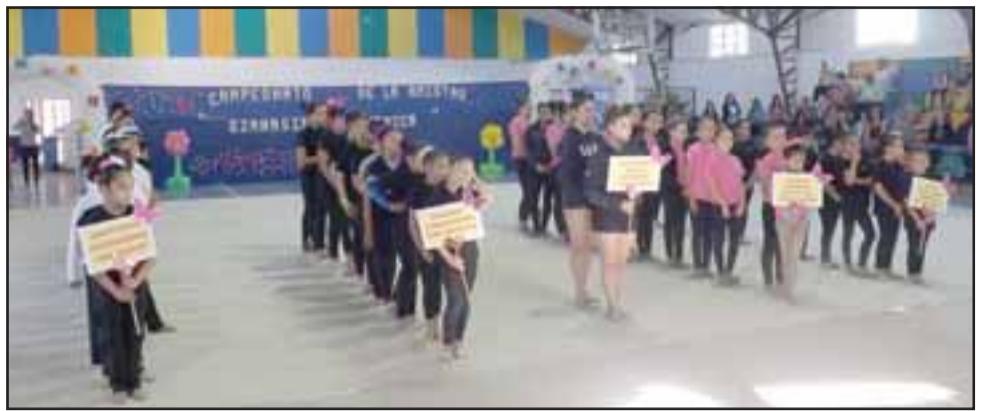
WINNERS.- Posan radiantes para la cámara, los ganadores del evento Iapb's Got Talent.

Año tras año, esta actividad ha ido adquiriendo una valoración por parte de la comunidad educativa, transformándose en una instancia altamente espera-