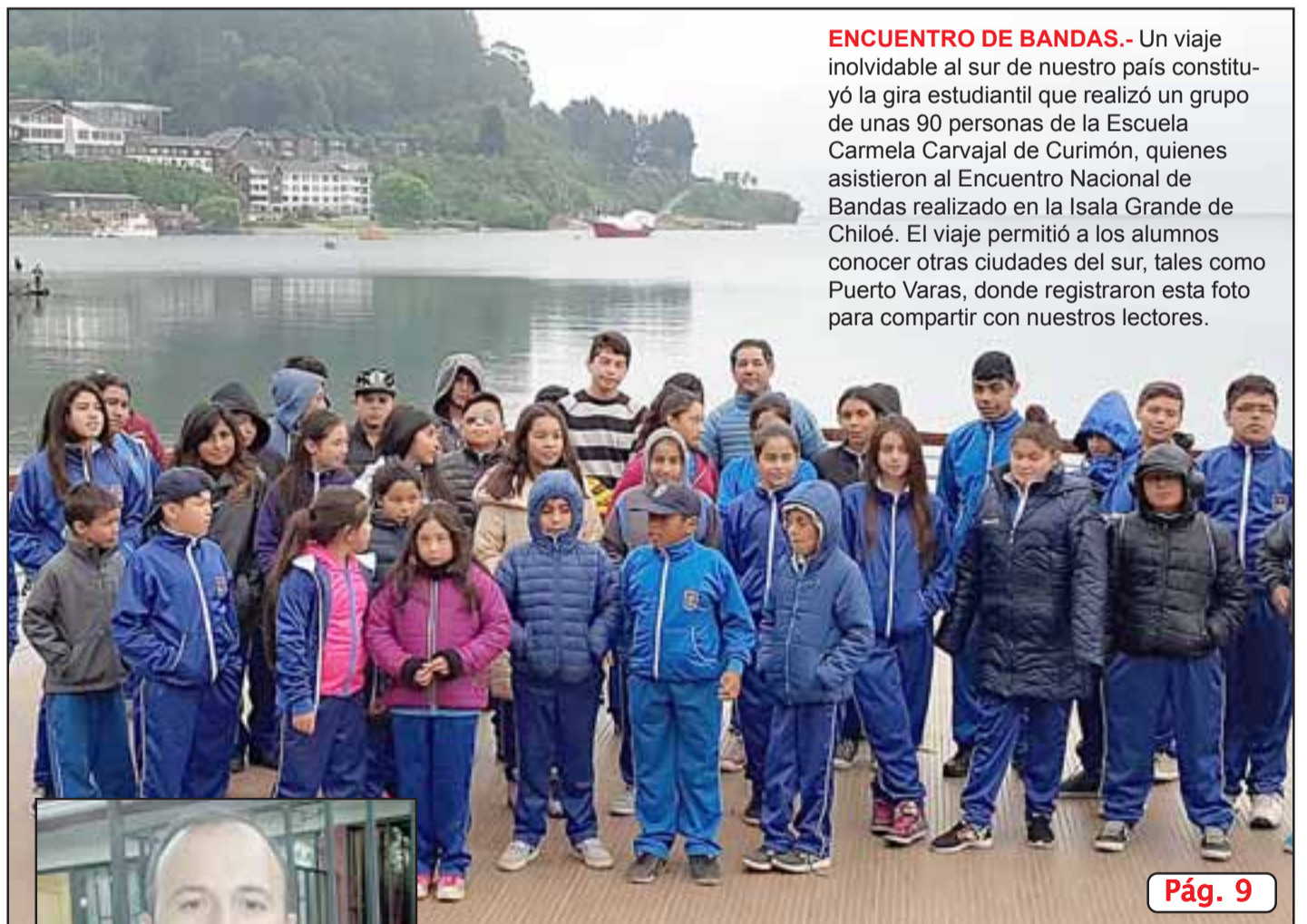
ENCUENTRO DE BANDAS.- Un viaje inolvidable al sur de nuestro país constituyó la gira estudiantil que realizó un grupo de unas 90 personas de la Escuela Carmela Carvajal de Curimón, quienes asistieron al Encuentro Nacional de Bandas realizado en la Isala Grande de Chiloé. El viaje permitió a los alumnos conocer otras ciudades del sur, tales como Puerto Varas, donde registraron esta foto para compartir con nuestros lectores.