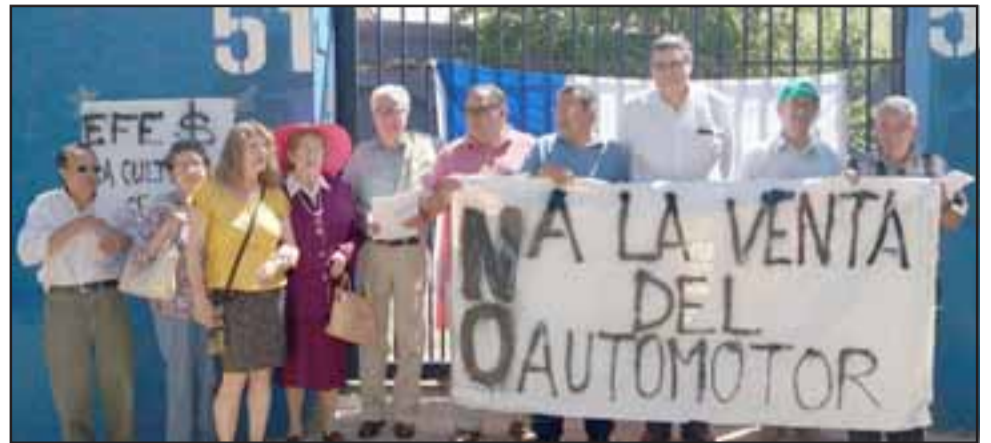
La protesta pacífica, se realizó en el acceso a la exmaestranza ubicada en avenida Argentina donde colocaron lienzos alusivos a esta situación.

Añadió que se debe replicar lo que ha hecho Suiza con sus trenes de montaña donde no solamente han conservado su material rodante, sino que desarrollado circuitos turísticos, “entonces nosotros tenemos un ferrocarril que recorría un paraje extraordinario de la cordillera de Los Andes y que puede ser explotado turísticamente” .