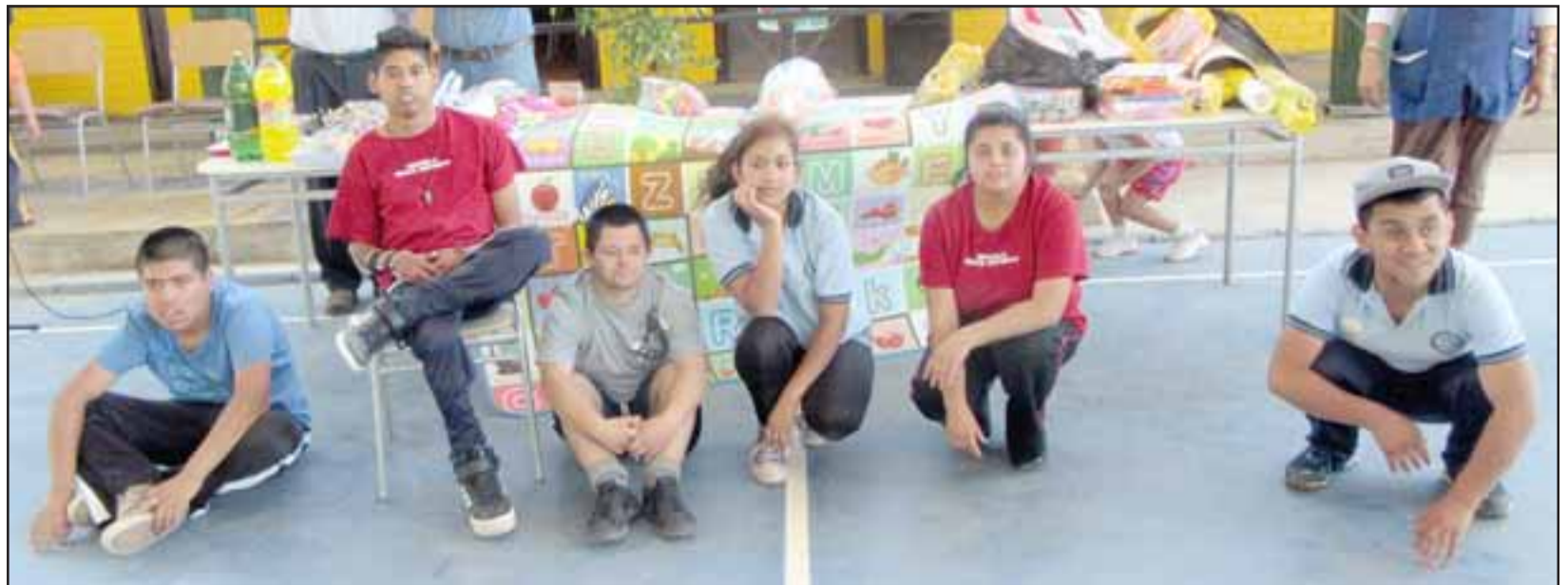
ELLOS CONTENTOS.- Aquí tenemos a parte del estudiantado de esta escuela especial, ellos están ya disfrutando de este material didáctico.

«En esta oportunidad hicimos cuatro donaciones a instituciones del