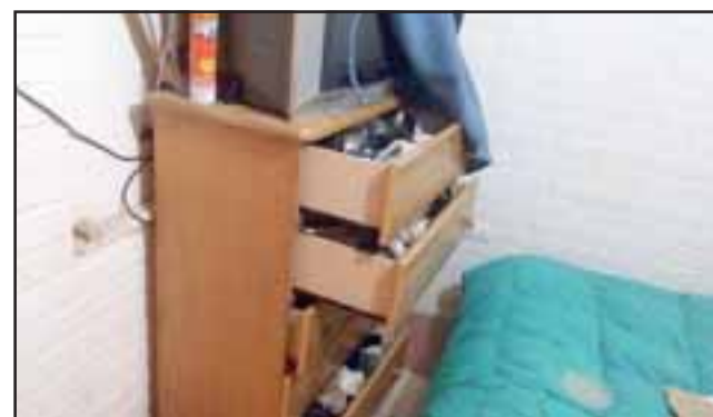
Los sujetos desordenaron todas las habitaciones para desvalijar la vivienda cerca de las dos de la madrugada del pasado viernes.

- Dejaron todo desordenado, destrozaron la chapa eléctrica, rompieron la puerta, se llevaron un televisor, una mochila, vestuario, computador, relojes, perfumes, una máquina de coser nueva, celulares, pendrives, zapatillas y varias monedas, cosas de mis hijos y de los proyectos del Quiero Mi Barrio, yo avalúo todo en más de dos millones de pesos. Como