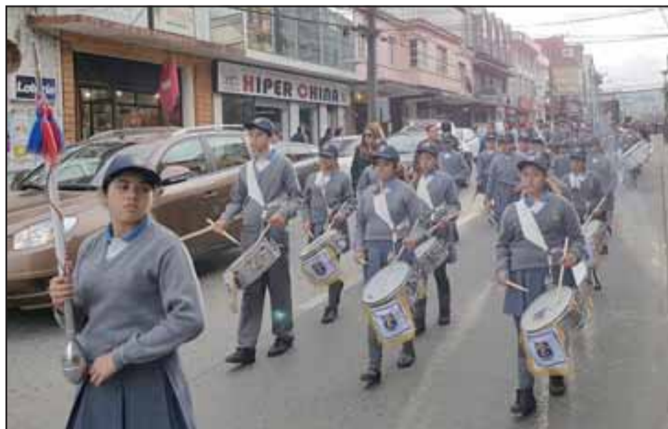
CONQUISTAN CHILOÉ.- Los chilotes disfrutaron en algunas de sus ciudades de esta presentación estudiantil.