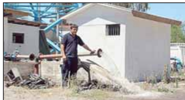
El Comité de Agua Potable Rural (APR) de esa localidad, habilitará uno de sus pozos profundos para abastecer a Bomberos de Putaendo, ante cualquier tipo de catástrofe forestal.

Historial de los animales de interés pecuario: