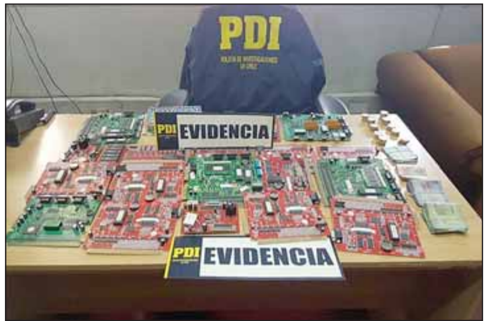
Las placas madres fueron evaluadas en más de 132 millones de pesos, mientras que el dinero al interior de los aparatos alcanzó a 2 millones 415 mil pesos, en monedas de 100.

ligencia no contempló la clausura de locales ni el retiro de las máquinas tragamonedas, solamente el retiro de las placas madres, con lo cual quedan prácticamente inutilizables, ya que dichas tarjetas las convertían en máquinas de azar y no de destreza. No obstan-