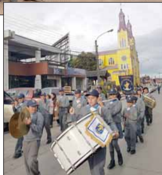
GRANDE CHIQUILLOS.- En el puro corazón de Castro, nuestros chicos de la banda de la Escuela Carmela Carvajal brillaron con luz propia.