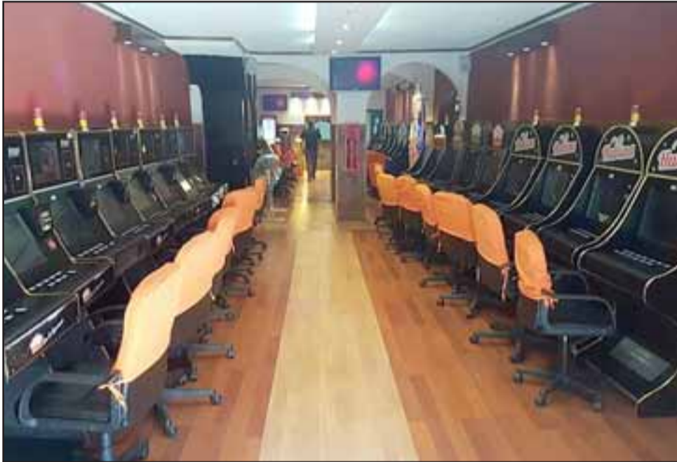
Diez salas de juego o 'casinos' como se les conoce popularmente, fueron intervenidos por la Policía de Investigaciones que procedió a inutilizar las máquinas tragamonedas.