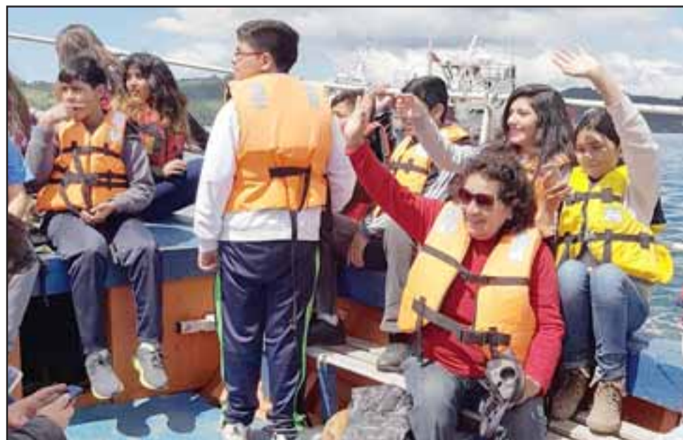
APODERADOS TAMBIÉN.- Los apoderados que viajaron también disfrutaron con sus niños de algunos paseos en el mar.