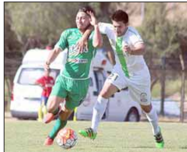
Trasandino fue vencido en el Regional de Los Andes por Deportes Vallenar.