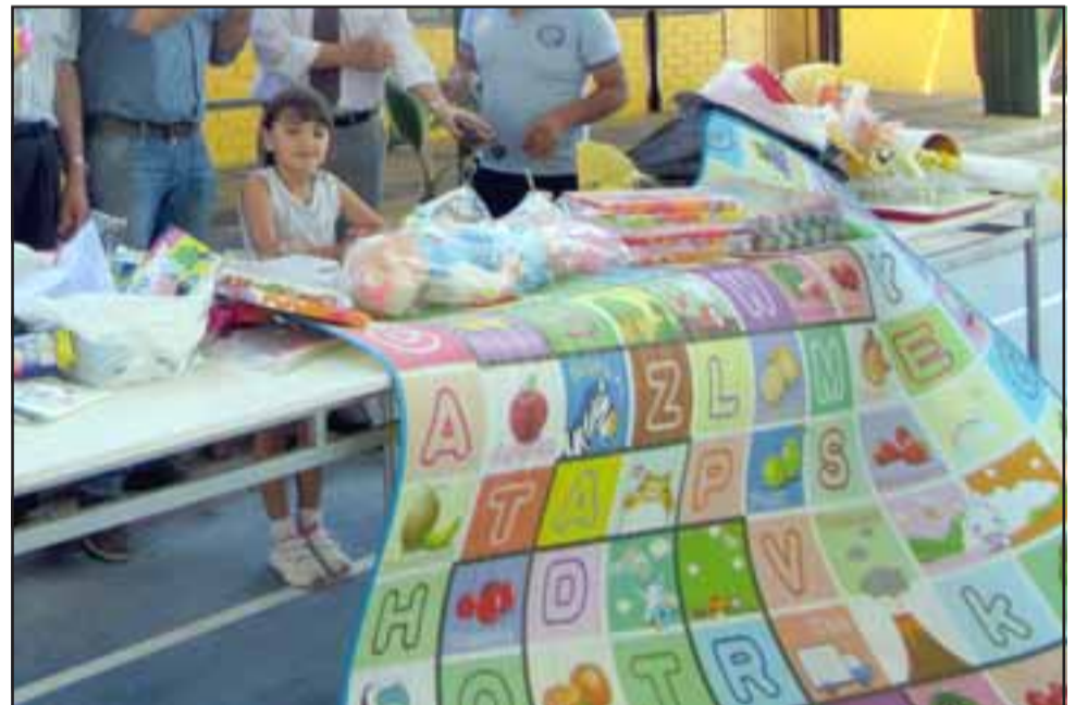
MUY ÚTIL.- Esta pequeña muestra a Diario El Trabajo parte del material didáctico recibido en esta donación.