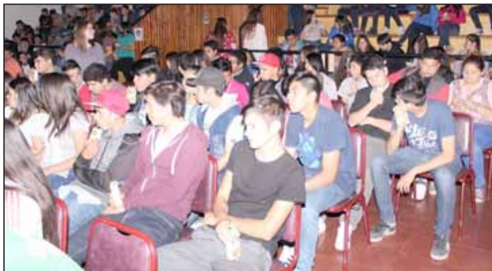
La sala de la galería cultural, estaba casi copada de alumnos del Colegio Panquehue. La invitación era para participar de una charla sobre cuidados y sexualidad.