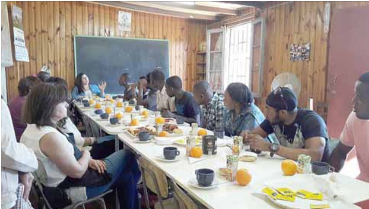
Los ciudadanos atentos a lo que la profesora les está enseñando para que puedan expresarse mejor con el idioma en San Felipe.

En cuanto al número de inmigrantes, este sobrepasaría los doscientos.