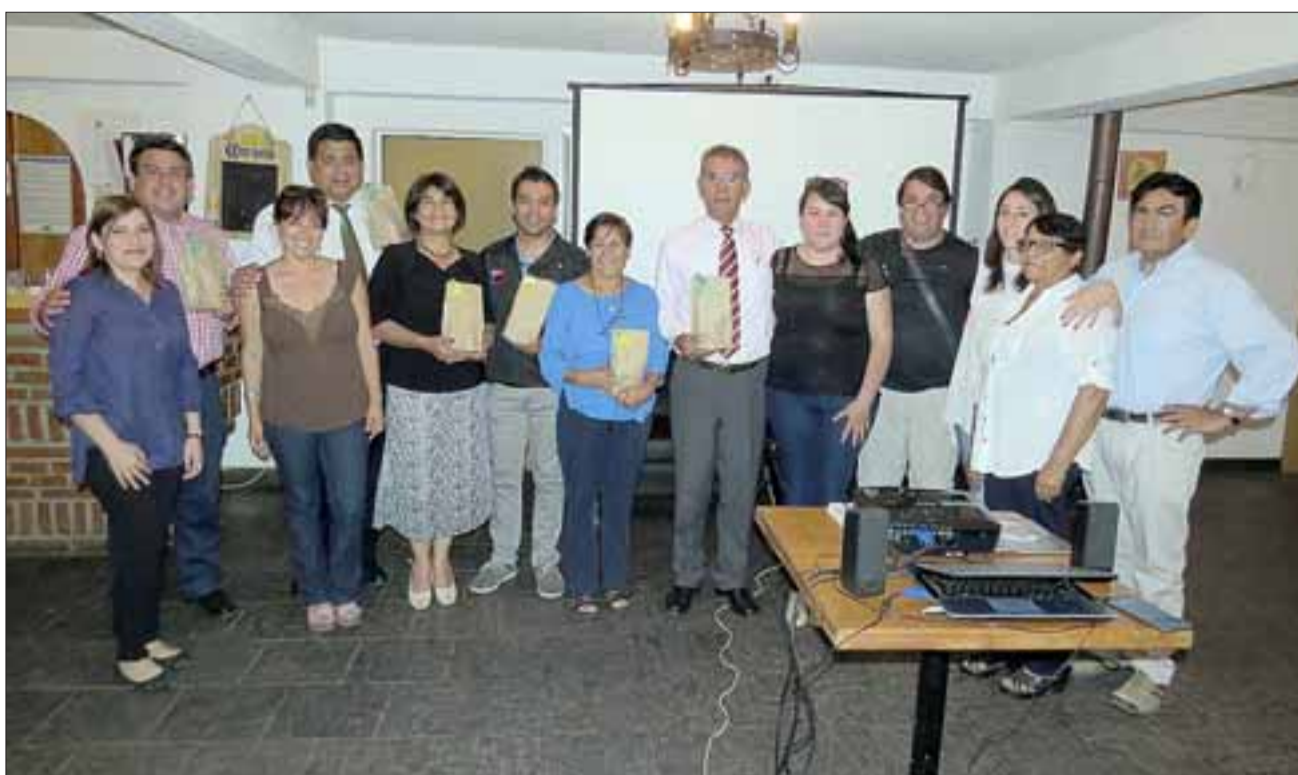
Ya son 30 las familias beneficiadas con estos dos programas, uno que comprende mejoras en el entorno del hogar.