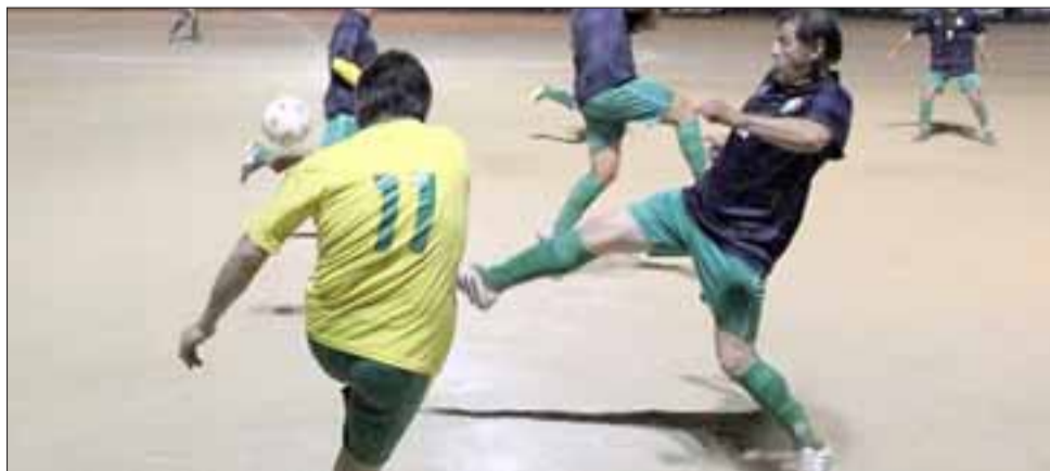
Dos selecciones del Valle de Aconcagua estarán en las semifinales del Regional Senior.

Ahora los juveniles albirrojos chocarán en postemporada contra sus similares de San Marcos de Arica, a los que enfrentarán en San Felipe, algo inédito debido a que siempre en las fases decisivas les había correspondido ser visitantes.