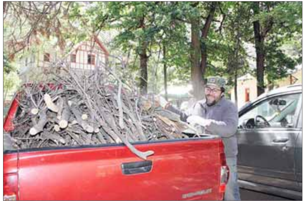
La iniciativa de entrega de leña, permite que vecinos puedan contar con combustible para sus actividades y comenzar con un trabajo de limpieza y mejoramiento del entorno.

La iniciativa de ayuda mutua surgió de la mesa de trabajo que Codelco Andina mantiene en Río Blanco. “La idea nació de los propios vecinos, la junta de