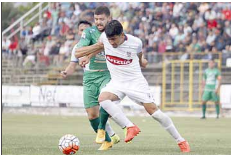
En un partido en el cual luchó durante los 90 minutos de juego Trasandino fue derrotado 4 a 3 por Melipilla.

En el 64', Franco Montero nuevamente adelantó a Trasandino en el marcador, pero diez minutos más tarde, Ignacio Troncoso anotaría el empate que parecía