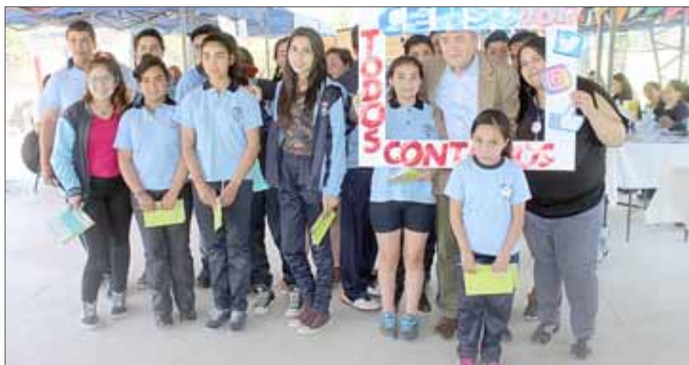
Hasta el alejado sector El Tártaro llegó el programa Gobierno Presente que se desarrolló en la multicancha del club deportivo Juventud Unida, donde alumnos aprovecharon de fotografiarse junto al Gobernador Provincial de San Felipe.

miso del Gobierno es estar en todos los lugares y por ello hoy estamos acá. Los vecinos han podido consultar y realizar varios trámites, lo que nos ha dejado muy conformes. Yo agradezco a los funcionarios públicos que, pese a la movilización, estuvieron presentes atendiendo a las personas" finalizó la máxima