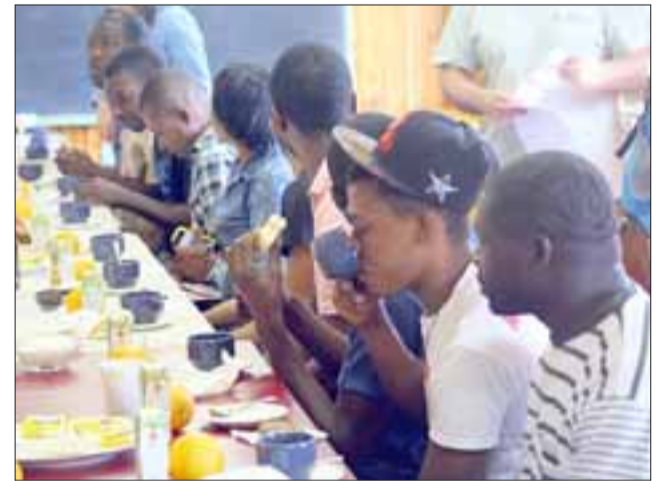
Un joven haitiano disfruta de una taza de té mientras los demás escuchan con atención.