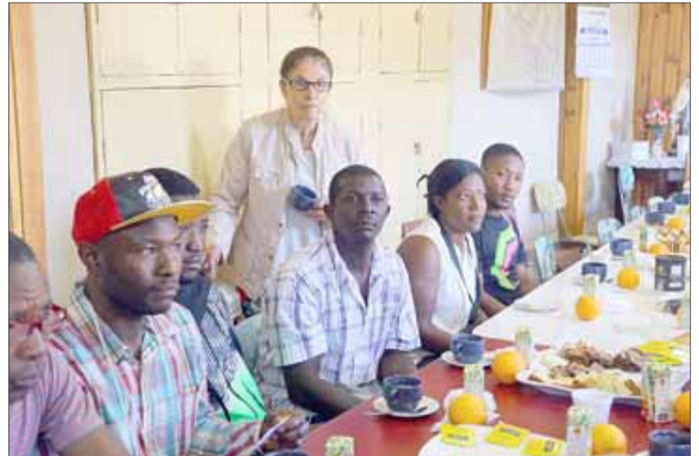
Una de las voluntarias organizadoras compartiendo con los ciudadanos haitianos.