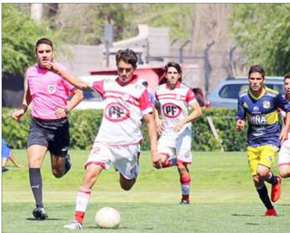
El conjunto sub – 19 del Uní Uní clasificó a Play Offs en el torneo de Clausura del Fútbol Joven de Chile.

Peñablanca; Unión del Pacífico; Panquehue, Rinconada.