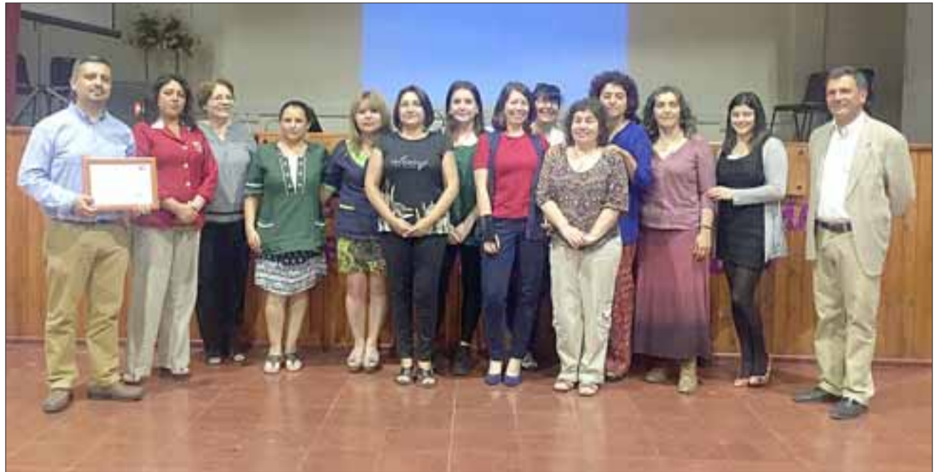
El programa Habilidades para la Vida, se desarrolla como un modelo de intervención psicosocial, cuyo eje principal es la promoción y prevención de la salud mental a nivel de la comunidad educativa.