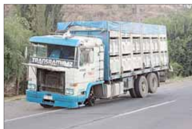
Cerca de las 06:30 horas de la madrugada de este viernes, un camión cargado con frutas sufrió el desprendimiento de una de sus ruedas delanteras mientras se dirigía hacia Putaendo a través de la carretera E-71.

En tanto, el hecho pudo haber derivado en un accidente mayor, pues el camión ocupó toda una pista y estaba cerca de una curva, lo que obligaba a conductores a frenar bruscamente al encontrarse repentinamente con el camión.