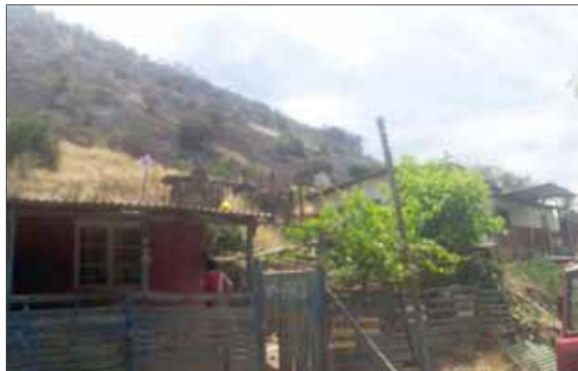
Bomberos logró controlar un incendio que se produjo en el Cerro La Virgen, manifestándose cinco metros de llegar a las casas del sector.

Consultados por los reiterados rebrotos de fuego en el Balneario Andacollo, el Comandante expresó, "nosotros tenemos claro que no son rebrotos en ese sector, es gente que está quemando, todos los antecedentes se pasaran a Carabineros para que el Ministerio Público haga una investigación como corresponde, creo que hemos ido 20 veces es poco y el incendio lo hemos controlado completamente, no es posible que al otro día a las tres de la