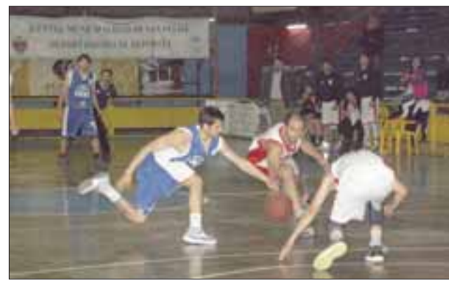
El Prat está cerca de llegar a los Play Offs de la Libcentro Pro A.