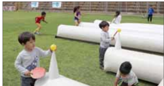
Novedosos juegos inflables, fueron la atracción de estos pequeños sanfelipeños.