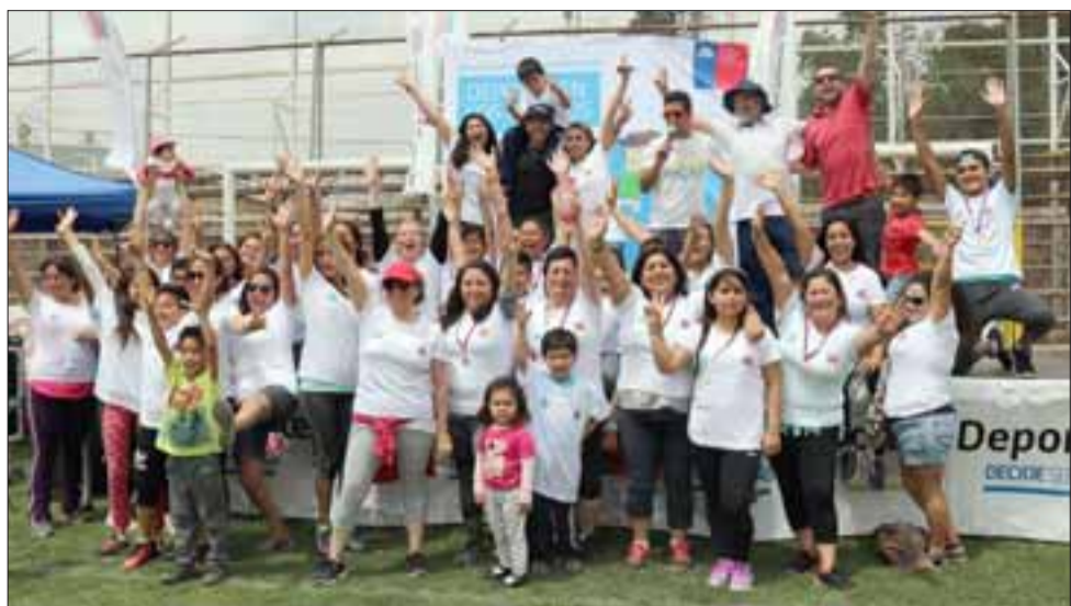
La actividad contó con una buena participación por parte de la comunidad sanfelipeña que llegó en familia al principal reducto deportivo de la comuna.

"Hemos tenido un súper buen apoyo por parte de la municipalidad con respecto a la convocatoria. Este ya es el segundo evento que hacemos durante el año con la municipalidad y el programa 'Deporte en los barrios'. La alianza que hemos generado con el municipio ha sido buena, nos han respondido de la manera que nosotros necesitamos y esperamos que