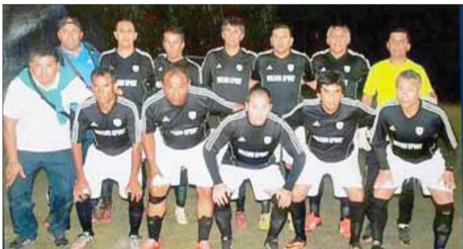
Luego de su triunfo del sábado, Panquehue tiene muchas chances de avanzar a la final del Regional Super Senior.