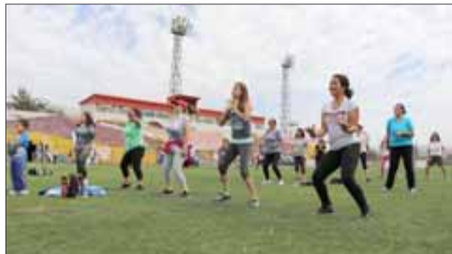
La jornada, se caracterizó por ofrecer diferentes actividades deportivo-recreativas tales como: zumba, murito de escalada, taichí, ping-pong, brisca, ajedrez, dominó, rayuela, baby fútbol y juego inflables, entre otras actividades.

tos lugares de nuestra ciudad que son completamente gratuitos durante todo el año, desde abril a noviembre".