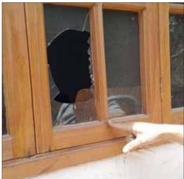
Un vidrio roto por donde ingresaron a otra dependencia de la casa a robar.

Para no creerlo, en veinte días le han entrado a robar cuatro veces , así de simple dice el dueño de la Mueblería Opazo ubicada en la avenida Maipú con Manuel de Lima en San Felipe.