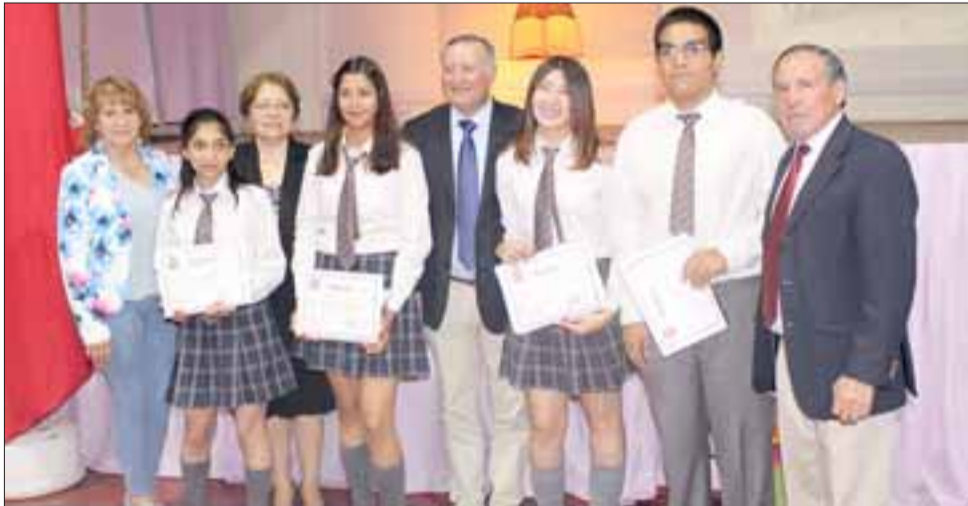
Emoción, nervios y ansiedad, fue lo que vieron los alumnos de los cuartos años medios del Colegio Panquehue, tras la realización de su tradicional licenciatura, ceremonia que acredita su egreso de la enseñanza media.

Contacto: msuazomardones@yahoo.com watsapp +56955818918