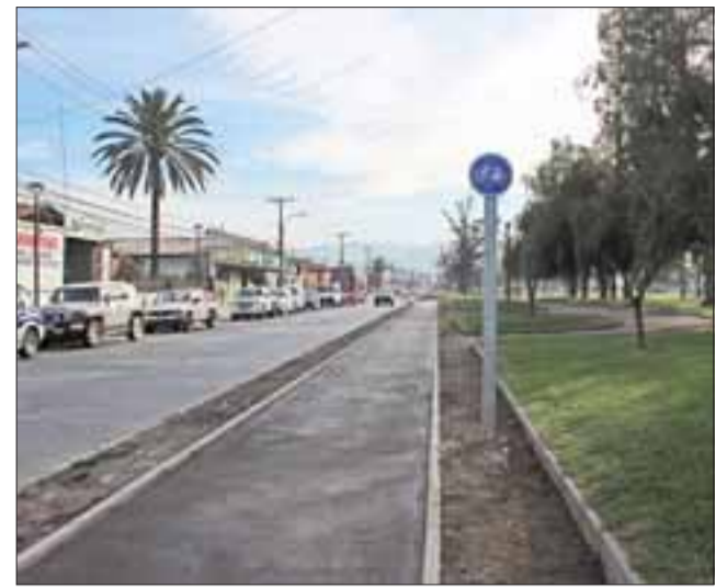
Tramo de ciclovías que corresponden a las alamedas Yungay.

El proyecto se comenzó a realizarse este año y ya cuenta con la construcción de ciclovías en la avenida Yungay, a lo que sumarán el resto de las alamedas de la comuna, contabilizando un total de 9,7 kilómetros por distintos sectores de la comuna, y que significan una inversión cuatro mil millones de pesos en su totalidad.