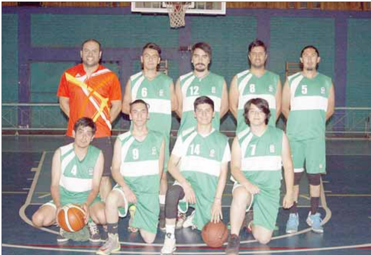
El equipo de la Universidad de Playa Ancha, aspira a estar dentro de los mejores en el torneo de básquet de educación superior.

21:00 horas, Asociación de Árbitros – Universidad de Playa Ancha