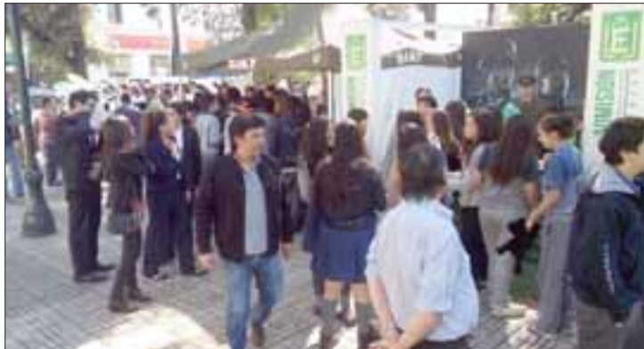
La policía uniformada, presentó la III versión de la 'Expo Carabineros Aconcagua 2016', la cual fue realizada en la Plaza de Armas de San Felipe.