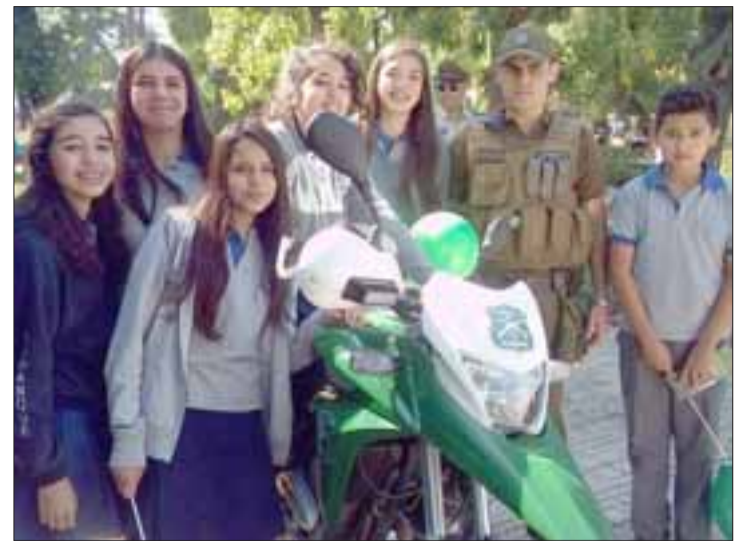
Alumnos del Colegio Pumanque, posan junto a funcionario de la policía motorizada.

Según informó la organización, la Expo Carabineros Aconcagua se realiza con el objetivo de presentar a la comunidad, detalles del trabajo que realizan las distintas secciones y especialidades de la institución, en sus labores de prevención y control del orden público.