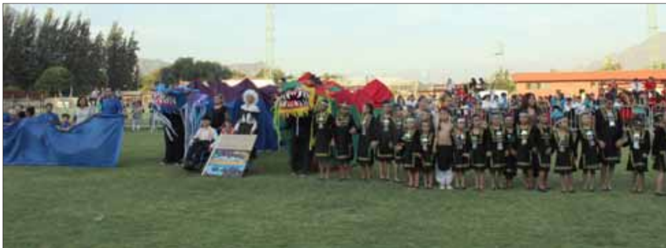
La Escuela Viña Errázuriz, basó su presentación en el mito originario de la región de Los Lagos; Trentrén-Vilu y Caicai-Vilu. Los alumnos mostraron a la separación de la Isla de Chiloé al continente, con todo aquel significado creativo en La Cosmovisión ancestral.