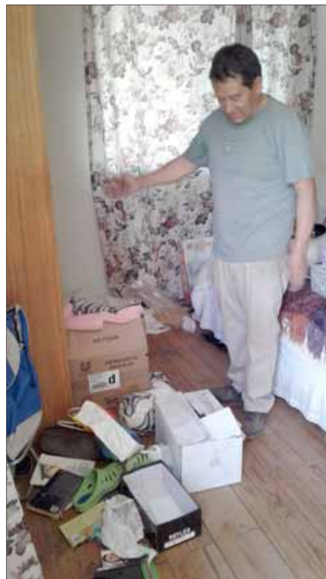
Acá nos muestra el desorden que dejaron los delincuentes al entrar a la pieza de su madre.

Recordar que durante el último fin de semana largo, detuvieron a unos sujetos cuando salían con especies.