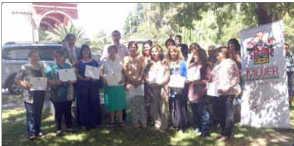
Seis grupos de mujeres, se certificaron en una actividad realizada al aire libre, donde aprovecharon de mostrar sus trabajos, incorporar en su exposición a otras instancias que componen las fuerzas vivas de la localidad.