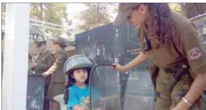
FUERZAS ESPECIALES.- Feliz se encontraba este pequeño luciendo las indumentarias de las Fuerzas Especiales.

Las nuevas patrullas Dodge Durango y Dodge Charger de la policía uniformada, se transformaron en las principales atracciones de la III versión de la 'Expo Carabineros Aconcagua 2016', que se realizó en la Plaza de Armas de San Felipe.