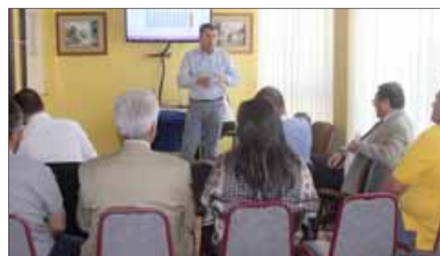
Autoridades y dirigentes abordaron las problemáticas que causan mayor afectación en la Provincia en materia de seguridad. Con especial cuidado en los locales comerciales.

dad está desarrollando y nos han detallado una serie de proyectos que permitirán aumentar la seguridad en la comuna. Yo creo que con el tiempo, de aquí al próximo año, deberíamos tener un trabajo mucho más coordinado que impida el actuar de los delincuentes durante fechas