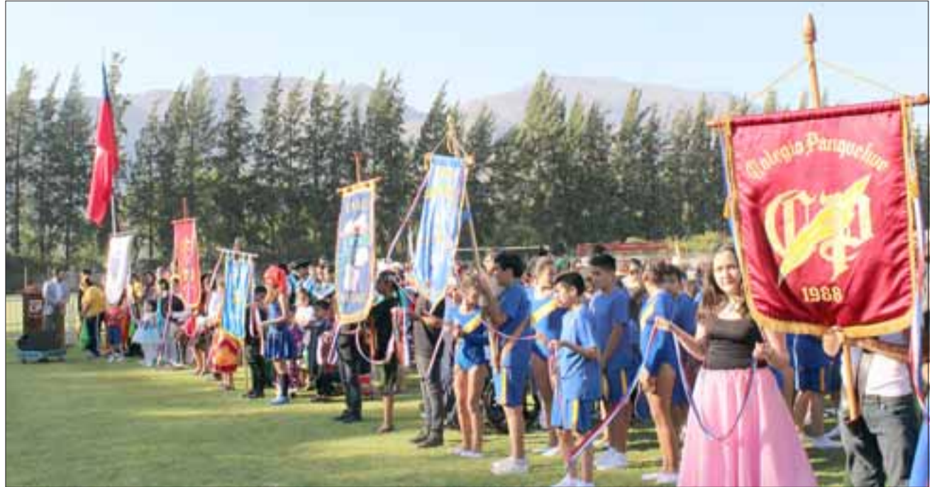
Una actividad extraescolar, fue organizada por el Daem de la comuna de Panquehue y que tuvo lugar en el estadio Los Libertadores de La Pirca.

“El pilar fundamental de nuestra sociedad es la educación, es allí donde se deben conjugar los elementos que faciliten a nuestros niños y niñas un desarrollo integral, para que cada uno sea protagonista de sus aprendizajes y un actor principal de sus logros y progresos. Debemos ofrecer siempre espacios de creación, de juego, de alegría y de una sana convivencia escolar; con ello potenciamos al ser integral y consolidamos los sellos que identifican a cada escuela y por ende a nuestra comuna. Hemos avanzado progresivamente en la consecución de logros educativos, cimentados en una política educativa pública comunal, la que siempre ha tenido como eje fundamental ofrecer las mejores oportunidades educativas a nuestros niños y jóvenes”.