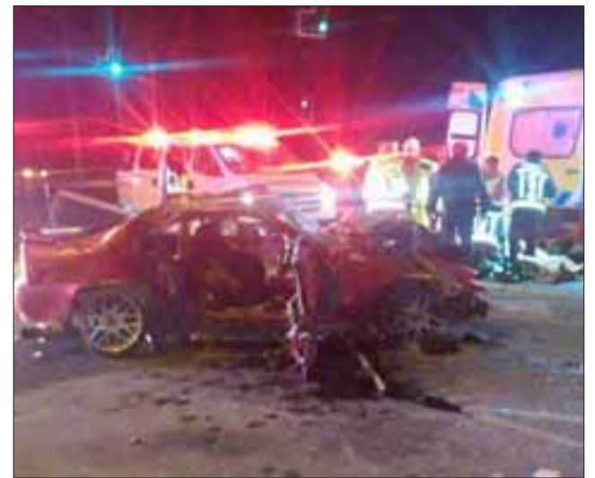
El accidente de tránsito se produjo la madrugada del pasado domingo, alrededor de las 03:10 horas, teniendo como protagonistas un vehículo Honda Prelude de color rojo y un automóvil Chevrolet Corsa.

"Es una colisión frontal entre dos vehículos, el automóvil marca Honda se desplazaba desde oriente a po-