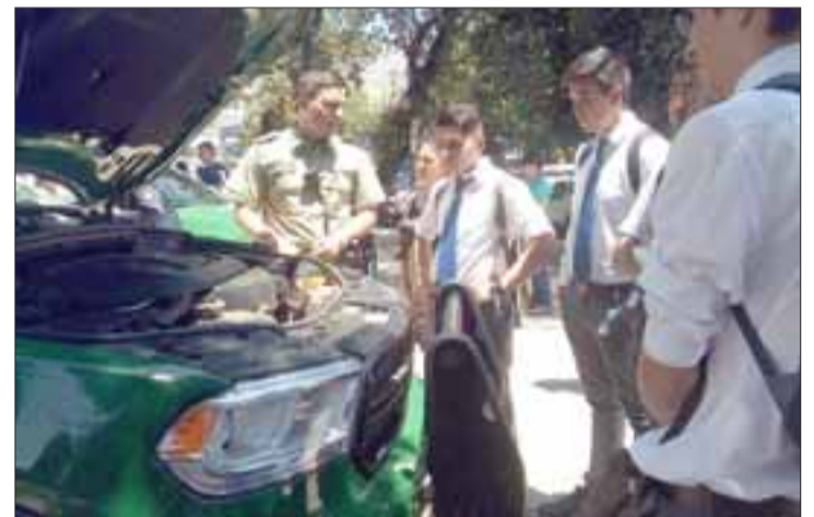
Las nuevas patrullas Dodge Durango y Dodge Charger de la policía uniformada, fueron el principal atractivo de la jornada.