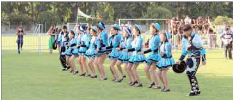
CAPORALES.- Fue un cuadro artístico melódico, que mostró la evolución de los diferentes ritmos musicales a través de la historia en las distintas culturas.

El cierre de la presentación estuvo a cargo del Colegio Panquehue, con un cuadro llamado Evolución del Ritmo y la Cultura a través del Tiempo. Trato en desarrollar en los alumnos el arte y la cultura desde una perspectiva musical, a través de la danza y la expresión rítmica, la cual ha influenciado de diferentes maneras en el quehacer de la sociedad actual, respetando la diversidad del ser humano y el cuidado del medio ambiente.