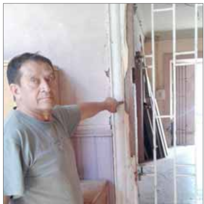
Acá nos muestra parte de los daños a una puerta que forzó.