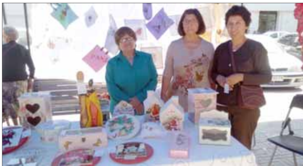
Puesto de manualidades en madera y género fabricadas por el Taller Dulce Esperanza.