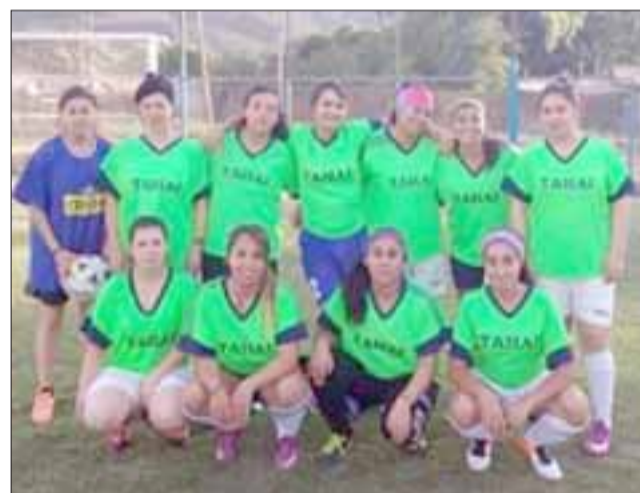
El equipo de fútbol femenino del Prat quiere ganarse su espacio en el club del marinerero.

El resultado final favoreció al Pentzke al ganar el encuentro por 5 a 0.