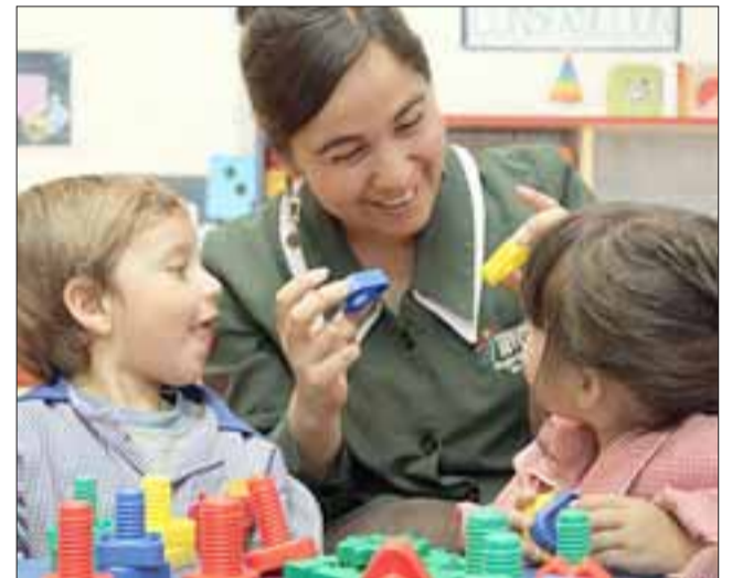
El nuevo establecimiento de educación parvularia de Integra, se encuentra ubicado en Villa Renacer otorgando cobertura a 60 nuevos lactantes y 112 párvulos de la comuna.

Para hacer efectivo el proceso de inscripción deben llevar ciertos documentos: certificado de nacimiento del niño y fotocopia del Carnet de control niño sano.