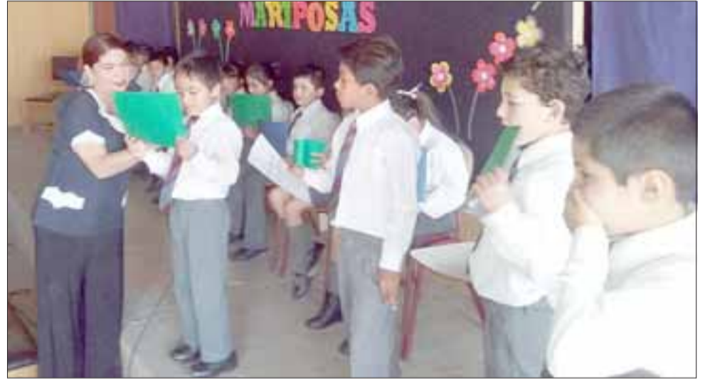
Los estudiantes de 1° año básico demuestran a sus padres lo que han aprendido durante el año, llegando así al mundo lector.