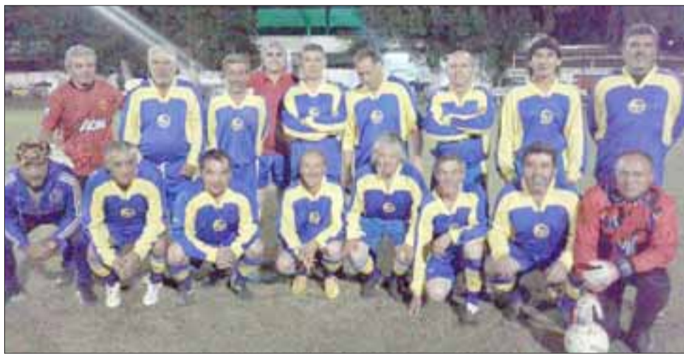
Tsunami es el nuevo puntero en los Super Senior de la Liga Vecinal.