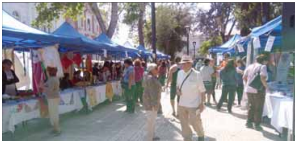
General, Masiva convocatoria tuvo la Expo Mujer 2016.