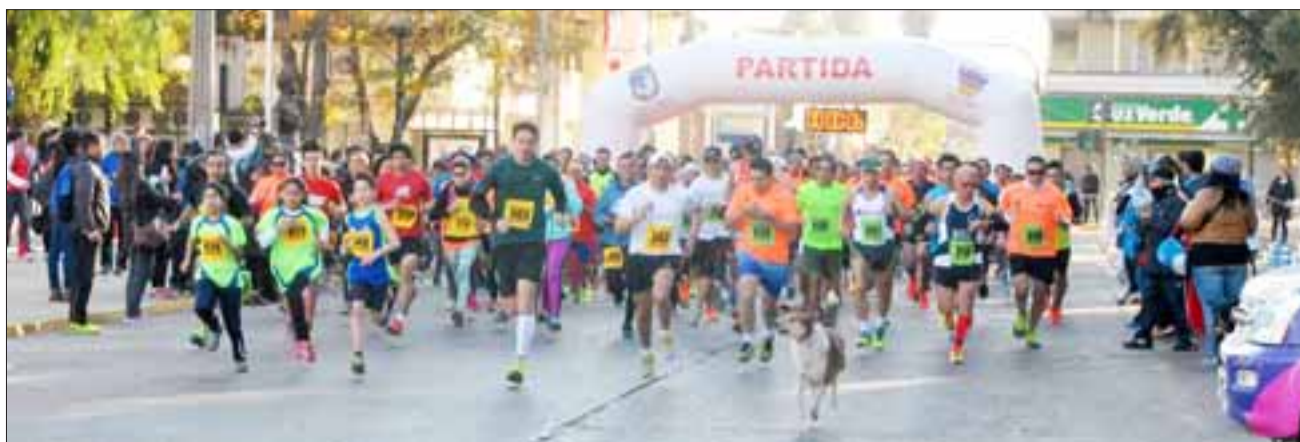
Este domingo, se realizará una nueva versión de la Corrida San Felipe 2016, la última de este año y que organiza el Departamento de Deportes del municipio, junto a la Mesa de Promoción de la Salud y el Injuv, con categorías de 1K, 3K, 6K y 9K.

“Estamos felices de poder llevar nuevamente este deporte tan entretenido y