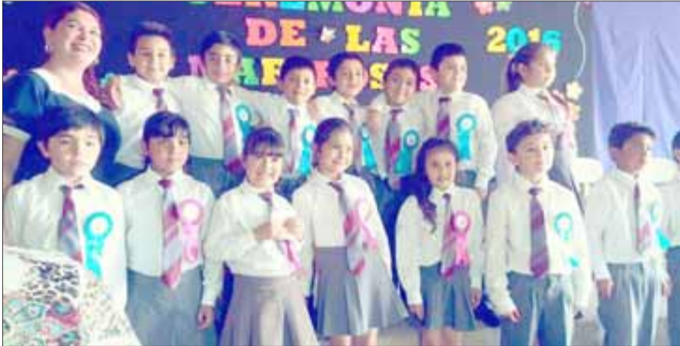
Los estudiantes, junto a su profesora prepararon esta bella sorpresa para los apoderados, que consistió en la lectura de un cuento Ya Somos Mariposas de autoría de su profesora, un discurso y canción de agradecimiento de los niños a sus padres.

Tuvo tal éxito esta ceremonia, que será parte de las tradiciones de ésta Escuela desde ahora en adelante.