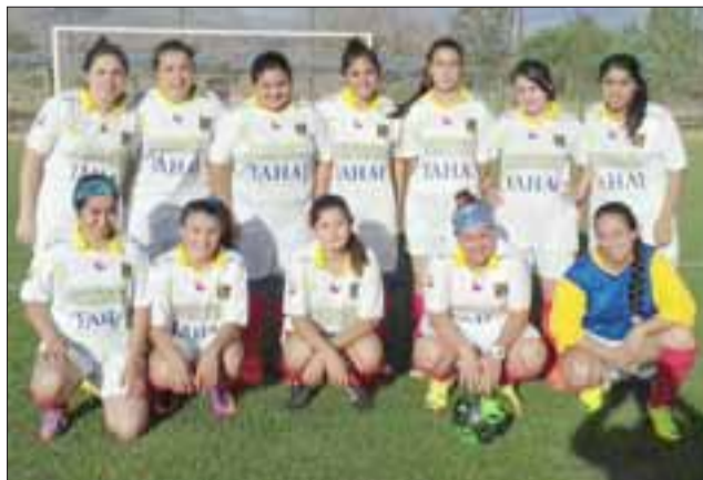
A lo grande, el conjunto femenino del Pentzke hizo su estreno en sociedad.

fue entretenido y se caracterizó por las ganas y el entusiasmo que pusieron las jugadoras de ambos equipos, dejando muy claro que, en San Felipe el llamado 'Deporte Rey' ya no es exclusividad de los hombres.