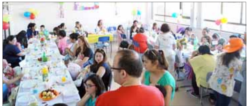
En el marco del día internacional del bebé prematuro, el del Hospital San Camilo, organizó una actividad para celebrar a los menores hospitalizados con esta condición.