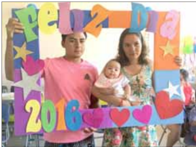
Padres de un pequeño prematuro, posan en este divertido y colorido marco.

en estado prematuro y entre 30 y 50 en estado de prematuridad extrema, es decir de menos de 32 semanas y/o 1500 gramos, lo que significa que requieren un tratamiento adecuado y un estricto seguimiento médico.