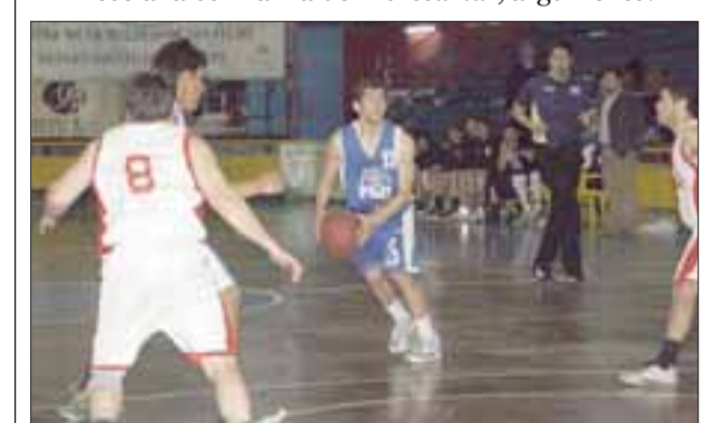
El Prat depende del resultado del partido de mañana ante Liceo Curicó para avanzar a la postemporada.

meterse en los Play Offs , el estratega igual se muestra inquieto por una situación extraña que está pasando en la Libcentro Pro A. "Hay un tema particular y ese es que Sportiva tiene un partido pendiente con Stadio Italiano y no lo han jugado a pesar que la liga varias veces les ha pedido que lo jueguen pero aún no sucede eso. El problema está en que si no se juega el partido se le dará a Stadio por 20 a 0, lo que sería un descriptorio porque ellos (Stadio) están peleando por clasificar", explica mientras que al mismo tiempo prefiere no pensar en cosas extrañas. "No digo que haya algo raro, si es claro que deportivamente sería muy injusto que el partido se le diera a Stadio, porque los partidos hay que jugarlos en cancha y no ganarlos por secretaría", argumentó.