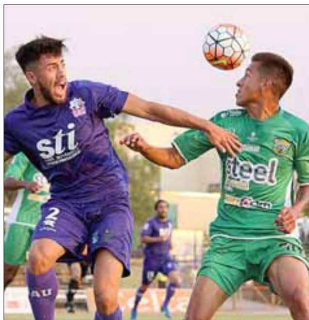
Los andinos enfrentaran el sábado como forasteros a Deportes Santa Cruz.

17:00 horas, Independiente de Cauquenes - Barnechea