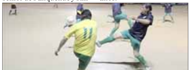
Mañana se conocerá si Rinconada y Panquehue clasifican a la gran final del Regional Súper Senior.