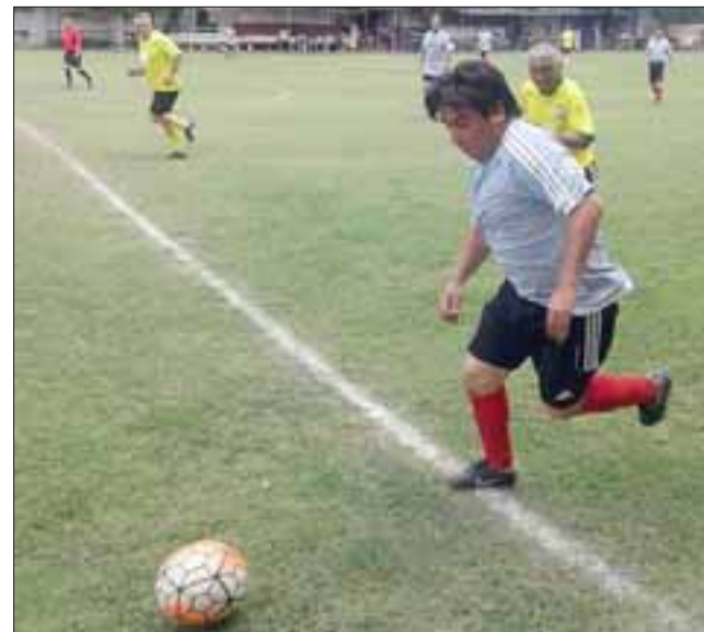
Enfrentamientos de fuerzas muy parejas se vivirán el domingo en la cancha Parrasía.

Complejo Cesar: Deportivo GL – Los del Valle; Casanet – Derby 2000; 3º de Línea – Estrella Verde; Bancarios – Fénix; Grupo Futbolistas – Magisterio.