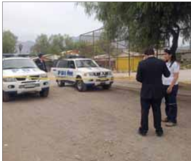
A un costado de la multicancha de la Villa La Escuadra se produjo exactamente el crimen el 24 de noviembre de 2014.

Trabajo que el asesino de su hijo, pagará sólo tres años y un día por el crimen de su hijo, pese a los incesantes esfuerzos ante la PDI y en la Fiscalía en su colaboración y entrega de informaciones relevantes para el esclarecimiento del crimen, a fin de obtener una condena que podría haber sido sentenciada por parte de los tribunales de juicio oral, a la pena de 15 años privado de libertad, considerando que ya la Fiscalía mantenía en su carpeta investigativa la prueba documental, relato de testigos e inclusive de don Jorge Gatica, declaraciones policiales y médico forense del Servicio Médico Legal, entre otros, para ser elevados en el Tribunal Oral en Lo Penal de San Felipe.