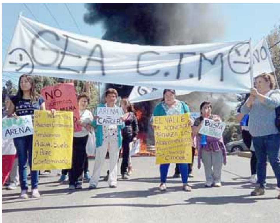
Los vecinos en el medio del puente protestando con lienzos, donde se podían apreciar lecturas contrarias a GEA.

Finalmente y luego de más de una hora de protestas, los vecinos, luego de dialogar con Carabineros, se retiraron del lugar, sin registrarse personas detenidas.