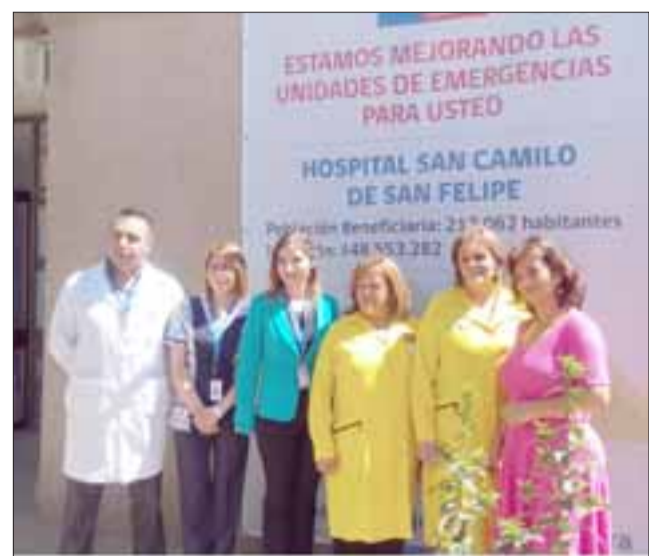
Directoras del Servicio de Salud Aconcagua y del Hospital San Camilo, junto a profesionales del Servicio de Urgencias de este recinto, visitaron las obras de mejoramiento que se realizan en la unidad.

Según lo informado por Yáñez, el servicio de Urgencias del HSC, atiende diariamente a unas 200 personas y el mejoramiento de la infraestructura está acompañado de un contingente adecuado para esa cantidad de pacientes,