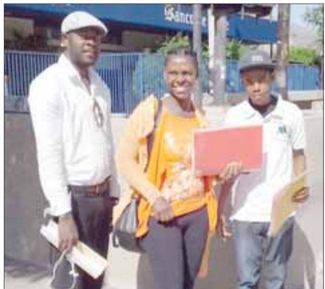
Tres ciudadanos haitianos durante la realización de trámites en San Felipe.

Sobre los contratos falso dice no estar al tanto de la situación, pero conoció de cerca una historia de una amiga que le paso algo similar pero no tiene mayores antecedentes, pero de todas maneras dice estar muy bien acá porque los sanfelipeños los han tratado bien no han tenido problemas.