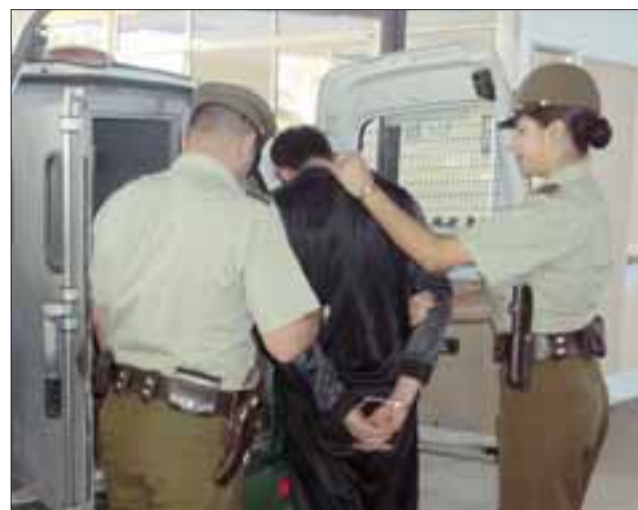
Los detenidos fueron puestos a disposición de la Fiscalía de San Felipe para la investigación del caso.

Imputado quedó a disposición de la Fiscalía: