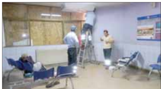
La instalación de aire acondicionado, será uno de los primeros trabajos en estar terminado, a ello se suma el mejoramiento de baños, instalación eléctrica y pintura, cambio de butacas e instalación de cámaras de seguridad en la Sala de Espera del Servicio de Urgencias del HSC.

Mejoramiento de baños, instalaciones eléctricas y pintura, instalación de aire acondicionado, cambio de butacas, nuevos sistemas de seguridad informáticos de televigilancia,