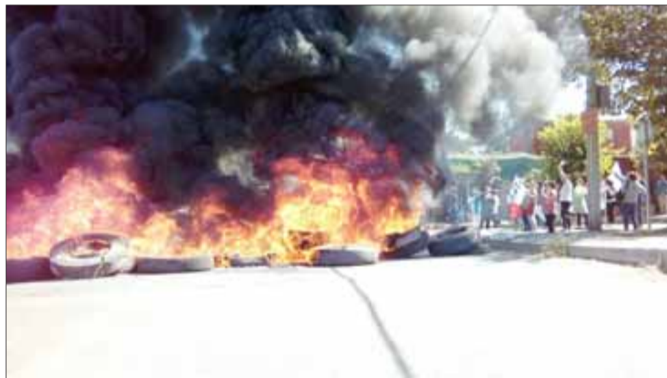
En las imágenes superior e inferior se puede apreciar el bloqueo de la calle a través de la quema de neumáticos.