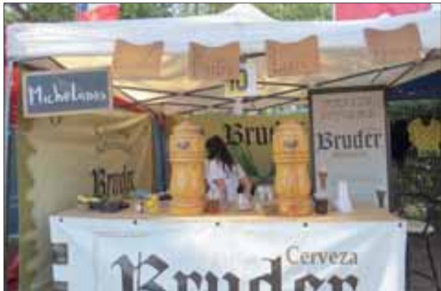
CHELITAS.- Diversos tipos de cerveza de exponentes zonales, fueron presentados en la feria, donde vecinos de todos los sectores de la comuna pudieron disfrutar de los distintos tipos de ingredientes, de este succulento brebaje.