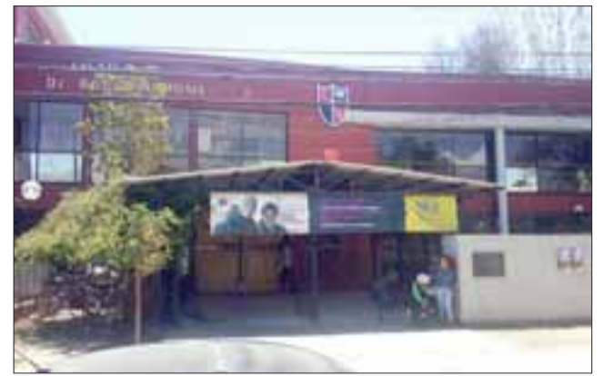
Nuevamente este año, son cuatro los establecimientos habilitados en la comuna de San Felipe, y que corresponden a los liceos Roberto Humeres, Corina Urbina y las escuelas José de San Martín y Pedro Nolasco Molina, este último ubicado en el CCP.

“El proceso está compuesto por tres etapas, el primero comienza este día domingo con el tradicional reconocimiento de salas, el que se efectuará de 17:00 a 19:00 horas, para posteriormente, el día lunes 28 de noviembre, los postulantes comiencen con su prueba de lenguaje a partir de las 9:00 de la mañana, y en la tarde, a las 14:00 rendir su prueba de ciencias. El día martes se