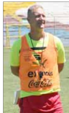
Durante cuatro partidos el técnico no podrá sentarse en el banco del Uní Uní...

lidades para reemplazarlo mientras el coach trasandino cumpla con el castigo que el Tribunal del Fútbol chileno le aplicó en su última sesión correspondiente a esta semana.