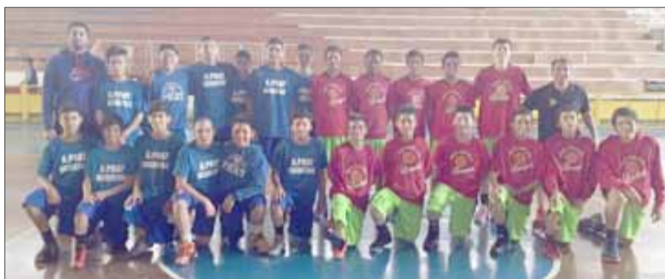
Las promesas del Prat y San Felipe Basket fueron anfitriones de una nueva edición de la Copa Juan Arancibia.

A partir de las once y media de la mañana, en las distintas canchas de San