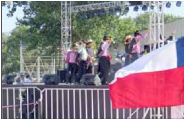
Los bailes típicos, fueron uno de los espectáculos más atractivos del Carnaval Andino.

LLAY LLAY.- Dos coloridas actividades engalanaron la ciudad del Viento Viento. El panorama fiestero, entregó oportunidad a locales y visitantes, de disfrutar de la tradicional Fiesta Costumbrista y del Carnaval Andino, efectuadas conjuntamente en el Estadio Municipal.