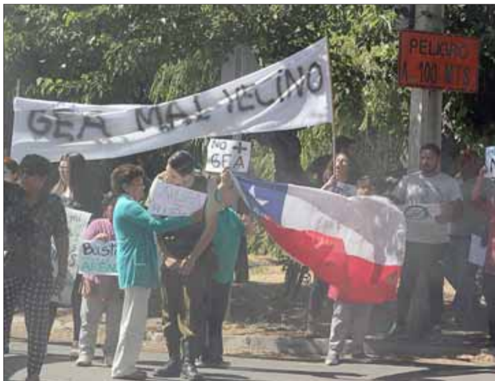
Una de las dirigentes conversa con Carabineros durante la protesta. (Foto gentileza Pedro Muñoz).