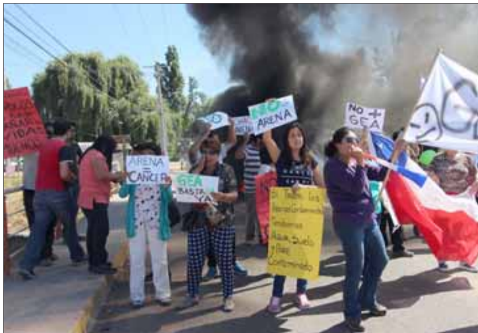
Los vecinos muestran los carteles con leyendas alusivas a los daños que pueden ocasionar la arena contaminada. (Foto gentileza Pedro Muñoz).