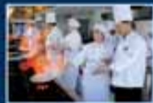
Taller de Gastronomía