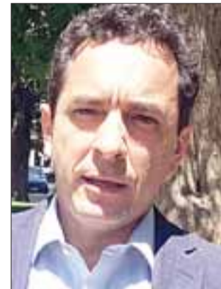
Diputado Marco Antonio Núñez.

No hay ningún argumento importante para oponerse a una iniciativa de esta naturaleza. He recibido a dirigentes de Agua Potable Rural, APR, de Aconcagua, quienes me han expresado su respaldo por la votación que hice junto a otros diputados para su aprobación. Como otras veces, espero que no se recurra a diferentes instancias para aplazar una ini-