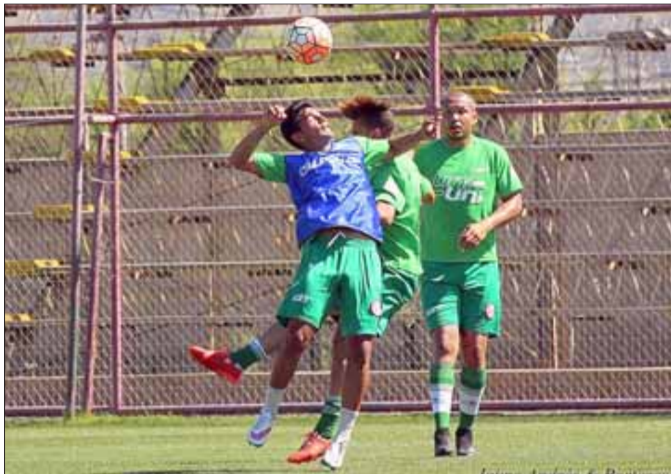
A los sanfelipeños, solo les sirve ganar esta noche el pleito que se jugará en el Municipal.

El partido corresponde a la fecha número 13 y está programado para las 20:30 en el estadio Municipal de San Felipe, bajo la conducción del juez Nicolás Gamboa.