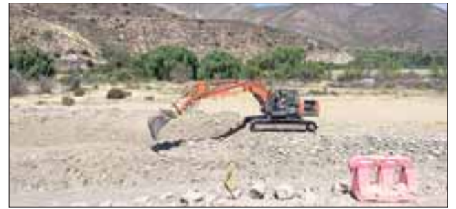
Junto a la empresa de 'Centenario Seguridad', la autoridad comunal conoció el avance de las obras, a cargo de la empresa OHL.

Pude apreciar que todo se ve bastante bien, hay mucho movimiento de obras y por lo mismo me siento feliz con la realización de este proyecto, donde asimismo se ve bastante mano de obra y tras conversar con los ejecutivos de la empresa OHL, el proyecto está dentro de los plazos que tiene fijado el estado a