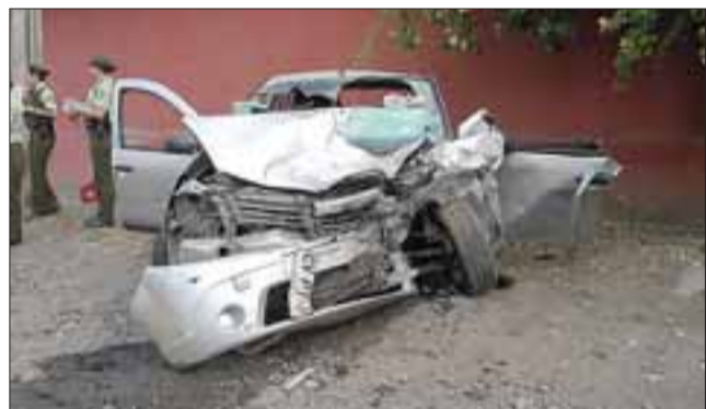
El conductor de este automóvil Renault Sandero habría causado el accidente al conducir en estado de ebriedad.

esas condiciones traspasó el eje central de la calzada. Fue un impacto de alta energía y afortunadamente no hubo víctimas fatales, todos fueron derivados a los servicios de urgencia de los hospitales de Los Andes y San Felipe, donde fueron atendidos."