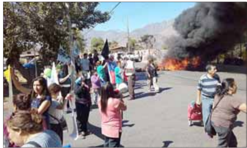
El jueves recién pasado la comunidad organizada se manifestó contra el cuestionado proyecto.

Y a más de 115 Km de distancia. Los ciudadanos de San Felipe, toda la opinión pública, exige una explicación a este atentado contra los derechos humanos de su población y contra una de las provincias de más preclaro renombre en la historia de la patria.