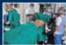
Pabellones de Práctica