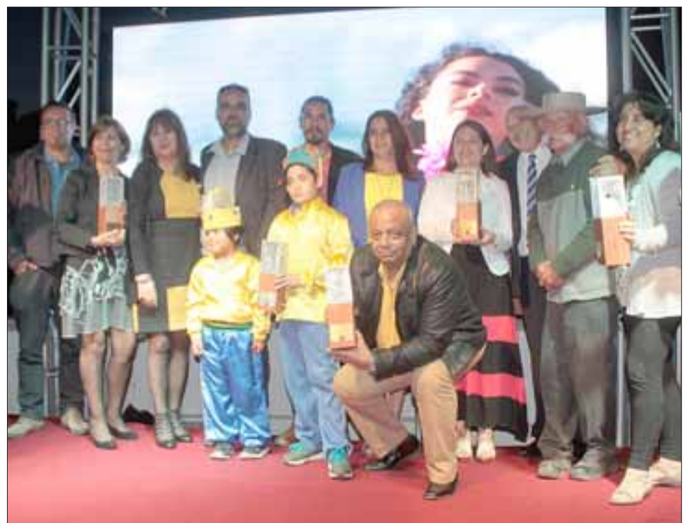
LOS MEJORES.- En esta gráfica vemos a varios de los premiados con Arte y Cultura 2016 otorgados por el Consejo de la Cultura y las Artes Región Valparaíso.