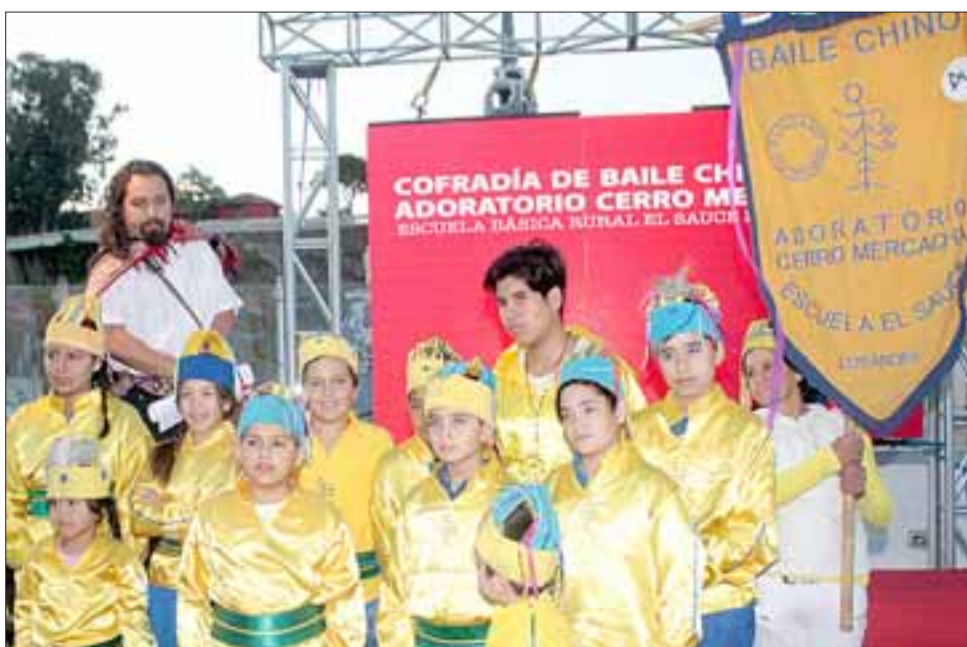
BAILES CHINOS.- La Cofradía de Baile Chino Adoratorio Cerro Mercacha, de la comuna de Los Andes, recibió su galardón en la categoría 'Actividad cultural de participación ciudadana'.