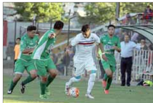
En la primera fecha de la fase nacional del campeonato el equipo andino fue goleado por Santa Cruz'. (Foto: ANFP).

Lota Schawager 2- La Pintana 0; San Antonio 2 - Naval 1; Melipilla 0 - Malleco 0; Vallenar 1 - Colchagua 1; santa Cruz 5 - Trasandino 1