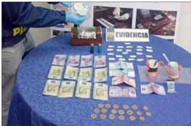
Efectivos de la PDI incautaron la pasta base, municiones y dinero en efectivo desde el domicilio de una mujer de nacionalidad peruana en la comuna de Llay Llay.