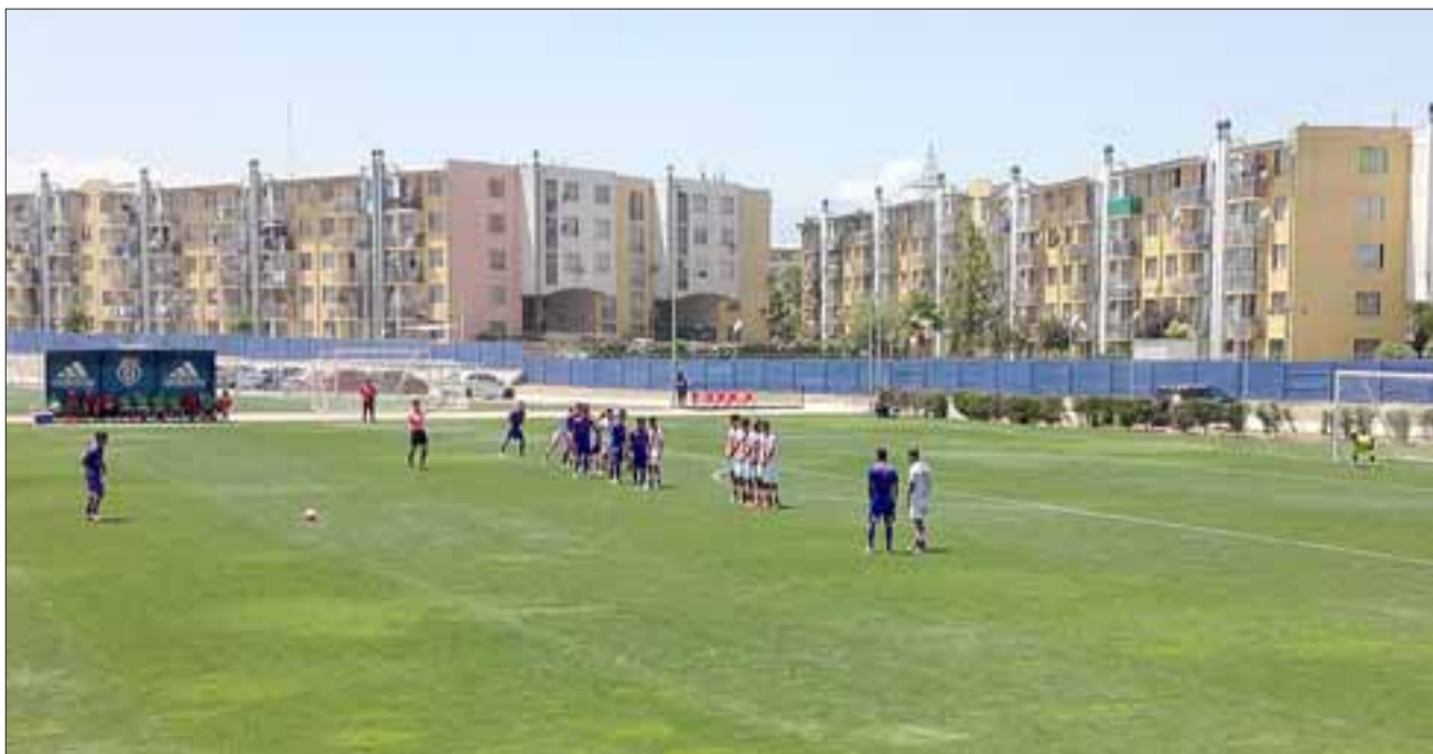
El partido entre la U y el Uní se disputó el sábado en el Centro Deportivo Azul.

bió correr con mayor suerte porque desperdició dos clarísimas oportunidades de gol, que más tarde pagaría muy caro, debido a que los universitarios sin ser más en lo futbolístico, si fueron muy certeros a la hora de convertir, eso y de manera muy simple explica la derrota de los sanfelipeños, que con este resultado fueron eliminados de la postemporada del certamen que reúne a la promesas del balompié rentado nacional.