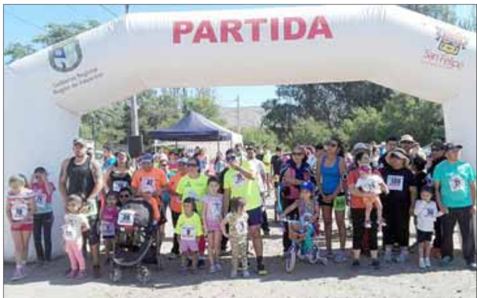
PREPARADOS, LISTOS, FUERA.- En el inicio de la corrida, familias completas se agolpaban para participar del evento deportivo.

parece que es lo más indicado, sobre todo a los chiquititos que hay que inculcarle el hábito del ejercicio. Participamos el año pasado, todavía no estaba la guagua, pero participamos los tres, iba la grande en coche y ahora a ella le tocó correr. Mi mensaje es que da lo mismo si uno llega primero o último lo importante es participar y los hábitos y yo que no los tuve, me interesa que mis hijas los tengan”, señaló esta entusiasta vecina.