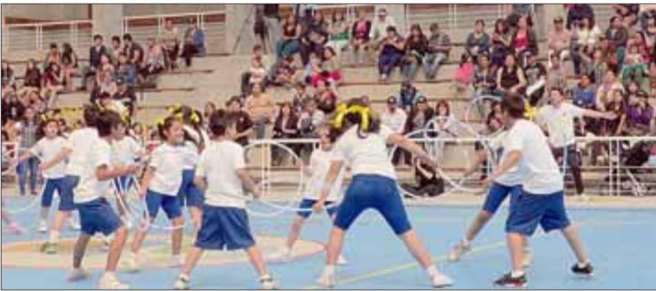
En la actividad participaron las 10 escuelas y el Liceo Politécnico B15, donde se destacaron las principales habilidades deportivas, artísticas y culturales de niños y jóvenes.