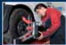
Taller de Mecánica