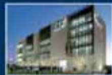
AIEP San Joaquín