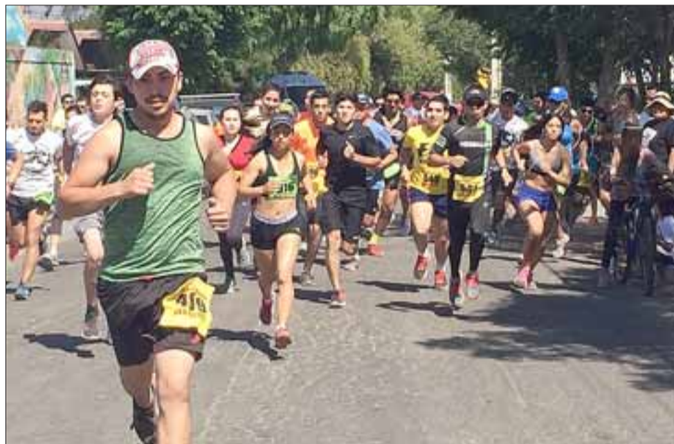
CORRELE.- Grandes y chicos, pudieron disfrutar de la sana actividad coordinada por el municipio a través de la Mesa de Promoción de la Salud.

Luego que llegaron los competidores del 1K partieron los 3K, también con decenas de participantes, quienes cronometraron unos 10 minutos, para luego dar la partida a los 6K y 9K, con un recorrido que permitió apreciar hermosos paisajes de la comuna de San Felipe.