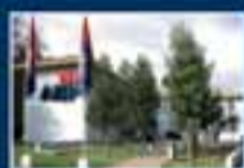
AIEP San Felipe