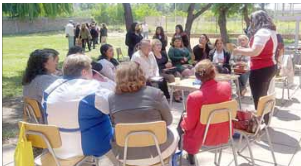
Unas 60 mujeres de todo el Valle y de distintas edades participaron del último conversatorio de salud del año 2016.

Respecto de los objetivos trazados a través de esta iniciativa, la personera agregó que «la idea era generar espacios de participación ciudadana, de diálogo, en relación a las temáticas que nos aquejan a nosotras las mujeres (...) desde temas de salud como la sexualidad, VIH, ITS (Infecciones de Transmisión Sexual); el tema de la integración social también de la mujer en el mundo, derechos huma-