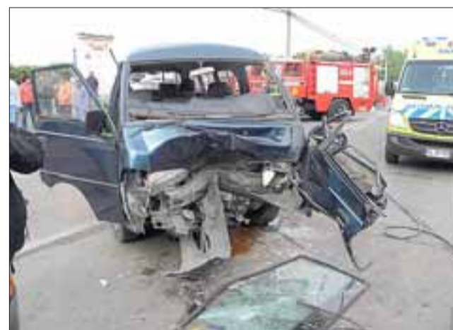
El Furgón Kia transportaba catorce trabajadores temporeros hacia una empresa agrícola del sector.

El Mayor Soto dijo que "trabajó la SIAT en el sitio del suceso y como probable causa basal del accidente, según los antecedentes, indicarían que el conductor del vehículo menor lo hacía bajo los efectos del alcohol y en