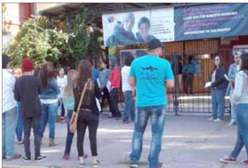
Los jóvenes la mañana de este lunes frente al liceo de Hombres esperando ingresar.

Los lugares de la rendición son el Liceo de Hombres Roberto Humeres, Es-