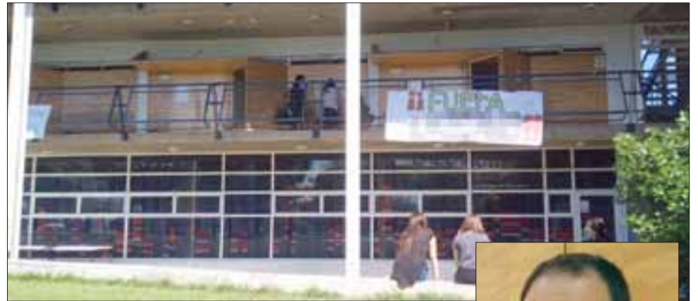
En el patio central del campus San Felipe de la Upla, pancartas piden la salida del docente.

Respecto del momento en que comienza a realizarse la investigación contra el docente, Ibáñez confirmó que ésta se inició antes de la 'funa' de la semana pasada y detalló que "había una investigación que se estaba llevando a cabo y lo que