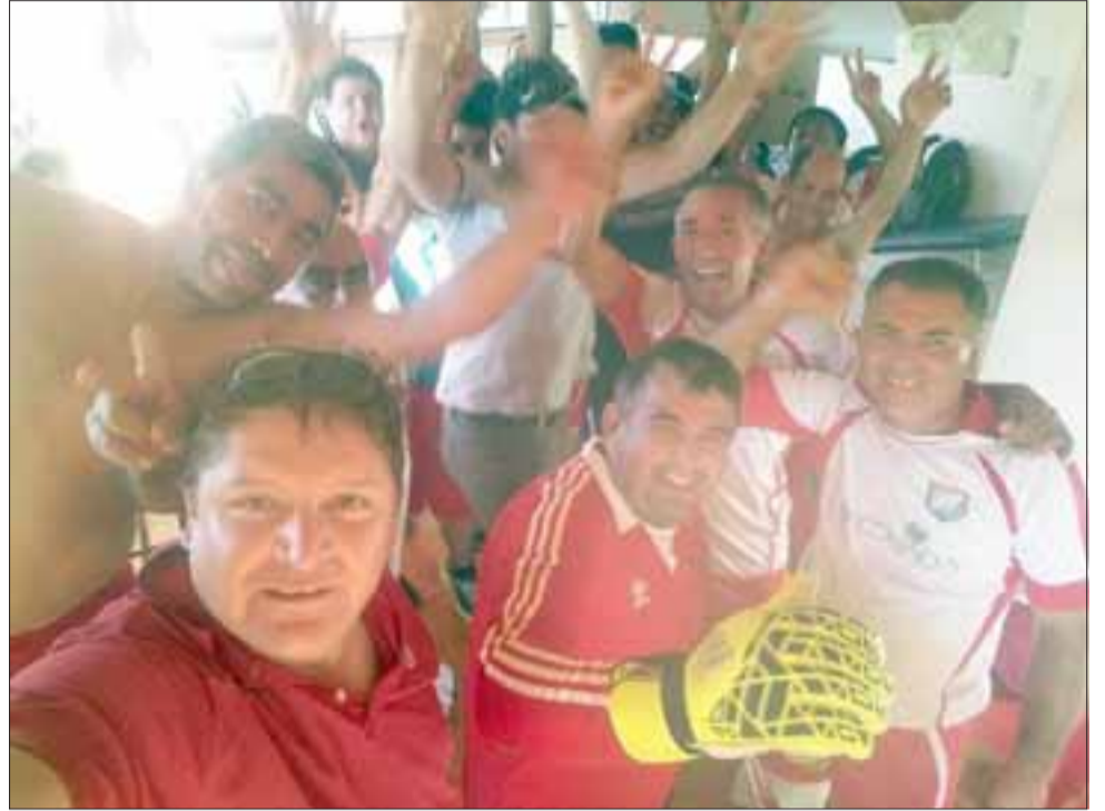
Tras la definición desde los doce pasos la selección de Rinconada dio rienda suelta a su alegría por haber clasificado a la gran final regional Super Senior.

Con esto, Rinconada de Los Andes y Unión Peñablanca, se convirtieron en los finalistas del campeonato, dejando con las ganas a