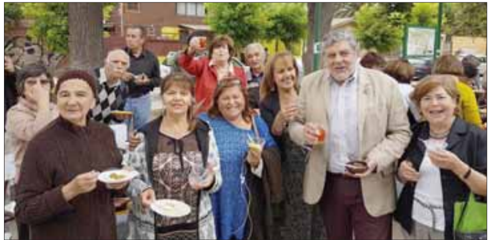
Todas estas delicias fueron ofrecidas en la degustación de la Muestra Gastronómica preparada por las representantes. La actividad se realizó en un ambiente cálido y familiar, en la sede de la Junta de Vecinos de población Morande.