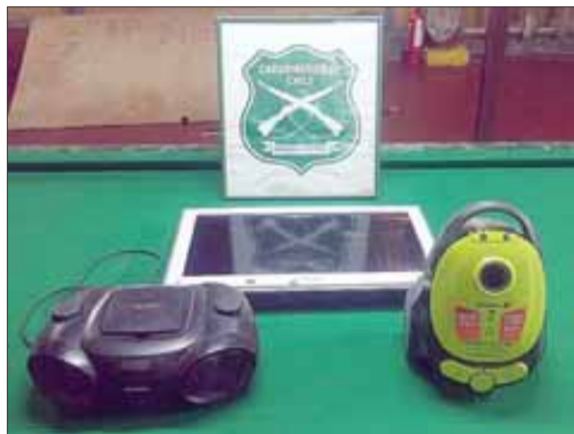
Carabineros logró a recuperación de los electrodomésticos pertenecientes a una vivienda de la población Los Copihues de Llay Llay.

formalizado por la Fiscalía por los delitos de robo en lugar habitado y daños.