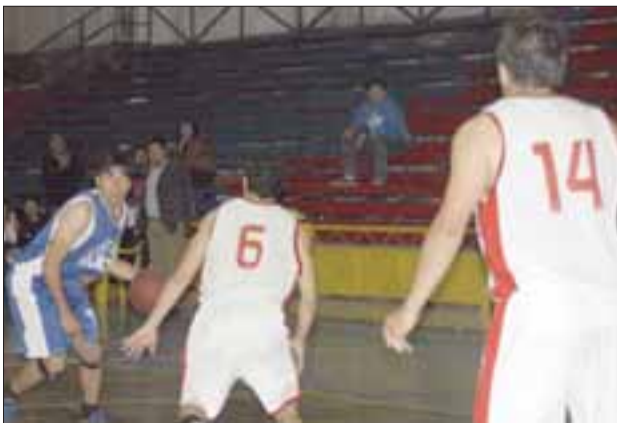
El Prat ya aseguró su participación en un repechaje para optar llegar a los Play Offs de la Libcentro Pro A.

Por ahora ya están en postemporada Municipal Santiago en la zona A y Sportiva Italiana y Sergio Ceppi en la B.