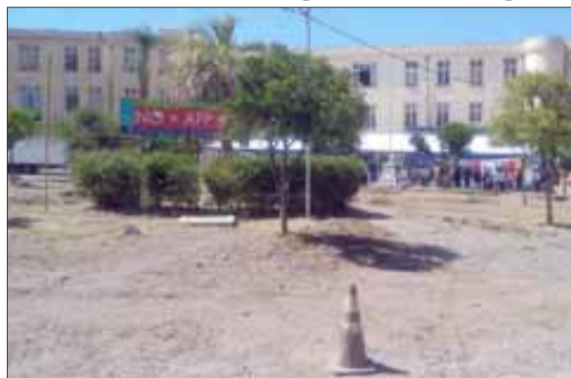
Más de 21 mil millones de pesos se invertirán en remodelar las cuatro alas del Establecimiento de Salud Mental, en la comuna de Putaendo.