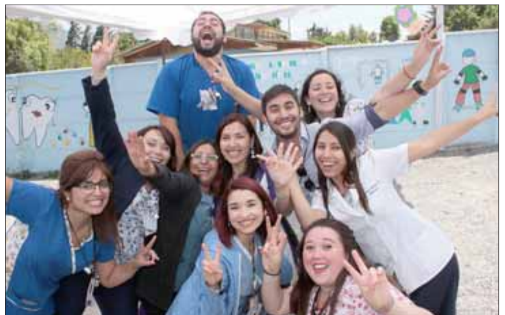
DE ANIVERSARIO.- Así de felices estaban los funcionarios del Cecosf, pues ya son seis años de atender a sus usuarios en este sector de la comuna.