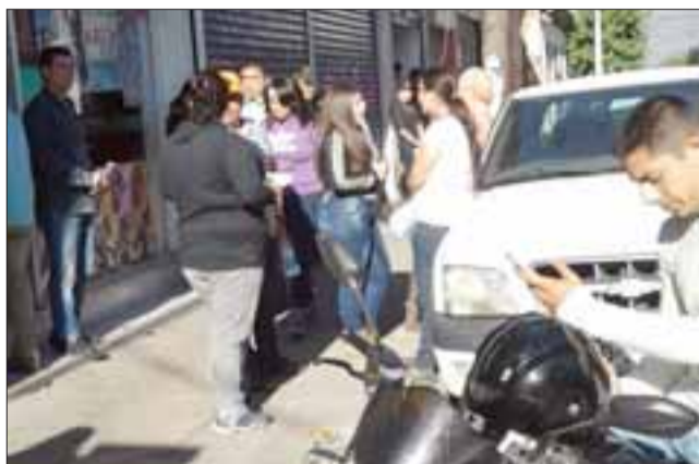
Otro grupo de estudiantes esperando ingresar al Roberto Humeres.

cuela E-62, Liceo de Niñas Corina Urbina.