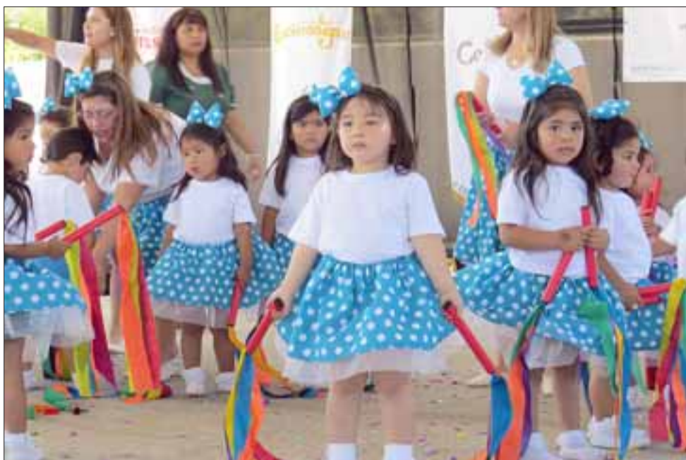
Cada jardín infantil presentó su mascota representativa, y un cuadro ejecutado por equipos compuestos por las 'tías' y niños.