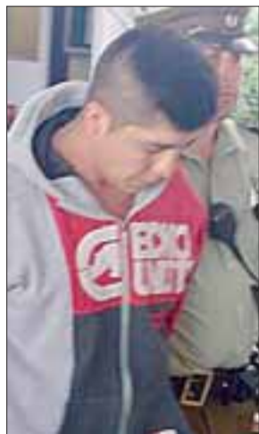
El imputado de 23 años de edad, fue detenido por Carabineros por el delito de robo al interior de la Capilla San Pedro Nolasco de San Felipe.

El imputado fue detenido en plena flagrancia por la policía uniformada en el templo ubicado en la Villa San Camilo de San Felipe.