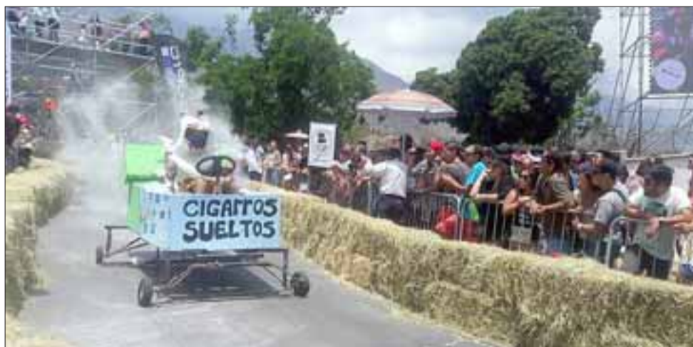
DE REMATE.- Así de locos están estos chicos, pero ni los problemas hidráulicos y ni técnicos evitaron que vivieran su gran momento.

Aunque no les fue tan bien en el puntaje, «tuvimos tres problemas técnicos, el audio nos los cambiaron, debimos improvisar con nuestro show, después nuestro carro loco se trabó en la salida y finalmente nos quedamos en pana unos segundos en una poza de agua, pero eso no nos impidió que lo pasáramos bien, fue un ambiente de mucha cordialidad y entre todos, Teams o no, nos ayudábamos mucho», agregó la joven aventurera.