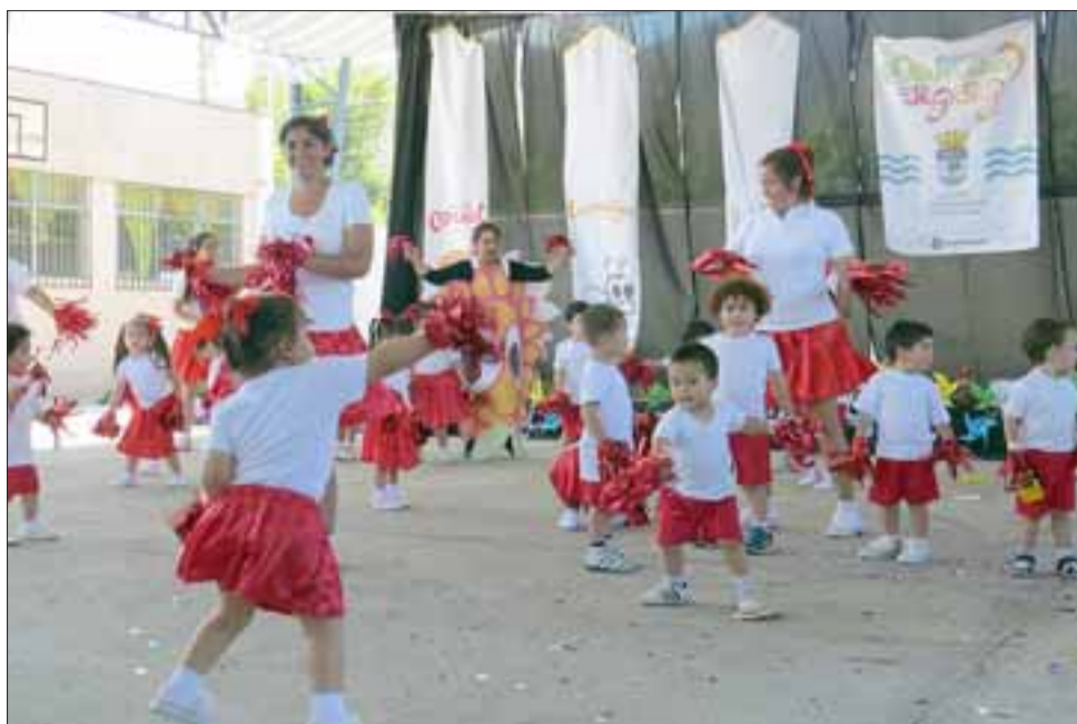
Los números artísticos fueron integrales, con coordinación motriz, e incorporación de disciplinas como la danza y el teatro.