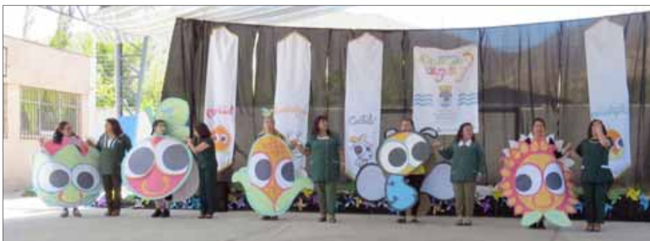
Cultivar la vida sana a través de la práctica del Deporte, es el objetivo de la 'Peque Olimpiada' de los jardines infantiles VTF de Llay Llay.