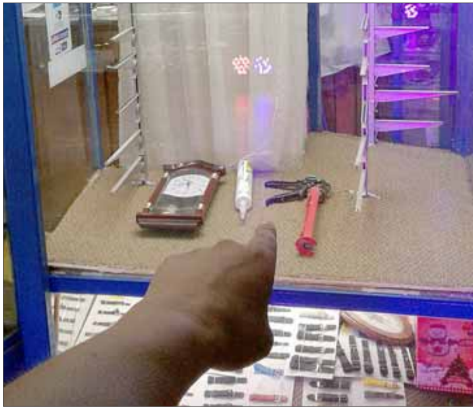
Desde esta vitrina ya reparada los delincuentes robaron los relojes más caros.

pal, los delincuentes venían solamente a robar a esa joyería porque había un vehículo esperando afuera por calle Traslaviña.