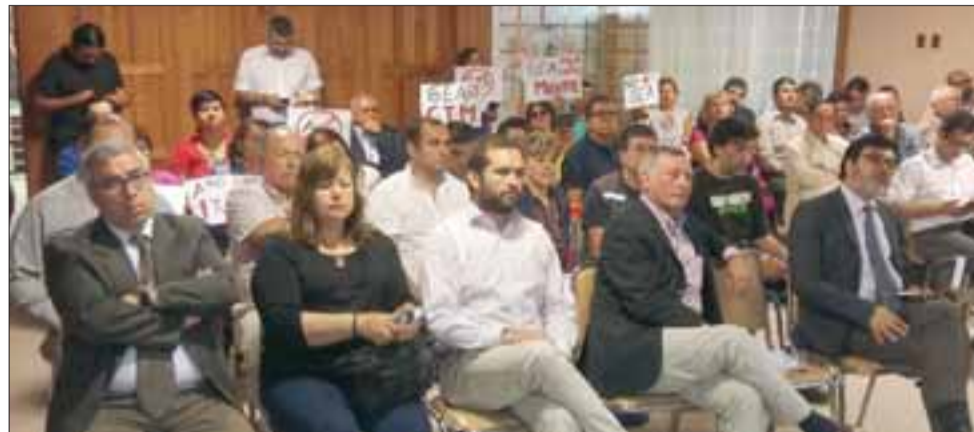
Vecinos, dirigentes y alcaldes de distintas comunas del Valle de Aconcagua, junto a autoridades regionales, participaron en Sesión de Comisión medioambiental del Gobierno Regional de Valparaíso.

Como ya es sabido, una vez que la información se