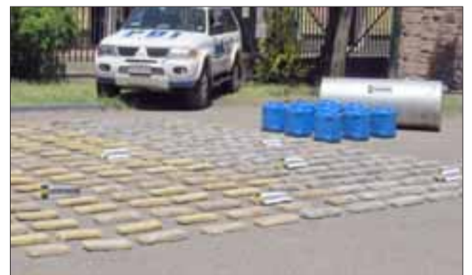
EVIDENCIA.- Briant de la PDI de Los Andes, logró desarticular una banda de narcos compuesta por seis bolivianos y un chileno, logrando incautar más de mil kilos de marihuana y cocaína en estado líquido.

Comentó que la droga era traída desde Bolivia hasta la ciudad de Iquique donde era acopiada para luego ser envia-