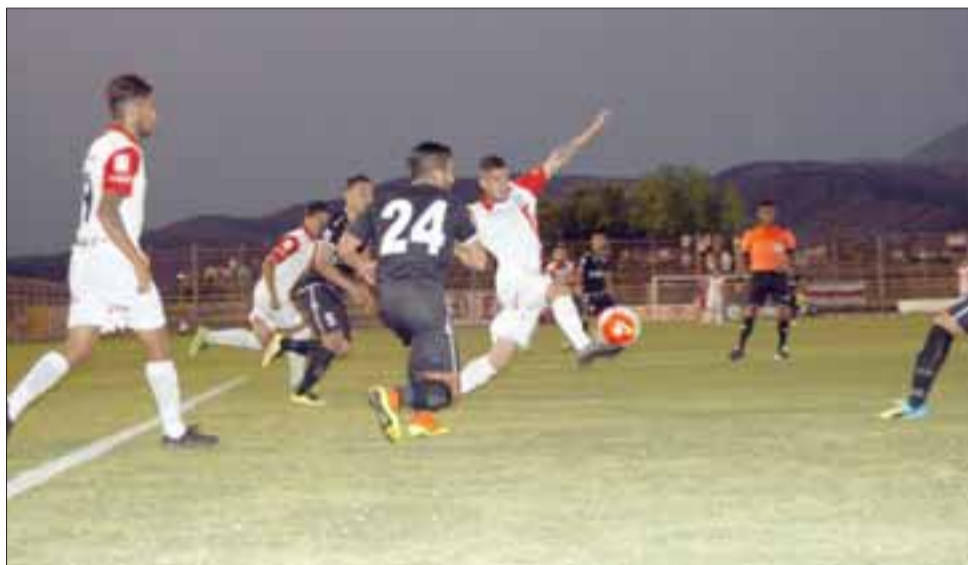
Sanfelipeños y bohemios empataron a un tanto la noche del lunes.