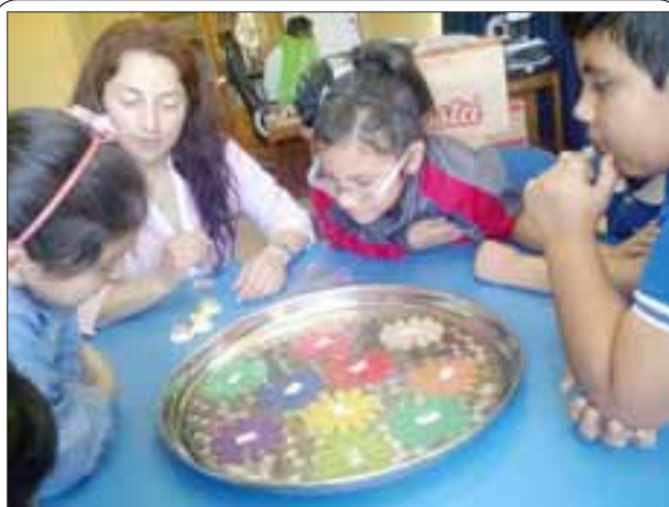
El programa Habilidades para la Vida uno , está dirigido a alumnos del primer ciclo, de primer a tercer año básico, a su entorno familiar directo y el equipo docente de establecimientos educacionales municipales con altos índices de vulnerabilidad.