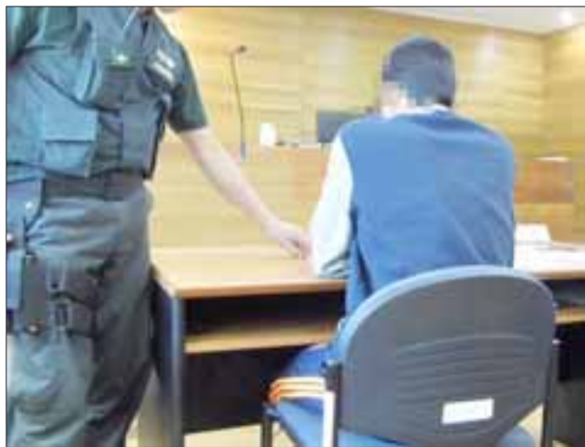
El estudiante de 16 años, identificado como F.L.R.L. fue formalizado por el delito de receptación de especies, fijándose una nueva audiencia para discutir medidas cautelares o explorar una salida alternativa al procedimiento.

eventual participación en el atraco que sufrió el trabajador.