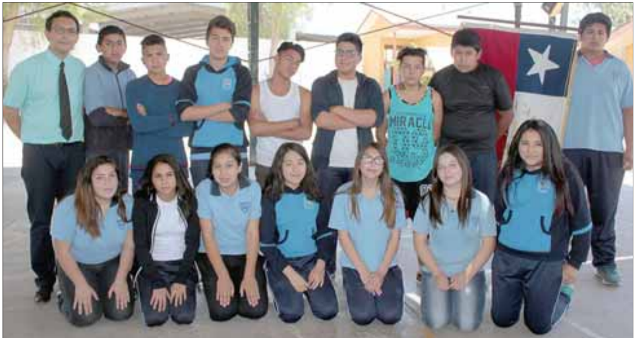
ADIÓS CHICOS.- Son 17 los estudiantes de octavo básico que mañana jueves terminan sus estudios.