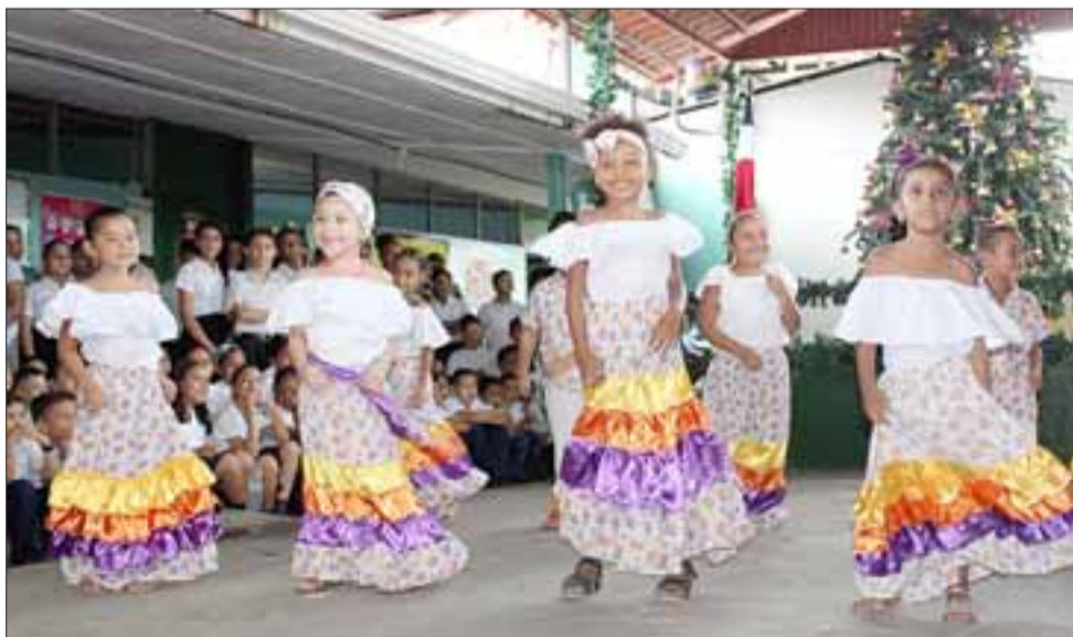
LO MEJOR DE LIMÓN ES SU GENTE.- Los pequeñitos limonenses ofrecieron con alegría el mejor de sus bailes al equipo de Diario El Trabajo de visita en Costa Rica.