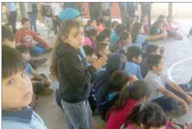
AÚN LES FALTA.- Aquí quedan los más chicos, llenos de ilusiones y deseos de crecer positivamente.