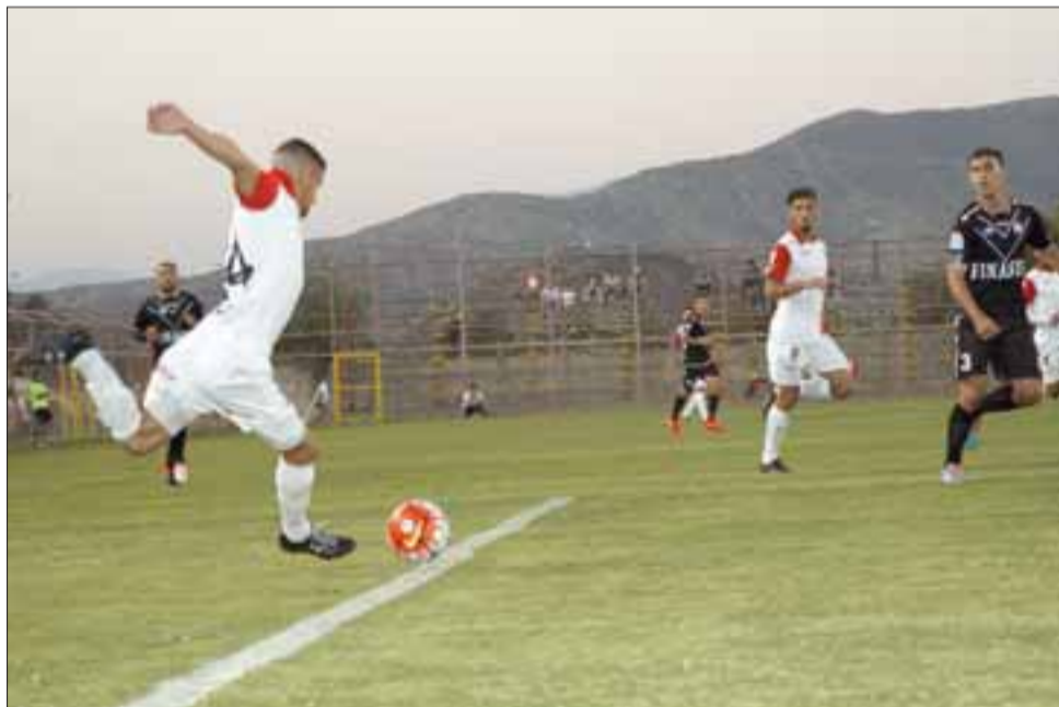
La igualdad sirve de poco y nada al Uní porque quedó a 14 puntos del líder San Marcos de Arica.