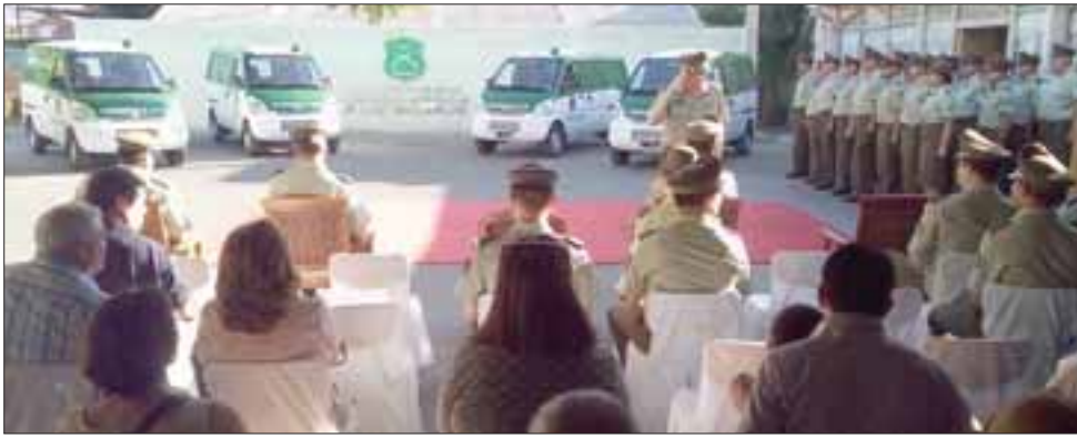
La Prefectura de Carabineros Aconcagua entregó este miércoles, cuatro nuevos vehículos utilitarios para labores de logística y transporte, a las comisarías de Los Andes, San Felipe y La Ligua.