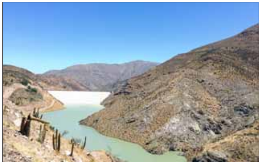
Embalse Chacrillas de Putaendo, ya cuenta con 6 millones de metros cúbicos de agua.