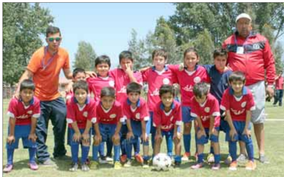
LOS MÁS RUDOS.- El Unión Jahuel es uno de los cuadros deportivos infantiles más duros del torneo.