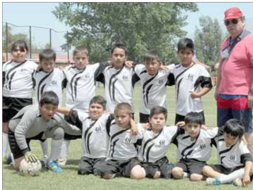
DUROS DE VENCER.- Ellos son los jugadores de la Escuela Juan Carlos Letelier, de Putaendo.