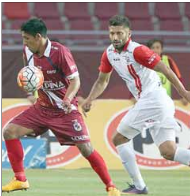
La igualdad conseguida en el estadio la Portada, sirvió de muy poco al Uní debido a que el puntero sigue sacando ventajas que parecen irremontables. (Foto: gentileza Phopresschile.cl).

Goles: 1-0; 39' Rodrigo Brito(LS) 1-1; 74' Sebastián Zúñiga(USF) Expulsado: Brayan Valdivia