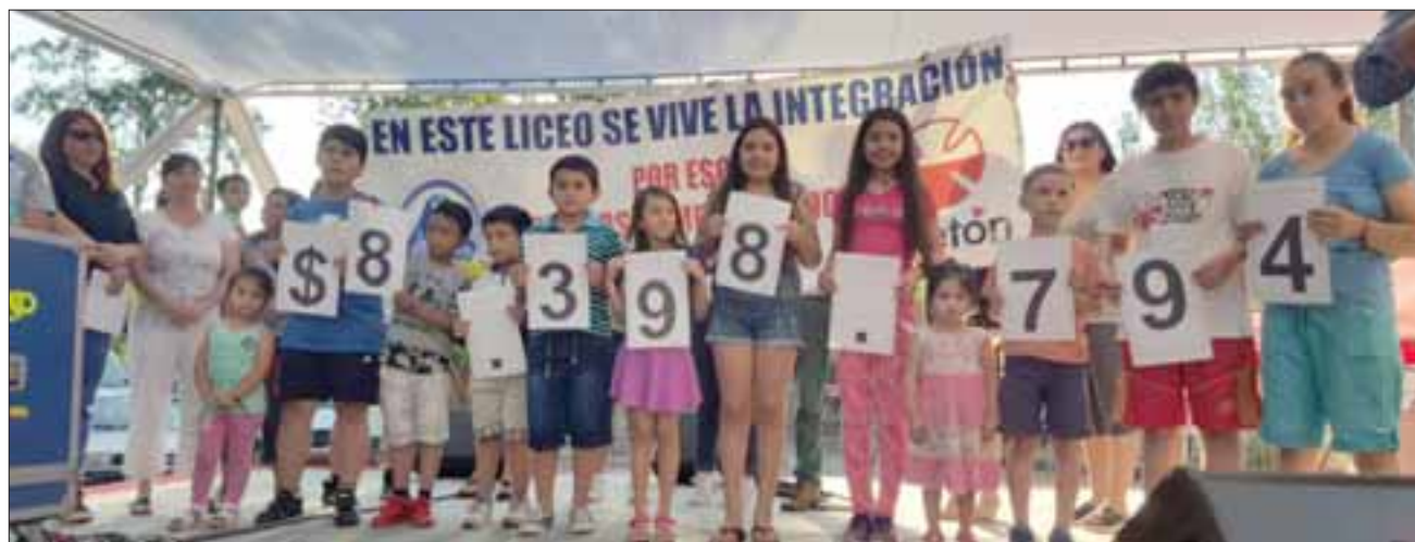
Cesfam Valle de Los Libertadores de Putaendo.

ñamos a nuestros alumnos y a todos en general a dar sin esperar nada y eso en el fondo nosotros forjamos esa virtud tan importante que nos une como es la solidaridad”