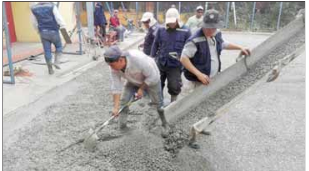
DURO TRABAJO. - Varias semanas y muchos obreros fueron los empleados para estas faenas de reconstrucción de la cancha.