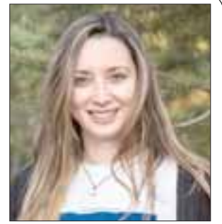
por María José Jury.

Por otra parte, hace un tiempo, el contrato de disposición de residuos aumento considerablemente de precio debido a que se