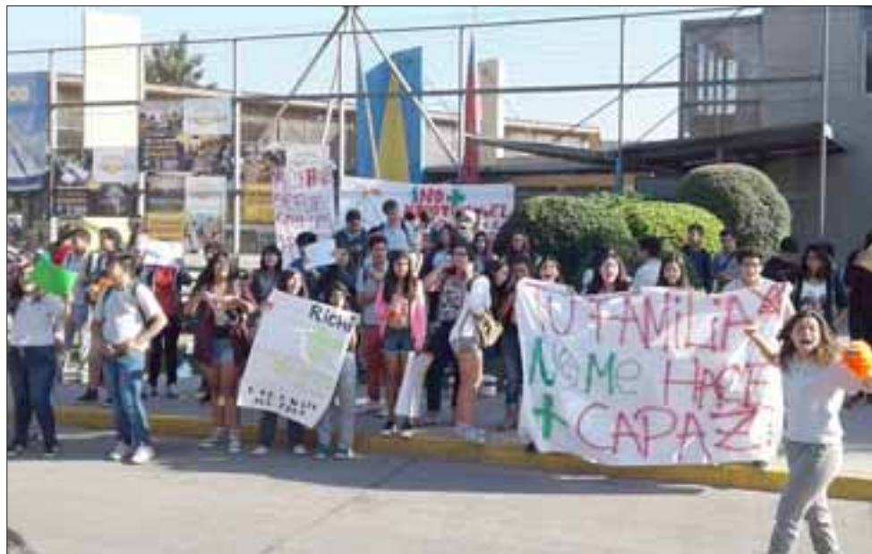
Los alumnos protestando frente al Colegio Pirámide.