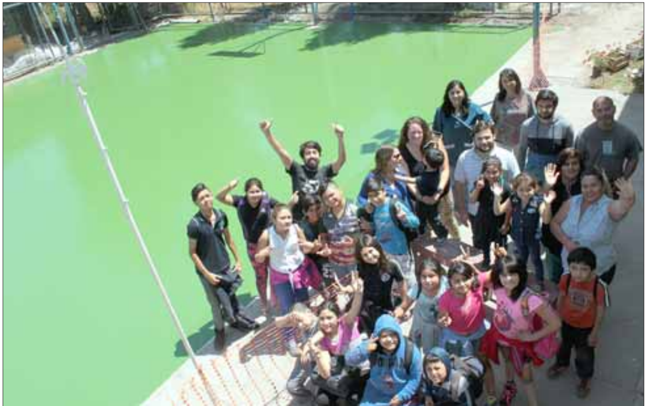
PATIO-CANCHA NUEVOS. - Así de impacientes están todos en la Escuela San Rafael, luego que el Municipio invirtiera $18 millones para reconstruir y pintar la nueva cancha de esa casa estudiantil, lo que permitirá a los niños el poder recibir adecuadamente sus clases de educación física y hasta desarrollar torneos de varios deportes.