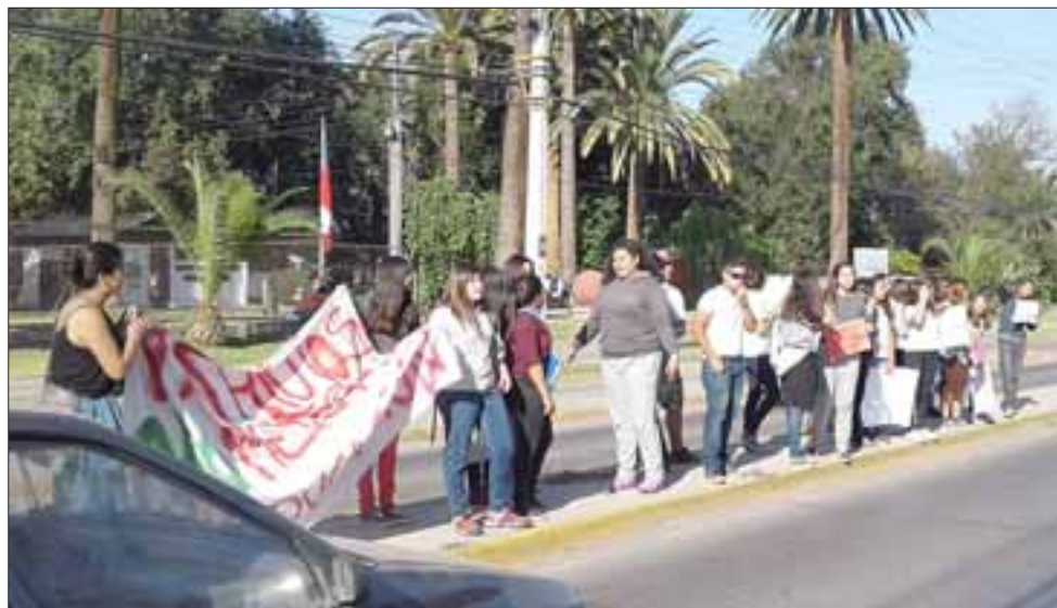
Alumnos del Colegio Pirámide sobre el bandejón central de Tocornal.