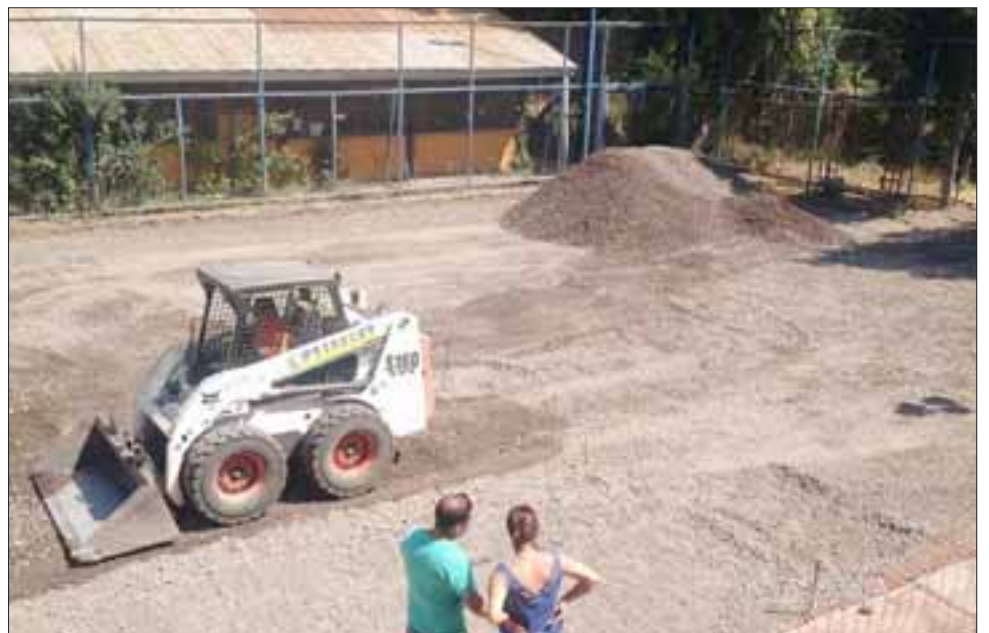
UNA LARGA ESPERA. - Las cámaras de Diario El Trabajo registraron cada etapa de las obras, ya casi terminadas.