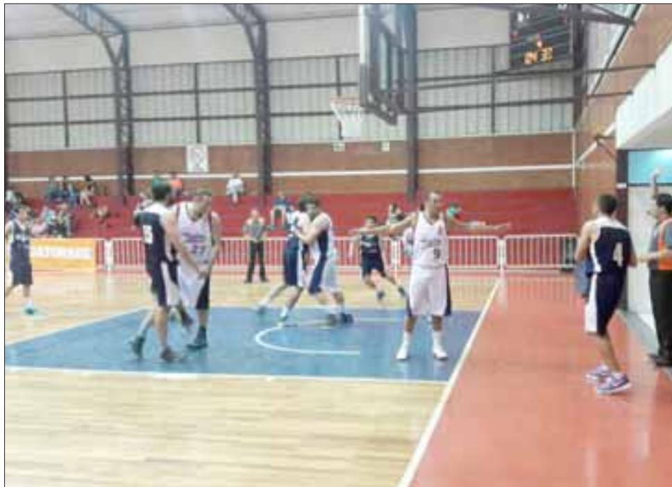
En la propia casa de su rival el Prat le propinó una drástica derrota a Liceo Mixto.

Ahora esta serie de Play Offs que es al mejor de tres encuentros, se trasladará hasta el Fortín Prat de San Felipe donde deberán jugarse los próximos dos (siempre que sea necesario un tercero) encuentros.