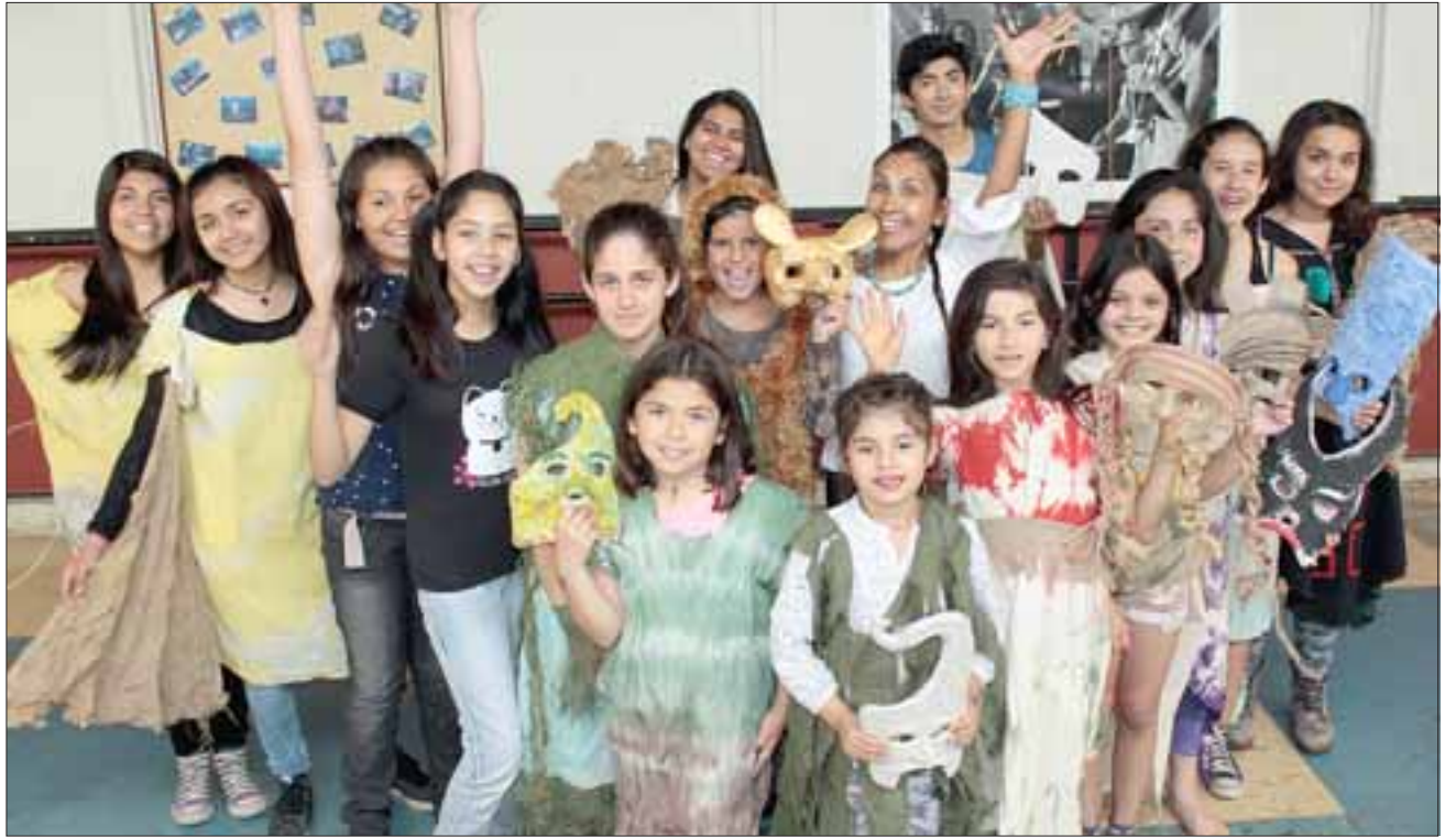
SEMILLERO DE ACTORES.- Estos jóvenes actores posan junto a su profesora para las cámaras de Diario El Trabajo.