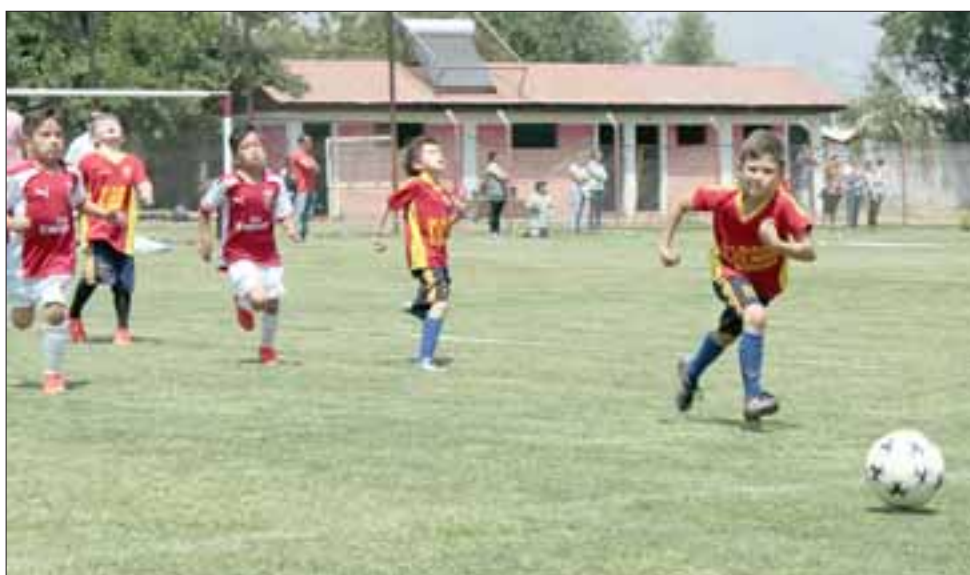
Cada jugador dio lo que tenía para hacer ganar a su equipo, como lo muestra esta gráfica.