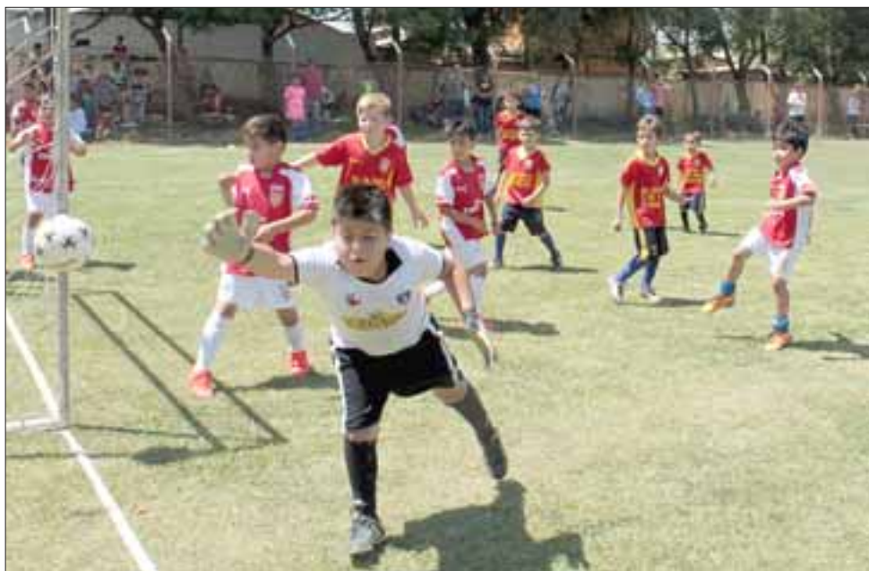
INBATIBLE.- Aquí vemos a este portero defendiendo con alma vida y corazón su portería.