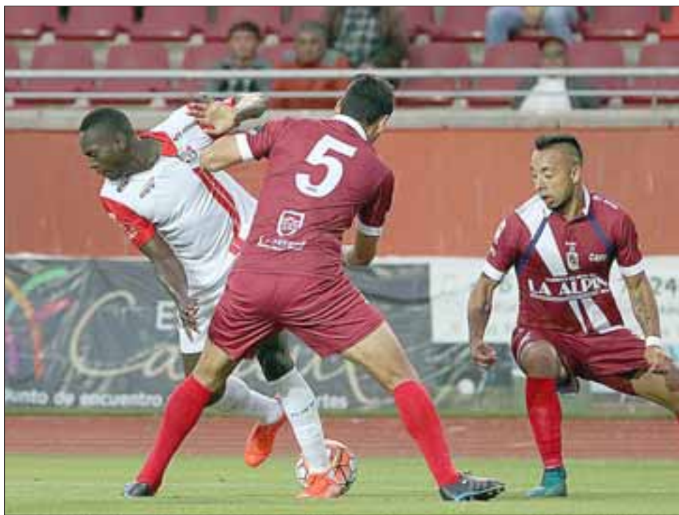
Ante Deportes La Serena, el Uní Uní volvió a ser un equipo de reacción.

birrojos llegan a 17 puntos en la tabla de posiciones, muy lejos de los 31 que hasta ahora acumula Curicó Unido, el mejor equipo de la primera rueda en el torneo de la Primera B.