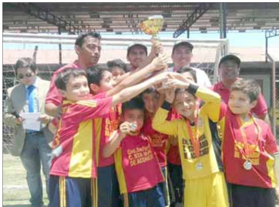
LOS CAMPEONES.- Aquí tenemos a los chicos de la Escuela Santa María de Aconcagua, quienes ganaron el primer lugar del campeonato.