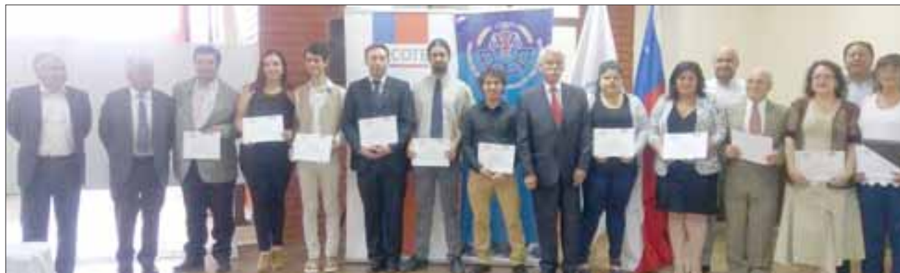
Microempresarios aconcagüinos se certificaron luego de su participación en el seminario 'En la Ruta del Turismo del Aconcagua'.

«A través de un convenio entre los Gobiernos de Estados Unidos y Chile, se pensó en implementar durante el periodo de Gobierno, 50 Centros en Chile, 4 de ellos en la Región de Valparaíso: Valparaíso, Quillota, San Antonio y ahora se adjudicó el de Aconcagua, que va a estar ubicada aquí en esta Cámara de Comercio (San Felipe)», concluyó Fernández.