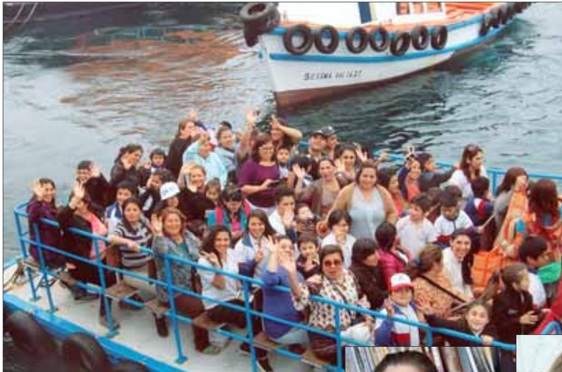
AL AGUA PATOS.- Aquí tenemos a los estudiantes de esta escuela sanfelipeña, felices como nunca durante este paseo en lancha, en Valparaíso.

pocos meses estrenaron sus nuevas chaquetas institucionales.