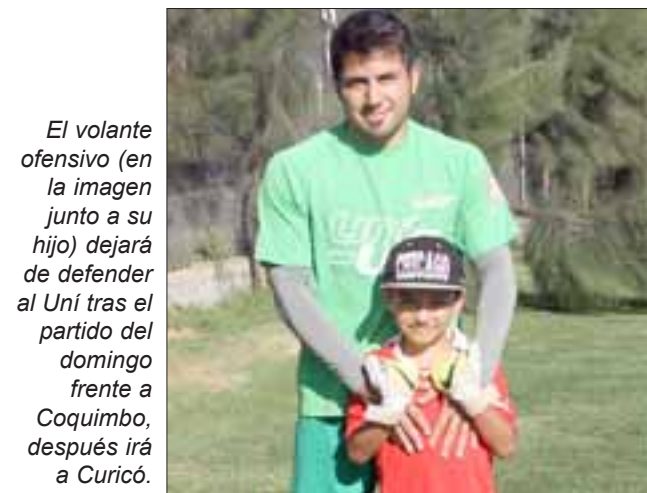
El volante ofensivo (en la imagen junto a su hijo) dejará de defender al Uní tras el partido del domingo frente a Coquimbo, después irá a Curicó.