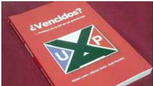
¿VENCIDOS?. - Este miércoles 14 a las 19:00 horas en el Salón de Honor de la Municipalidad de San Felipe, se presentará el libro '¿Vencidos? Crónica de la UP en las provincias'.