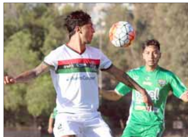
Trasandino carga con la obligación de conseguir un buen resultado ante Independiente, y de esta forma, levantar una campaña que hasta ahora ha sido muy pobre.