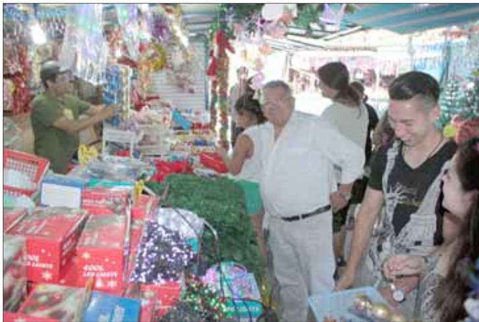
FERIA DEL JUGUETE. - Desde este miércoles, decenas de sanfelipeños se acercaron a la Feria del Juguete para hacer sus primeras compras de adornos, luego serán los juguetes.

Diario El Trabajo habló con uno de los fundadores de esta feria, don Ví-