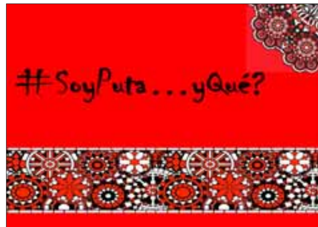
Acá el afiche de la marcha.

que la sociedad impida de alguna forma que esto siga sucediendo es una labor un oficio más antiguo que existen", finalizó.