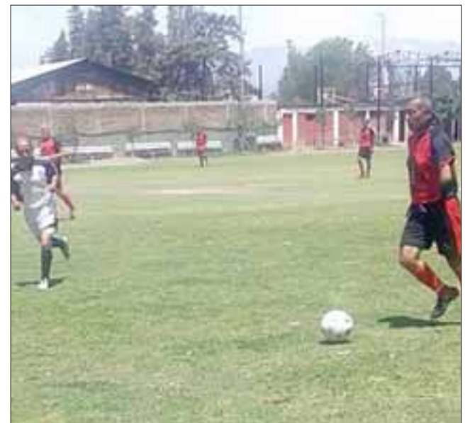
Durante el viernes y el domingo, se jugarán las respectivas fechas de los actuales torneos de la Liga Vecinal que se juegan en la cancha Parrasía.

21:50 horas, Hernán Pérez Quijanes – Barcelona