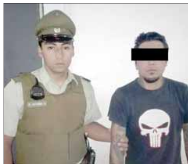
El imputado fue detenido por Carabineros, tras ser sindicado como uno de los autores del robo a un menor de edad.

Los antecedentes fueron fundamentales para dar con