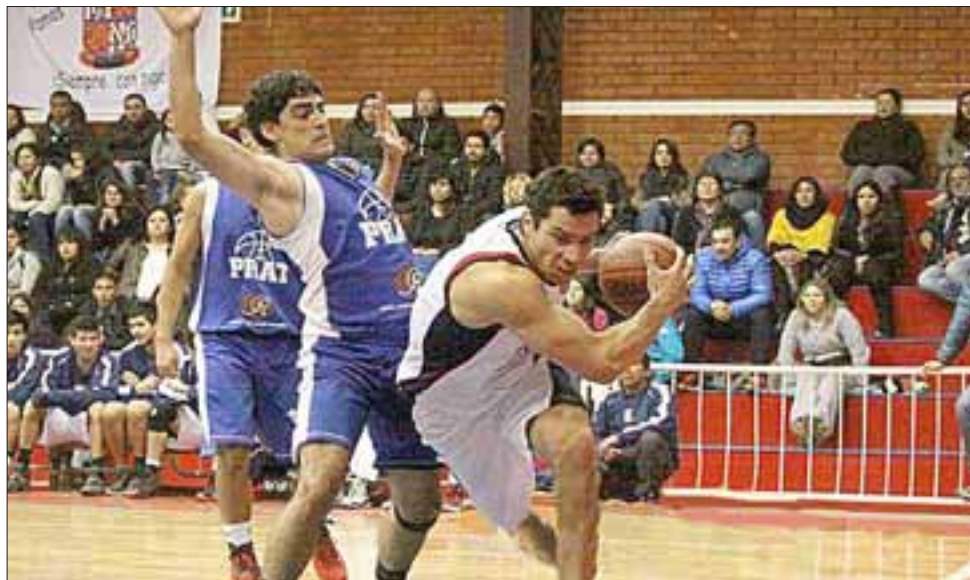
Entre el Prat y el Mixto saldrá el último equipo que jugará en la Liga A.

*Solo de ser necesario un tercer encuentro