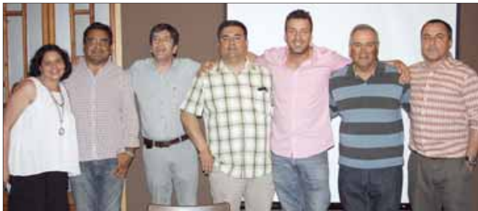
Directivos, técnicos y simpatizantes del Prat estuvieron presentes en la cena de clausura del 2016.

En una cena de camaradería, que tuvo lugar la noche del martes último en el Hotel y Restaurante Reinares, la rama de baloncesto del Prat, cerró un año 2016 que para el club del marino, todavía puede deparar alegrías de marca mayor, si es que su equipo adulto este fin de semana (ver nota aparte) consigue clasificar a la Liga Nacional.