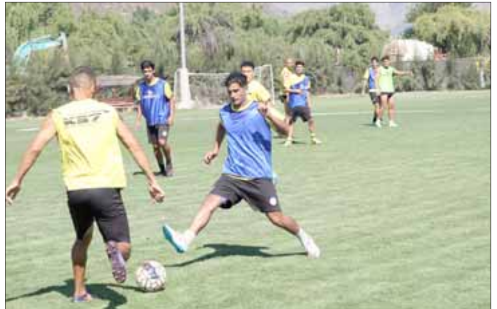
Los sanfelipeños enfrentarán a Coquimbo en el último partido del año.