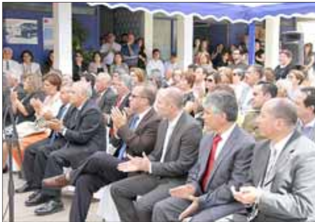
Gran marco de público, llegó hasta los patios del municipio de Putaendo para presenciar el acto de juramento de los nuevos ediles y apoyar a las autoridades electas.

importancia como el Plan Regulador, de forma que sea una iniciativa que esté acorde a las necesidades y crecimiento urbano de Putaendo, sin dejar de lado su identidad y naturaleza rural.