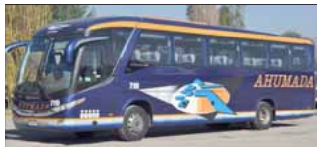
Empresa de Buses Ahumada, deberá adaptarse a la nueva logística de salida de la ciudad.

A partir de este lunes 12 los buses del transporte público de San Felipe, cambiarán el recorrido para salir de la ciudad, luego de que este lunes a las 18:00 horas, en una reunión realizada en la municipalidad de San Felipe, les fuera informado a todas las empresas de transporte público, el menciona-