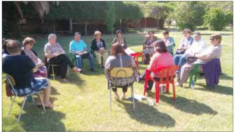
Distintas organizaciones comunitarias e instituciones participaron de una nueva jornada de 'Salud dialoga' en la casa Juan XXIII.

«Queremos enseñarle a la gente a usar el Fono Con-