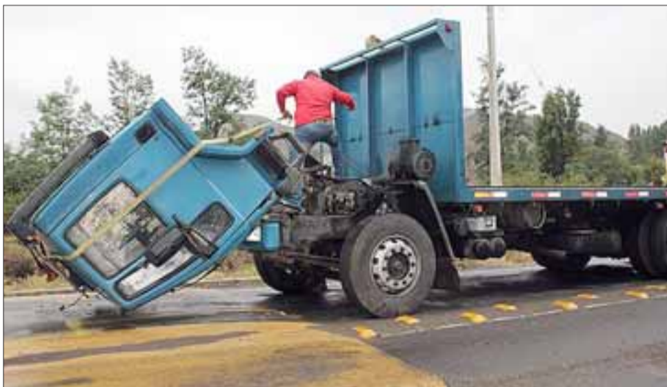
El accidente se produjo a eso de las 08:00 de la mañana de este viernes, en la carretera que une Putaendo con San Felipe, a la altura del Colegio Cervantino.

Al lugar acudió Bomberos de Putaendo, que prestó las atenciones de emergencia al afectado. Carabineros no se constituyó en el lugar, por lo que no se conocen mayores detalles, como la identidad y procedencia del conductor.