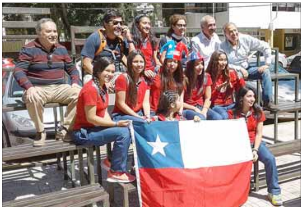
La Selección de Voleibol al momento de ser despedida antes de partir a Colombia. Las chicas enfrentan hoy al medio día su primer partido, cuando deberán medirse frente a sus similares representantes de Bolivia.