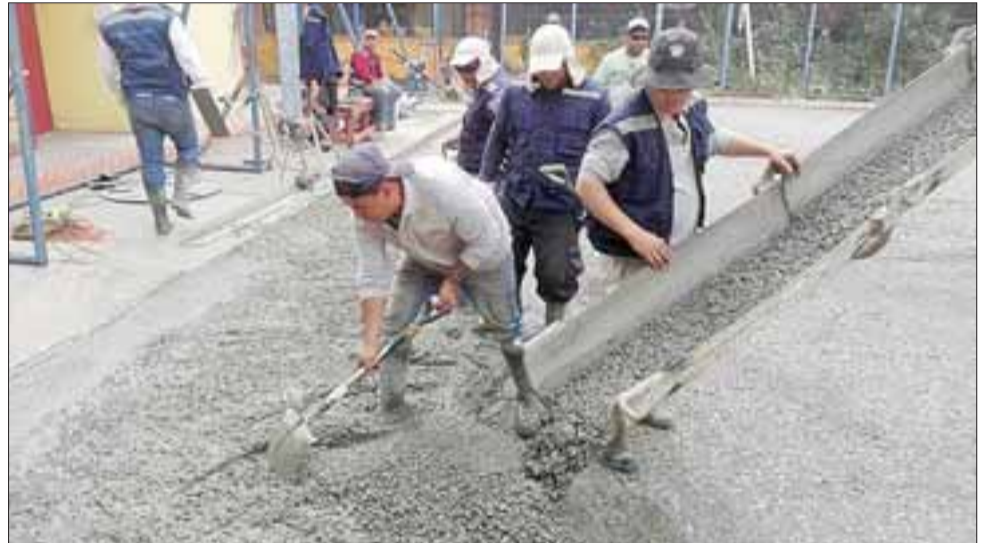
DURO TRABAJO. - Varias semanas y muchos obreros fueron los empleados para estas faenas de reconstrucción de la cancha.