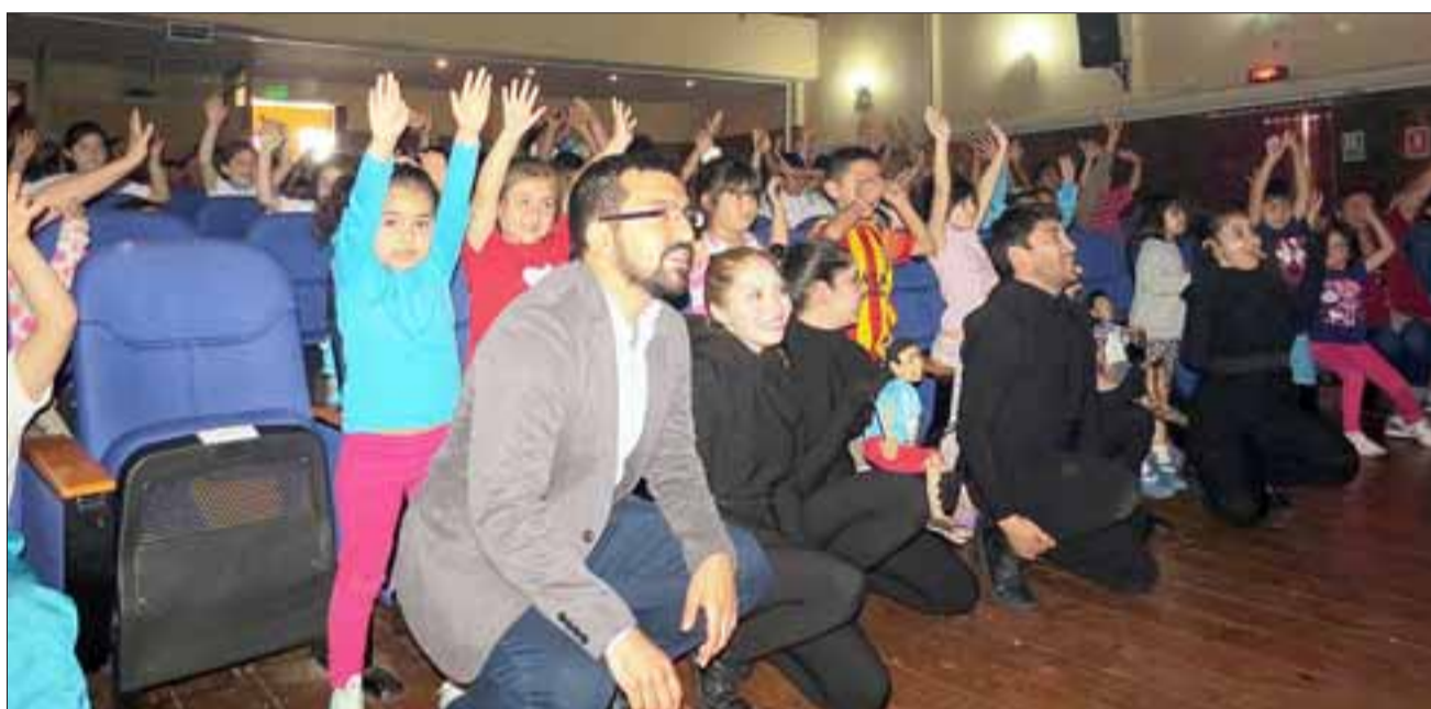
Un total aproximado de 300 niños, vivieron el viaje ancestral de 'Hotu'u', un niño porteño que conoce sus raíces Rapanui y se identifica con ellas, por medio del espíritu que habita en un moai de la Isla.

"Buscamos que los beneficios culturales, puedan llegar a todos los niños y niñas de la comuna. Así, que éstos, se va a mantener