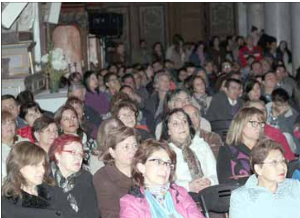
LLENO TOTAL.- Las bancas de la iglesia no fueron suficientes para dar asiento a todos los presentes.