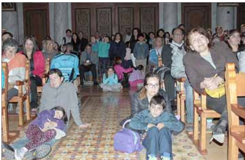
PRIMER CONCIERTO.- No había espacio para más personas, atrás, el público de pie disfrutaba del concierto.