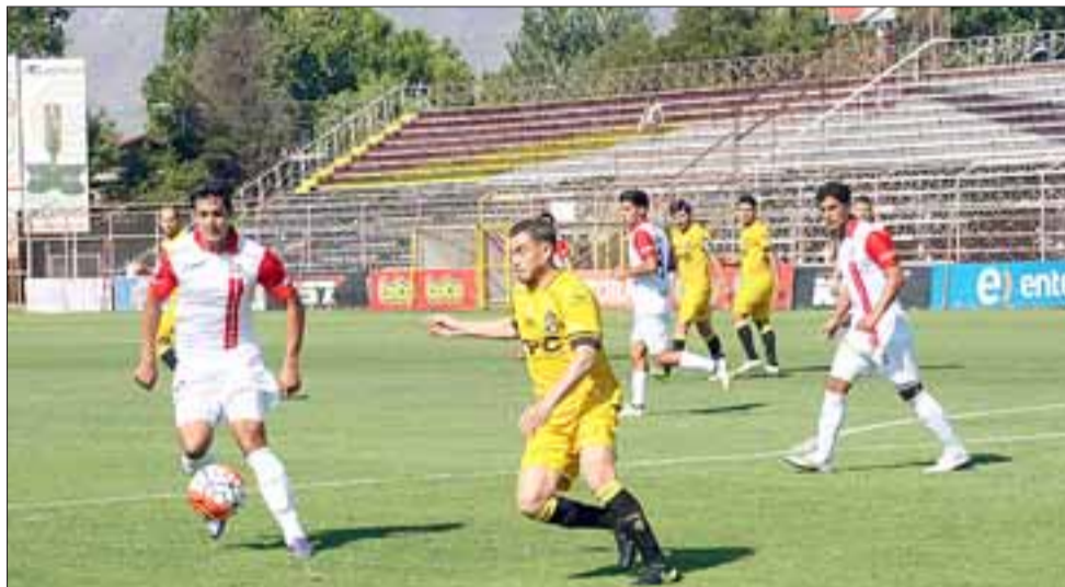
En un partido donde nuevamente despertó en el segundo lapso, Unión San Felipe superó 3 a 2 a Coquimbo Unido.