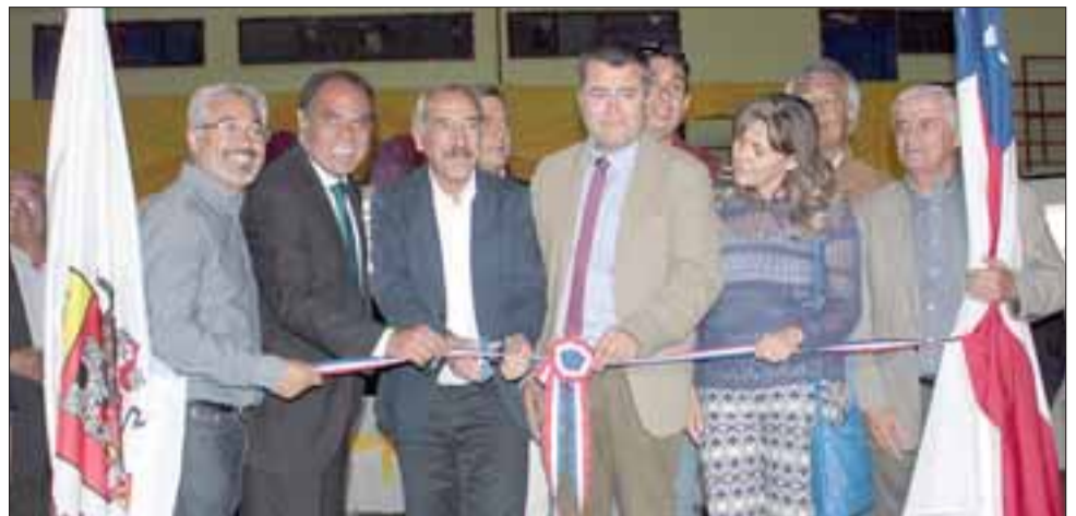
A JUGAR NIÑOS. - Autoridades municipales y de Gobierno junto al propio director de la escuela, realizan el protocolar corte de cinta, lo que deja inaugurado este patio escolar.