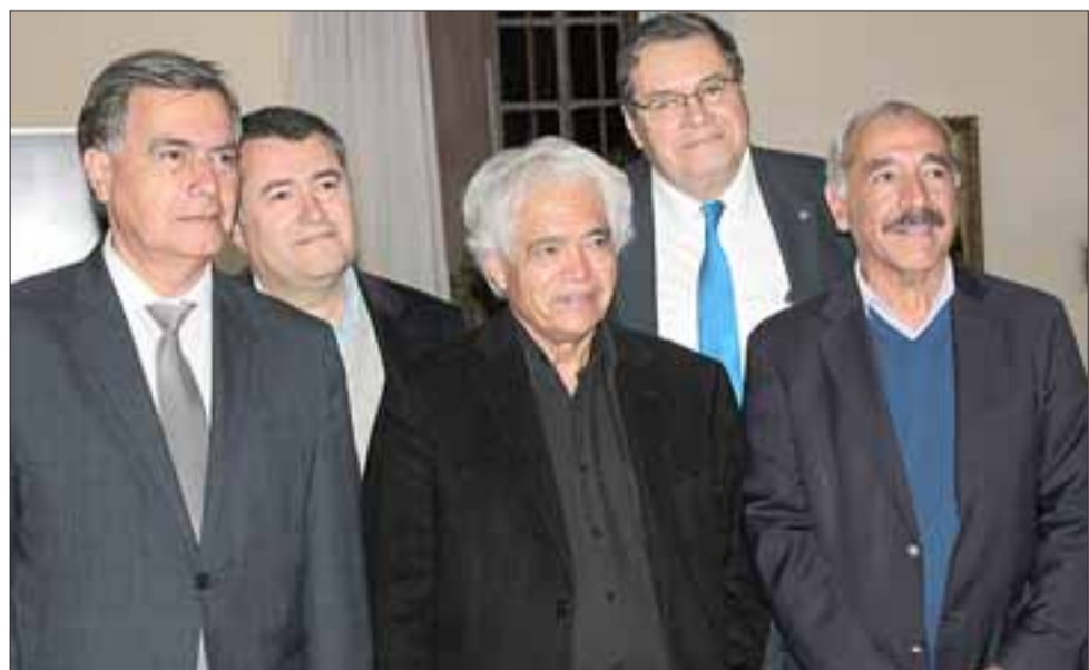
SATISFECHOS.- Autoridades posan junto al artista para las cámaras de Diario El Trabajo.