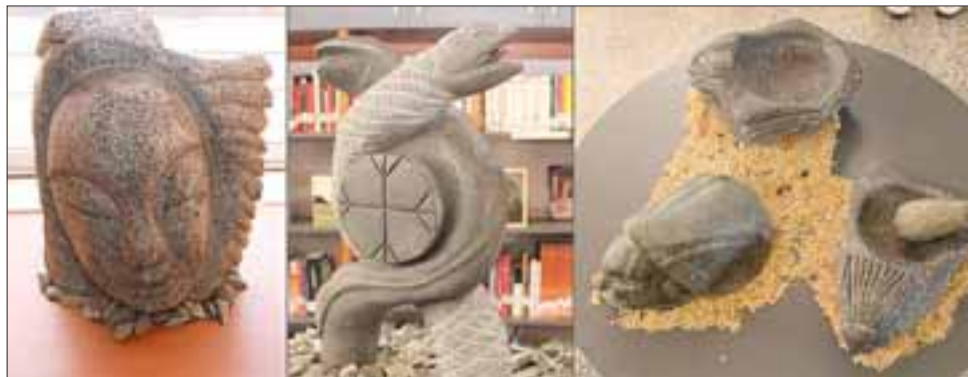
Las obras indagan en diversas expresiones que de alguna manera se relacionan con lo arcaico, lo precolombino y la naturaleza.

“El trabajo que estamos haciendo va en esa dirección, en el sentido de dar oportunidades a los niños y tengan la posibilidad de poder ver este tipo de exposiciones, asimismo dar espacios a artistas nuestros y así puedan exponer sus traba-