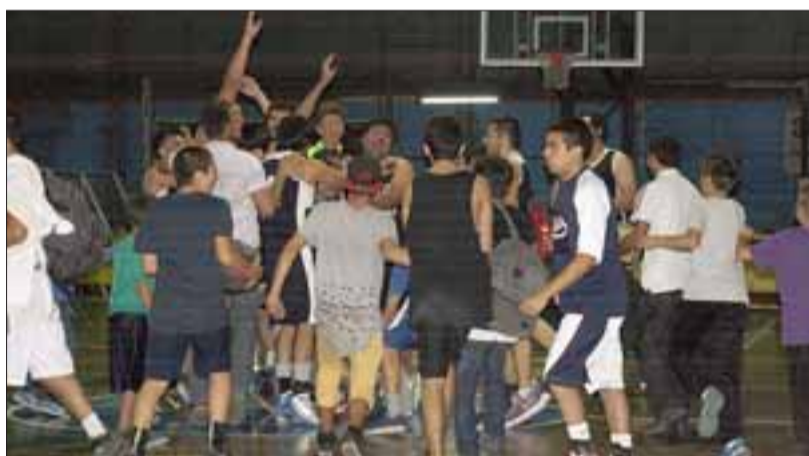
Los pratinos celebraron eufóricos el triunfo que le otorgó el ascenso a la serie A del básquet chileno.

Con este triunfo, el Prat cerró a su favor la serie de repechaje de la Libcentro Pro A con lo que en el primer semestre del próximo año tendrá la oportunidad