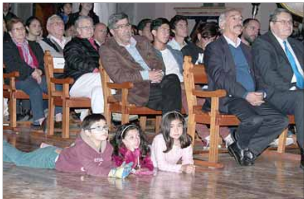
BIEN RELAJADOS.- Estos pequeñitos decidieron mejor tirarse al piso para no perderse el concierto.