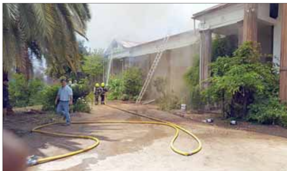
Al combate del fuego debieron acudir unidades de los cuerpos de Bomberos de San Esteban y Los Andes.

Los daños causados por el incendio son millonarios, sin considerar el valor patrimonial de la propiedad.