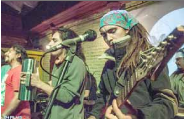
ESPECTACULAR.- Esta banda sanfelipeña celebrará sus dos años la noche del viernes, en Bar Valle a las 23:00 horas, lugar al que también están invitados Latimba y Aiúte Místico.