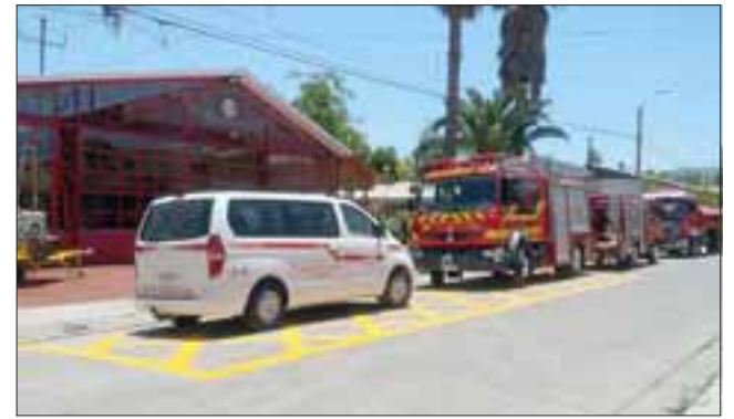
Cuarta Compañía de Bomberos de San Felipe cumplió 90 años. Desde 1995 tiene su cuartel en calle Ambrosio Santelices, Población Pedro Aguirre Cerda.

Respecto del contingente con el que cuenta esta unidad bomberil, Torrejón precisó que "tenemos un