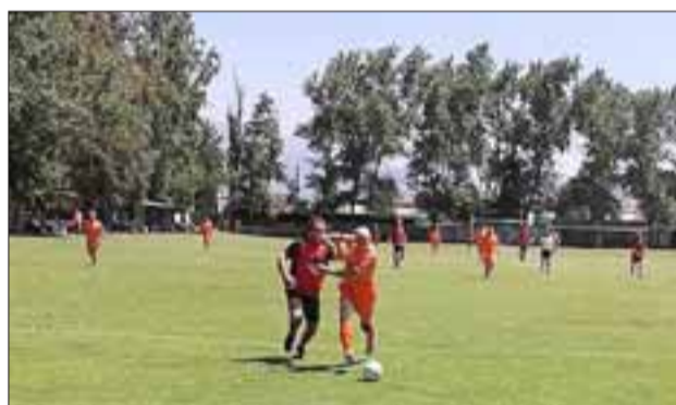
Corridas ya varias fechas de la segunda rueda, nada cambia arriba en la Liga Vecinal.

Barcelona 1 – Santos 0; Villa Argelia 3 – Resto del Mundo 2; Hernán Pérez Quijanes 3 – Unión Esperanza 1; Los Amigos 2 – An-