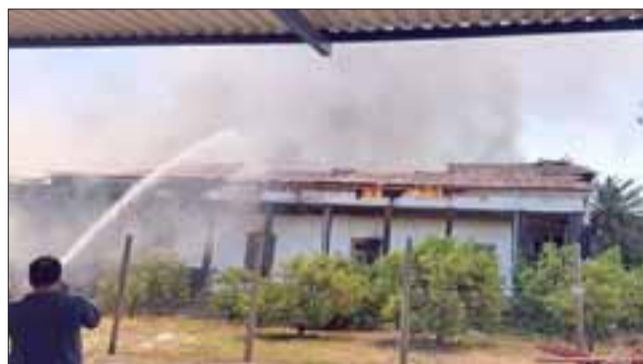
Completamente destruida resultó la centenaria casa patronal de la familia Catán, ubicada en el sector de Lo Calvo, en la comuna de San Esteban. (Foto Paulino Fernandez).