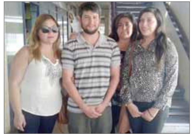
Cuatro docentes, incluido el jefe técnico del establecimiento, acusan que fueron desvinculados de manera arbitraria, con evaluaciones infundadas, mientras el presidente del Centro de Alumnos sostiene que el director del liceo le ofreció golpes.