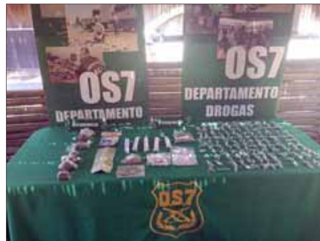
Efectivos del OS7 de Carabineros incautaron las drogas desde una vivienda de la Villa Santa Teresita de San Felipe la mañana de ayer miércoles, además de la detención de un imputado de 22 años que enfrentará a la justicia el día de hoy en tribunales.

“Carabineros del OS7 da cuenta de este importante