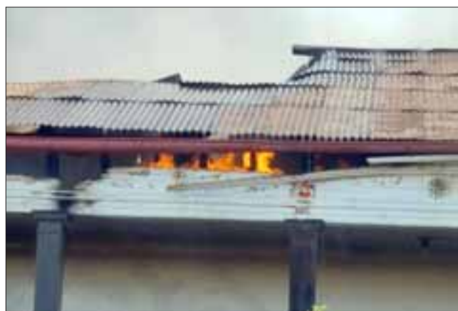
La casa fue envuelta por las llamas en cosa de minutos, debiendo concentrarse el trabajo de bomberos en evitar que el fuego alcanzara una bodega de productos químicos.