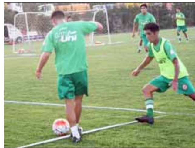
El fixture de la segunda rueda del Uní, contempla 7 juegos en casa e igual cantidad fuera de ella.

FECHA 11º: 26 de marzo: Cobreloa – Unión San Felipe