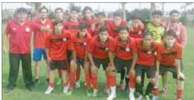
Categoría U15, campeón Lief 2016.