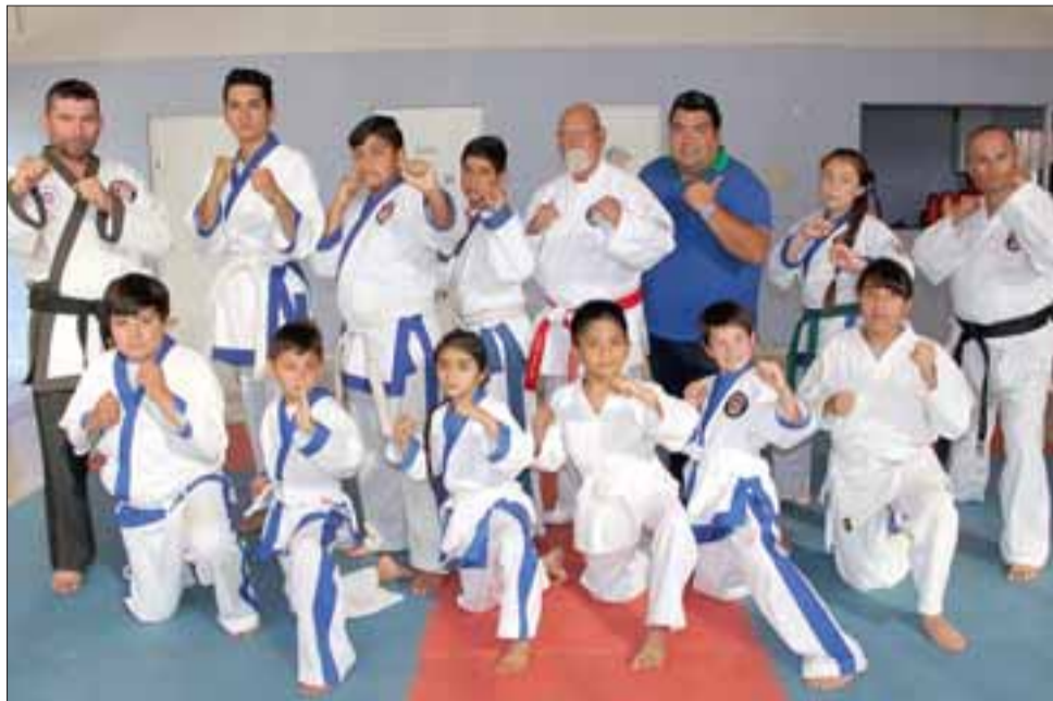
LOS MEJORES.- Aquí tenemos a los guerreros que fueron promovidos de grado durante la ceremonia de aniversario del club.