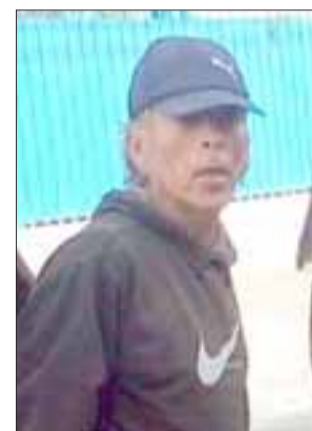
En abril de este año el antisocial fue capturado por Carabineros, tras el robo cometido al interior de la Escuela 62 en San Felipe.

tuario delictivo, recordaremos que el pasado mes de abril fue capturado por Carabineros luego de ser sorprendido junto a otro antisocial al interior de la Escuela José de San Martín, ubicada en calle Freire en San Felipe, sustrayendo dos contenedores de basura de los sanitarios de este establecimiento.