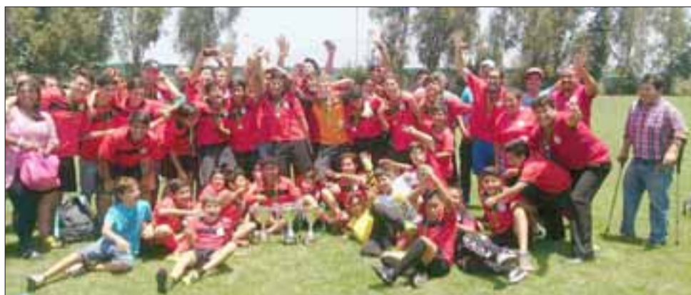
Fortalezas de Aconcagua, logró coronarse con dos títulos de campeón y un segundo lugar en Liga de Integración de Escuelas de Fútbol, Lief.

“Estamos felices porque nosotros nos caracterizamos por ser una escuela formativa y poco a poco hemos empezado a competir y hemos tenido muy buenos resultados, eso quiere decir que estamos haciendo las cosas bien y no queda más que agradecer