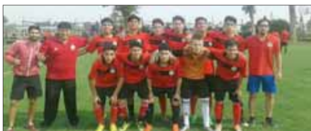
Categoría U17 de Fortalezas de Aconcagua, vicecampeón Lief 2016.