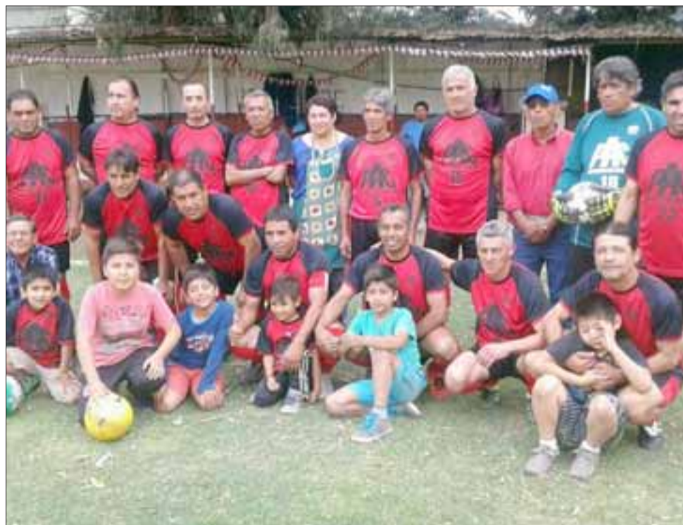
Los dos campeonatos de la Liga Vecinal, entraron en un receso que se prolongará por algunas semanas. En la imagen PAC candidato fijo para dar la vuelta olímpica en Parrasía

hinchas puedan desconectarse de dos competencias, las que hasta ahora han sido muy reñidas y ajustadas, con pronósticos muy inciertos, situación que hace prever que tras el receso la acción se vendrá con todo en la cancha Parrasía.