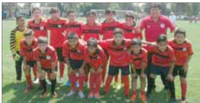
Sub 13 de Fortalezas de Aconcagua, campeón Lief 2016.

El próximo desafío de Fortalezas de Aconcagua, será su participación en el Torneo Internacional, Con-Con Cup, a desarrollarse desde el 16 al 22 de enero próximo y donde la escuela sanfelipeña competirá con las categorías U9, U11 y U15.