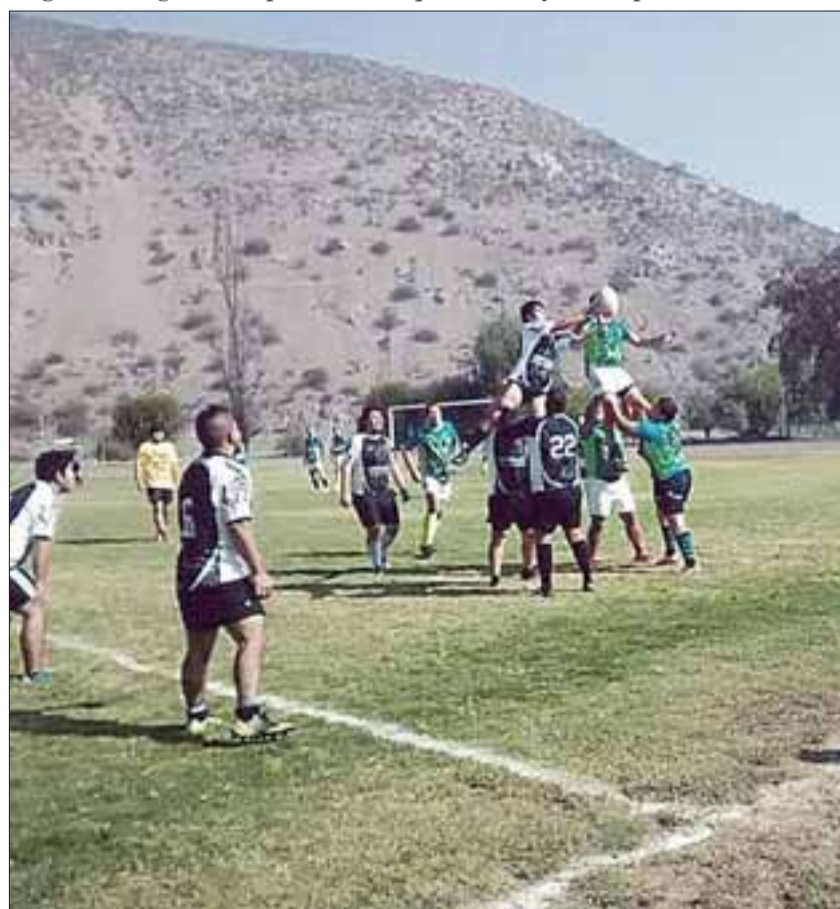
Para el 2017, San Felipe Rugby espera tener compitiendo un equipo en la liga nacional.

San Felipe Rugby, ya comenzó una ruta que tiene como destino 'el éxito', y para llegar a él es fundamental contar con jugadores, por eso los jóvenes que quieren incorporarse deben acercarse los días lunes y jueves, a partir de las 19:30 horas, hasta la cancha Exser (Michimalongo) recinto que pasará a la historia como la cuna de este proyecto deportivo.