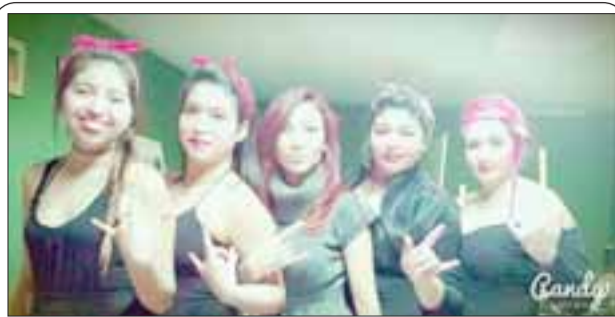
GUAPÍSIMAS.- Aquí tenemos a las chicas de Jeon Jungkook con su baile animado moderno.

"Estamos proponiendo algunas alternativas, como el Centro Comunitario por las tardes. Vamos a encontrar juntos una solución. Siempre será más atractivo que construyamos algo y que sea propio. Eso puede llegar en algún momento. Lo que importa es que ellos tengan pronto un lugar y que ellos tengan un contacto con sus familias y autoridades regularmente. Esperamos fortalecer nuestra relación con los discapacitados y trabajaremos con ellos", explicó el edil.