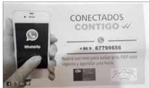
Este es el número del Whats PAP.