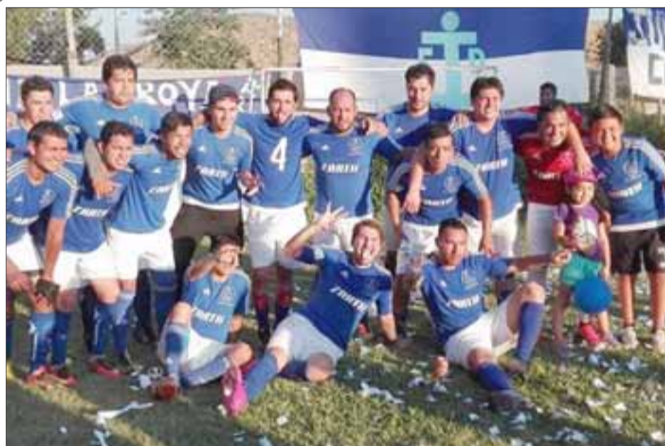
Una vez más y por tercera vez consecutiva, Juventud La Troya se coronó campeón de la Serie de Honor.