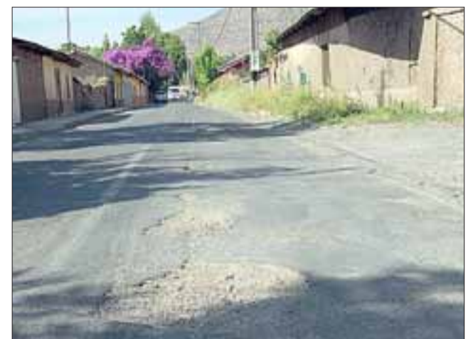
Constantes son los reclamos de vecinos y automovilistas por el pésimo estado de Calle Juan Rozas.

Calle Juan Rozas, es uno de los puntos críticos donde los caminos presentan un considerable deterioro, sumándose a El Tártaro, Guzmanes, Casablanca y Población Hidalgo. Patricio Gallardo