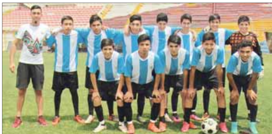
En la Escuela de Fútbol de Panquehue, sus integrantes dan sus primeros pasos en el fútbol aplicando el concepto: Jugar para aprender.