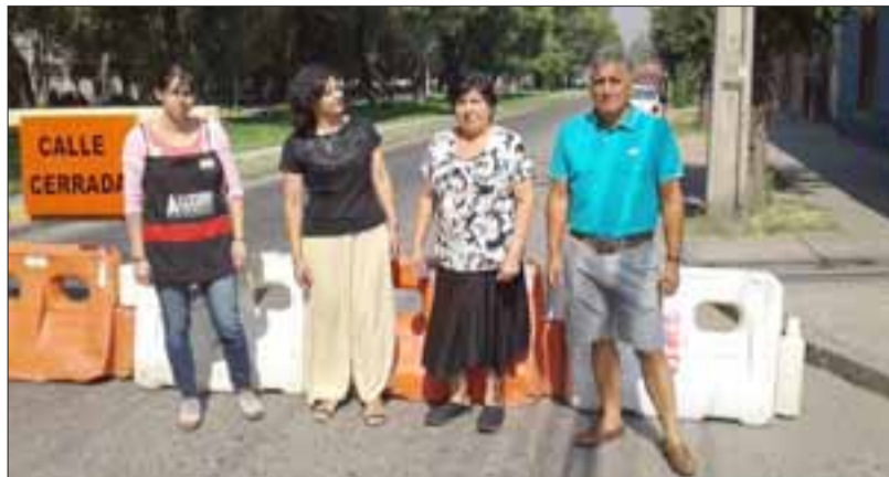
Los vecinos junto al cierre que fue puesto para cortar el tránsito en Avenida O'Higgins con Navarro.

"Entonces yo le pregunté al señor de la Dirección de Tránsito y al propio alcalde, si ustedes se comprometieron con nosotros que eso no iba a ocurrir, como autorizan vía un decreto a cerrar la calle, nos mintieron entonces, fue un show la reunión en el Ilustre Salón de la Municipalidad,