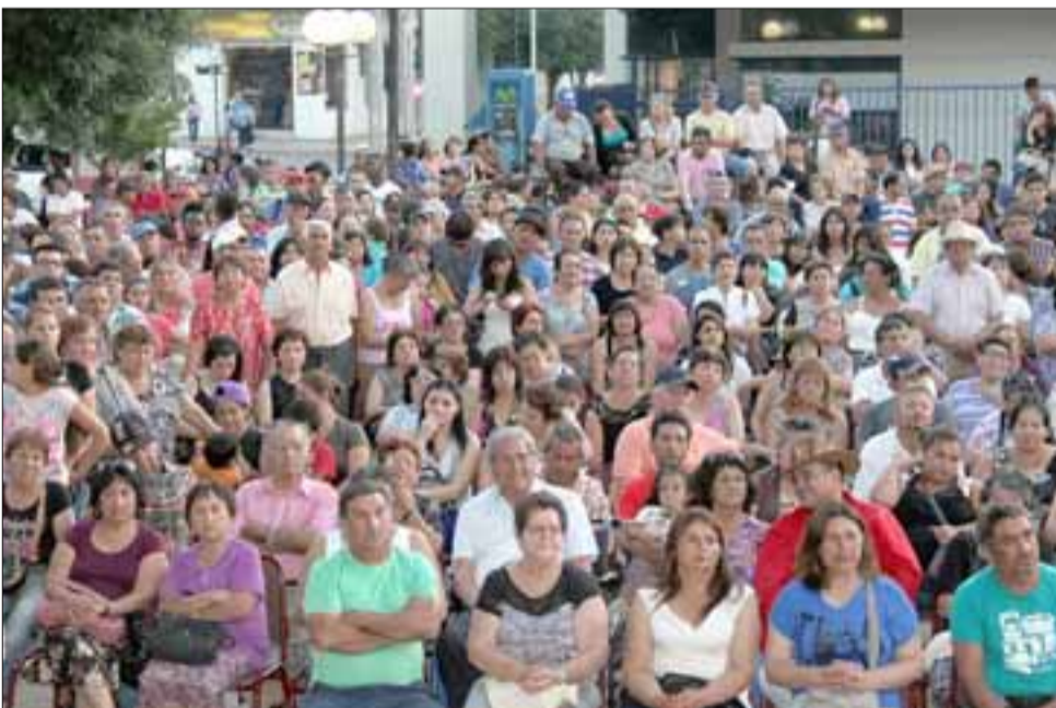
FIELES A NELSON. - Personas de todos los rincones del Valle Aconcagua llegaron para expresarle cariño y fidelidad al locutor.