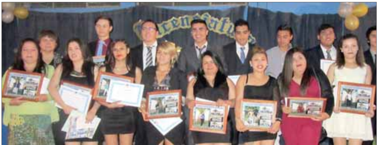
SEDIENTOS DE TRIUNFAR.- Ellos conforman la Generación Curimón de 2016. Terminaron sus estudios de Media en la Escuela Carmela Carvajal.