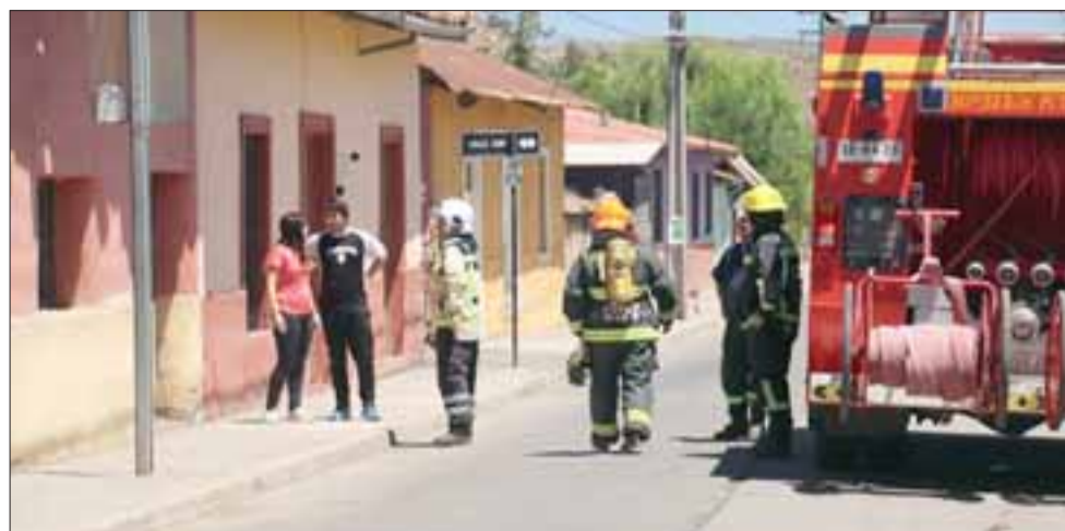
Personal de Bomberos concurrió a verificar la alerta recibida por el humo que salía desde dos viviendas de calle Chacabuco, no pudiendo ingresar a verificar si se trataba de un incendio o no.

Con la finalidad de detectar un posible foco de propagación a un incendio mayor, y para comprobar que efectivamente se trataba de una cocina inflamada, personal de Bomberos se