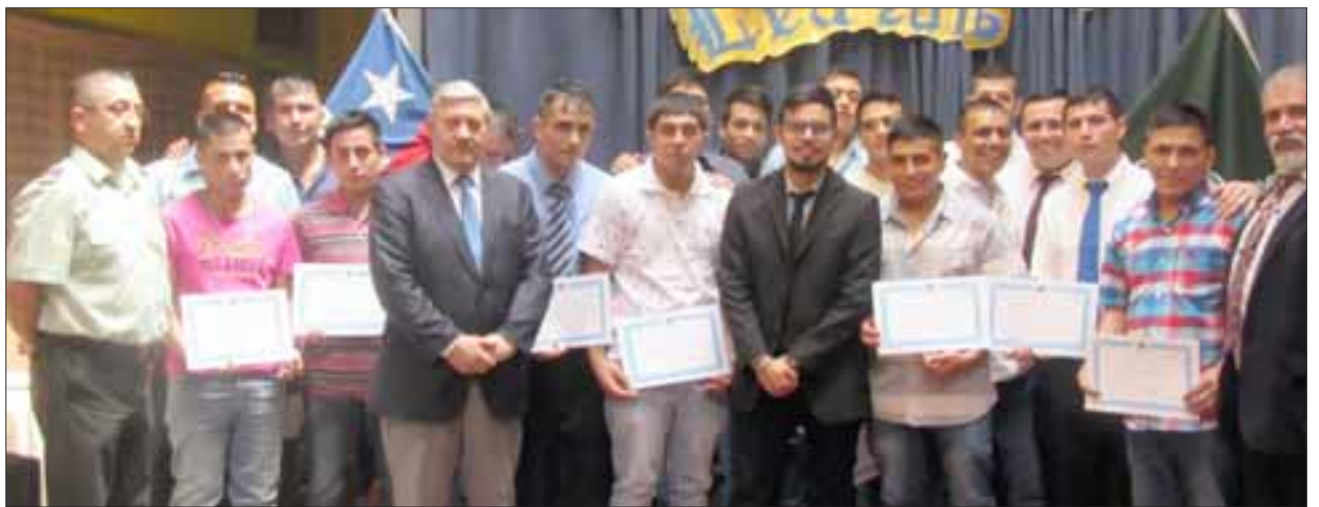
IMPARABLES.- Aquí tenemos a los jóvenes estudiantes del CCP San Felipe, ellos terminaron este año su 4º Medio.