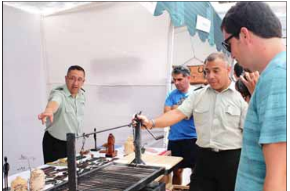
Distintos productos, pudieron comprar las personas que se acercaron hasta los dos stands con que contó el CCP en la Expo Emprendimiento de Aconcagua.