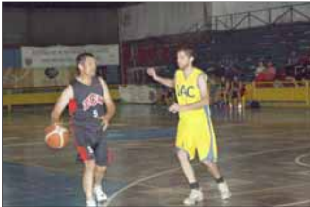
Los quintetos del IAC y el Chacabuco, animaron una entretenida y reñida final de la serie Senior de la Copa Juan Arancibia.