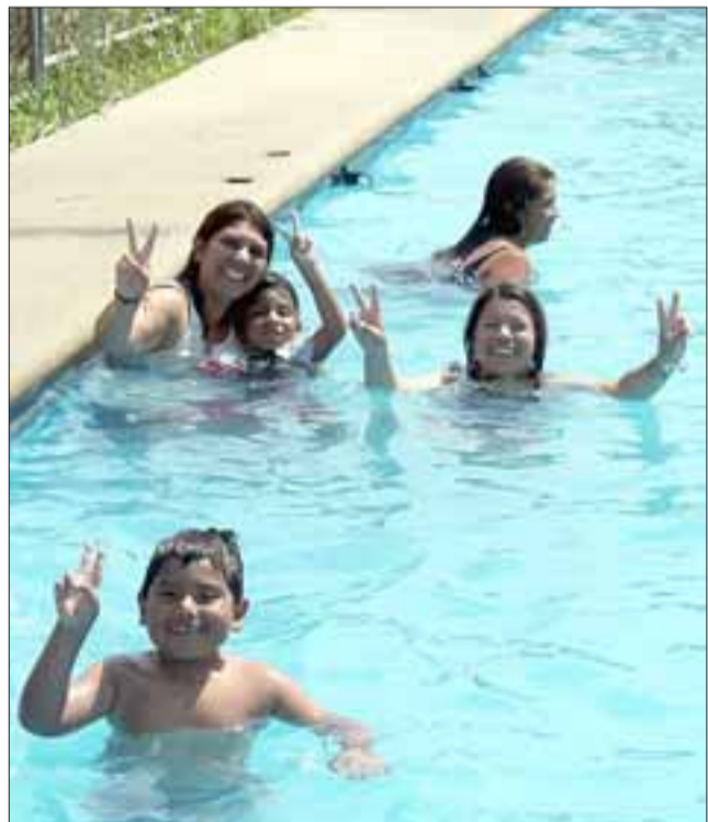
REFRESCANTE FIN DE AÑO. - Estos niños en verdad que lo pasaron bien durante la fiesta a ellos ofrecida.