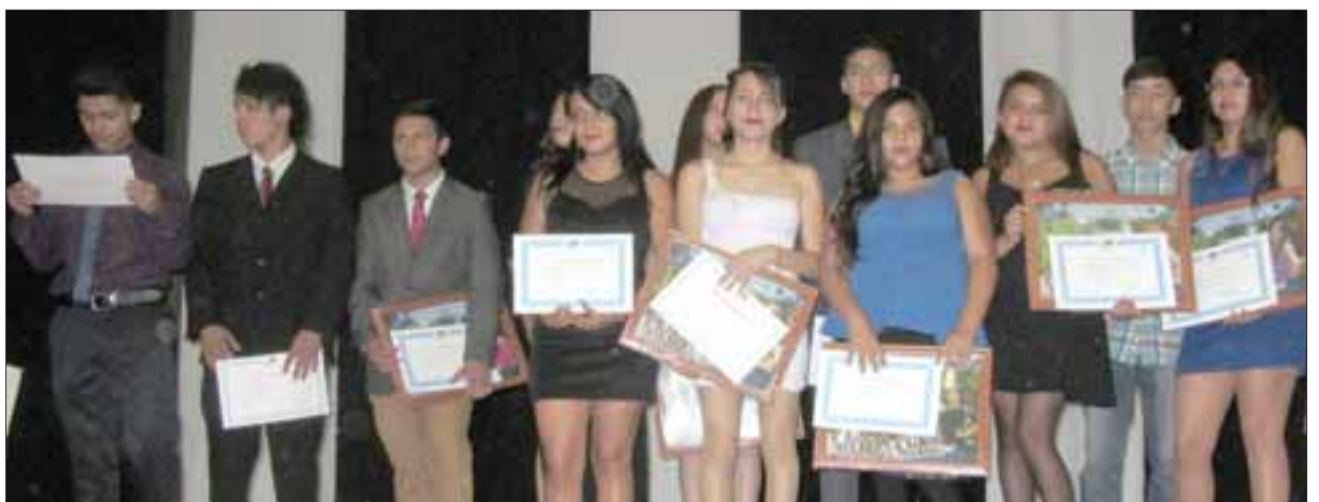
SUERTE MUCHACHOS.- Aquí tenemos a chicos de Básica, terminando su escolaridad. Ellos continuarán este año 2017 con su Media.