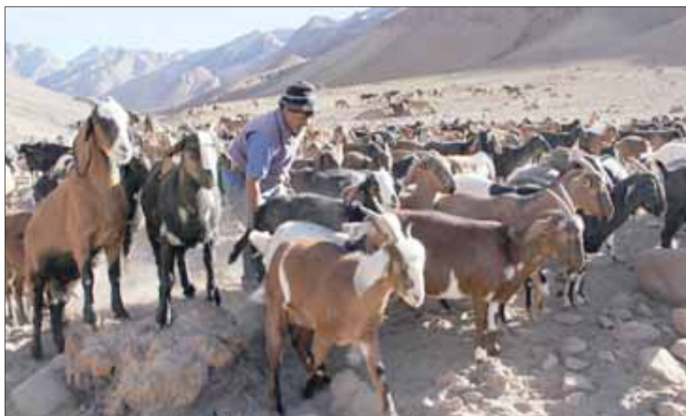
Un agricultor del sector arrea sus animales eb el extenso terreno de la comunidad.

«Se debe hacer presente, -agrega el profesional- que todos los individuos que están detrás de esto han tenido problemas legales con la comunidad. El señor Jor-