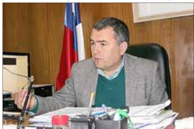
El gobernador, Eduardo León, hizo un llamado a tener una mirada de inclusión con los inmigrantes, principalmente haitianos, que han comenzado a llegar a la zona y a denunciar cualquier situación que revista una vulneración de sus derechos.