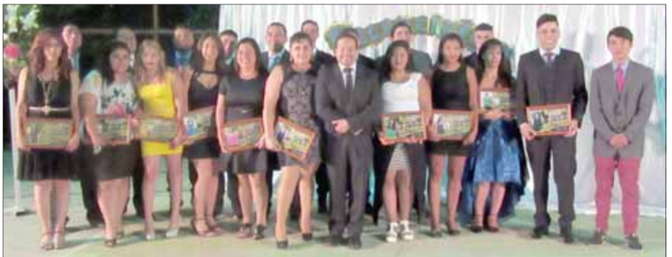
Y VAN POR MÁS.- En la Escuela Heriberto Bermúdez, de El Algarrobal, estos jóvenes culminaron sus estudios de enseñanza media.