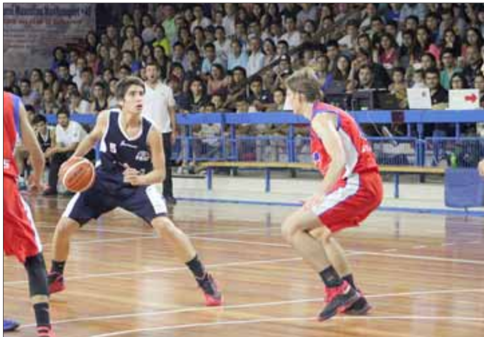
Para el viernes 6 de enero está programado el comienzo del Campioni di Domani donde el Prat de San Felipe es el campeón defensor.

Según el sistema de clasificación, avanzarán a las instancias finales los cuatro mejores de cada grupo, para desde ahí jugar cuartos de final, semifinales y la respectiva final en partidos de eliminación directa.