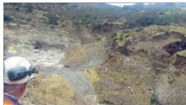
Sernageomin paralizó faena 'La Patricia' de Catemu luego de deslizamiento de terreno que afectó un área aproximada de 20 mil metros cuadrados.

me de investigación en que se determinen las causas del colapso, el cual, debe presentar de acuerdo a lo establecido en el Reglamento de Seguridad Minera, a más tardar en 15 días de ocurrido el evento. Cabe considerar, que cuando