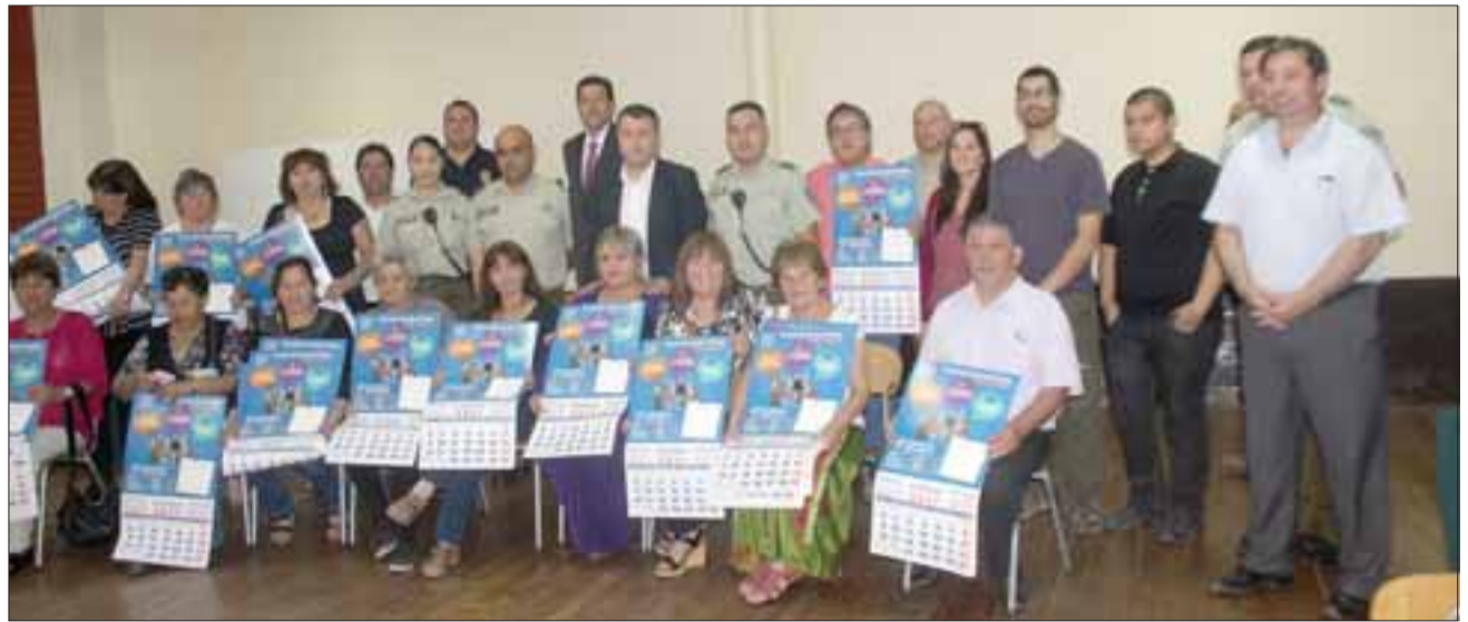
Hacen la entrega de calendarios, con el fin de difundir diversos números de emergencias a la comunidad.

La idea nace a partir de la prioridad asumida por el Gobierno de la presidenta Michelle Bachelet, en cuanto a la prevención y reducción del delito, desarrollan-