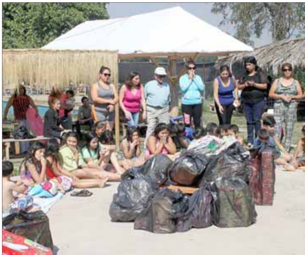
MUCHOS REGALOS. - Eran enormes las bolsas de regalos que los empleados de Correos Chile, de San Felipe, entregaron a los estudiantes de la Escuela San Rafael, durante esta semana.

«Fue una jornada muy especial para todos los niños, quiero agradecer al personal de Correos Chile filial San Felipe, por haber premiado a nuestra escuela, también doy las gracias a nombre de todos los profesores, a los motoqueros, ellos nos donaron la torta y también se involucraron en las actividades de servir, alegrar a los niños y hasta montar en sus motos a los estudiantes y apoderados, fue una alegre locura este