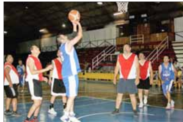
Arturo Prat y Frutexport disputaron el partido por el tercer puesto.

dor del certamen, Exequiel Carvalho, resaltó. "Reunimos a jugadores de los años 80', fue todo muy bonito porque fue un encuentro de amigos donde lo importante estaba en jugar y pasarlo bien, al final quedamos todos felices".