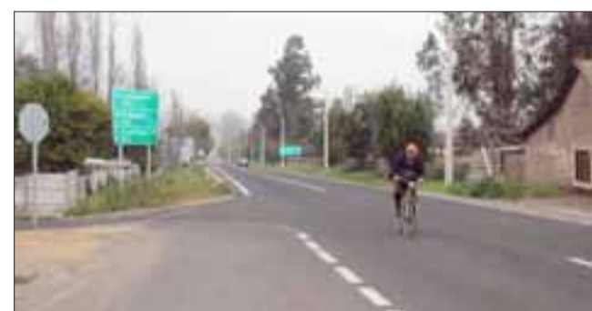
Solicitarán a la Dirección Provincial de Vialidad una reunión en terreno, para en conjunto buscar una solución a la problemática de seguridad vial que enfrenta el Cruce Las Quillotanas.