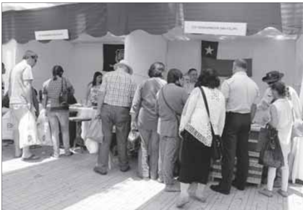
Excelentes ventas logradas durante los días que duró la iniciativa.