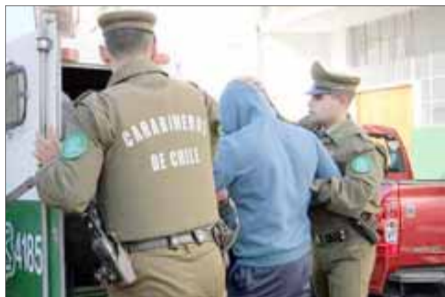
El imputado fue detenido por Carabineros siendo conducido hasta Tribunales por el delito de porte ilegal de arma de fuego y municiones quedando en prisión preventiva.

Tras un patrullaje preventivo realizado por Carabineros de la Tenencia de Catemu, se concretó la detención de un sujeto que portaba entre sus vestimentas, un revólver cargado con su respectiva munición, el que arrojó al suelo al advertir la presencia policial mientras caminaba por la Villa Lican Ray de esa localidad.