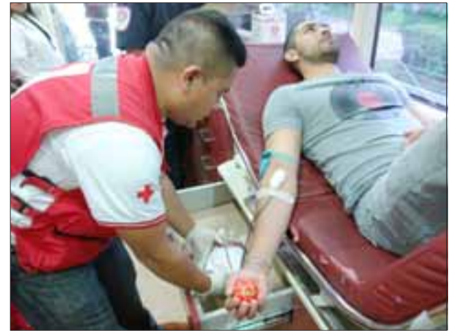
A DONAR.- A partir de las 13:00 y hasta las 18:00 horas de hoy jueves, en la filial de la Cruz Roja de San Felipe se estará recibiendo a donadores de sangre. (Referencial)