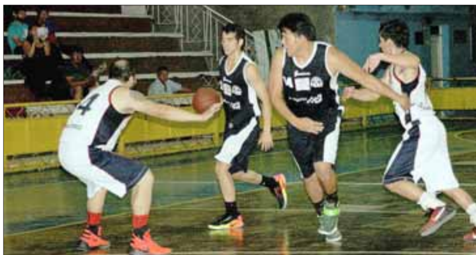
El Prat, hizo lo que parecía imposible al ascender a las ligas mayores del básquetbol chileno.