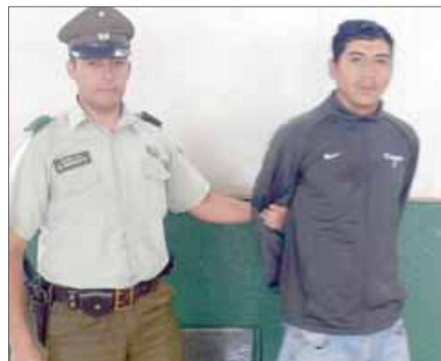
El imputado fue capturado por Carabineros, tras haber cometido el delito de robo por sorpresa, resultando víctima una adulta mayor de 75 años de edad en la comuna de San Felipe.