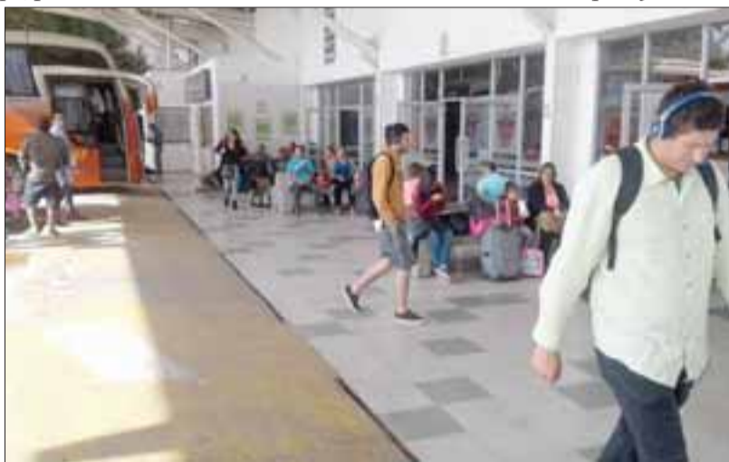
El Terminal Rodoviario experimentará un fuerte incremento de pasajeros en estos días.