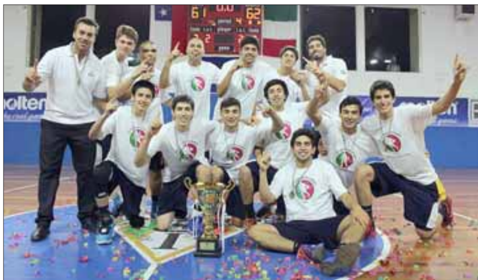
El equipo juvenil del Prat, consiguió el logro de mayor importancia de este 2016 al ganar de manera invicta el Campioni di Domani.

de la Quinta Región, al superar en la gran final a su similar de Unión Peñablanca, en el que se convirtió en el mayor logro del balompié aficionado de nuestra zona durante estos 12 meses.