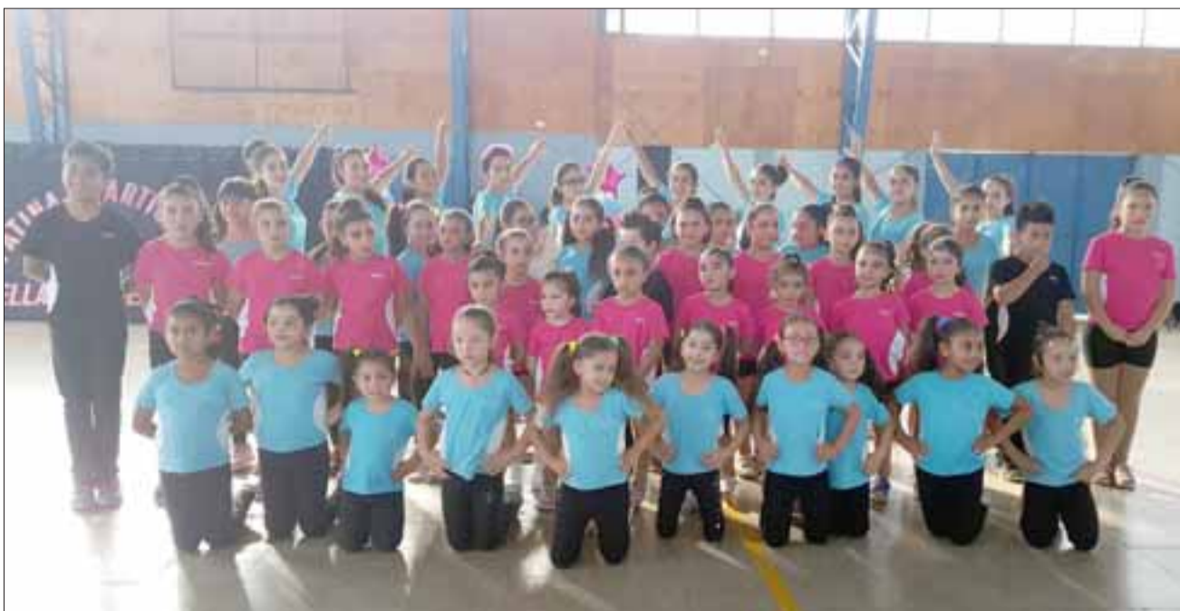
SON LOS MEJORES.- Te presentamos a todo el grupo de campeones del patinaje de nuestra comuna.