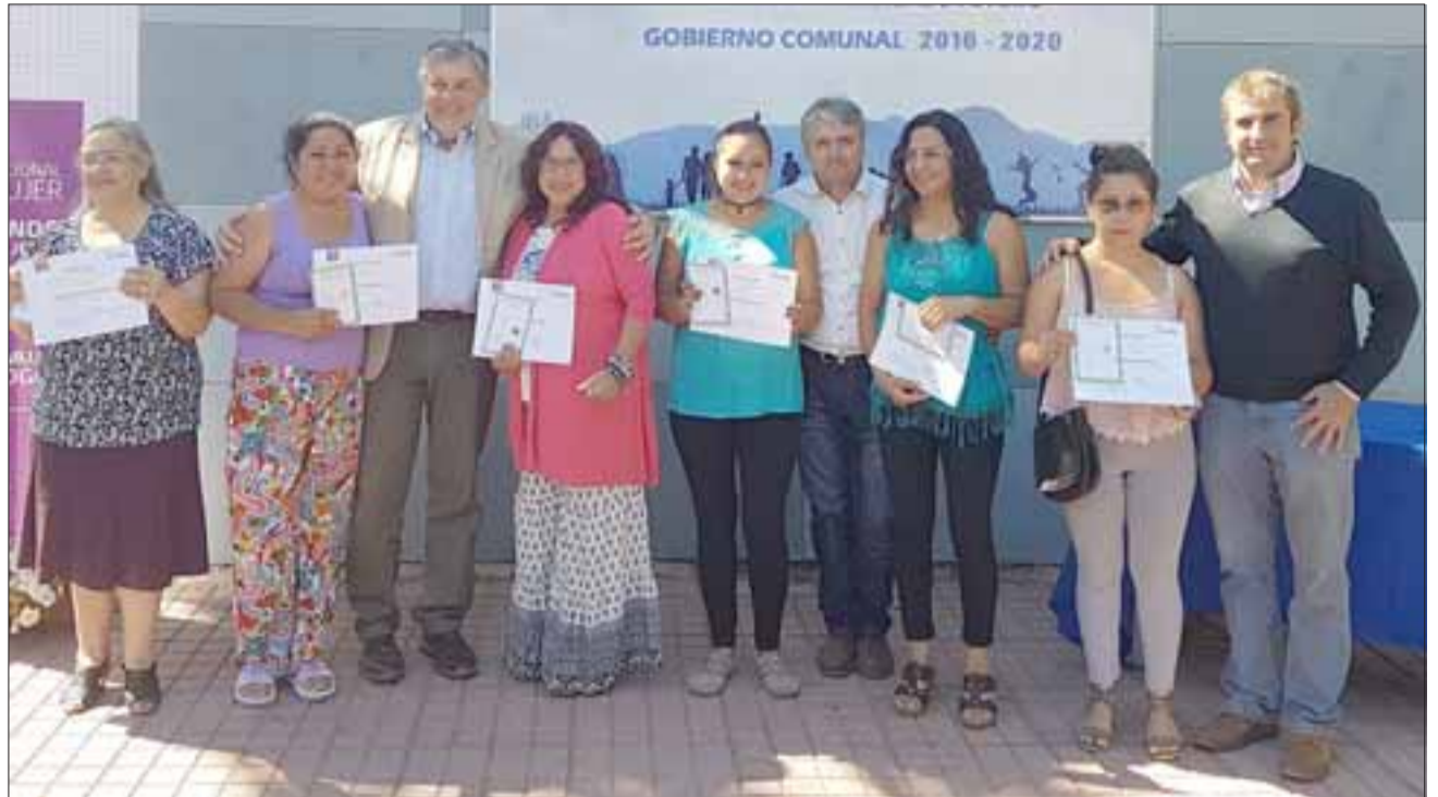
Éxito rotundo tuvo este Programa Mujeres Jefas de Hogar en su versión 2016, con las 80 mujeres de Catemu que participaron.