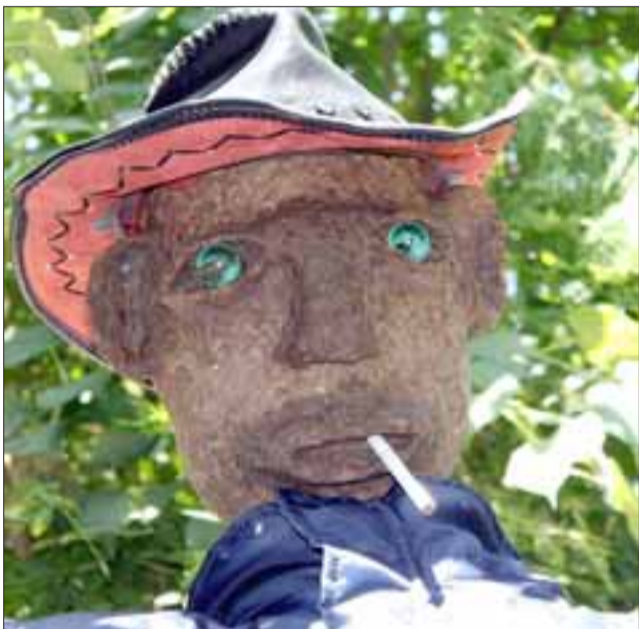
SOY JAIMITO.- Aquí tenemos a 'Jaimito', con sus ojos de vidrio, el sombrero de Indiana Jones y un mortal cigarro.