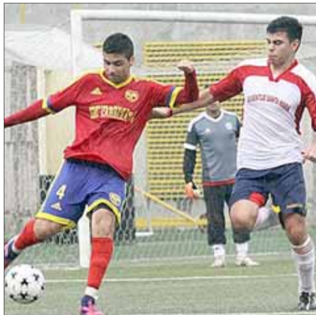
La serie de honor de Juventud Santa María, cumplió una actuación brillante en la Copa de Campeones al llegar a la final.

En la serie Senior Rinconada, avanzó tanto que llegó a convertirse en el mejor