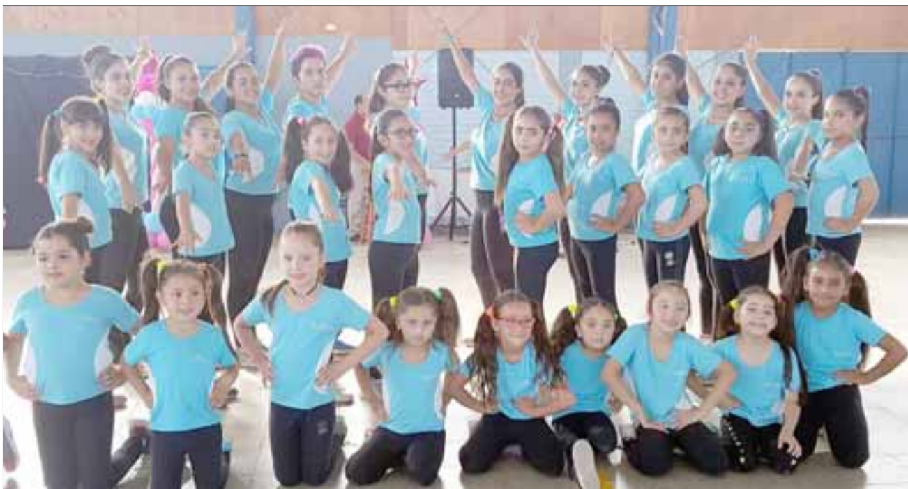
UN AÑO EXITOSO.- Aquí tenemos a nuestras estrellitas del patinaje, ellos son los mejores en su categoría, siempre dispuestos a lucirse y a competir.

Roberto González Short Franklin Azócar Muñoz (colaborador)