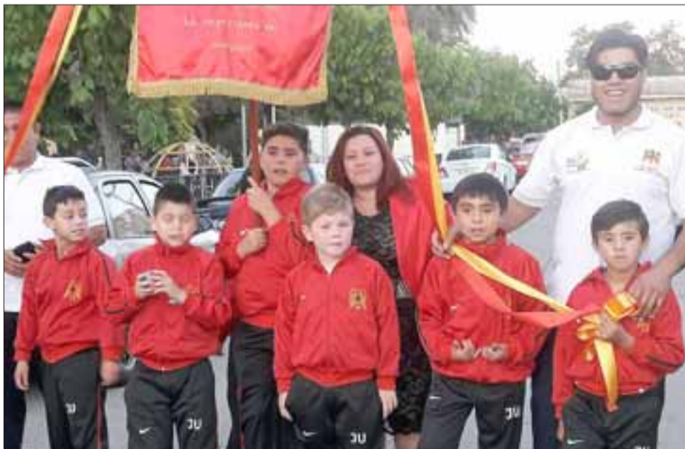
VIENEN EN SERIO.- Ellos son los herederos del club, la Liga Infantil, pues muy pronto tomarán las riendas de este proyecto a fuerza de goles.