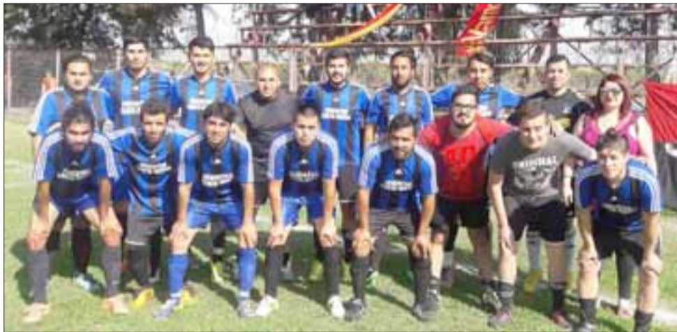
TERCERA ADULTO.- Mucho cuidado con la Tercera Adultos, estos explosivos jugadores no perdonan a nadie.