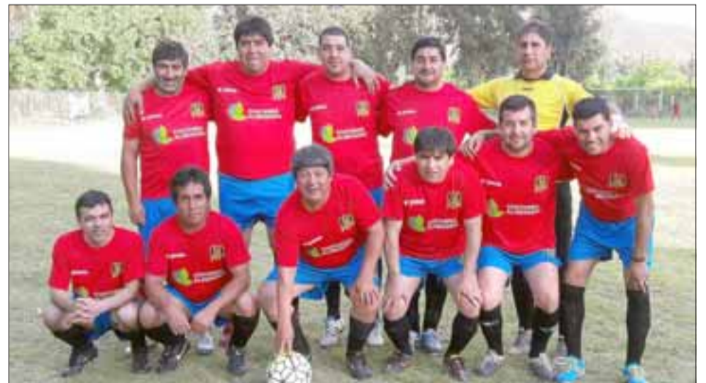
CATEGORÍA SENIOR.- Los más experimentados posan para las cámaras de Diario El Trabajo.