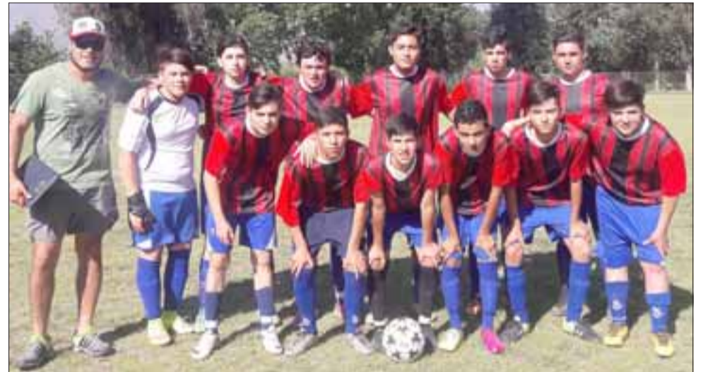
LA JUVENTUD IMPONE.- La liga juvenil del Club Deportivo Juventud Santa María también tiene lo suyo.