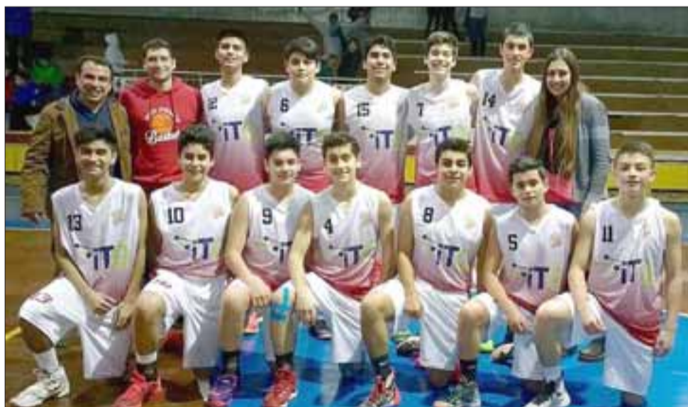
Durante este año, el proyecto deportivo San Felipe Basket maduró de manera definitiva, al ratificarse como uno de los mejores clubes a nivel formativo de Chile.