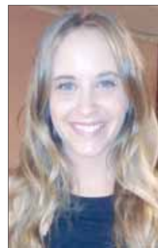
La cantante nacional Consuelo Schuster, además de animar el Festival, hará la presentación de sus mejores canciones durante la primera noche del evento.

Cabe destacar, que en la 1era jornada se presentarán 8 canciones en competencia, dejando solamente 4 artistas concursantes para la segunda noche, momento en que se realizará la premiación del Festival de la Voz de Panquehue, que en su edición VIII, tendrá un