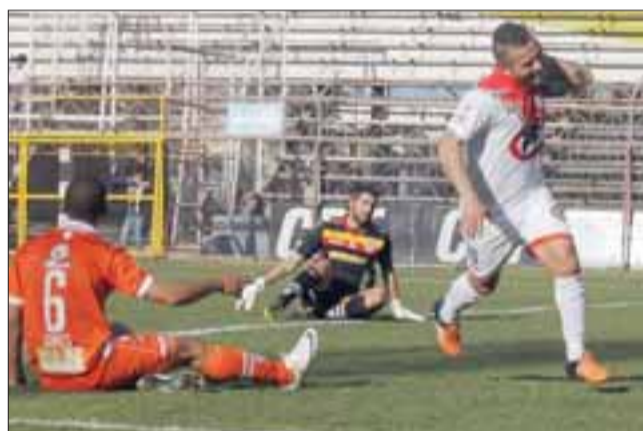
Unión San Felipe tuvo un año solo regular, que no alcanzó para soñar con un ascenso.