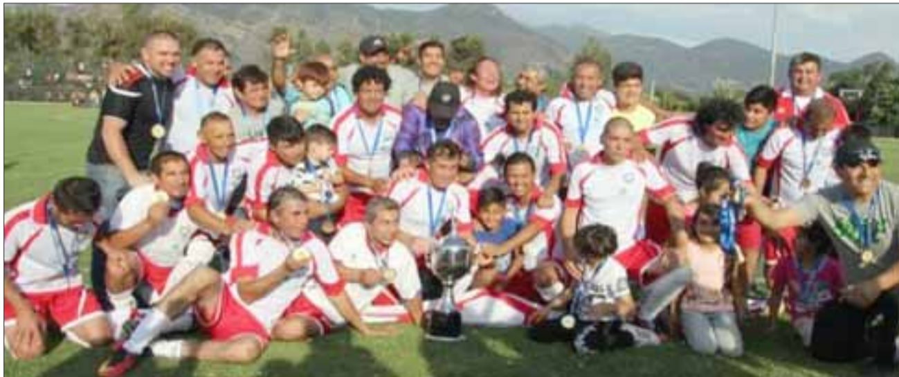
La selección senior de Rinconada de Los Andes, se encumbró a lo más alto al convertirse en campeón regional de la serie.