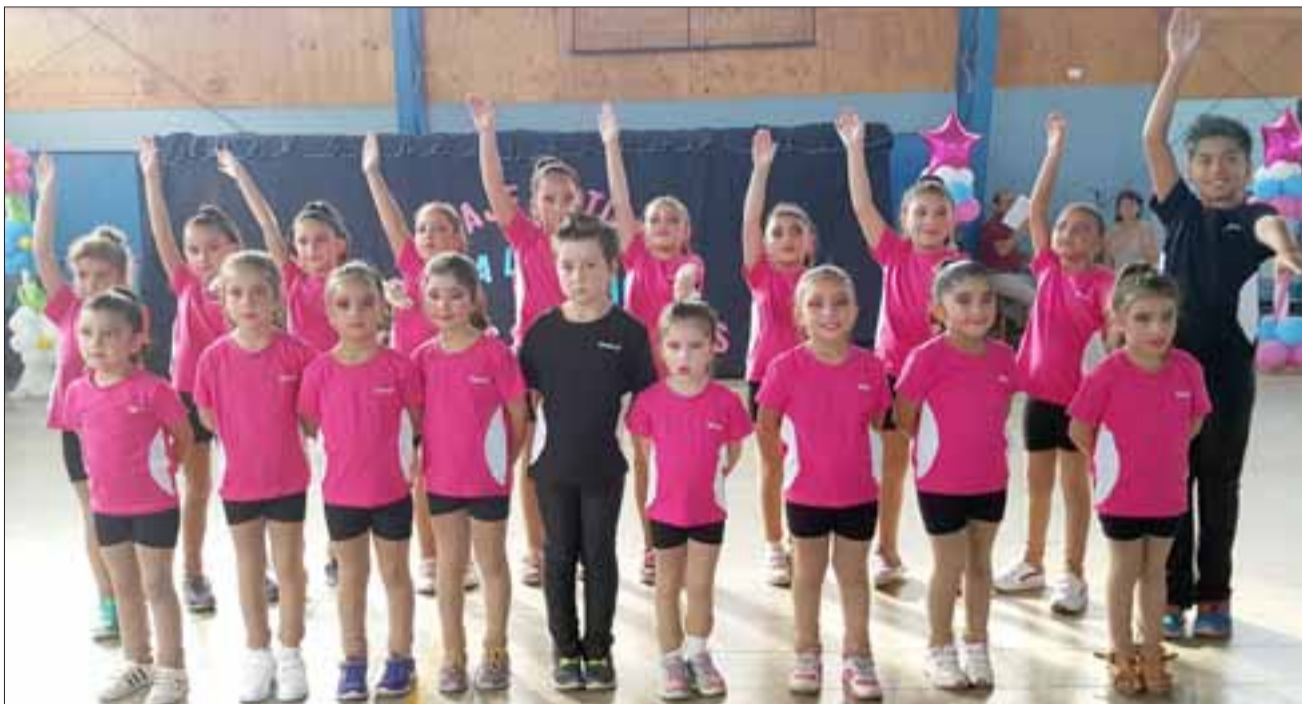
LA ESCUELITA.- Aquí tenemos a los más nuevos del club, ellos y ellas pronto estarán cosechando copas y medallas, si se esfuerzan por ellas.