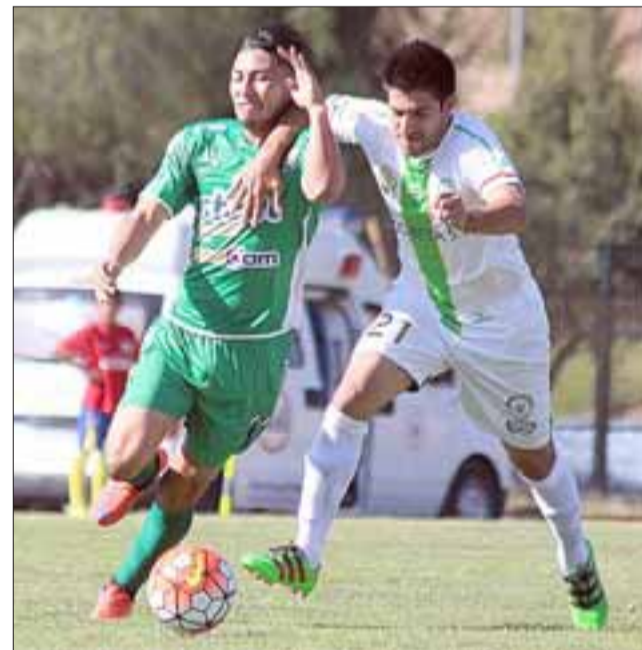
El año que expira, no fue productivo para un Trasandino que está apremiado por el descenso a la Tercera A.