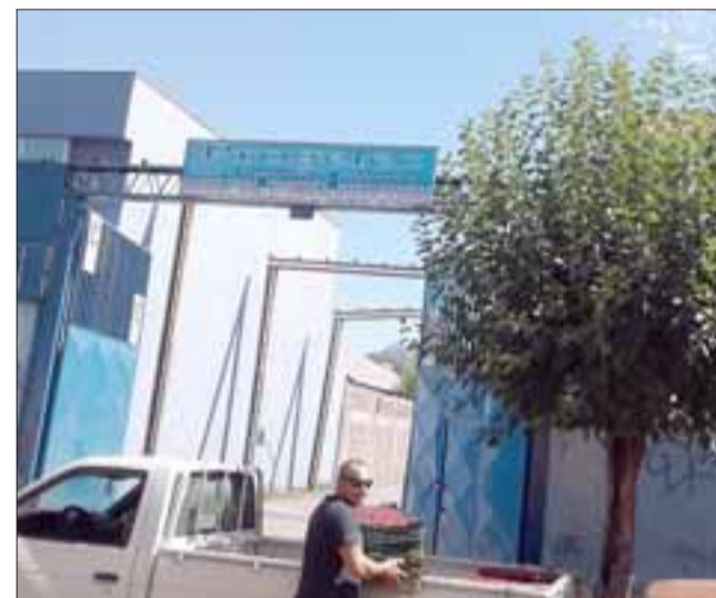
La entrada a la empresa Progelec.