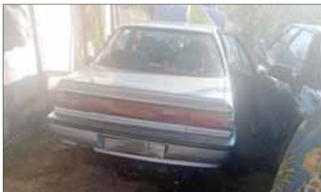
El vehículo marca Honda Civic, fue hallado en un domicilio en la Villa Nueva Algarrobal de San Felipe sin sus placas patentes.