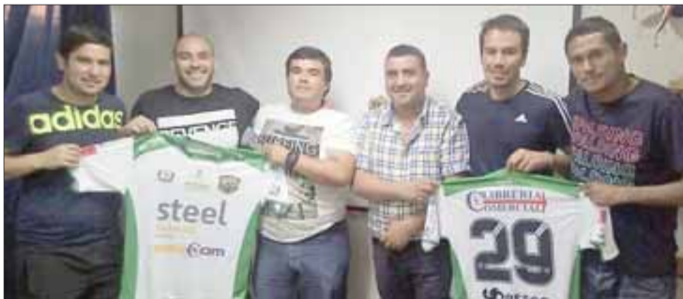
El nuevo cuerpo técnico de cadetes de Trasandino, tendrá la responsabilidad de formar de la mejor manera a los futuros jugadores del club de Los Andes.