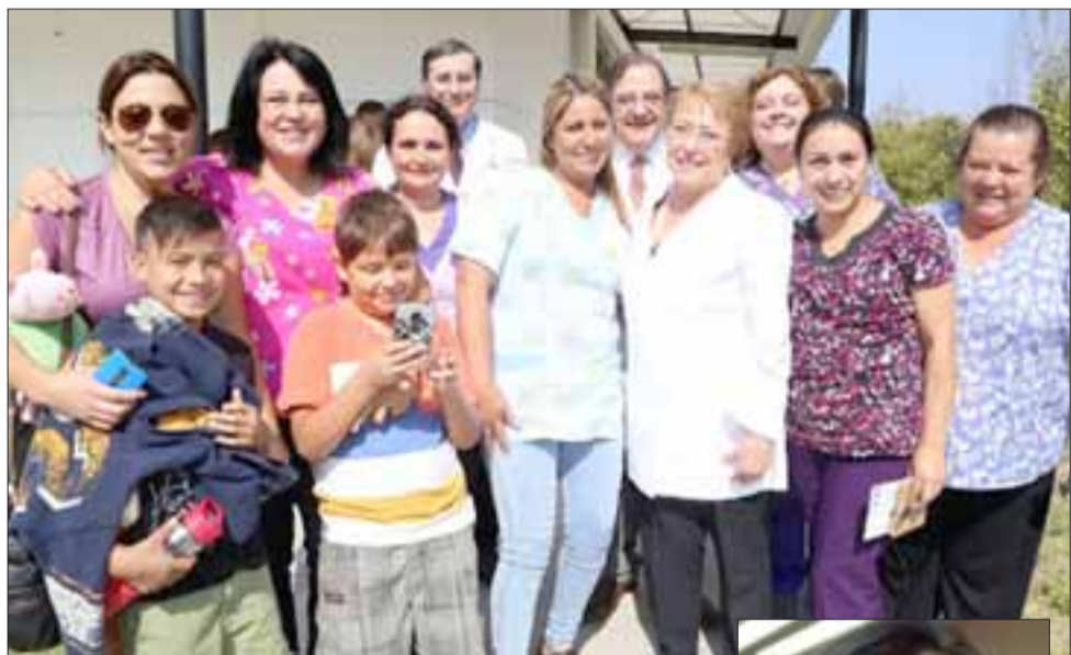
CAMPAÑA PREVENTIVA. - La presidenta Michelle Bachelet, visitó el centro de rehabilitación en Santiago, para apoyar personalmente una campaña contra el uso de la pólvora en nuestro país.