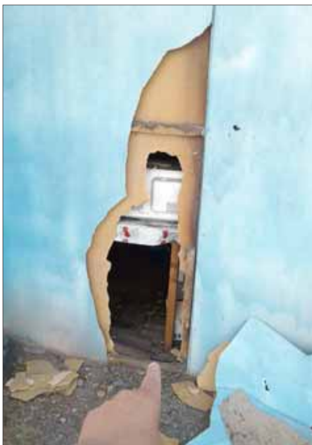
Este es el forado por el costado de la empresa que hicieron para ingresar.