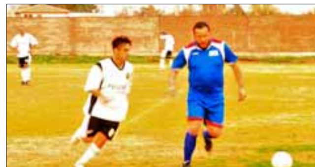
Los clubes sanfelipeños competirán en la Copa de Campeones, Afava y el Selim Amar Pozo.

en el Amor a la Camiseta, quedando solo por dilucidar si Juventud Antoniana de Curimon, soluciona algunos temas internos para así poder mantenerse en acción durante la primera parte de este año.