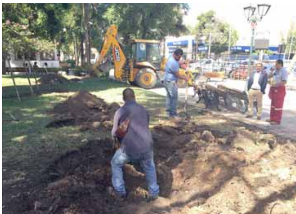
Personal municipal dio inicio al proceso de reposición de árboles de la Plaza de Armas, en reemplazo de aquellos que han sido retirados como consecuencia del cumplimiento de su vida útil.

Añadió que “hemos planteado un plan de arborización, tenemos considerado plantar cien especies en la Plaza de Armas y casi doscientas especies en las alamedas, pues queremos tener estos espacios revitalizadas. Al mismo tiempo queremos atacar un problema puntual que tiene que ver con los árboles más añosos y así, de manera serie y segura, respetando los árboles que no son necesarios de rebajar o cortar,