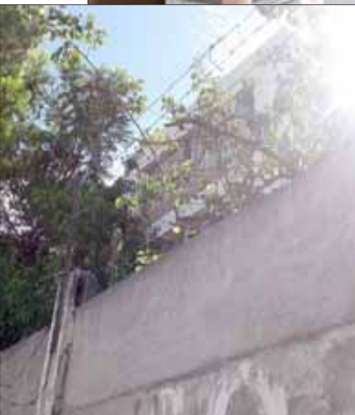
El alambrado que supuestamente cortaron los delincuentes para ingresar al patio de la empresa.