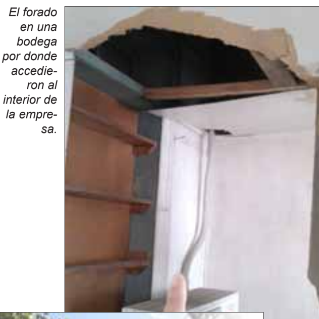
El forado en una bodega por donde accedieron al interior de la empresa.

Esta es la segunda vez que entran a robar, concurriendo a realizar la denuncia ante la policía.