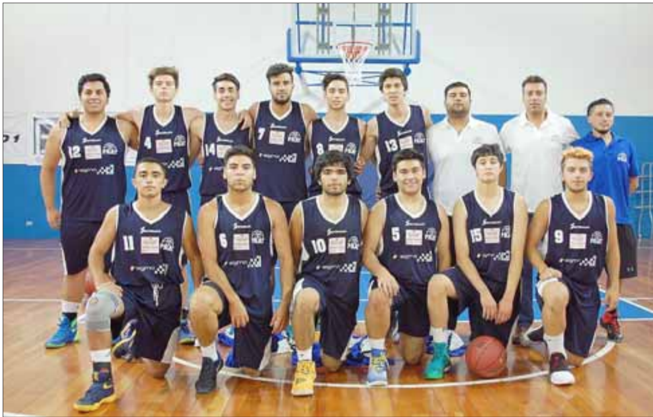
En lo que va de Domani, el equipo del Prat ha perdido tres y ganado dos encuentros.

En el juego de ayer las mejores manos y figuras del Prat, resultaron ser los re-