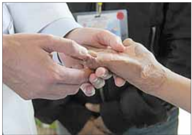
NI UNO MÁS. - Según datos de Coaniquem, en el Valle Aconcagua se atiende un promedio de 150 niños de forma permanente, por eso esta campaña está dirigida para nuestras diez comunas. (Referencial)

Verdes para este fin. Los lectores interesados en participar en esta campaña, pueden llamar al 976952377 . Roberto González Short