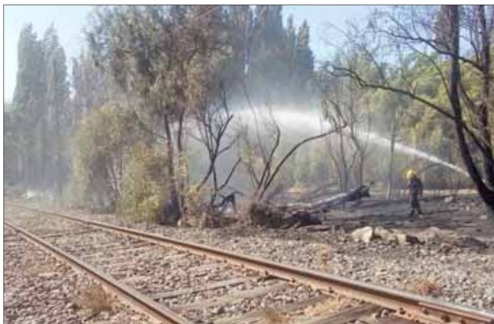
Personal de bomberos trabajando en el incendio de pastizales en El Peñón.