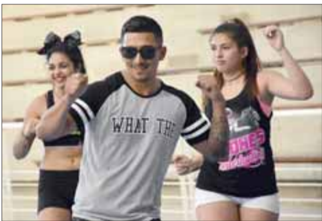
Con entretenidas muestras de cheerleaders, voleibol, baile entretenido, entre otros, se dio por inaugurada la parrilla de talleres abiertos a la comunidad que la Municipalidad de Llay Llay dispuso para este verano.

LLAY LLAY.- Con entretenidas muestras de cheerleaders, voleibol, baile entretenido, entre otros, se dio por inaugurada la parrilla de talleres abiertos a la comunidad que la Municipalidad de Llay Llay dispuso para este verano.