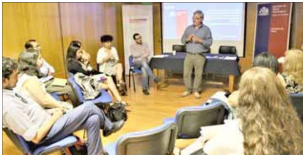
Instancia de carácter regional, que busca establecer un marco político estratégico común, fortaleciendo el vínculo con la comunidad, reconociendo las distintas formas de participación y promoviendo el enfoque de derechos ciudadanos.