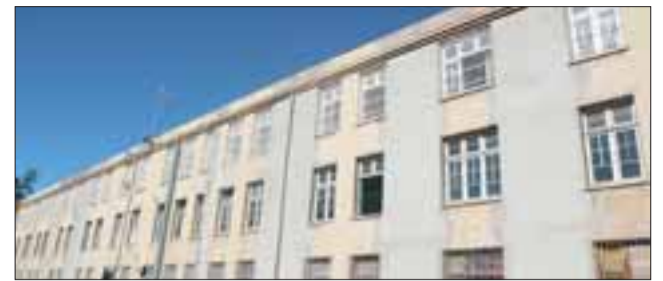
Uepi del Hospital Psiquiátrico Philippe Pinel de Putaendo.