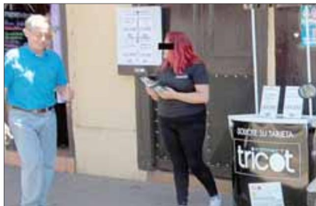
OFERTAS DE ENERO. - En plena vía pública esta tienda tiene a sus empleados ofreciendo estas 'ofertas', pero ya hay varios reclamos por algunos de sus productos y servicios.