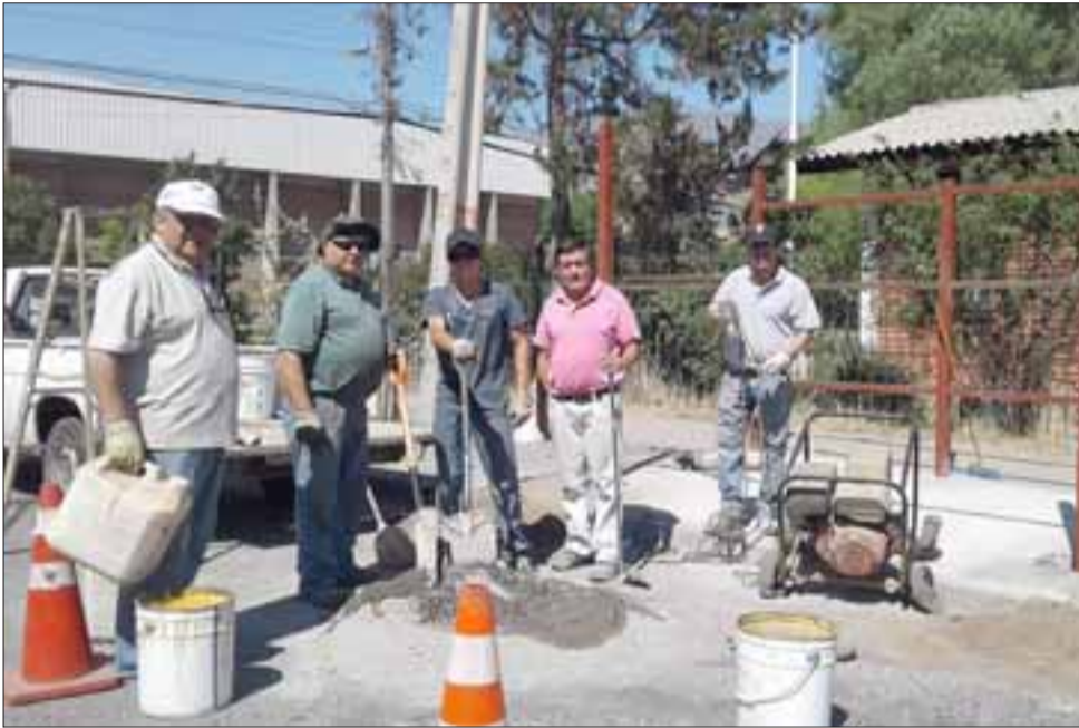
El grupo de trabajadores posando para nuestro lente, le quitamos un minutito.

Según lo que pudimos averiguar, el paradero ya estaría en condiciones de poder ser utilizado por la comunidad.