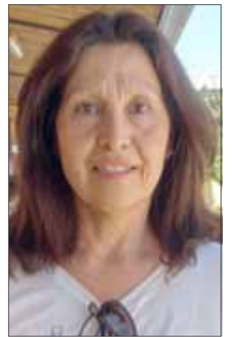
Karate, baile y piscina son algunas de las actividades que realizan los niños, tanto en la Escuela Bernardo O'Higgins, como en la Escuela Carolina Ocampo de Bellavista.

Cabe mencionar, que aún es tiempo para que las familias sanfelipeñas inscriban a