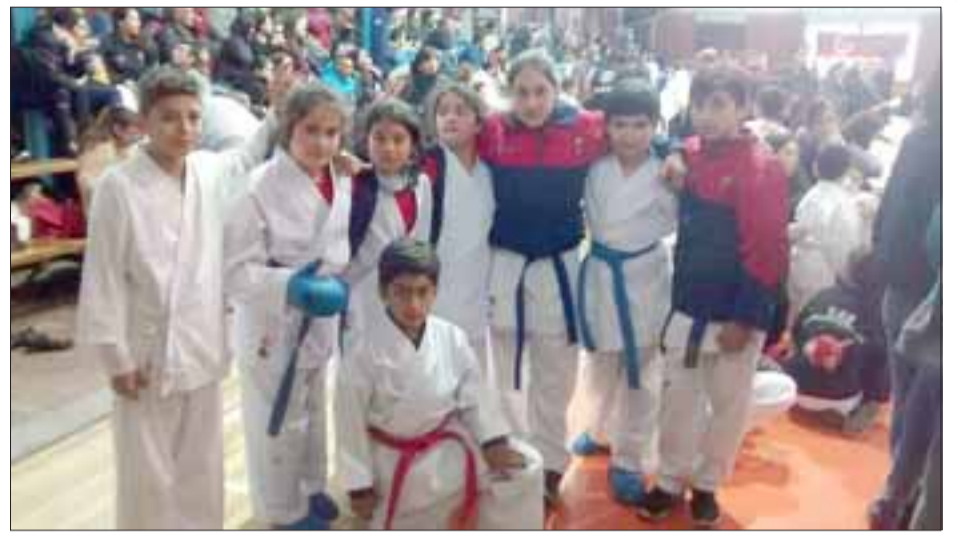
LOS MEJORES.- Ellos son los valientes guerreros del Club Deportivo Catemu Karate.