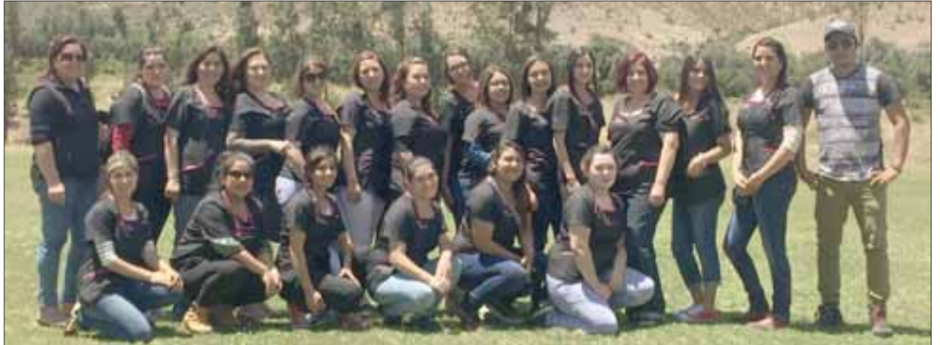
Estudiantes de la Academia de Belleza Amelia Jurgens ofrecieron atención estética a usuarios de la institución de salud mental. Actividad que se realiza en el establecimiento desde hace dos años.