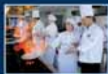
Taller de Gastronomía