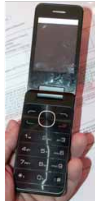
¿VENDEDORA CON VISTA DE RAYOS X? Sin ser nosotros expertos y tras una revisión externa al aparato, evidentemente éste no muestra signos visibles de golpes.