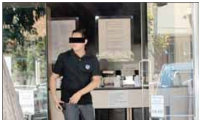
TRICOT NO RESPONDE. - En esta tienda, ubicada en Portus con Merced, es en donde su administradora se niega a recibir el celular a este adulto mayor.