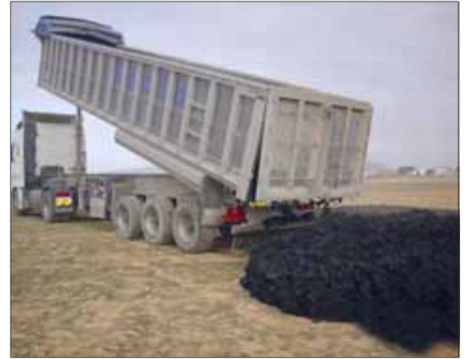
Camión descargando lodos contaminados. (Foto Referencial).

«Este barro debió sacarse rápidamente del lugar mañana a primera hora (ayer), en un ca-