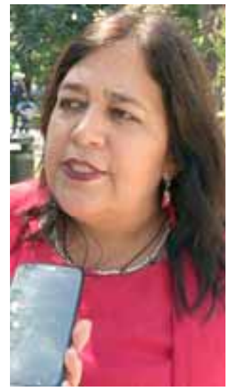
Ximena Rivillo, subdirectora nacional del Servicio Nacional de Capacitación y Empleo, Sence.

culación entre organismos públicos y privados, sindicatos, gremios”, apuntó, agregando que “estamos llamando también a las corporaciones, fundaciones, los municipios, a que presenten proyectos y que la comunidad se acerque a través de las Omil y de la misma atención que hacemos en la gobernación, para poder solicitar esta