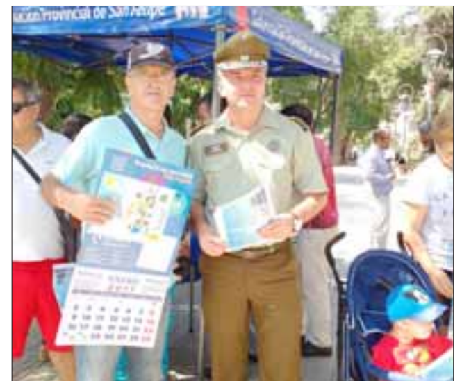
El comisario de Carabineros de San Felipe, mayor Héctor Soto Möeller en la campaña ‘Verano Seguro’.

Si la familia se desplaza en vehículo, revisar el estado mecánico del móvil, ya sean luces, frenos, llevar un botiquín de primeros auxilios, portar documentación personal y del vehículo al