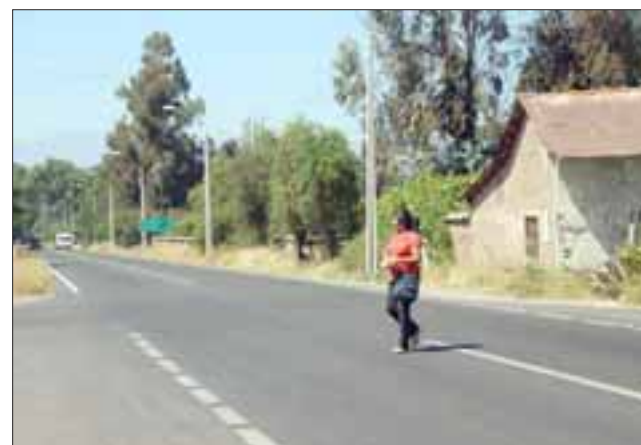
Cruce Las Quillotanas, al ingreso a Rinconada de Silva en la carretera E-71 que une Putaendo con San Felipe.