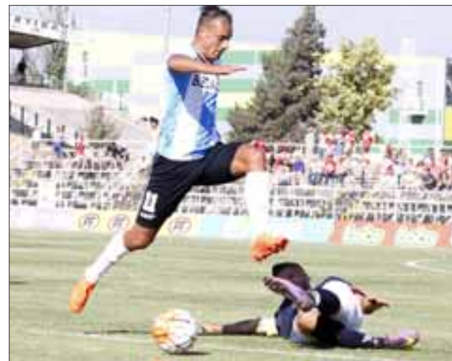
El sábado próximo, Unión San Felipe deberá ponerse de pie para enfrentar a Rangers en el Municipal.

Viernes 20 de enero 19:00 horas, Barnechea – Malleco Unido Sabado 21 de enero 16:00 horas, Lota Schwager – Deportes Melipilla 18:00 horas, La Pintana – Naval 19:00 horas, Trasandino – Colchagua 20:00 horas, Santa Cruz – Vallenar Domingo 21 de enero 18:00 horas, Independiente de Cauquenes – San Antonio Unido