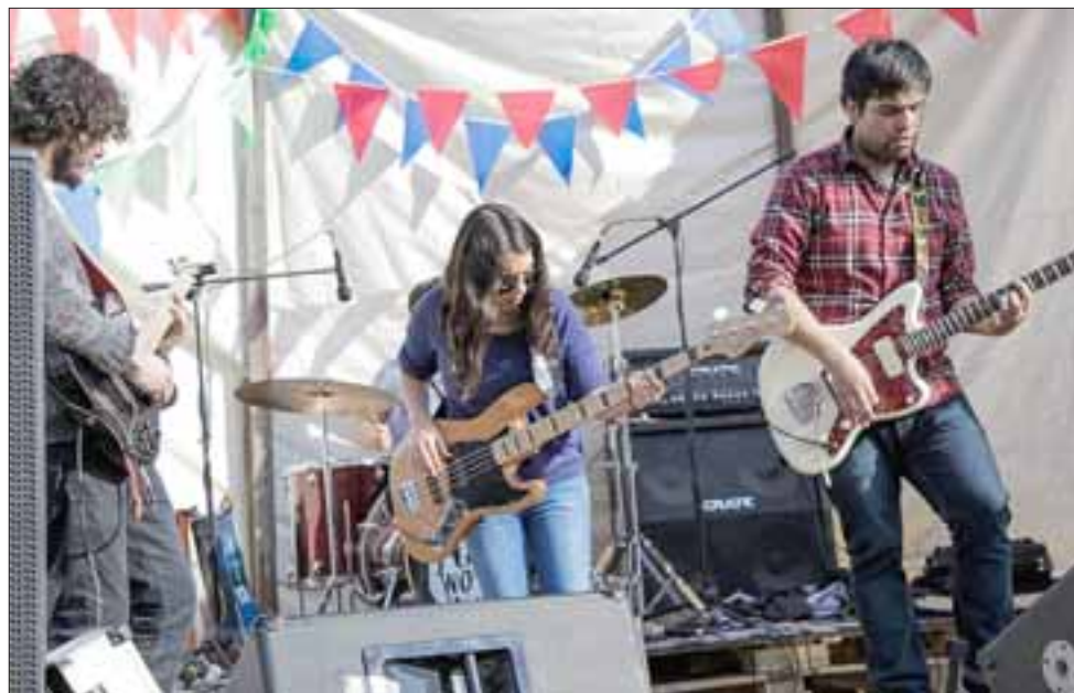
IMPARABLES.- Aquí tenemos a estos jóvenes músicos sanfelipeños haciendo de las suyas con su rock instrumental.

Hoy continuamos con las bandas musicales de nuestra comuna, ayer lunes hablamos con los chicos de Droste , una agrupación musical que ya tiene un CD grabado, esta banda expone estilos como el stoner; el post rock; el shoegaze y el rock progresivo.