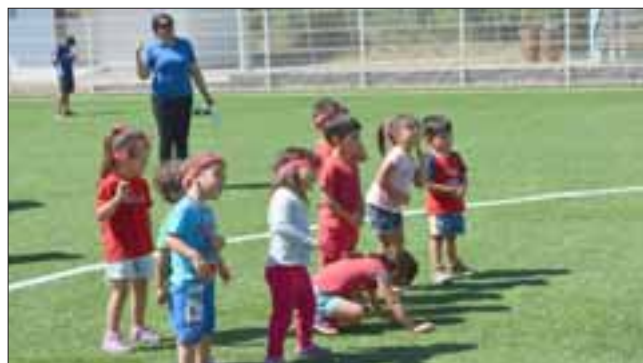
La iniciativa promueve la actividad física, el deporte y la vida saludable, en los niños que concurren a los Jardines Infantiles administrados por la Municipalidad de Santa María.

SANTA MARÍA.- Fomentar la actividad física, el deporte y la vida saludable en los niños que concurren a los Jardines Infantiles administrados por la Municipalidad de Santa María, fue el objetivo del proyecto 'Olimpiadas por la Infancia', que ejecutó el Jardín Infantil Campanitas de Jahuel.