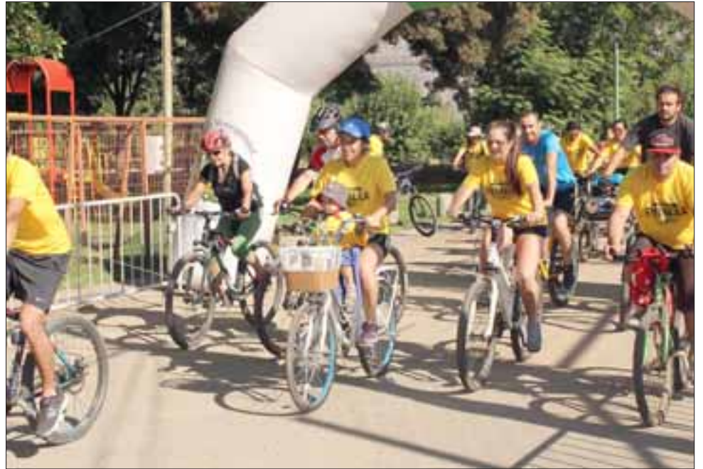
Tras la inscripción de los ciclistas, se realizó un espacio de acondicionamiento físico y de esta forma evitar algún tipo de lesión muscular en los participantes.

"Tuvimos una importante cantidad de participantes en esta tercera versión de la cicletada familiar, considerando que fue un día domingo donde muchos ya están de vacaciones, pero creemos que el objetivo está logrado, ya que nosotros estuvimos apostando por una participación en familia y notamos que hubo familias que llegaron con sus