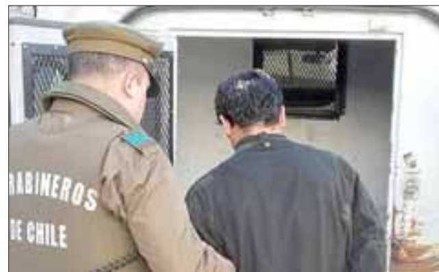
El imputado fue capturado por Carabineros para quedar a disposición de la Fiscalía.