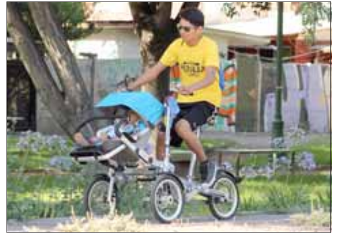
Todos los competidores fueron aceptados, como vemos en la imagen, un bebe de pocos meses de edad no fue la excepción y recorrió el trayecto junto a su ingenioso padre.

Al término del circuito, los participantes junto con recibir fruta para su hidratación, participaron de un sorteo, recibiendo implementos para sus bicicletas como de regalo.