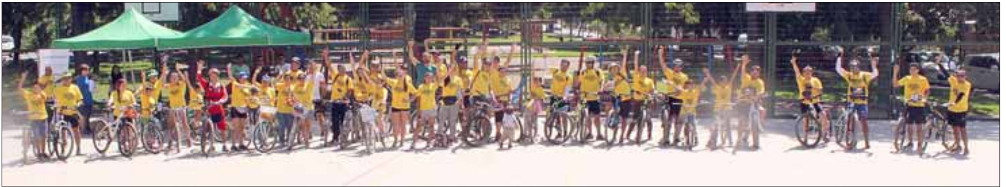
La tercera versión de la cicletada familiar 'Panquehue Pedalea', estuvo orientada a la participación de la comunidad en familia.