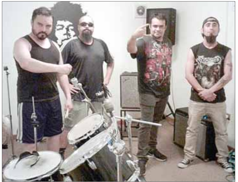
DEMONTRES.- Normalmente una banda de death metal, está compuesta por un cantante, dos guitarristas, un bajista y un baterista, es decir, la formación estándar del heavy metal.

Según este músico cuarentón, a finales de este mes ellos estarán haciendo de las suyas en uno de los festivales de rock más duros del país, el que se realizará en Ovalle, «el próximo sábado 28 de enero arrancamos con nuestra gira nacional, estaremos en Ovalle, ciudad a la que llegamos las