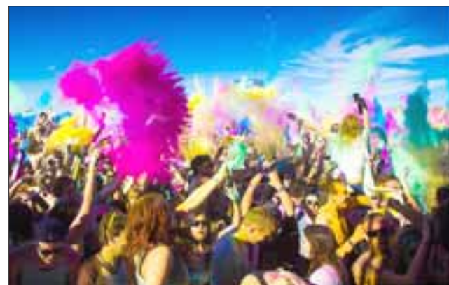
LOS COLORES DEL TIEMPO.- Una explosión de colores, música y danzas en vivo es lo que este jueves nos trae la empresa francesa Artonik a nuestra comuna. (Foto Referencial)

«Una vez que este carnaval logra instalarse en el centro de San Felipe, los presentes serán sobrepasados por la energía destructora, llegará la toma de conciencia, el trance y la purificación, para después llenar el suelo de fi-