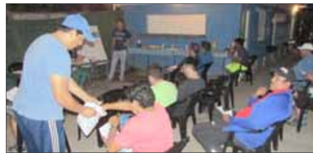
Dirigentes de los equipos de distintas partes de la quinta región, estuvieron presentes en el sorteo del campeonato de la Semana Troyana.

4ª hora: Juventud La Troya (San Felipe) v/s Juventud Lo Garzo (Quillota)