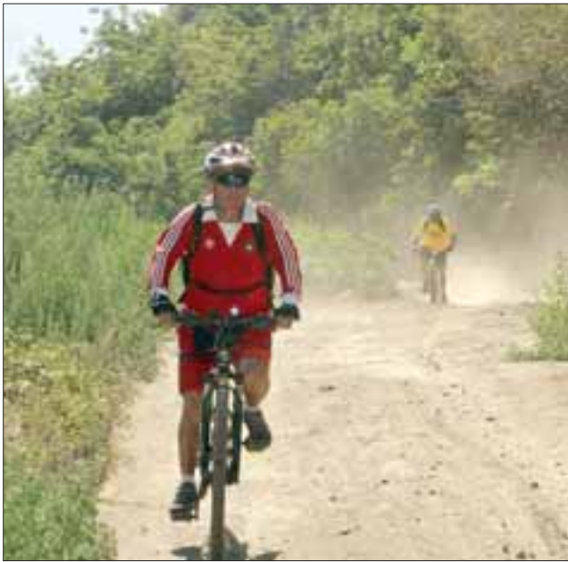
Los ciclistas realizaron distintos recorridos, el de 8 kilómetros hasta el sector de Viña Errázuriz y el de 16 kilómetros que incluyó varios sectores interiores, tales como La Ensenada, Lo Blanco y Orocoipo.