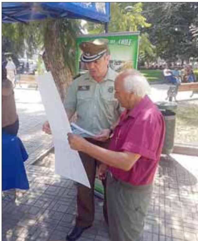
Con la entrega de calendarios Carabineros y la Gobernación dialogaron con los vecinos para evitar delitos e incendios forestales en la región durante el periodo estival.