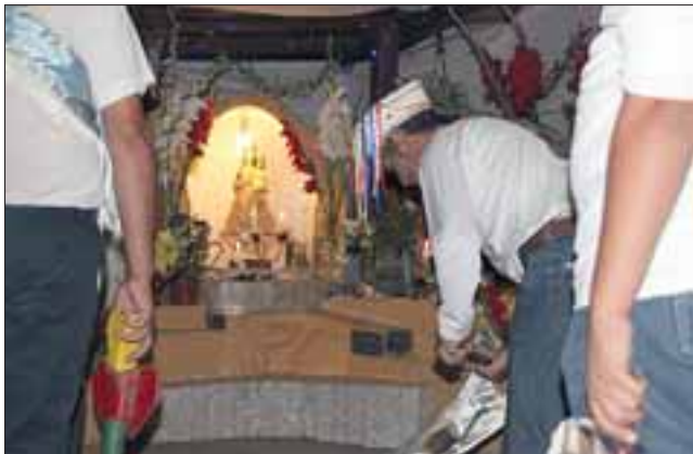
Tradicional Velorio a la Virgen de Andacollo.

estas expresiones religiosas son un aliciente que demuestra que tradiciones tan propias de comunas como Putaendo aún siguen vigentes.