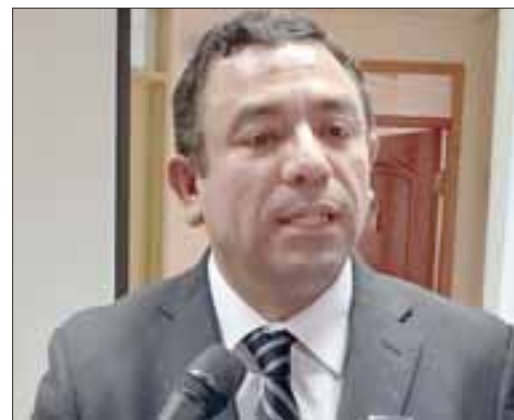
Fiscal del ministerio Público de San Felipe, Benjamín Santibáñez.