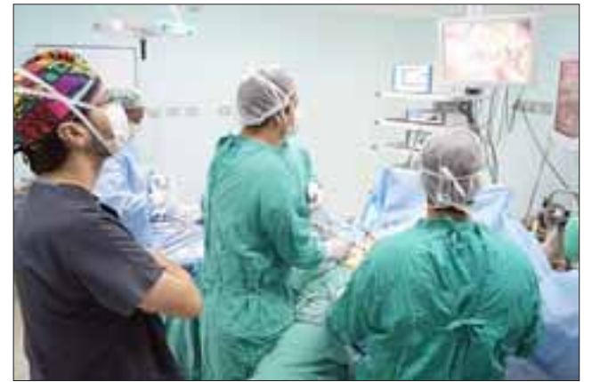
MEJORANDO EN TODO. - En este proceso, se miden los ámbitos de la Dignidad del Paciente; la Gestión Clínica; seguridad del equipamiento y de las instalaciones, así como de los procesos de apoyo diagnóstico y terapéutico.

De acuerdo a la profesional, esta reacreditación es una potente herramienta para trabajar con mayor cla-