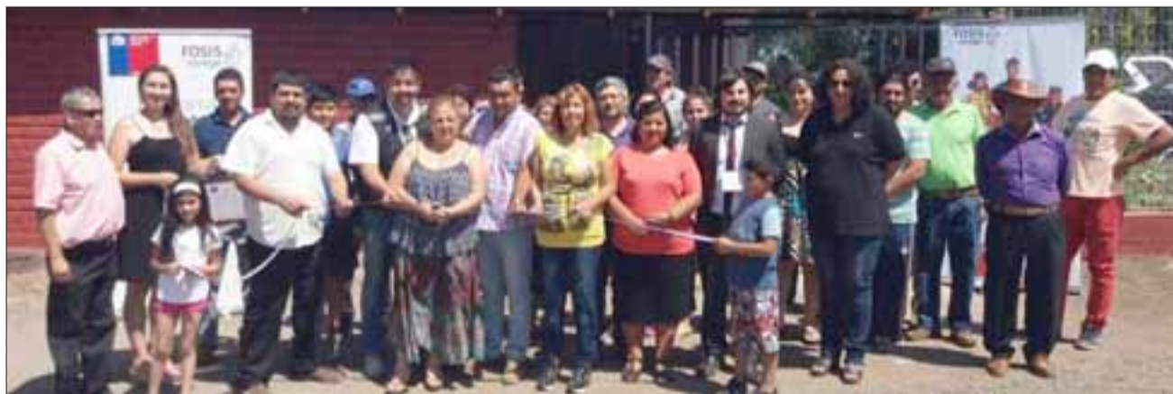
EL COBRE.- El sector de El Cobre, en San Esteban cuenta ya con un nuevo proyecto a desarrollar, como es el rescate de la cancha de fútbol de la comunidad andina.