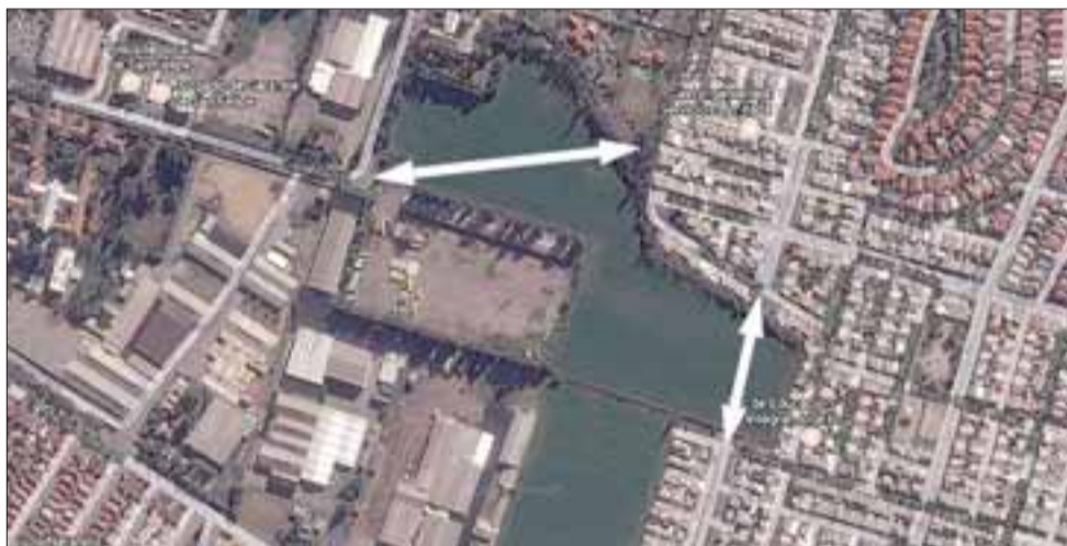
San Martín y Herrmanos Carrera, dos arterias que se extenderían con este proyecto.

«Mañana (hoy) nos juntamos con los dueños de los dos lotes del predio, para poder llegar a acuerdo con el precio, tenemos valores comerciales además para los metros que se van a expropiar, una vez levantada la licitación deben contarse 30 días, es decir, ésta se está cerrando a mediados de febrero, por tanto, si nos va bien en la licitación y llegan oferentes, nosotros podríamos tomar posesión del sector a fines de marzo», anticipó Paredes.