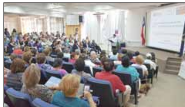
Con más de 200 participantes se dio inicio a la I Escuela de Verano ‘Los Mayores a la Universidad’ en el Valle del Aconcagua.

Dupré agregó que “esto ha sido un éxito, estamos muy contentos, tenemos alrededor de 200 adultos mayores que están participando de la I Escuela de Verano que estamos realizando con la Universidad de Valparaíso y las Gobernaciones de San Felipe y