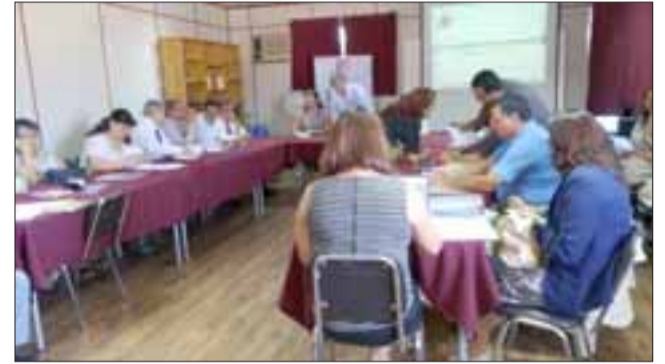
Sostenedores de establecimientos educacionales municipalizados y subvencionados, de las Provincias de San Felipe y Los Andes, se reunieron en torno a mejorar los índices de calidad de sus escuelas.

AVISO: Por robo quedan nulos cheques N° 1 y desde N° 3 al N° 50, Cuenta Corriente N° 000070510987 del Banco Santander, Sucursal San Felipe. 18/3