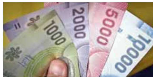
El imputado reconoció el hecho quedando a la espera de citación de la Fiscalía que investigará el caso. (Foto Referencial).

El detenido fue identificado con las iniciales H.O.H.H. de 29 años de edad, quien fue dejado en libertad por instrucción del Fiscal de turno, quedando a la espera de cita-