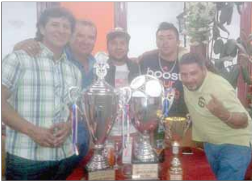
UNIÓN DELICIAS.- Ellos son los campeones generales 2017, recibiendo sus copas.