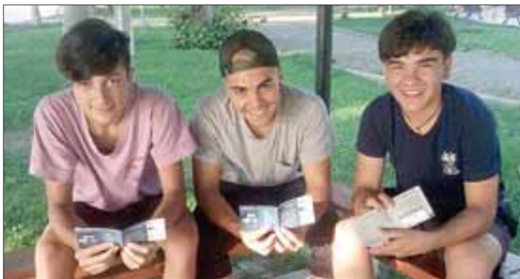
CAMPAÑA SIGUE. - Estos jóvenes bromeaban luego de recibir los folletos informativos de las voluntarias.