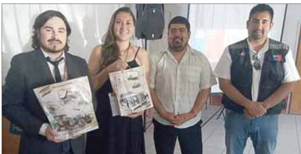
Cerca de 100 beneficiados pertenecientes a zonas rurales de las comunas de Putaendo y San Esteban, recibieron aportes del Programa Acción de Fosis, para la recuperación de espacios comunes de su localidad.

importantes programas como estos, porque buscan y generan un fortalecimiento organizacional en las comunidades que se intervienen. Acá hay talleres de diferentes índoles y temáticas, y al final del proyecto hay un monto de inversión que la misma comunidad define en que invertir. En el caso de Los Patos, se decidió mejorar la escuela de la comunidad, un lugar en donde generar acciones en pro de la comunidad. Estos programas buscan el fortalecimiento de la participación y el trabajo asociativo de las per-