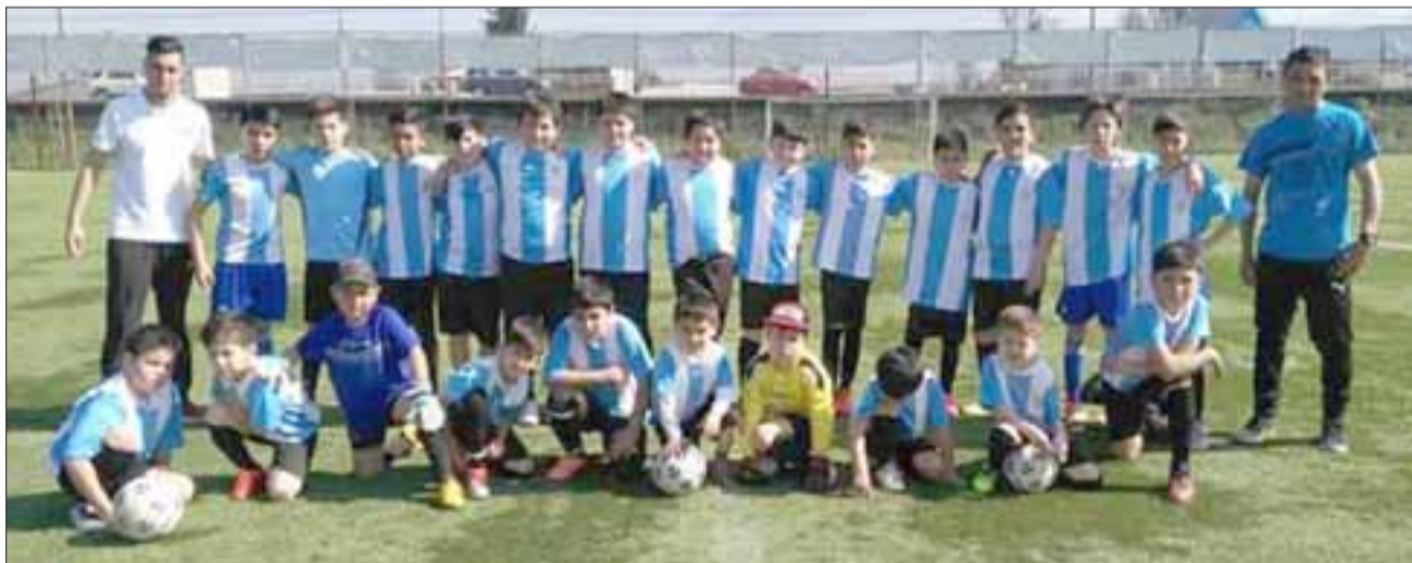
ESCUELA DE FÚTBOL.- En las instalaciones del estadio Los Libertadores de la localidad de La Pirca, los menores interesados podrán inscribirse para participar de este programa deportivo.

Por lo mismo lo que estamos haciendo es un llamado para que los menores se presenten en el estadio Los Libertadores, nosotros tenemos una escuela de fútbol muy bien implementada, con el apoyo del municipio”.