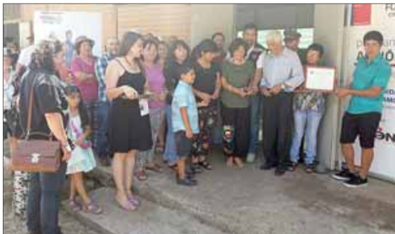
LOS PATOS.- El programa, entregará recursos para rescatar las dependencias en donde se encontraba la escuela básica en la localidad cordillerana de Los Patos, Putaendo.

El sector de El Cobre, en San Esteban cuenta ya con un nuevo proyecto a desarrollar, como es el rescate de la cancha de fútbol de la localidad, iniciativa en la que ya están trabajando los dirigentes de las distintas organizaciones sociales, junto a la participación de las familias que integran esta comunidad.