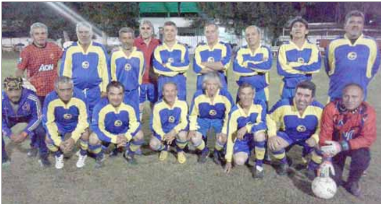
En el regreso de la competencia, Tsunami jugará en el segundo turno con Andacollo.