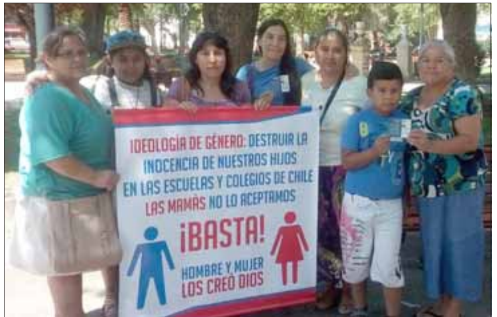
SOMOS MILLONES. - En San Felipe por ejemplo, ayer martes varios activistas de Somos Millones hicieron acto de presencia en nuestra comuna, Los Andes y Santa María.