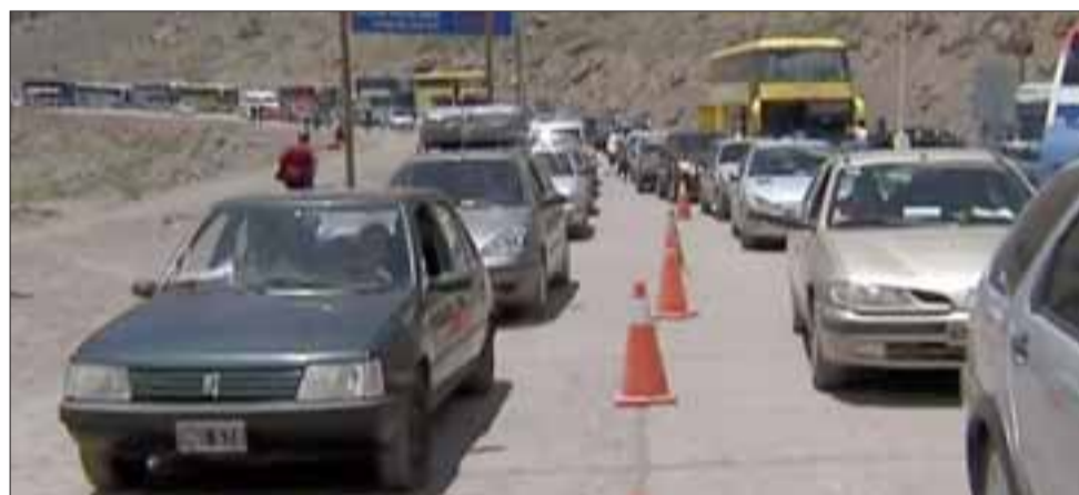
Interminables filas de vehículos ha provocado en los últimos días, la elevada afluencia de turistas procedentes de Argentina.