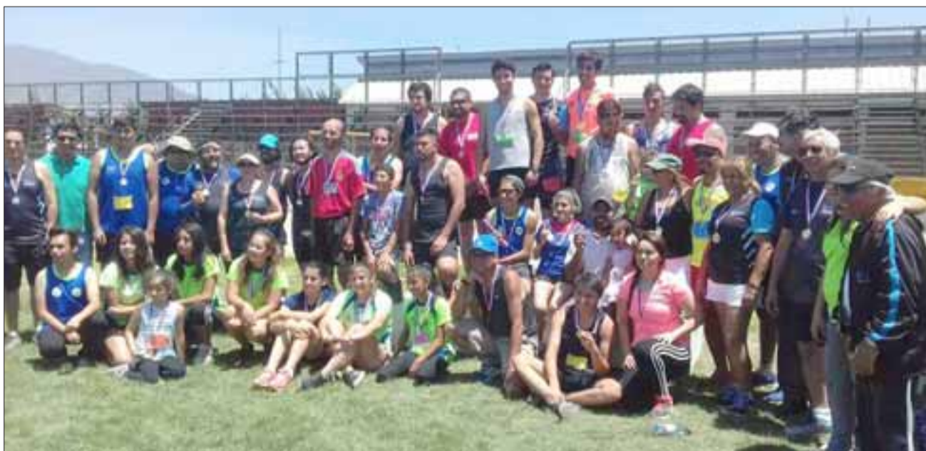
Competidores de la región y la capital, se dieron cita en el torneo atlético de Llay Llay.