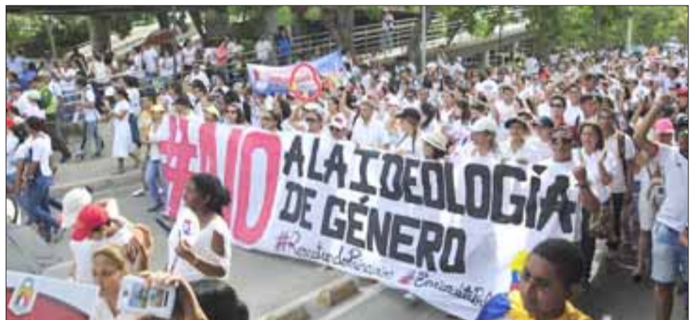
OLA MUNDIAL. - En varios países del mundo ya se están generando multitudinarias marchas contra este modelo educativo. (Referencial)

tas han vulnerado el derecho de los padres a educar a los hijos en sus creencias, ya que detrás de estos aparentes y justos DD.HH. de las mujeres, se esconde una reingeniería social marxista que va en contra de las creencias, las convicciones paternas, lo cual ha llevado a padres detenidos en Alemania por no llevar a sus hijos a estas clases; masivas protestas en Italia, en Francia y en Puerto Rico.