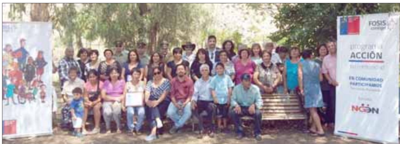
A través del trabajo grupal, se subsidiarán iniciativas que ayuden al progreso y a la autogestión, además se busca mejorar la calidad de vida de los chilenos en las zonas urbanas y rurales del país.