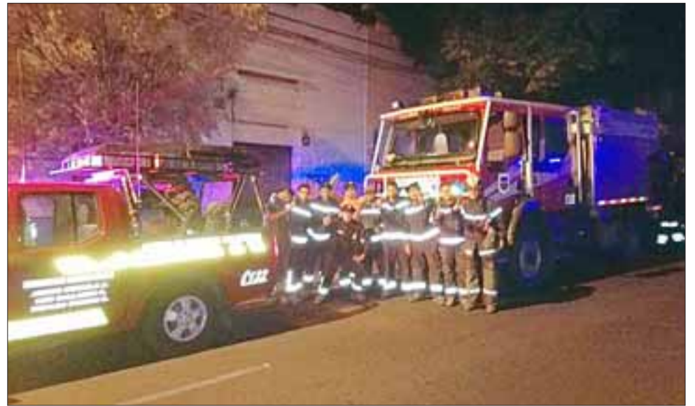
La fuerza de tarea compuesta por voluntarios y unidades de los tres Cuerpos de Bomberos de la Provincia de Los Andes, salieron de madrugada, para poder comenzar con el trabajo de apoyo y relevo en horas de la noche.

Manifestó, que los voluntarios que fueron desti-