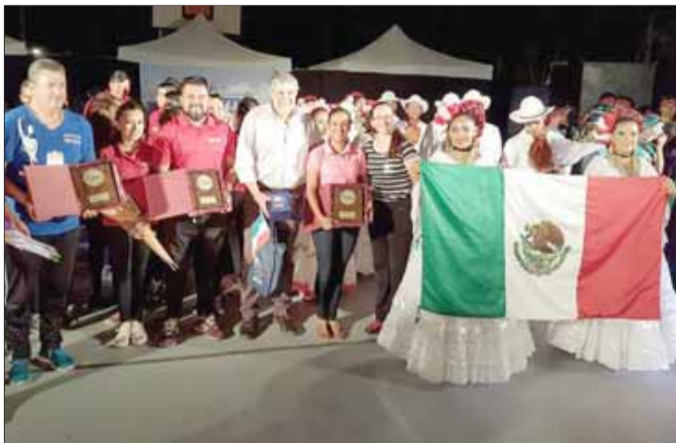
Cientos de personas disfrutaron de la presentación de cada uno de los ballet que participaron del Festival Internacional de Folclor 'Raíces del Mundo 2017', realizado en Catemu.

CATEMU.- Cientos de personas disfrutaron de la presentación de cada uno de los ballet que participaron del Festival Internacional de Folclor 'Raíces del Mundo 2017', realizado en Catemu.