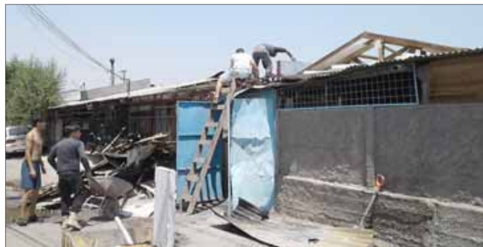
Imagen de los jóvenes ayudando.