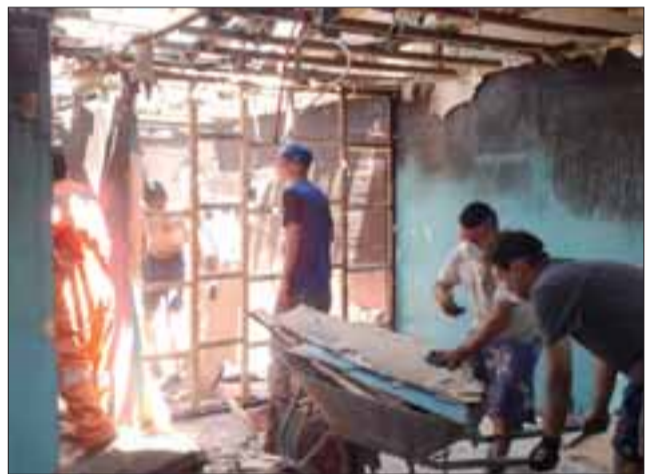
Así quedó el interior de la casa que resulto totalmente quemada.

situación “porque la persona dijo que ahora no podía hacerlo debido a que habían mucha gente y él no podía ver el catastro y el daño de la casa o sea el daño está a la vista, el container se acaba de llenar, dijeron que iban a traer otro, pero la respuesta no hay mas container están todos llenos”, explicó esta vecina.