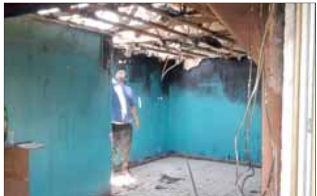
Un joven sacando los últimos vestigios del inmueble siniestrado.