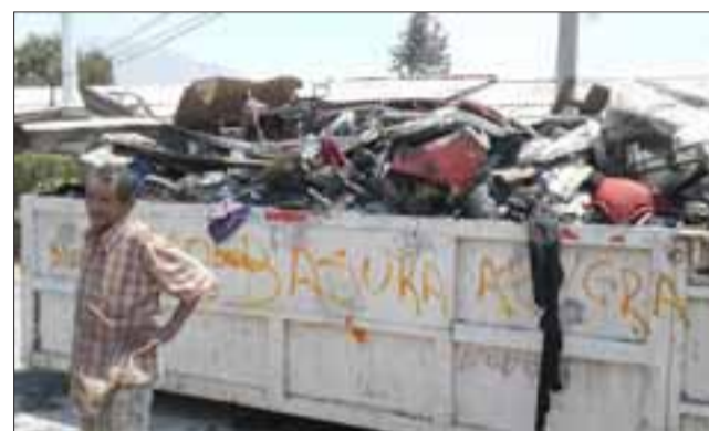
El container lleno con restos de la casa quemada, y que pedían cambiar los vecinos.

situación “porque la persona dijo que ahora no podía hacerlo debido a que habían mucha gente y él no podía ver el catastro y el daño de la casa o sea el daño está a la vista, el container se acaba de llenar, dijeron que iban a traer otro, pero la respuesta no hay mas container están todos llenos”, explicó esta vecina.