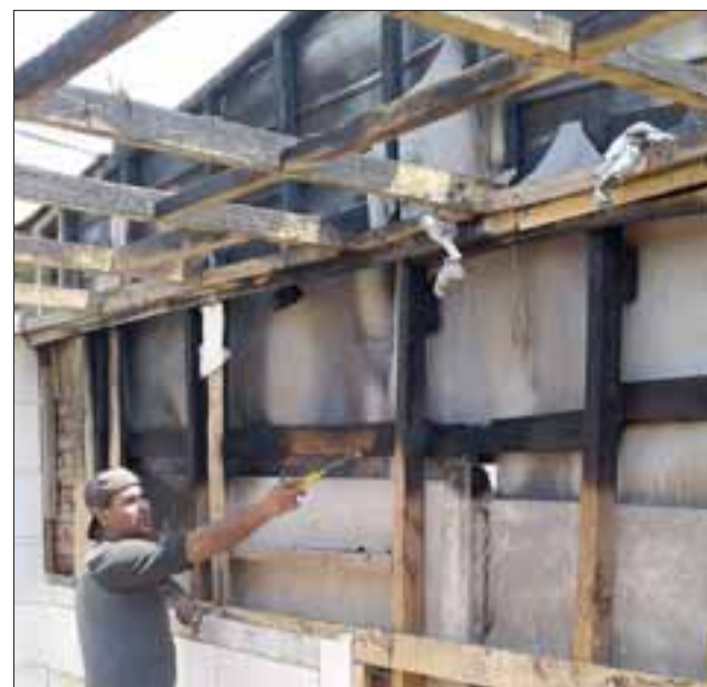
El dueño de una de las casas siniestradas nos muestra por donde entró el fuego.

Denuncian la tardanza con que ha actuado la Municipalidad de San Felipe, porque recién hoy van a realizar un catastro verdadero de la