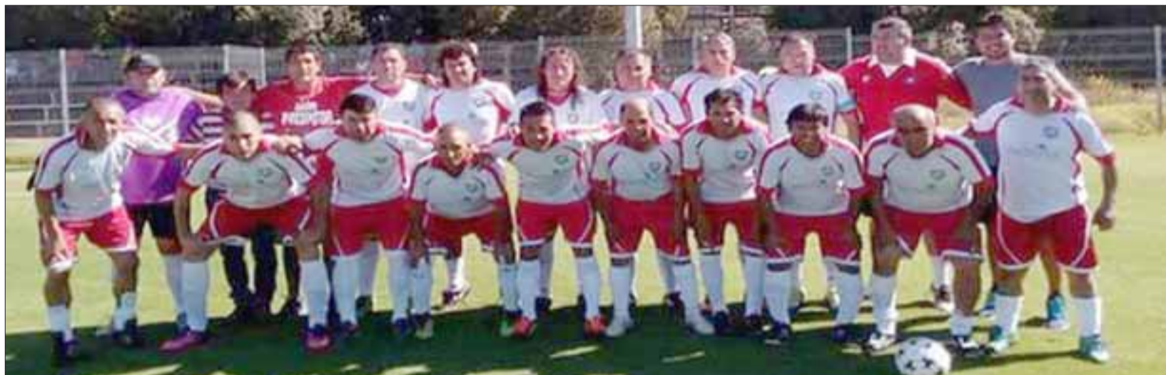
La selección de Rinconada de Los Andes, fue eliminada en los cuartos de final del Nacional Súper Senior.

El partido se jugó durante la jornada del domingo, y pese a la gran diferencia que se expresó en el marcador final, el combinado aconcagüino que dicho sea de paso cargaba con la responsabilidad de representar a la quinta región, hizo un gran esfuerzo para contrarrestar a un equipo que dentro de sus filas contaba con ex jugado-