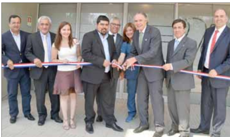
La Mutual de Seguridad CChC realizó la ceremonia de inauguración de su remodelado Centro de Atención de Salud en la ciudad de Los Andes.

Se espera que el Centro de Atención de Salud pueda dar cobertura a más de