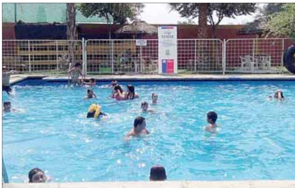
La Campaña de verano 'más cariño, más conversación, más diversión... menos riesgo, verano libre de drogas', comenzó el día 23 de enero en la comuna de Santa María, con actividades en la Piscina Municipal.

También cabe destacar que el equipo Senda Previene, se encontrará entregando material preventivo en el