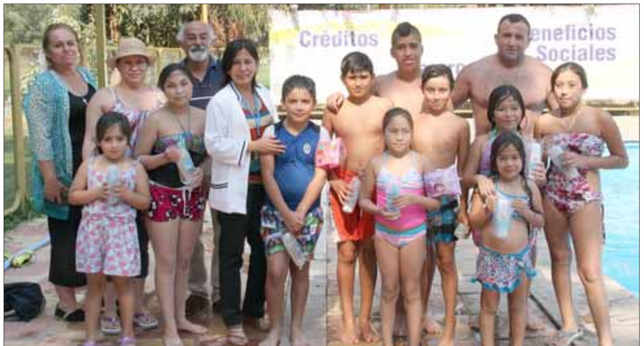
Con cursos gratuitos de natación en la Piscina Municipal de Putaendo, Cesfam Los Libertadores inicia programa de promoción de salud.

“Iniciamos el sábado 21 de enero y vamos a cerrar el martes 28 de febrero. Hemos recibido la aceptación de familias,