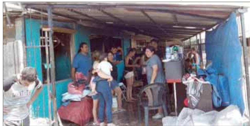
Las personas de la casa que resultó totalmente quemada.