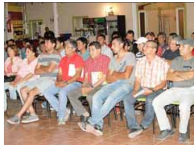
Una nutrida presencia de dirigentes tuvo el lanzamiento oficial del Amor a la Camiseta 2017.

Por su parte, Afava la otra liga de importancia du-