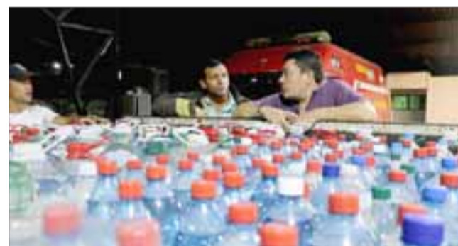
En total, fueron más de mil litros de agua reunidos en esta campaña, donaciones que junto con las barras de cereal aportadas, serán entregadas en la comuna de Vichuquén, Región del Maule.

«Hay un sector importante de nuestro país que se está quemando y creo que más que palabras o críticas, lo que necesitamos entre todos es unirnos. Estamos con los Bomberos que están realizando esta heroica labor en el sur de Chile. Si esto sirve un poco para paliar la situación que están viviendo, sin duda que para nosotros es muy satisfactorio, pero creo que lo más importante es enviar un gesto de que nosotros estamos soli-