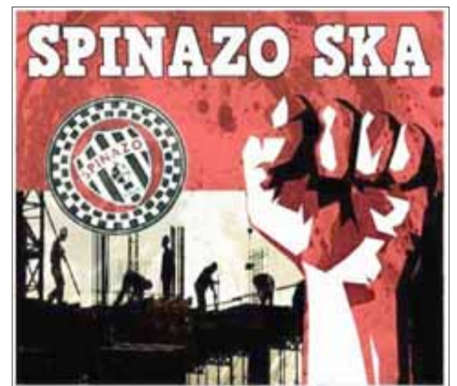
UNA ESCUELA MUSICAL. - Este es su CD homónimo que Spinazo Ska, ya ha colocado en las mejores radios de Aconcagua.

Revise el listado de enfermedades en: web.minsal.cl/leyricarte