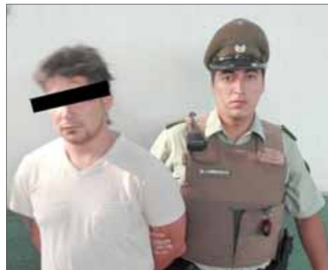
El imputado, fue capturado por Carabineros tras ser acusado de robo al interior del pub 'Entre Copas y Chicas' de calle Portus en San Felipe.

Carabineros, al revisar entre las vestimentas del detenido, quien se encontraba ebrio, halló al interior de un banano que portaba, dinero en efectivo y las tarjetas BIP que mencionó la víctima en su denuncia. El procedimiento policial, continuó en las dependencias del local, confirmándose los daños perpetrados al interior de los servicios higiénicos que habría producido el acusado.