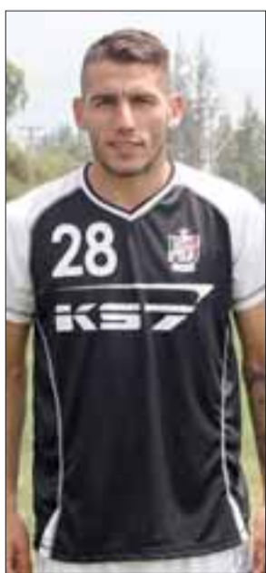
El volante ofensivo argentino, se reintegrará al plantel el viernes próximo.

Puerto Varas, Universidad de Cuyo (Argentina), Hindú Club (Argentina), Libaes (Venezuela), San Felipe Basket.