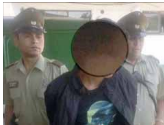
El menor de 15 años de edad habría participado del asalto