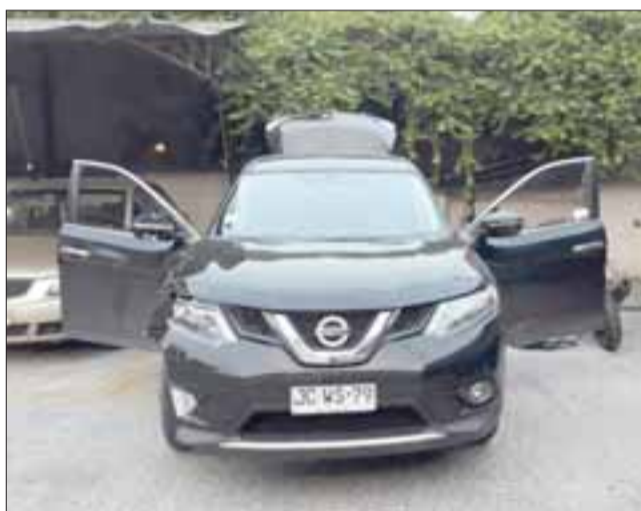
El vehículo utilizado por los delincuentes mantenía encargo por robo.