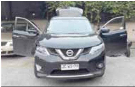
AUTO ROBADO: En este vehículo huyeron los delincuentes, pero al final fueron capturados.