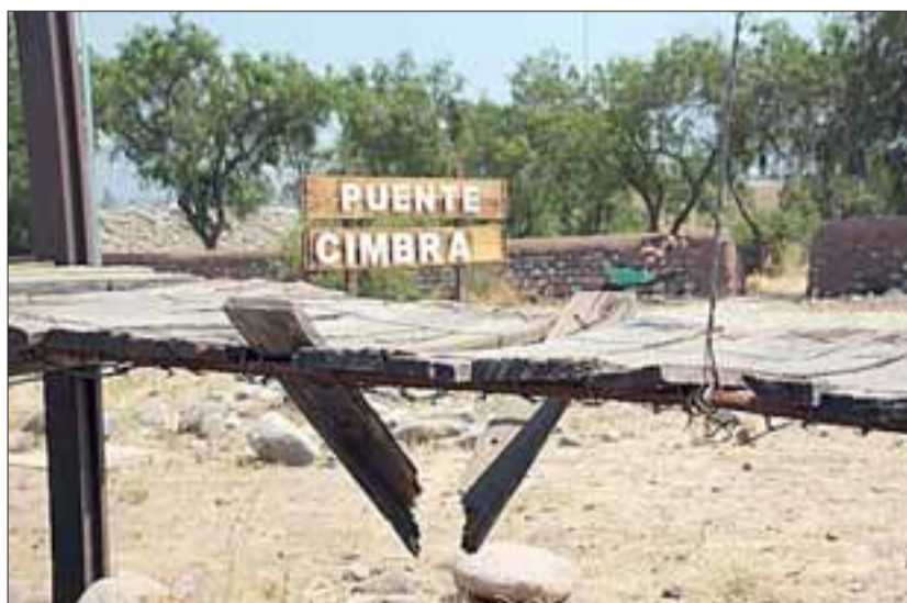
Tablas rotas, rayados y robos han obligado a la Municipalidad de Putaendo a realizar mantenciones prácticamente cada dos meses

El personero indicó que ya están trabajando en la implementación de medidas urgentes, como la reposición de las tablas faltantes del puente colgante y principalmente la instalación de una malla bizcocho, “ya que constantemente