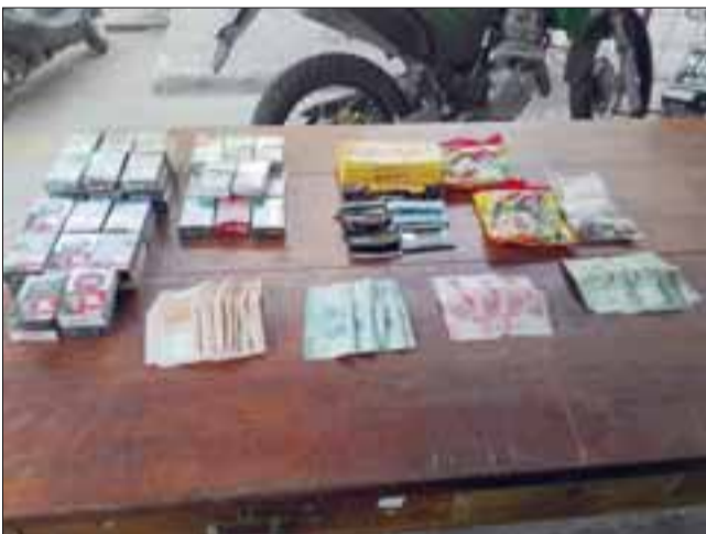
Carabineros recuperó alrededor de $300.000 en billetes y monedas, cigarrillos y golosinas robadas desde el Servicentro Copec de la comuna de Llay Llay.