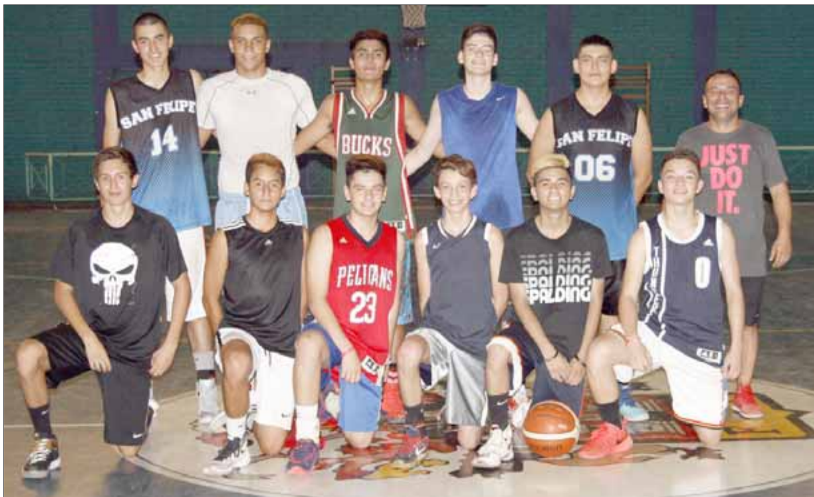
San Felipe Básquet va a la Copa Pancho, con la idea fija de ser protagonista dentro de un selecto grupo de competidores.

Los cuadros participantes, fueron sembrados en dos grupos, quedando los sanfelipeños en el B, junto a clubes de mucho peso como por ejemplo son, Puerto Varas y el Libaes de Venezuela, precisamente el rival del debut del próximo domingo cuando el reloj marque las 18:00 horas.