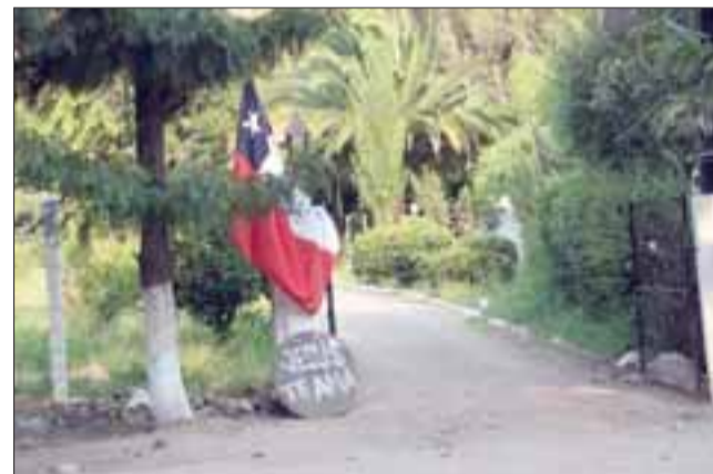
Vecinos del sector de Las Coimas, denuncian riñas y altercados en una comunidad cristiana establecida como Centro de Rehabilitación, y solicitan a las autoridades mayor seguridad.

no vive ahí, sino que fue a hacer una especie de visita, haya terminado peleando en el suelo con un Carabiniero y le iba a pegar con una piedra en la cabeza. Cosas como esas son inaceptables. (...) Clausurar sería si dentro se produjeran escándalos o peleas, este hecho ocurrió fuera, por lo que el gobernador y el comisario de Carabine-