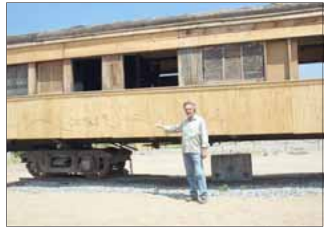
El empresario ha tenido que sortear cinco robos e innumerables daños al vagón donde pretendía establecer una cafetería en la avenida Alejandrina Carvajal, por lo cual le hacen dudar de la continuidad del proyecto en Putaendo.

Frente a esta seguidilla de robos, el empresario pidió a la Municipalidad de Putaendo que haga un esfuerzo en aumentar la seguridad en el Parque Puente Cimbra, “porque la gente incluso viene mucho en la noche a pasear, pero se