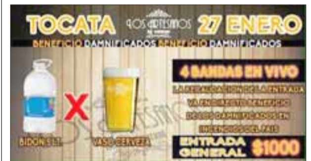
Afiche promocional de la actividad ‘Shop x Agua’ de Artesanos Bar, ubicado en calle Santa Rosa 140.

La actividad, se llevará a cabo este viernes 27 de enero en Artesanos Bar, ubicado en calle Santa Rosa 140, a metros de la plaza de Armas. Para esa noche ya confirmaron su asistencia las bandas musicales Agrupación Chungará, Verde Arrebol, Cocodrilo, entre otros.