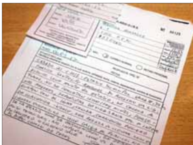
EN INVESTIGACIÓN.- En la Oirs de la Secretaría Municipal de San Felipe quedó constancia de esta situación.

partido de la fecha con mi familia, me quejo porque en nuestra grada había un señor fumando cigarro, el humo nos afectaba a los adultos mayores y a los niños que estaban en ese lugar. No es posible que tengamos que sufrir nosotros