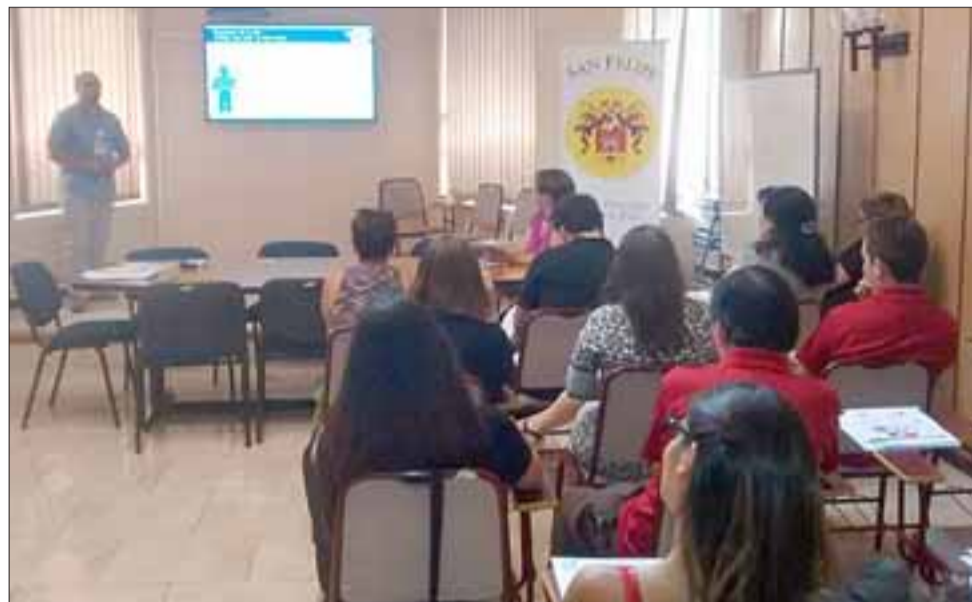
En la jornada de este miércoles, se realizó una jornada de capacitación encabezada por profesionales del Instituto Nacional de Estadísticas, para que así, todas aquellas personas que participen el 19 de abril, estén completamente preparados para el buen desarrollo de esta iniciativa.

En la jornada de este miércoles, se realizó en la Daem una jornada de capacitación encabezada por profesionales del Instituto Nacional de Estadísticas, organismo responsable de este proceso y que contempla otras instancias similares, para que así, todas aquellas personas que participen el 19 de abril, estén completamente preparados