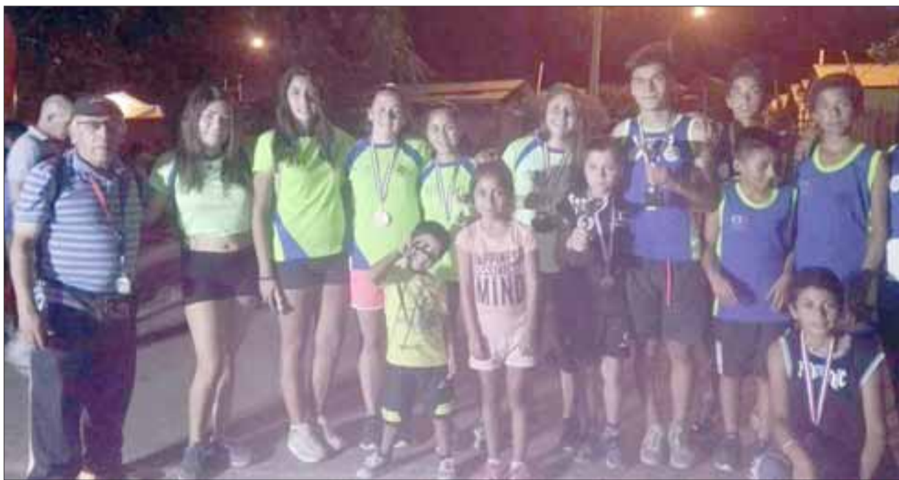
Una actuación sobresaliente cumplió la Escuela Infantil de Atletismo de Llay Llay en una corrida nocturna en Til Til.