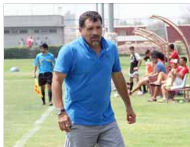
El entrenador está muy confiado en que su equipo abandonará las últimas posiciones.

La sensación de tiempos mejores descansa, ya que después de un buen rato, Trasandino comienza a mostrar una línea de juego definida, cosa que antes no pasaba. "Hay que encontrar una identidad y un estilo, y en eso avanzamos, aunque es muy evidente que todo hay que ratificarlo con triunfos y eso es lo que no hemos podido concretar durante los partidos" , afirmó el estratega, que tiene claro el gran déficit que está mostrando su equipo. "Por ahora es el tema de la conversión al no poder aprovechar las oportunidades que se nos crean, ya que lo otro (asumir la propuesta) lo hemos ido trabajando y tenemos la tranquilidad que los muchachos están dispuestos a