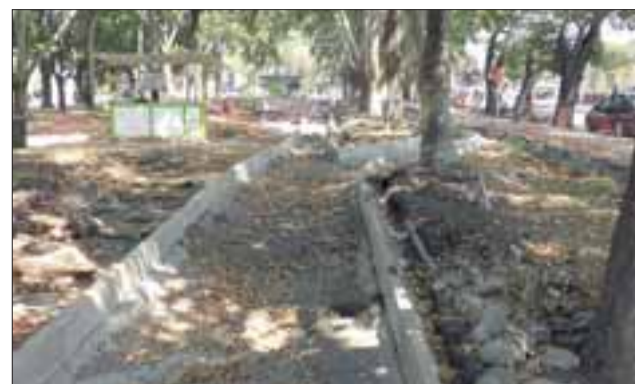
Cambio del diseño en el sector de avenida O’ Higgins, entre las calles Traslaviña y Maipú, donde la ciclovía iba por la calle, tramo que fue cambiado.

“Si bien se han hecho proyectos importantes en el último tiempo, varios han sido en lugares que están en la periferia de la comuna, pero esto está en el damero central y por cierto que genera mayor inconveniente, así que esperamos que esto nos acostumbre un poco,