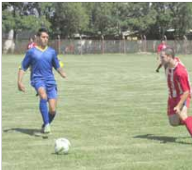
Varios son los equipos del Valle de Aconcagua que aspiran a meterse en la fase de grupos de la Copa de Campeones.

La Higuera (La Ligua) 0 - Social Putaendo 0; El Sauce (San Esteban) 3 - Invencible (Osman Pérez Freire) 0; Libertad (Miraflores) 0 - Parrales (Llay Llay) 0; San Alberto (Los Andes) 0 - Montevideo (Barón) 0; Escorial (Panquehue) 0 - Unión Delicias (San Felipe) 1; Jorge Toro (Villa Alemana) 3 - El Guindal (Calle Larga) 1; Alfredo Riesco (Catemu) 4 - Tranque Vergara 3 (Forestal Alto) 3; Santa Rosa 4 (Santa María) - El Venado 0; Casuto (Rinconada) 2 - Santa Julia 3 (Achupallas) 3.