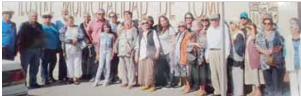
Otra postal de los integrantes del Club Los Nonos ahora a un costado de la Municipalidad de Tomé.

En cuanto a los sectores quemados el presidente dijo "estuvo muy cerca de los lugares donde anduvimos a metros de la ciudad de Tomé pero fueron controla-