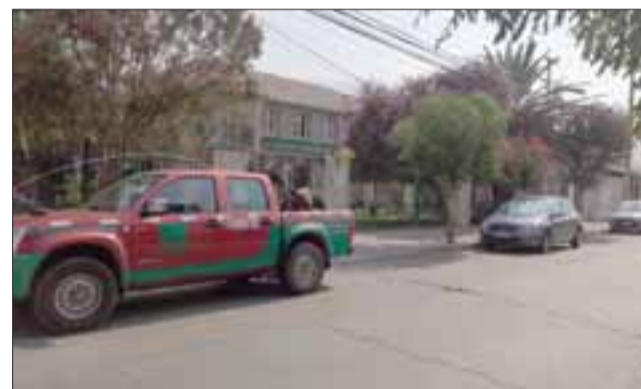
El delincuente habría ingresado hasta la Asociación Chilena de Seguridad (Achs) ubicada en calle San Martín 120 en San Felipe.

hasta la Alameda Bernardo O'Higgins esquina Toro Mazote, los trabajadores pudieron observar a un sujeto con las mismas características del video, logrando su retención mientras esperaban la llegada de Carabineros que concurrió de inmediato.