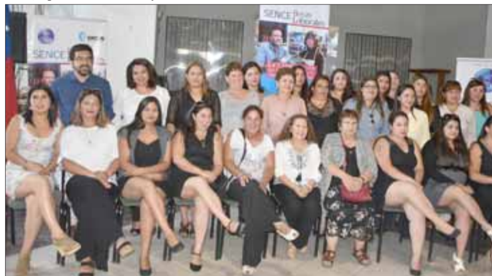
Ceremonias de certificación de los cursos de repostería a 50 mujeres de Llay Llay. Capacitación impartida por el Servicio Nacional de Capacitación y Empleo (Sence), a través de su Programa Becas Laborales.

como concejal de la comuna, «Estoy muy contento de ver que hoy muchas mujeres se han podido capacitar por lo que agradezco enormemente a Sence, quienes aportan para que la capacitación pueda llegar a todos los rincones de la comuna, yo siempre digo vamos más lejos para estar más cerca de la gente y en este contexto feliz de que este curso haya llegado a Llay Llay y sobre todo al sector de la Mina el Sauce, que es uno de los lugares más alejado de la comuna del sector rural, donde muchas de estos beneficios no llegaban y es por esto que