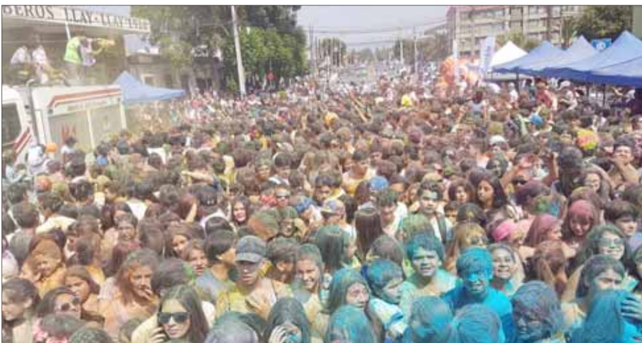
The Wind Colors, una exitosa fiesta que organizó la Ilustre Municipalidad de Llay Llay, a la que acudieron cerca de mil personas.