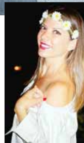
Las modelos desbordaban belleza y simpatía. Si no cree, juzgue usted.