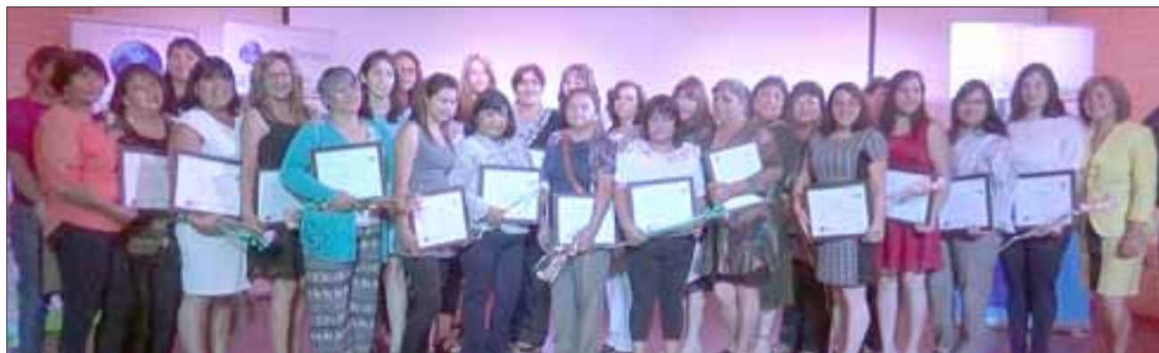
Un total de 25 mujeres, recibieron su diploma tras un curso de Corte y Costura, comprobando que la capacitación es el camino a la superación e independencia económica.

SANTA MARÍA.- La comuna de Santa María, avanza a pasos agigantados en la preparación de su gente para ser competitivos, tener oficios y capacitaciones que permitan su mejor desempeño en el moderno campo laboral, ya sea como asalariados o independientes. Es así, que 25 mujeres recibieron su diploma tras un intensivo curso de Corte y Cos-