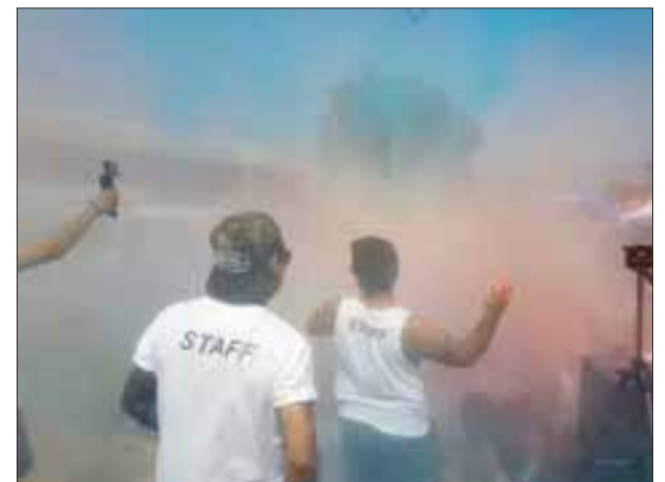
La corrida contempló un recorrido por las av. Balmaceda, O'Higgins, Circunvalación Ucuquer, José Miguel Carrera y Río Cuarto, donde los participantes recorrieron cerca de dos kilómetros, ruta en la cual se dispuso de puntos de colores e hidratación.

de la fiesta, que era entregar un grato momento familiar y deportivo, «estoy contento con el resultado de esta actividad deportiva, ya que creo que es la más masiva que hemos visto en Llay Llay, me gusta ver como la genta participa activamente, y la familia en general porque había muchos niños disfrutando del evento, todos muy motivados», concluyó el Edil.