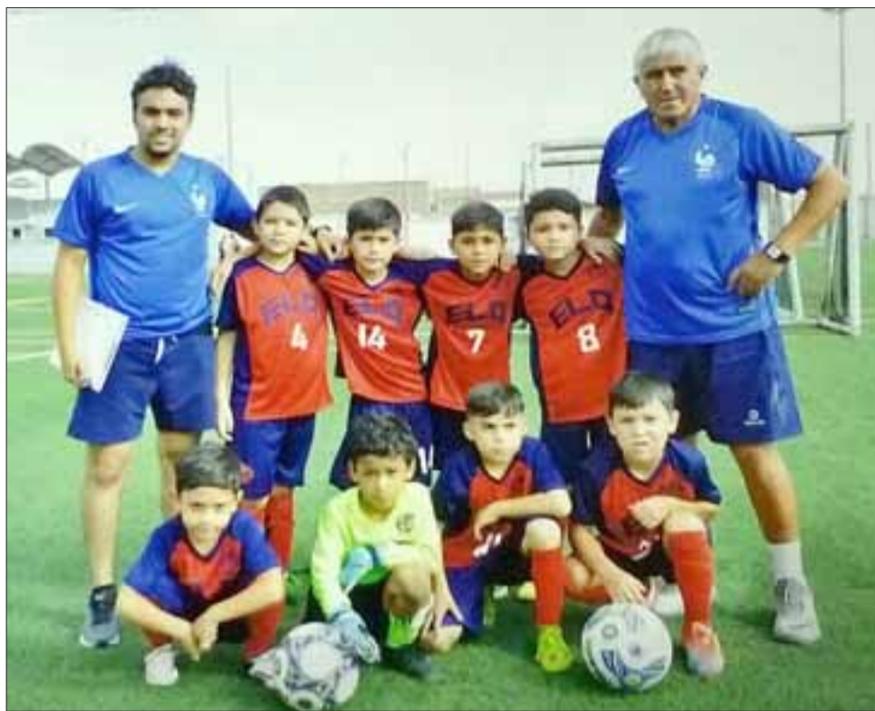
El equipo Sub 8 de la escuela de fútbol Luis Quezada, quienes obtuvieron el tercer lugar dentro de setenta equipos que participaron en torneo fútbol 7 en Tacna Perú.

El equipo estuvo constituido por nueve niños más dos técnicos. En el grupo de la competencia, había ocho equipos, donde las pequeñas promesas del fútbol sanfelipeño llegaron a la semifinal donde perdieron,