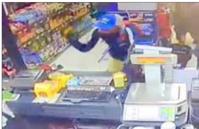
El minimarket 'Al Paso' se ubica a un costado de la ruta 60 Ch esquina calle Antofagasta en Panquehue. (Foto Referencial).

Los desconocidos, huyeron a rostro descubierto sin dejar rastro de su paradero. Carabineros recogió la denuncia poniendo en antecedente a la Fiscalía de San Felipe.