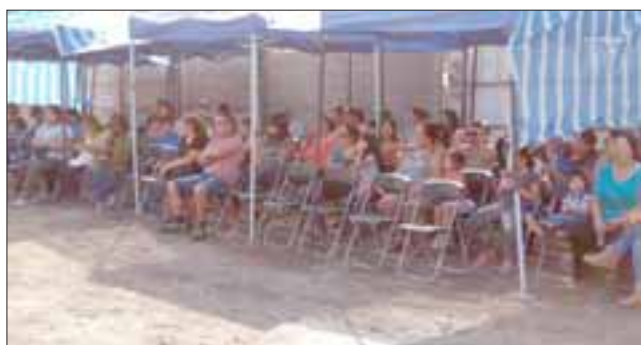
Integrantes del Comité Habitacional Futura Casa, recibieron felices la noticia de la continuación de los trabajos en el conjunto habitacional de avenida Encón.