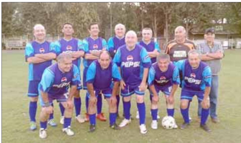
Pese a que está lejos de la cima, la escuadra de Andacollo no baja los brazos en la serie mayor de 55 años en la Liga Vecinal.