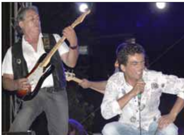
'DE ELVIS A CERATI'.- Aquí tenemos a estos veteranos del Rock, a puro talento hicieron delirar a los presentes con su show 'De Elvis a Cerati'.