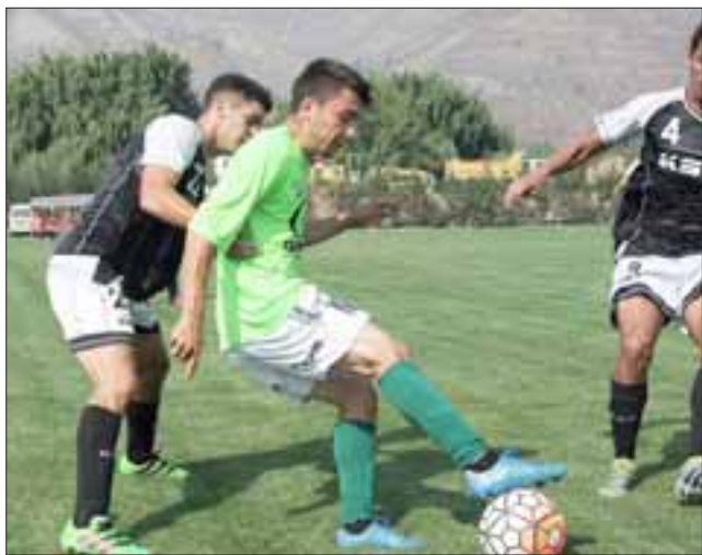
Las escuadras aconcaquina verán acción durante el sábado en sus respectivas competencias.

La Asociación de Fútbol Profesional confirmó que este fin de semana, se jugarán las respectivas fechas de todos sus torneos, con lo que ya es un hecho que Unión San Felipe deberá desplazarse hasta Chillan para medirse con Ñublense, en el partido que está programado para las siete de la tarde del sábado próximo.