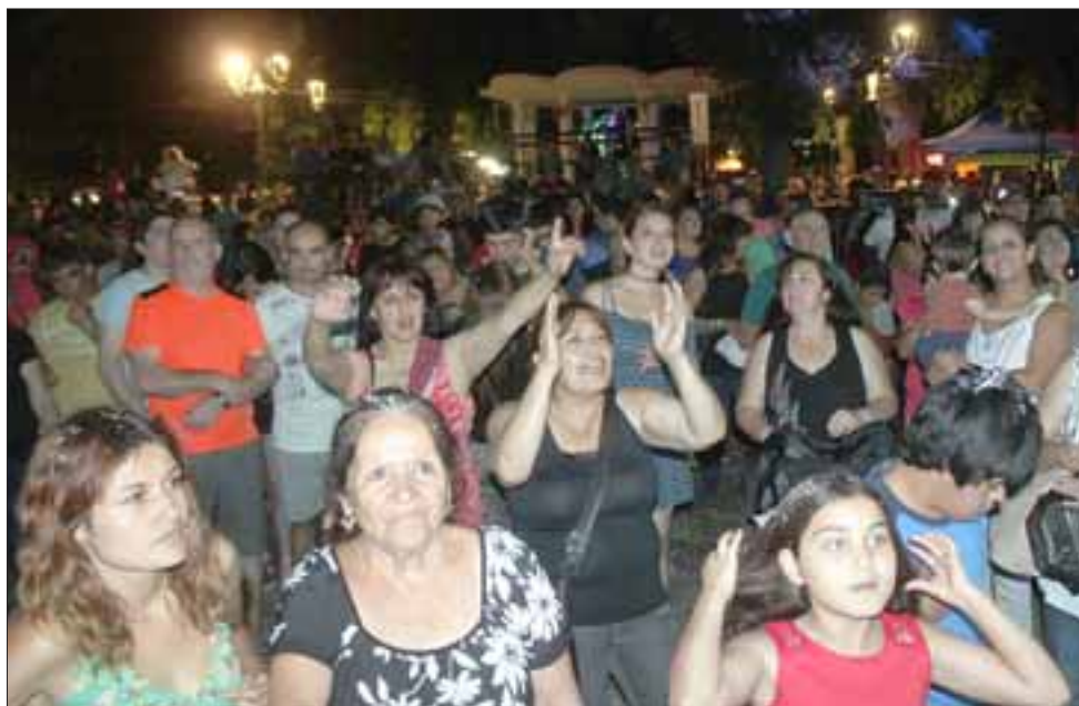
FIEBRES DEL ROCK.- Miles de sanfelipeños llegaron a la plaza de Armas para disfrutar de la gran presentación ofrecida por Liverpool.

ca que tocamos ya no se oye en las radios, pero de igual forma la vieja y nueva generación responden cuando la tocamos, porque ese vacío lo llenamos con nuestro trabajo», indicó el experimentado músico. Roberto González Short