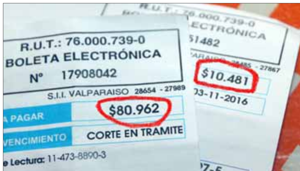
Y LOS ALTOS COBROS SIGUEN.- Así de claritas son estas boletas de Esvál, de una suma tan pequeña salta al mes siguiente a más de $80.000.