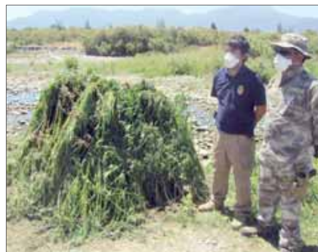
Con la incautación de cerca de 3 mil matas de marihuana, la Brigada Antinarcoóticos contra del Crimen Organizado (Brianco) de la PDI de Los Andes dio inicio al Plan Cannabis 2017 en las provincias de Los Andes, Petorca y San Felipe.

El jefe de la Brianco manifestó que este Plan Cannabis se extenderá hasta el