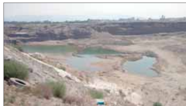
Este es el enorme socavón que se ha formado a orillas del Río Aconcagua, con la extracción de material desde el sector de Tres Esquinas en San Felipe.

El profesional, hizo mención al sinnúmero de intervenciones ilegales al cauce del río cometidas por Áridos Tres Esquinas y destacó la coordinación existente entre la Gobernación