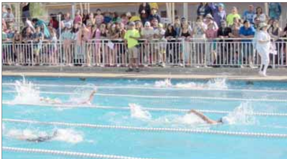
Fueron más de 150 deportistas quienes participaron en la actividad, que se ha convertido en una tradición del verano en la comuna.

gorías, la que se ha realizado en conjunto con el club de natación Master Aconcagua, señalando que "este año la actividad la desarrollamos en conjunto con un nuevo club de natación que está formado por antiguos nadadores que tienen una