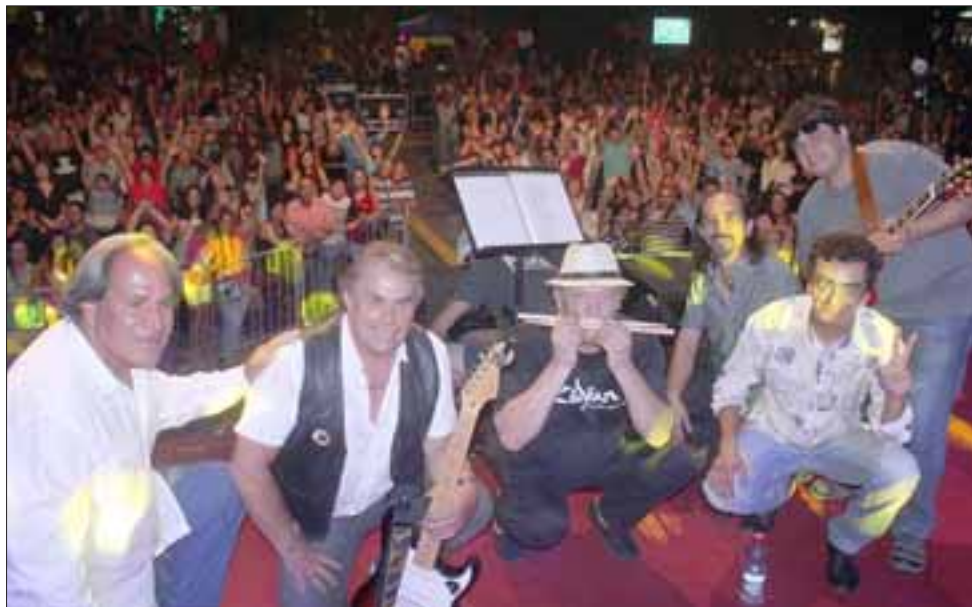
LLENO TOTAL.- Tal como lo muestra esta gráfica de Diario El Trabajo, fueron miles de personas las que llegaron el sábado a la Fiesta de la Chaya.

«Ya estamos haciendo las pruebas finales en Casino Enjoy para instalarlos de manera permanente en ese escenario, posiblemente estemos allá los días miércoles. El éxito de Liverpool se debe a que la música