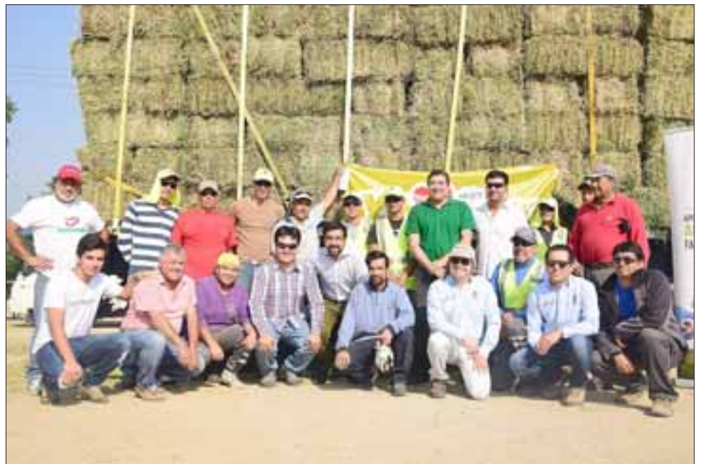
La campaña buscaba reunir la mayor cantidad de fardos de alfalfa posible, para ir en ayuda de la pequeña agricultura familiar campesina de las zonas que han sido afectadas por los incendios.

traslado de los fardos se concretó gracias a las empresas Transportes Terraza y Transportes Varmontt, quienes pusieron dos camiones a disposición.