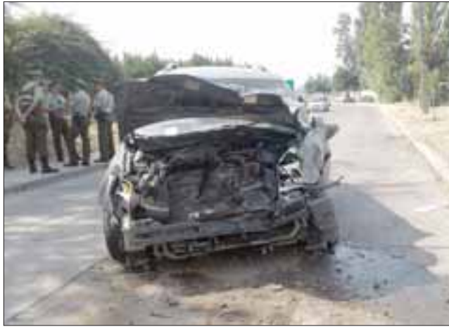
Así quedó el vehículo que impactó con el bus.