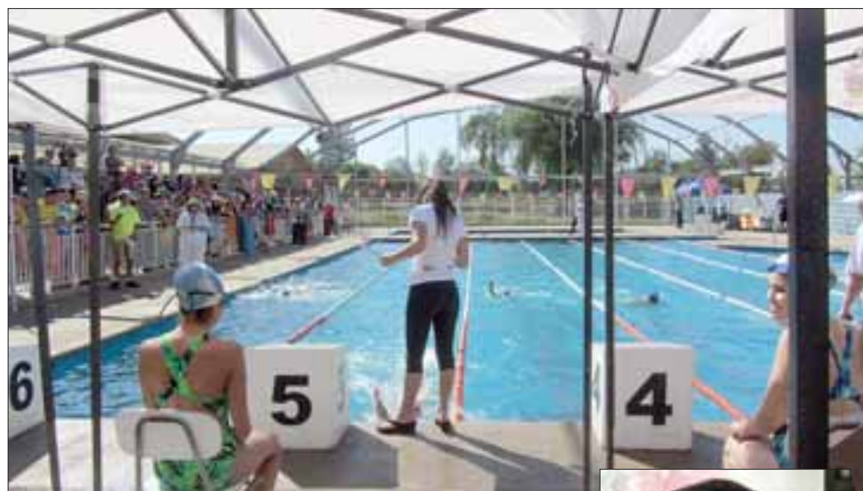
El campeonato de natación, organizado por el departamento de Deportes y Actividad Física del municipio en conjunto, este año, con el club de natación Master Aconcagua de San Felipe.

larga trayectoria en el Valle del Aconcagua".