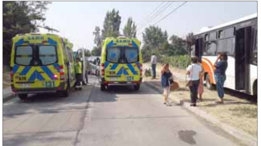
Personal del Samu trabajó durante algunos minutos en el lugar.