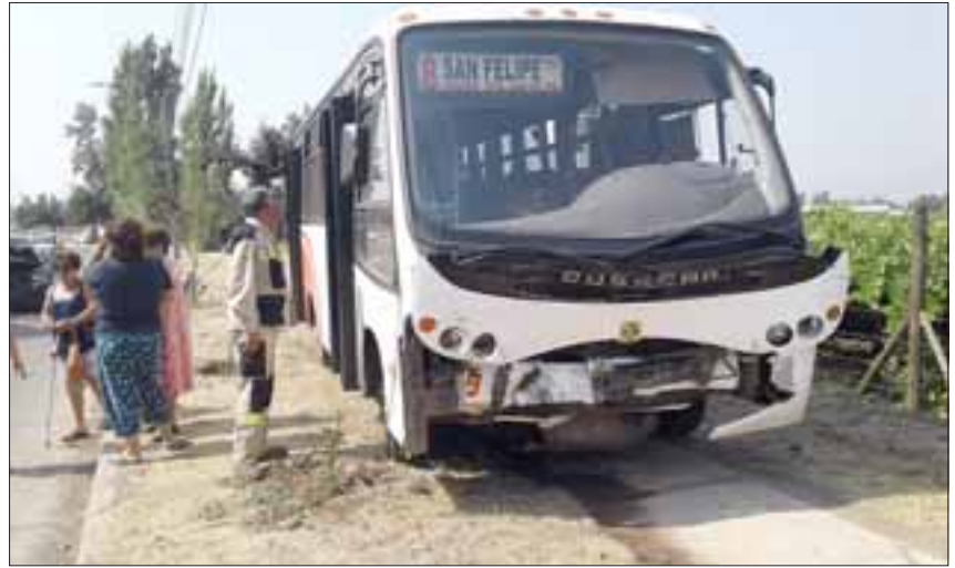
Así quedó el bus de Vera Arcos tras el impacto con el Station wagon.

Según el testigo, la persona que venía conduciendo el station wagon era una mujer que rápidamente fue trasladada hasta el San Camilo. Al lugar debió concurrir personal del Samu, Bomberos, Carabineros quienes adoptaron el procedimiento de rigor.