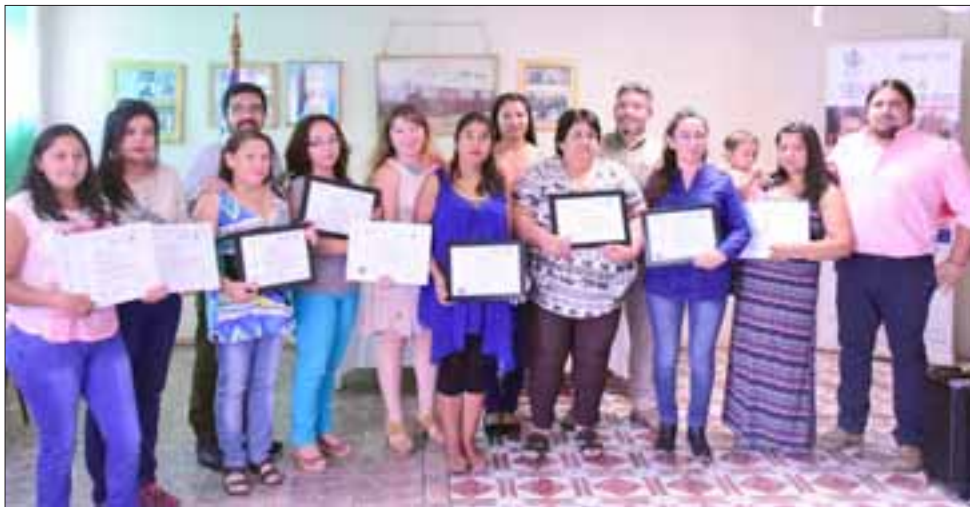
Un total de 13 mujeres de la comuna de Llay Llay, participaron del curso financiado por Sence, el cual tuvo una duración de 80 horas cronológicas, distribuidas en 20 días.

LLAYLLAY.- En la ciudad del 'viento viento' se realizó, la certificación del curso 'Procedimientos de Higiene, Seguridad y Prevención de Riesgos en Procesos de Manipulación de Alimentos', financiado por el Servicio Nacional de Capacitación y Empleo, Sence, dependiente del Ministerio del Trabajo y Previsión Social, a través del programa Becas Laborales, impartido por la Otec Instituto de Capacitación de Chile.