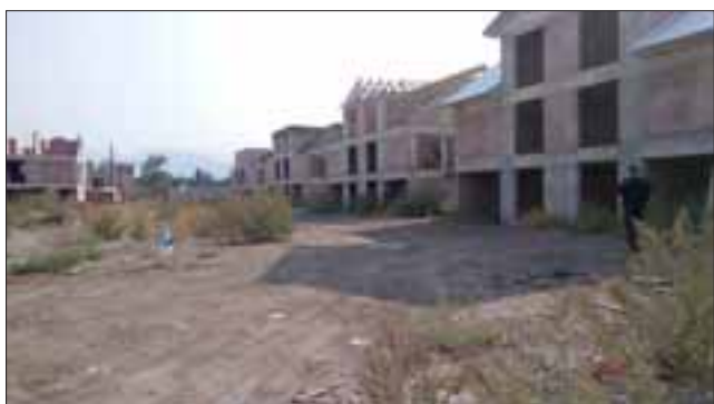
Se estima que la nueva empresa debiera estar culminando con la construcción de las viviendas a fines del 2017.