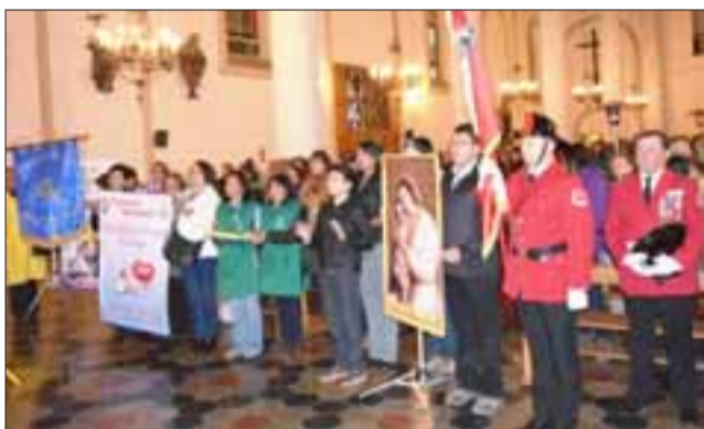
Obispo diocesano de Aconcagua, Mons. Cristián Contreras Molina OdeM.