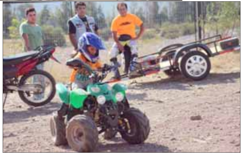
Fueron varios los padres que llegaron hasta el estacionamiento del Parque Municipal de Putaendo, para llevar a sus hijos a disfrutar de un paseo en moto y a dejar su aporte