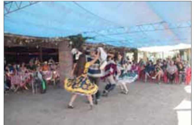
Una excelente muestra de bailes típicos, compuesta desde los más adultos hasta los más pequeños de la familia, demostrando una tradición que ha sido traspasada de generación en generación.