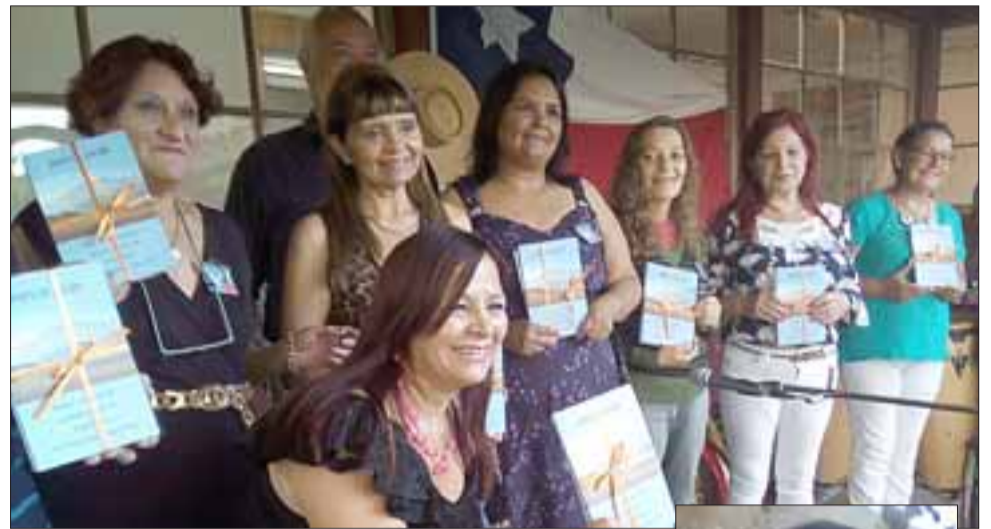
TALENTO TRASANDINO.- Aquí tenemos a las escritoras argentinas, posando para las cámaras de Diario El Trabajo.

Varios de estos escritores provenían de Argentina (Mendoza), ellos recibieron 100 ejemplares de libros, los cuales serán distribuidos entre los autores participan-