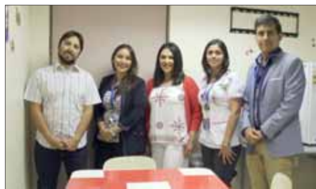
El pasado viernes fue inaugurada la Sala de Estar para Madres y Familiares del Hospital San Juan de Dios de Los Andes.

apoyar esta idea nacida de los funcionarios del Servicio de Pediatría del Hosla.