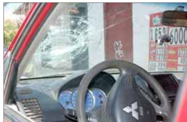
GOLPAZO. - Así quedó el parabrisas frontal de esta camioneta, luego que un conductor en su ‘moto fantasma’ se estrellara contra ésta en Navarro esquina Merced.

Nuestro medio pudo hablar con testigos y curiosos en el lugar, algunos comentaban que ‘de la nada’ apareció otra camioneta, que dos tipos bajaron de la misma y se habían robado la moto, otros en cambio, aseguraban que en la moto venía una jovencita de acompañante, que ella ubicó a dos amigos suyos y que éstos, y con ella también, rápidamente se llevaron la moto del lugar caminando, lo que explicaría en parte la desaparición.