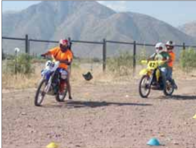
PASEOS EN MOTO.- Una tarde solidaria y entretenida, pudieron disfrutar las familias que con un gran corazón y disposición, aportaron su granito de arena para que la actividad cumpliera su cometido.