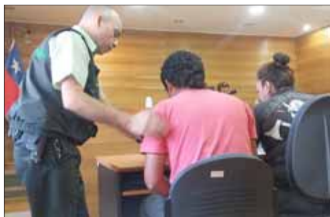
Al efectuar el intoxilyzer arrojó una graduación de 1,53 gramos de alcohol por mil en la sangre, siendo detenido y puesto a disposición del Tribunal de Garantía de Los Andes.

LOS ANDES.- El conductor de un automóvil particular, fue detenido luego de chocar contra un poste en estado de ebriedad y comprobarse que nunca había sacado licencia de manejar.