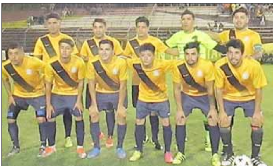
El equipo sanfelipeño de Unión Delicias sigue en carrera para meterse al cuadro definitivo de la Copa de Campeones.