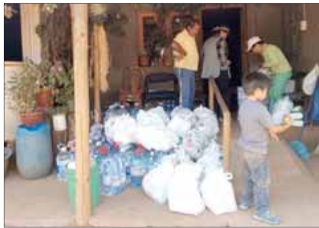
FAMILIAS AGRADECIDAS. - Esta familia por ejemplo, recibió agua y alimentos, pues estos incendios les arrebataron todo.