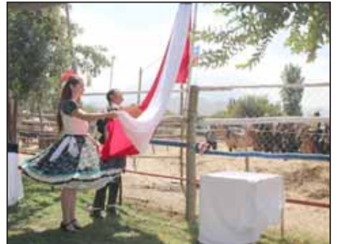
Hermosa ceremonia de izamiento de nuestro pabellón patrio.