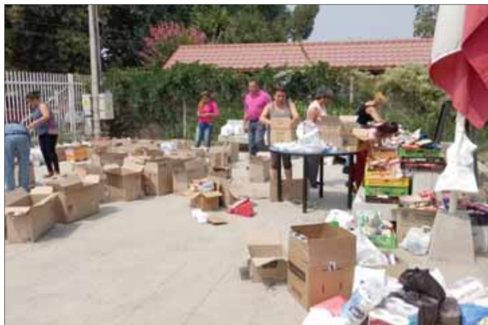
SOLIDARIDAD TOTAL. - Muchos voluntarios se esforzaron por días, a fin de empacar y revisar cada donativo en el centro de acopio, en la emisora.

« En San Pedro Alto los vecinos perdieron su predio agrícola, están sin nada y hasta sin trabajo, en Las Papas y Portezuelos también se quemaron varias casas, ahí llegamos con agua y con todo el cariño de los vecinos y autoridades de nuestra comuna, el alcalde