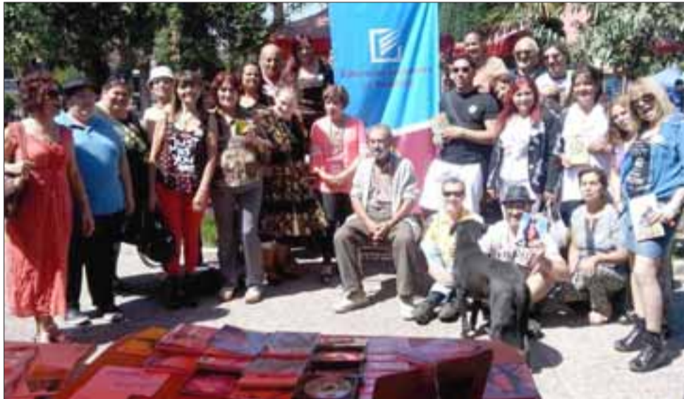
EL PODER DE LAS PALABRAS.- Decenas de escritores chilenos y argentinos se dieron cita este año en Putaendo, para presentar sus trabajos ya publicados.

tes, centros culturales de Mendoza y el Departamento de Cultura de dicha ciudad. Así también, recibieron sus libros los escritores chilenos provenientes de ciudades como Santiago, Los Andes, Santa María, San Felipe y de Putaendo.