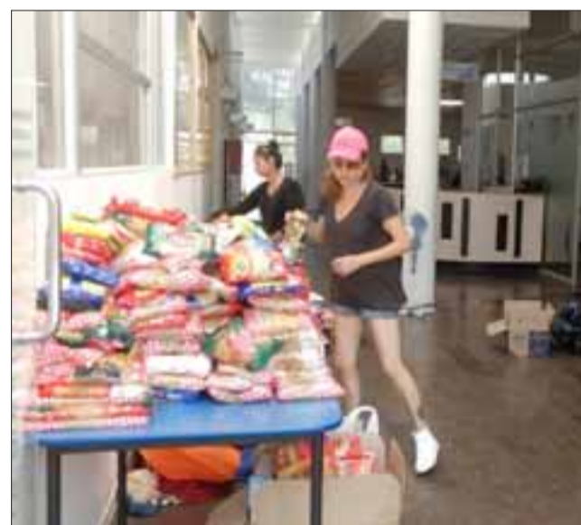
MUCHO TRABAJO. - Personal de Radio Orolonco y de la Biblioteca Municipal trabajó muchísimas horas extra, para poder seleccionar los alimentos y demás donativos.