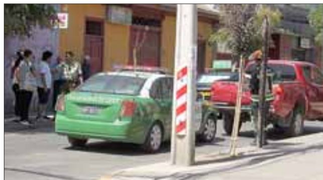
¿Y LA MOTO?. - Los carabineros intentaron por todos los medios ubicar el paradero de la motocicleta, pero sin resultados positivos.