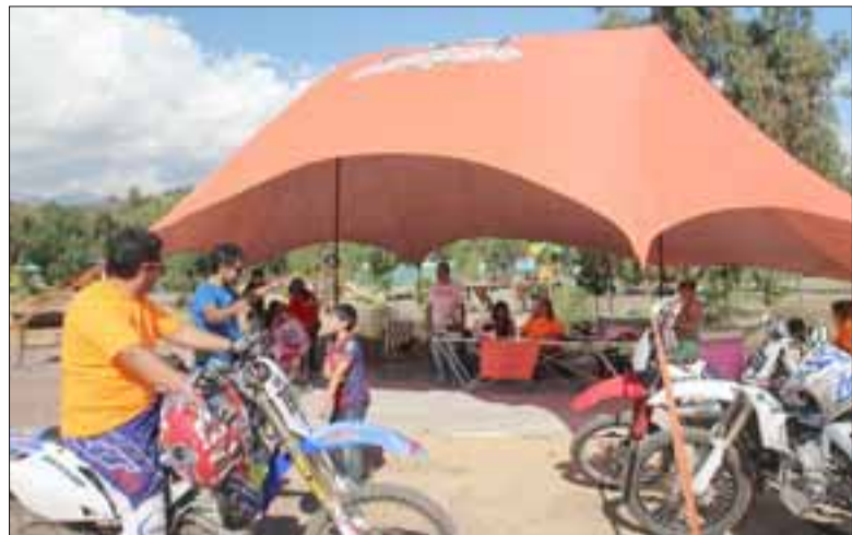
El Club de Motos Enduro, lideró una exitosa tarde de paseos gratuitos para recolectar mochilas y útiles escolares para los damnificados por los incendios forestales en el sur del país.

Los aportes para la campaña '500 mochilas para el sur' se recibirán todos los días de 18:00 a 20:00 horas en la sede de la Población San Antonio.