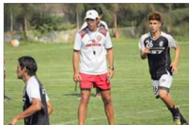
El equipo sanfelipeño recibirá a Deportes Iberia en la próxima jornada del torneo Loto.

Sábado 11 de febrero 18:00 horas, La Pintana – Melipilla 18:00 horas, Naval – Santa Cruz 19:00 horas, Colchagua – Lota Schawager 19:00 horas, Vallenar – Independiente de Cauquenes 19:30 horas, Barnechea – San Antonio Unido 20:00 horas, Malleco Unido – Trasandino