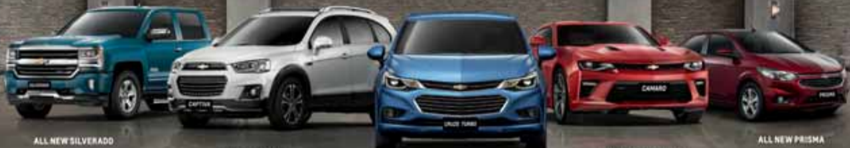
ALL NEW SILVERADO

CAMBIAMOS NUESTRA LÍNEA Y TAMBIÉN TU FORMA DE COMPRAR.