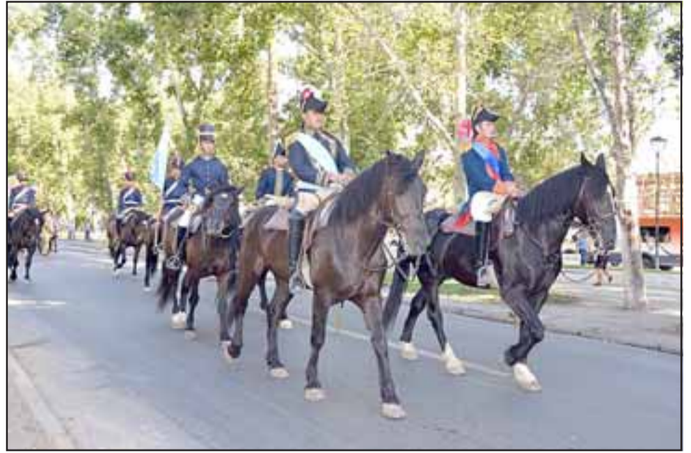
La delegación chileno-argentina llegó a Los Andes el lunes, replicando la histórica hazaña del cruce de la cordillera hace 200 años.