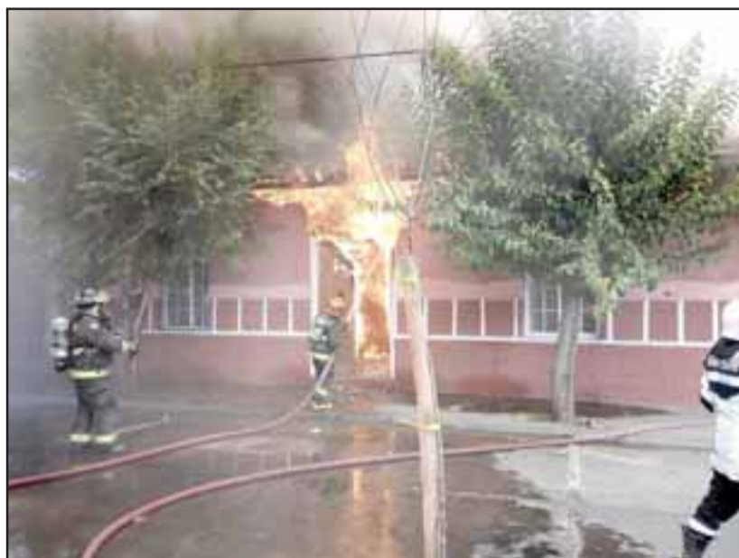
El pasado 19 de enero, un gigantesco incendio registrado en Traslaviña arrasó varias viviendas antigua, dejando con lo puesto a varios ciudadanos extranjeros.

Y si de brindar ayuda se trata, los sanfelipeños una vez más han dado una gran muestra de solidaridad al resto del país, puesto que, además de todos los medios