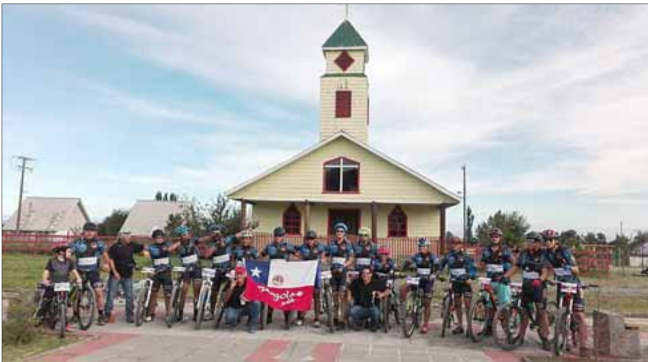
Una más que destacada presentación cumplió el club de ciclismo Las Gárgolas en el Desafío Austral en Puerto Montt.