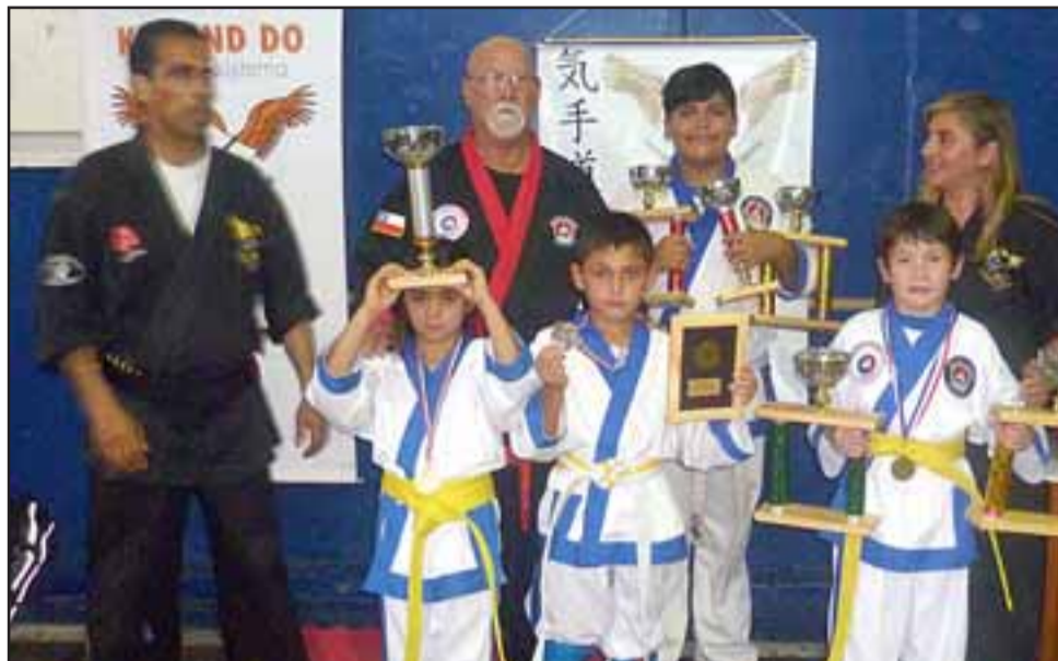
NUESTROS CAMPEONES.- Los karatekas sanfelipeños regresaron a nuestra comuna, cargados de premios.

jo como yo, porque ellos son ahora mi fuerza, yo me siento pagado cada vez que un chico de estos logra sus pequeños y grandes triunfos en el deporte, pues los riesgos que ellos enfrentan de perderse en el camino, son muchos y de gran peligro», dijo a Diario El Trabajo el experimentado