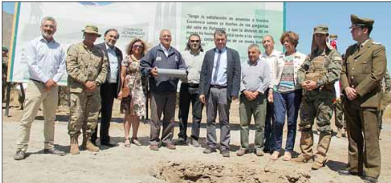
El municipio preparó una impecable ceremonia, llena de patriotismo y hermandad entre los pueblos, en el monolito al Combate de Achupallas.