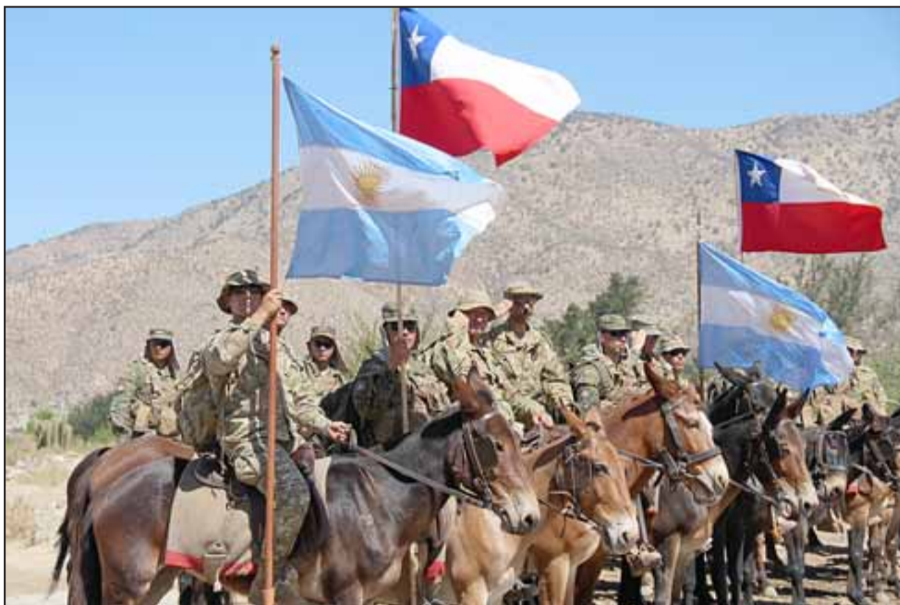
Delegaciones civiles y militares de Chile y Argentina cruzaron con éxito la cordillera, replicando la proeza que hiciera el General José de San Martín hace 200 años.

"La verdad que la expedición siempre tiene la dificultad de la montaña, pero Gracias a Dios no tuvimos ninguna víctima. Todos los accidentes fueron leves. Como les decía recién, esto es un orgullo para poner en valor y estar en el mismo lugar donde