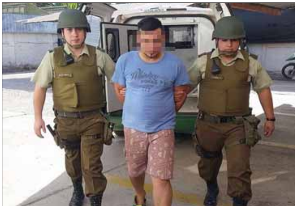
El imputado por homicidio, fue trasladado en horas de la mañana del martes hasta el Tribunal de Garantía de Valparaíso, para su correspondiente formalización de cargos.

Asimismo, el capitán Torres señaló, que continuarán con este trabajo de diligenciar las órdenes de detención a fin de poner en manos de la justicia a los criminales que se encuentran prófugos y que ha decidido ocultarse en esta zona.