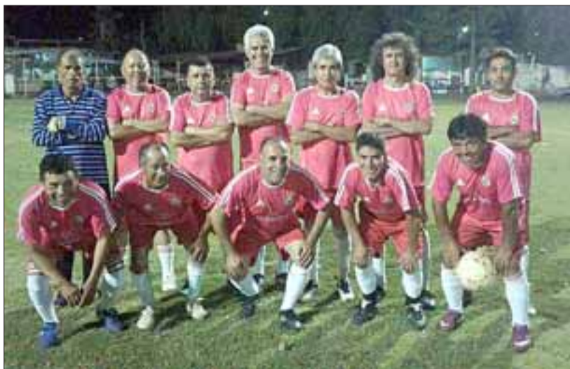
En la fecha pasada del torneo para jugadores mayores de 55 años, Unión Esfuerzo (en la imagen) aplastó a Unión Esperanza.

Miércoles 8 de febrero 19:45 horas, Villa Argelia – Hernán Pérez Quijanes; Andacollo – U. Esfuerzo. Viernes 10 de febrero 19:30 horas, Unión Esperanza – Carlos Barrera; 20:45 horas, Tsunami – Santos; 21:45 horas, Villa Los Amigos – Barcelona.