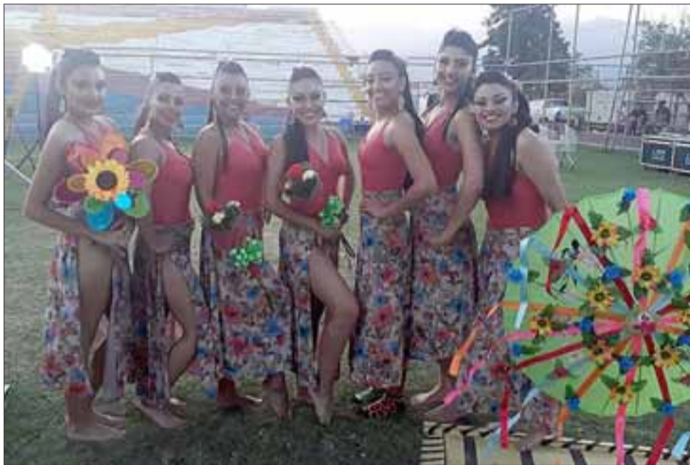
ORI NEWEN.- Aquí tenemos a una parte del elenco de la Compañía de Danza Ori Newen, agrupación sanfelipeña que tiene su propio ritmo para brillar en nuestro valle.