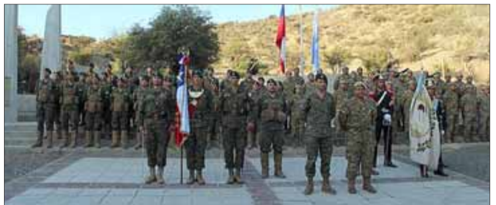
Ejércitos chileno y argentino, erguidos frente a sus pabellones patrios.