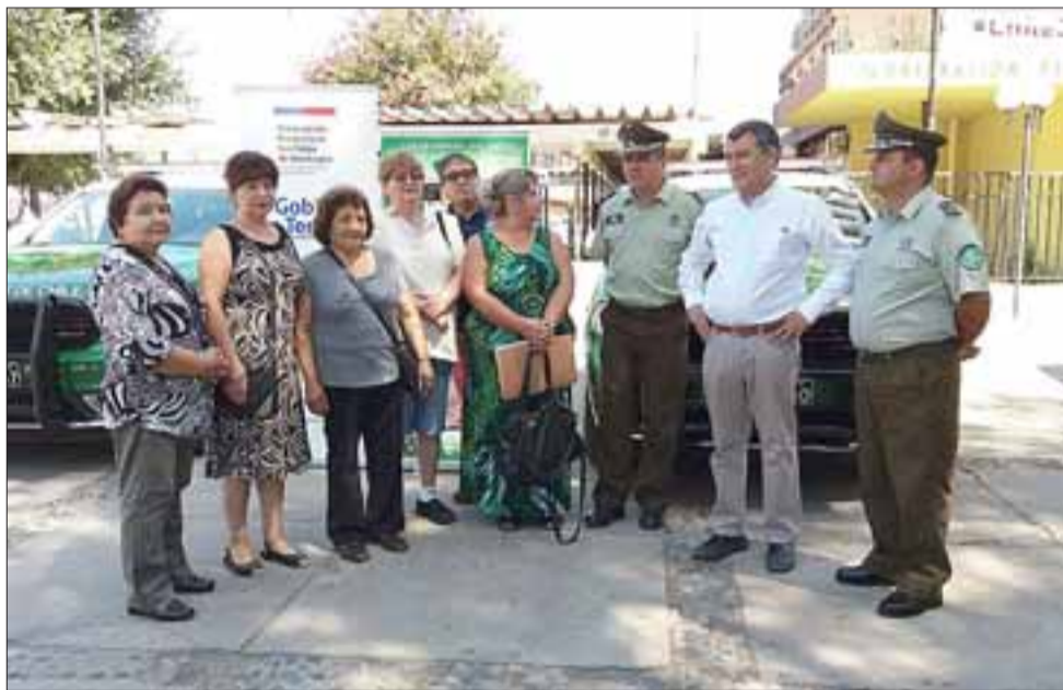
El Gobernador Eduardo León junto a autoridades policiales presentaron a la comunidad la nueva dotación de modernas patrullas con que contará la Prefectura Aconcagua.