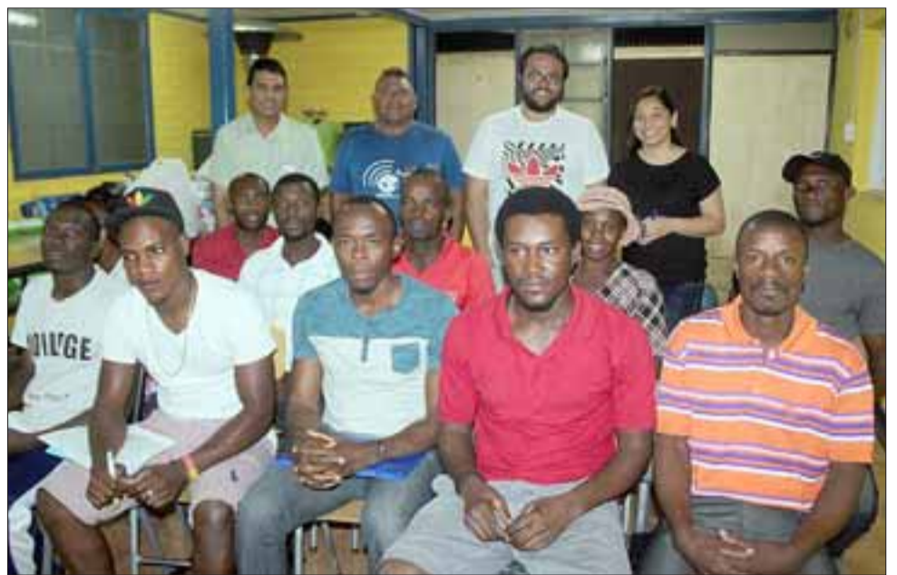
ESTUDIAN ESPAÑOL .- Ellos son parte de la matrícula de haitianos que estudian español en un curso de verano impartido en la Iglesia Adventista del Séptimo Día, en calle Navarro.

nutricionista en el Cefam San Felipe El Real, pero que brinda su tiempo y conocimientos de manera gratuita a favor de estos caribeños.