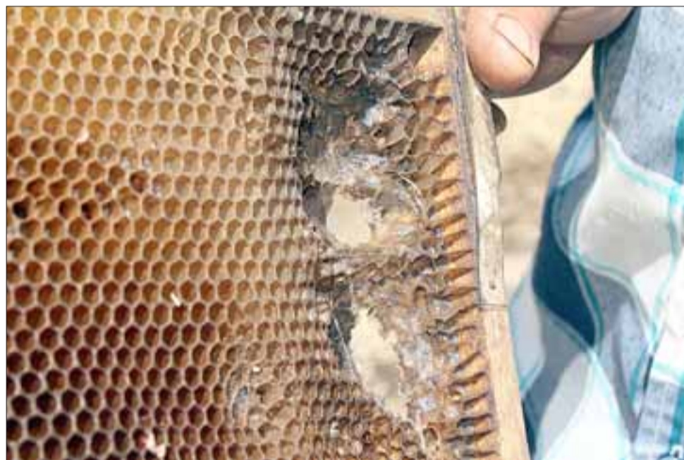
Así quedan finalmente las colmenas, podridas y desabitadas por las abejas, las que mueren a causa del polvo.