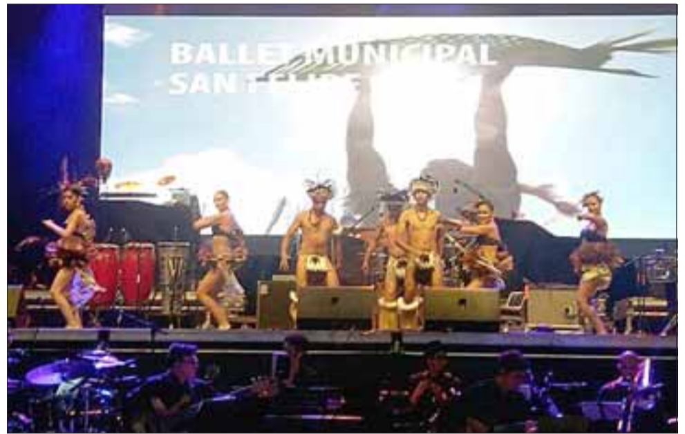
A LO GRANDE.- Así actuaron en fusión con el Ballet Folclórico San Felipe, en el Festival de la Canción Palmenia Pizarro.

En cuanto al director de esta compañía, podemos decir que se trata de un talentoso intérprete e instruc-