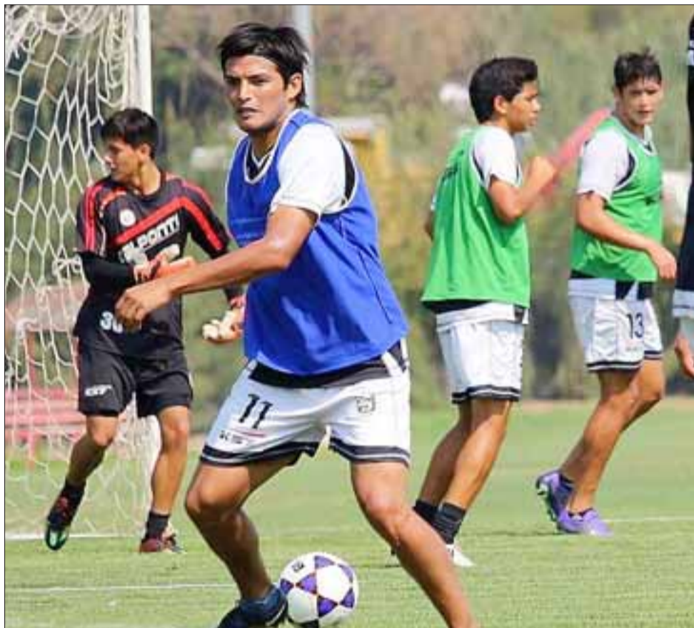
El volante argentino fue el goleador del Uní al anotar dos goles en uno de los duelos amistosos contra Santiago Wanderers.