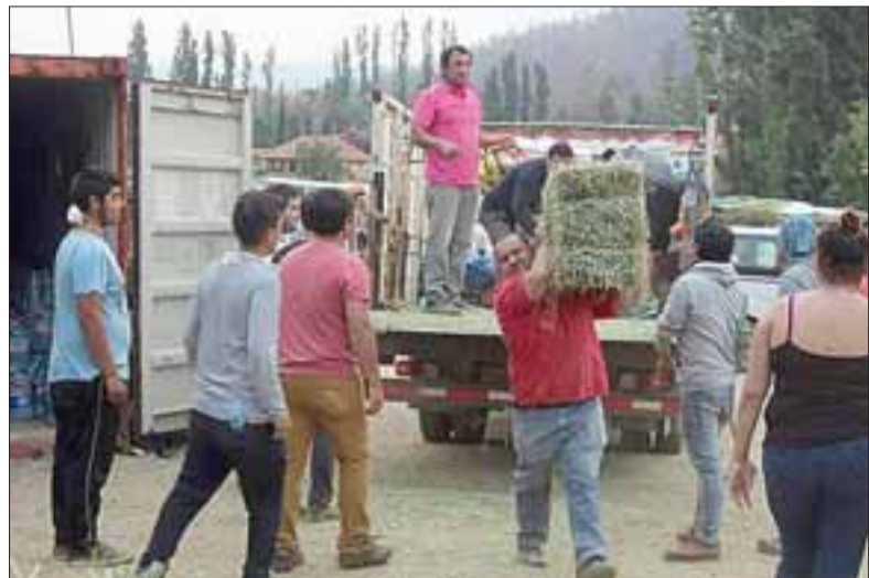
El primer envío de ayuda de los sindicatos de Andina llegó a las cercanías de Molina (en la Región del Maule) y Machalí (en la Región de O'Higgins).