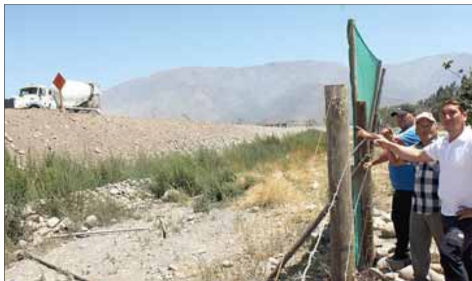
EL PROBLEMA. - Los camiones pasaban a muy baja velocidad para no levantar polvo, cuando se percataron de la presencia de nuestras cámaras en el lugar.

Cuando nuestro medio llegó a investigar y los empleados de esta empresa constructora se percataron de nuestra presencia, de inmediato las camiones disminuyeron la velocidad, pasando muy despacio frente a nuestras cámaras, incluso-