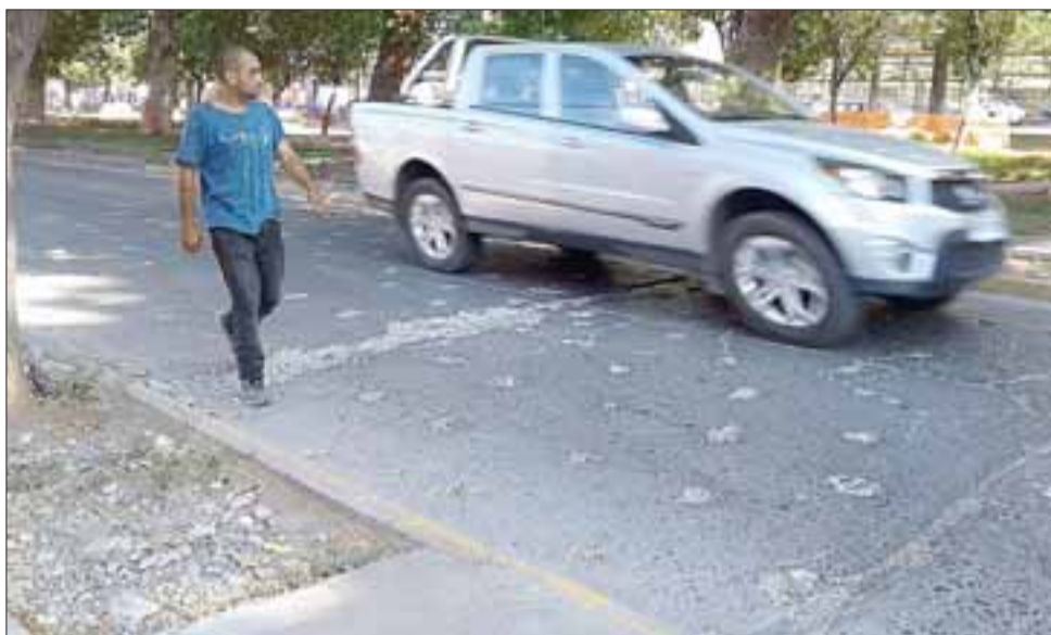
Este es uno de los problemas que se ha suscitado en calle Salinas con Alameda Chacabuco, donde el picado que se hizo se ha ido agrandando.

- Lo que nosotros estamos construyendo es una ciudad mejor, hoy en día estamos abriendo la calle San Martín con Hermanos Carrera, entre Tocornal y Michimalongo, eso va a significar un gran avance de la conectividad vial y también viene en marzo, esperamos sacar el RS del gran proyecto de la circunvalación, va a significar un gran adelanto para la ciudad de San Felipe, es decir