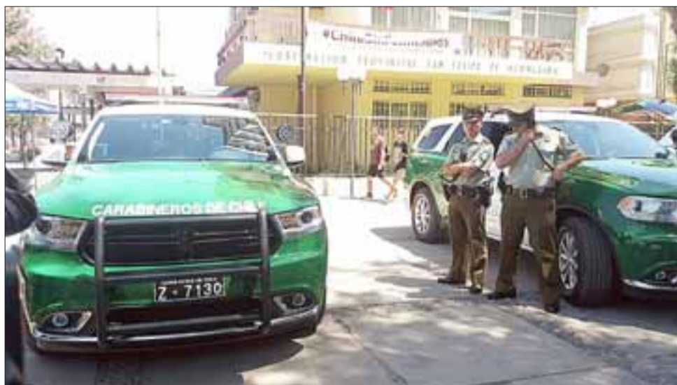
Seis vehículos marca Dodge con tecnología de punta, comenzarán a patrullar las distintas comunas de la Provincia de San Felipe.

trativo de la Prefectura de Carabineros Aconcagua, mayor Fernando Fajardo, recordó que este proceso de recambio de vehículos, es un proyecto institucional que se está trabajando hace unos 4 años, cuando se presentaron iniciativas para mejorar las tecnologías de los móviles que ocupa la