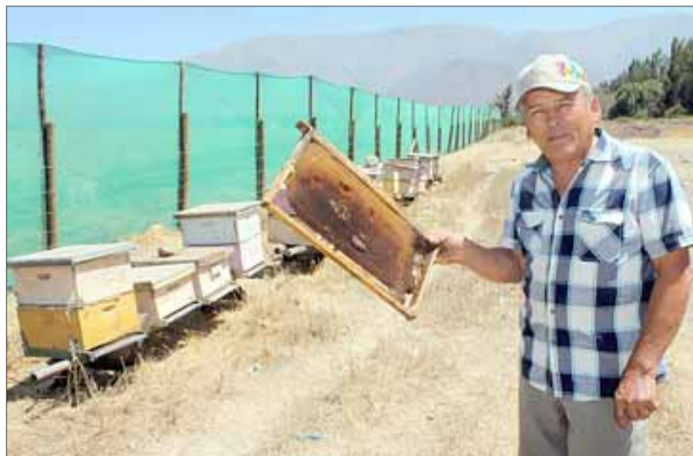
APICULTOR DESESPERADO. - Sólo estas 24 colmenas sobreviven al polvo que esta empresa genera en el sector Parrasía bajo.