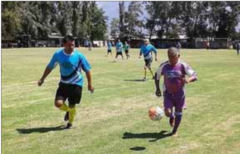
Una jornada cargada de goles fue la que se vivió en la serie central de la Liga Vecinal.

Unión Esperanza 2 – Aconcagua 0; Villa Los Álamos 3 – Andacollo 2; Resto del Mundo 4 – Hernán Pérez Quijanes 2; Carlos Barrera 4 – Los Amigos 1; Pedro Aguirre Cerda 4 – Unión Esfuerzo 0; Tsunami 5 – Santos 0; Barcelona 8 – Villa Argelia 0.