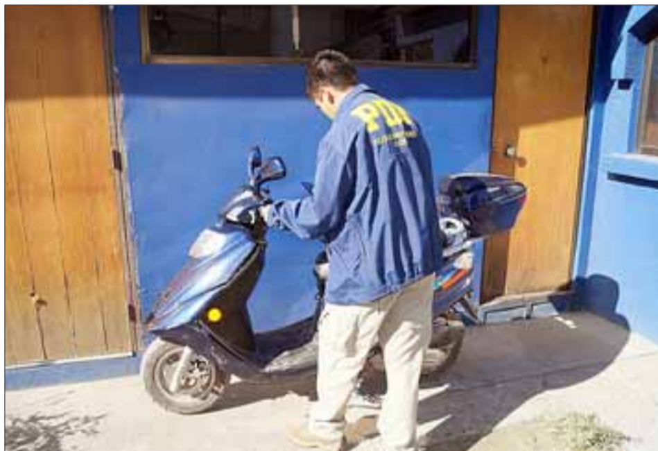
Detectives de la Brigada de Robos de la PDI de Los Andes (Biro) lograron la recuperación de una motocicleta evaluada en 800 mil pesos que había sido sustraída el pasado 29 de enero desde la avenida Yungay en la ciudad de San Felipe