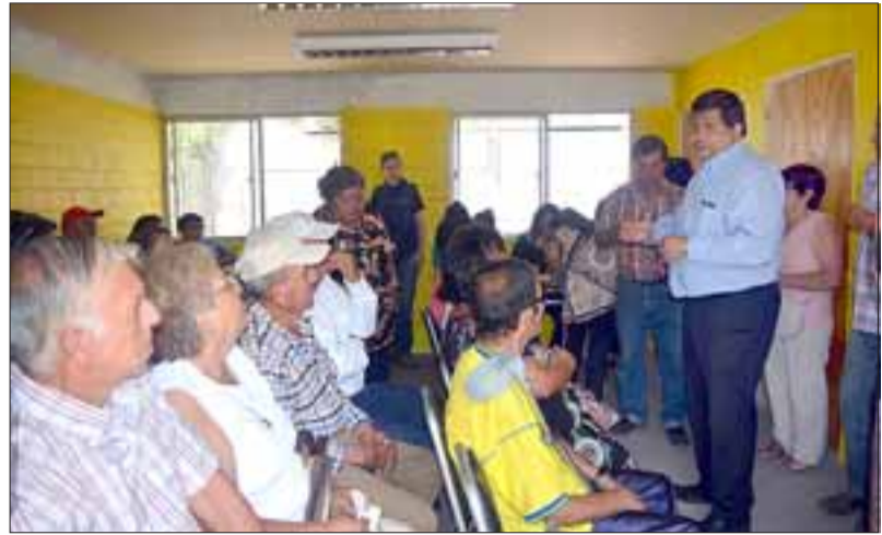
Familias de los Comités Teocalan y Villa Las Cadenas de Santa María, procedieron a la firma de los subsidios para la instalación de paneles termo solares en sus respectivos hogares.

Al tiempo que precisó que más de 200 familias están proceso de postulación a este subsidio en diversos otros comités en la comuna de Santa María.