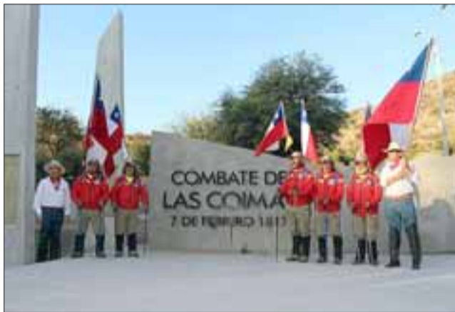
En la tarde se llevó a cabo el acto conmemorativo del Combate de Las Coimas.