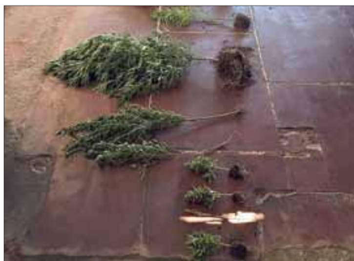
En el allanamiento de la casa que en esos momentos estaba sin sus moradores, encontraron un total de 21 plantas de marihuana de entre 20 centímetros y 2,10metros de altura, además de cannabis sativa y pasta a base a granel.