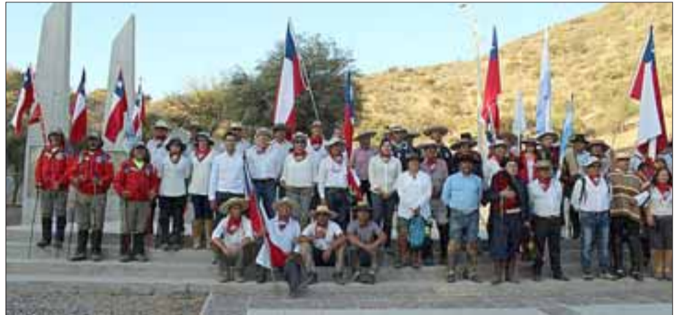
Las banderas chilena y argentina flameaban juntas y los himnos de ambas naciones se entonaron con fuerza y orgullo por parte de las cientos de personas que llegaron a presenciar la culminación de las actividades de Bicentenario.

Las actividades de conmemoración del Bicentenario del Cruce del Ejército Libertador continuarán en la comuna de San Felipe, específicamente en Curimón, y luego en el Monumento a la Batalla de Chacabuco en la Región Metropolitana.