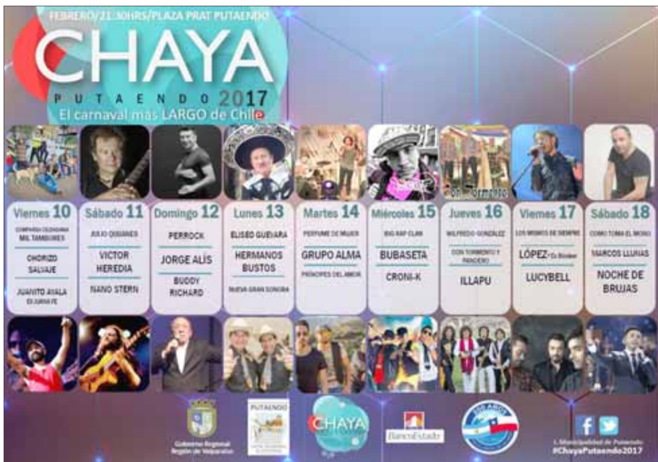
El carnaval 2017, contempla a 27 artistas, destacando a Víctor Heredia, Illapu, Lucybell, Jorge Alís, Marcos Llunas, Noche de Brujas, entre otros. Además se recibirán donaciones, que irán en ayuda a las víctimas de los incendios forestales.