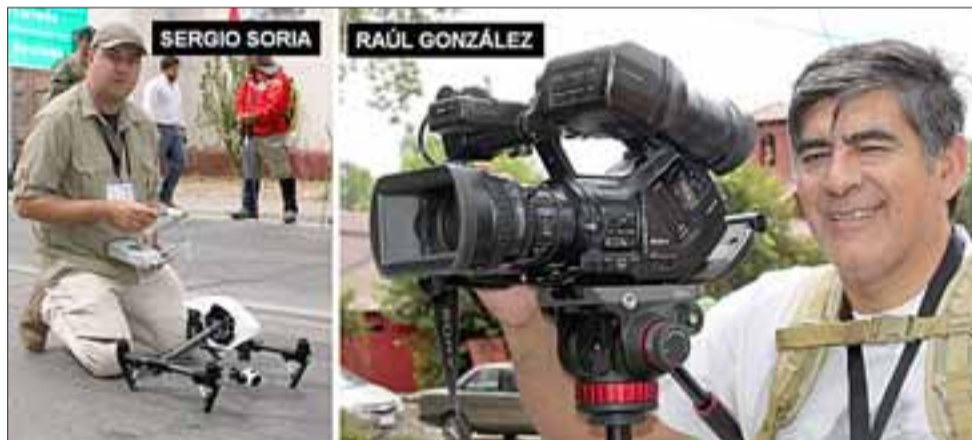
PRENSA EXTRANJERA. - La prensa argentina se hizo presente también, para informar a su país paso a paso todas las etapas de esta histórica travesía.