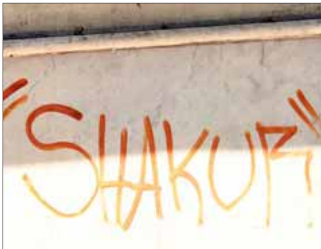
GRAFITIS. - Estos grafitos dejan mucho en evidencia cómo quieren algunos sanfelipeños que se vea nuestra ciudad.