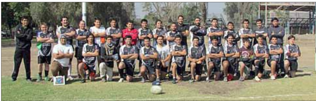
Unos 25 jugadores, conforman la actual plantilla de San Felipe Rugby.

Con los objetivos ya definidos, el 2016 fue el año que comenzó a consolidar a los amantes de 'la ovalada' como institución deportiva. Reúnen un grupo de casi 25 personas y