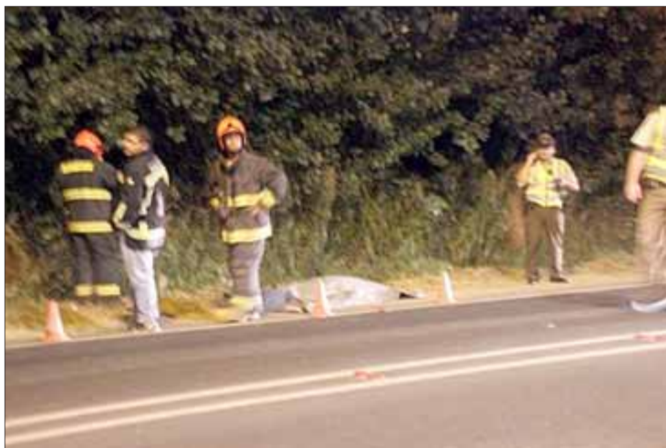
El lamentable accidente ocurrió a eso de las 21:30 horas de este viernes, cuando un menor de 14 años de edad falleció luego de ser atropellado por un furgón en la carretera E-71 que une Putaendo con San Felipe.

norte a sur, vale de decir en dirección a San Felipe, falleciendo en el mismo lugar producto de las graves lesiones en el atropello.»