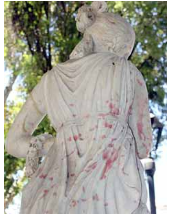
CON PINTURA. - Esta por ejemplo, está pintada en rosa atrás, bien podría ser sólo algo que se quite con agua, pero también puede ser más serio el daño.