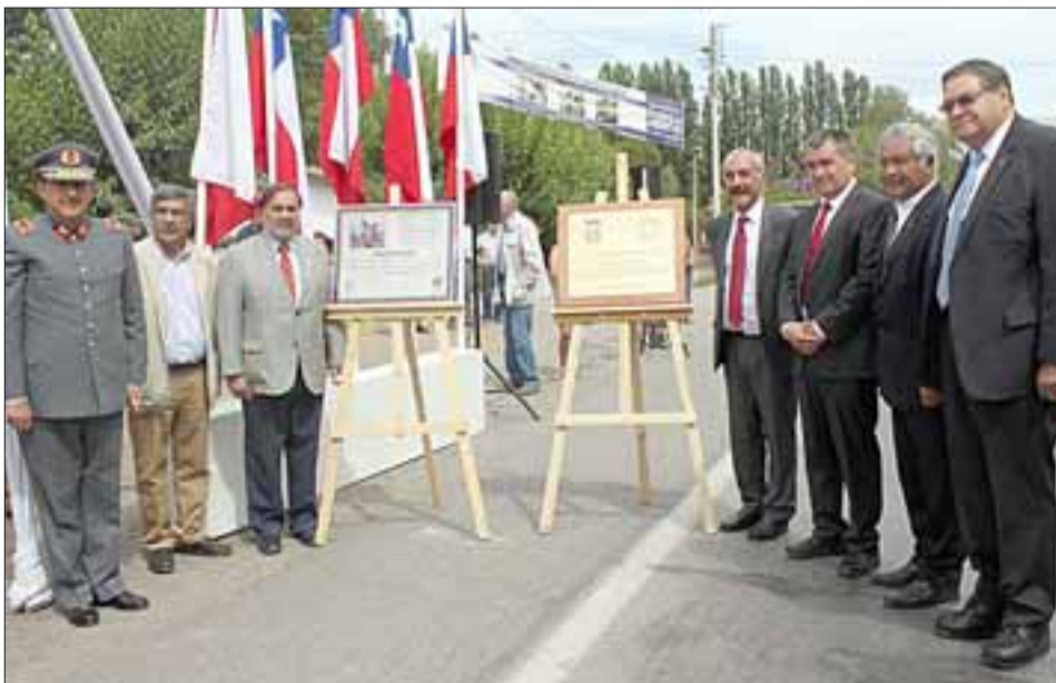
LAS AUTORIDADES. - Las autoridades posan para nuestras cámaras al lado de las placas conmemorativas que develaron minutos antes.