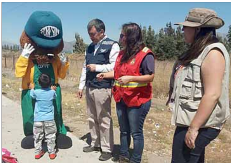
Personal del organismo forestal, con el apoyo de Carabineros y los gobernadores provinciales de San Felipe y Los Andes, atendió a más de 180 personas en Llay Llay y en el complejo fronterizo en Los Andes.

En la provincia de Los Andes, en tanto, agregó que "se han desarrollado cuatro campañas de difusión, las cuales han consistido en la asistencia a tres ferias ciu-