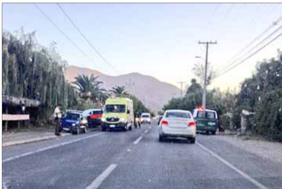
Personal del Samu y Carabineros en el lugar del accidente en Catemu Chagres