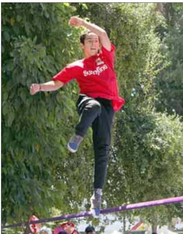
MUY EN ALTO. - El talento sanfelipeño se elevó muy alto durante esta jornada del Slackline.

Para nuestros lectores que no estén muy familiarizados con la práctica de esta actividad, el slackline es un deporte de equilibrio en el que se usa una cinta que se engancha entre dos puntos fijos, generalmente árboles, y se tensa. En el slackline se camina sobre una cinta pla-