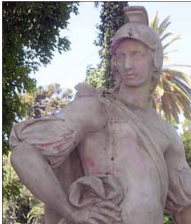
HAY QUE INSPECCIONARLAS. - Ninguna se escapó, las estaciones están de nuevo maltrechas, aunque el Municipio se ha esforzado por restaurarlas, pseudo humanos rápidamente las dañan y pintan.