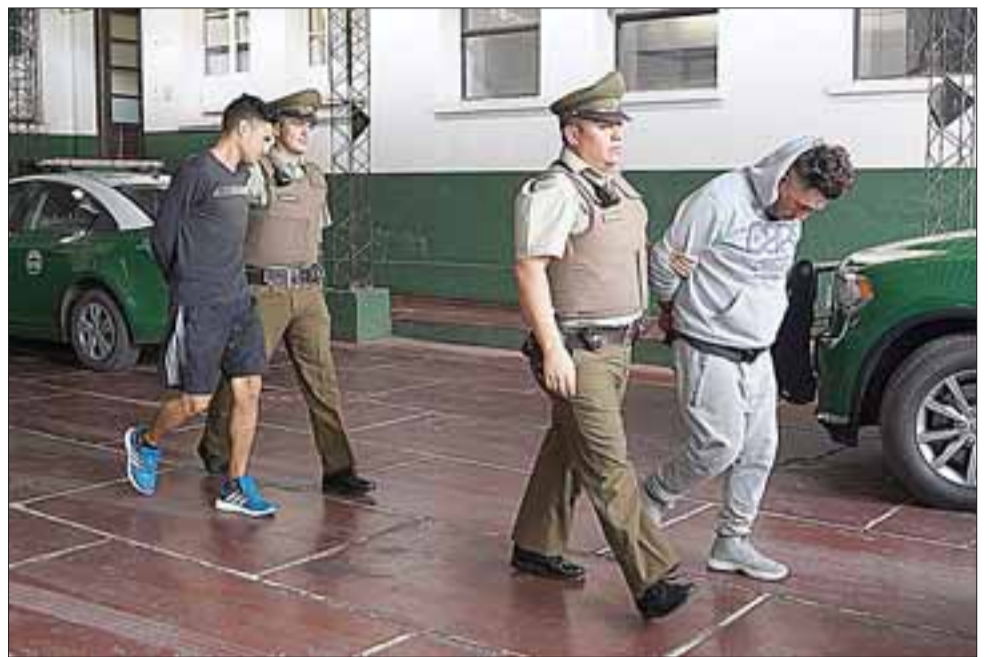
Una banda compuesta por cinco delincuentes santiaguinos fue detenida en horas de la madrugada de este viernes por personal de Carabineros, cuando se aprestaba a perpetrar un robo en la tienda ABCDin de Los Andes.

El capitán Torres insistió en que el modus operandi que mantenían los antisociales era bastante específico, "los horarios bastante delimitados y obviamente el actuar bastante rápido, razón por lo cual a posterior nosotros solo teníamos el denuncia respectivo, los forados en los techos, no había otro tipo de antecedentes como tampoco testigos que nos permitiera obtener algún tipo de información o posible sospecha, la verdad es que el actuar era bastante rápido bien sofisticado y con una coordinación bien estable-