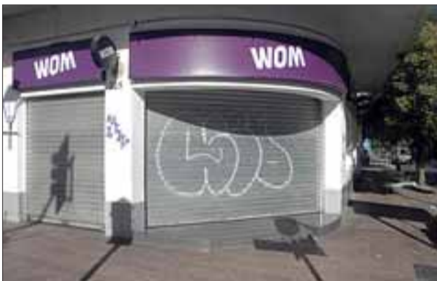
Empresa de telefonía 'Wom' ubicada en la esquina sur de calles Maipú con Rodríguez.

Finalmente, el comisario de Carabineros de Los Andes destacó el trabajo focalizado que se ha estado llevando cabo en las últimas semanas en el centro, lo cual ha permitido el arresto de siete antisociales que pretendían robar a locales comerciales.