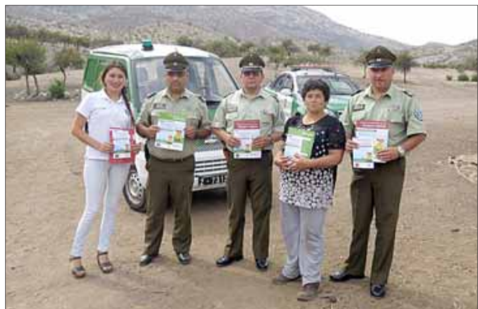
En zonas rurales, la campaña estuvo enfocada a la prevención de Incendios Forestales.