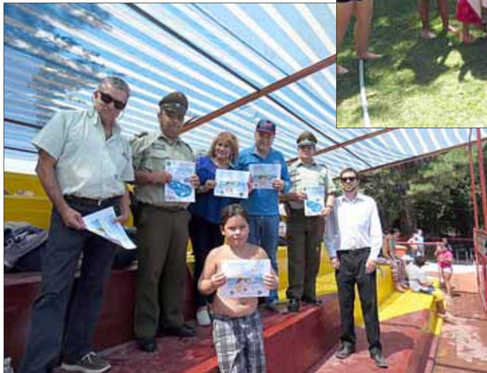
Carabineros de la Oficina de Integración Comunitaria de San Felipe entregando volantes informativos en piscinas.