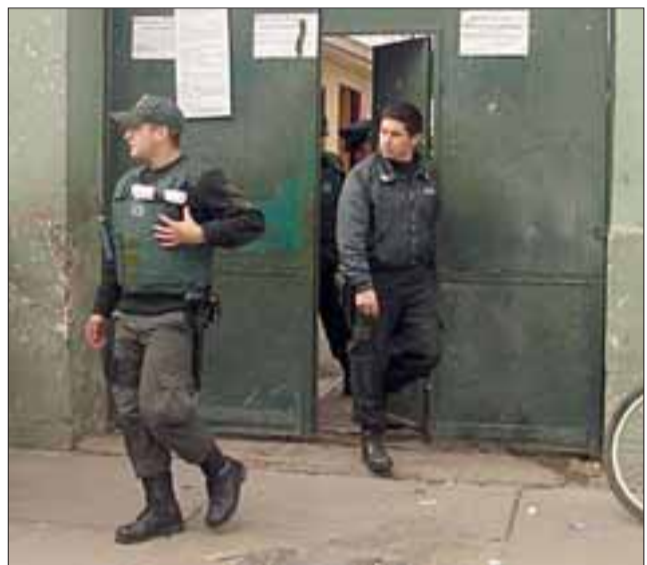
El CCP San Felipe, habría mejorado las condiciones laborales del personal de Gendarmería (foto referencial).