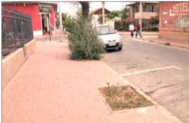
Uno de los grandes temas para la comuna, se refiere a la recuperación y mantención de áreas verdes de Los Andes.

“Somos una ciudad que en los últimos años ha perdido mucha arborización y en ese plan, que va a incluir el Cerro de La Virgen, queremos que sean ustedes, los propios vecinos los guardianes de nuestros árboles”, agregó Rivera, con el objeto de crear conciencia también en la comunidad, de que trabajando juntos Los Andes puede ser un lugar mucho más amable, limpio y ordenado.