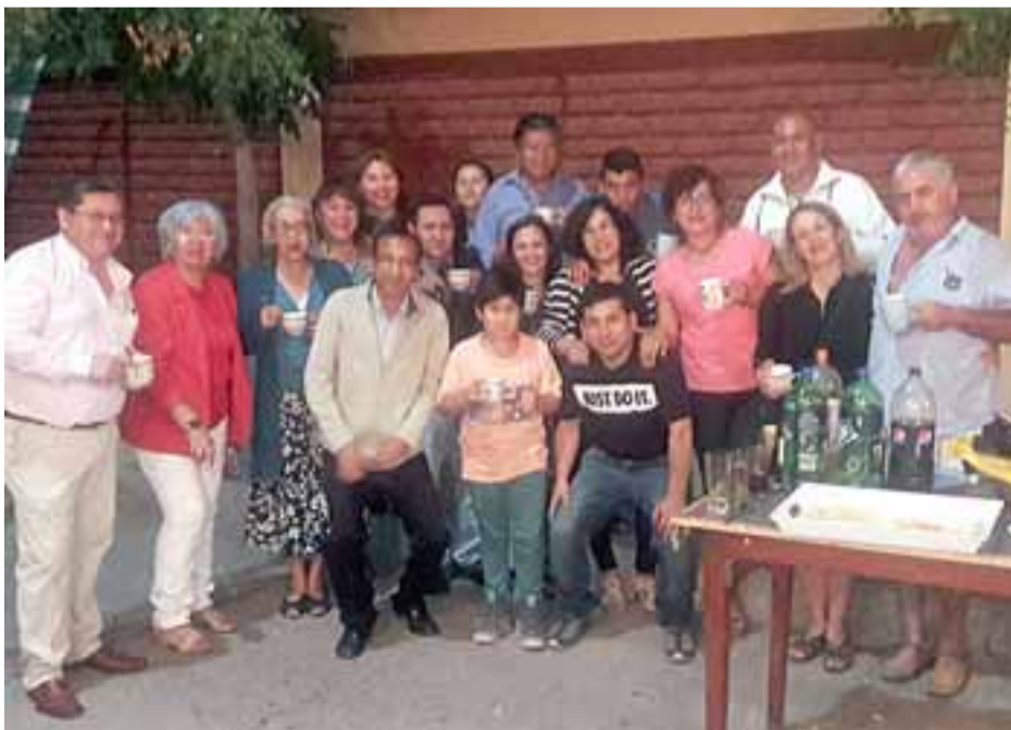
MALÓN DE FEBRERO. - Aquí tenemos a varios vecinos de Población Aconcagua, posando para nuestras cámaras.

misma población, mientras que se espera que muy pronto se pueda realizar otro encuentro comunitario, en esta oportunidad este Malón se desarrolló en Pasaje Guillermo Ibáñez.