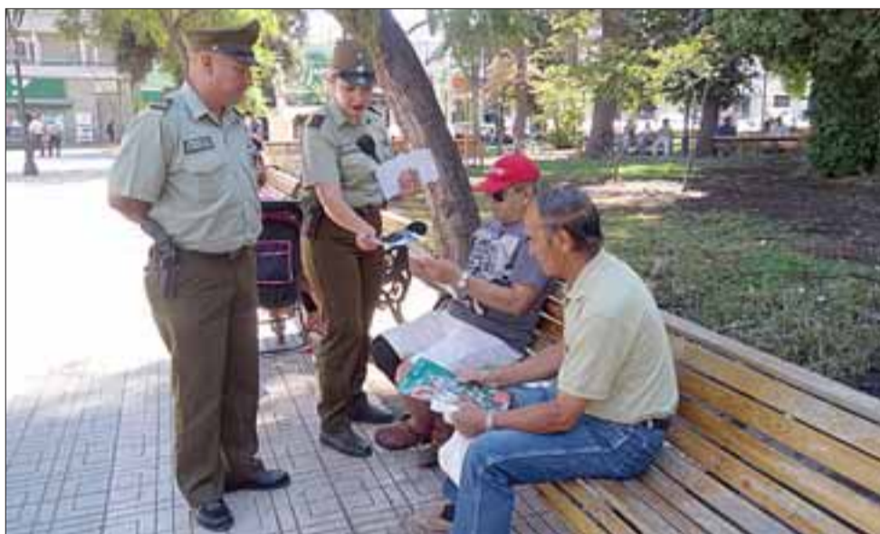
Efectivos policiales de la oficina de integración comunitaria de la Segunda Comisaría de Carabineros de San Felipe, efectuaron una campaña preventiva contra delitos de hurto y receptación de artículos robados.