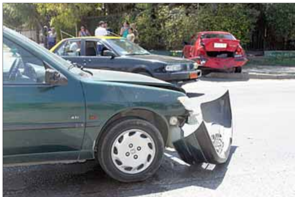
Situación preocupante. - Algunos vecinos nos pidieron establecer que en este sector de Calle Encón los accidentes están ocurriendo todos los días.