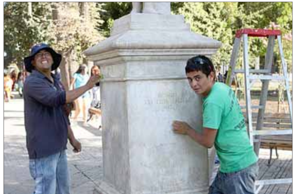
MANOS A LA OBRA. - Personal de talleres municipales aún trabajaban ayer lunes a las 18:00 horas, pues desde muy temprano iniciaron el proceso de limpieza.