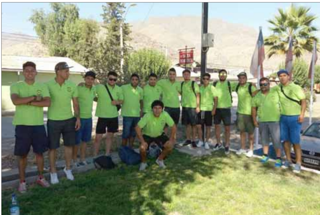
Después de ganar como forastero, Unión Delicias tiene muchas posibilidades de meterse en la Copa de Campeones.

Parrayes (Llay Llay Rural) 4 – El Sauce (San Esteban) 3; Victoria Morande (Llay Llay) 1 – Bandera de Chile (Viña del Mar) 4; El Guindal (Calle Larga) 2 – Unión Delicias (San Felipe) 3; *Unión Católica (Nogales) – Santa Rosa (Santa María). *Suspendido