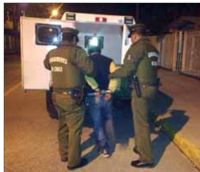
El imputado fue derivado hasta tribunales por Carabineros sindicado como el autor de robo con intimidación ocurrido en Catemu.

En el caso del presunto asaltante, el médico de turno lo diagnosticó con un traumatismo encéfalo craneal complicado, herida cortante y policontuso de carácter leve. En tanto la víctima del asalto, resultó con heridas con arma blanca y otras lesiones leves, mientras que su hermano producto del enfrentamiento con el imputado, resultó con herida cortante, esguince de tobillo de