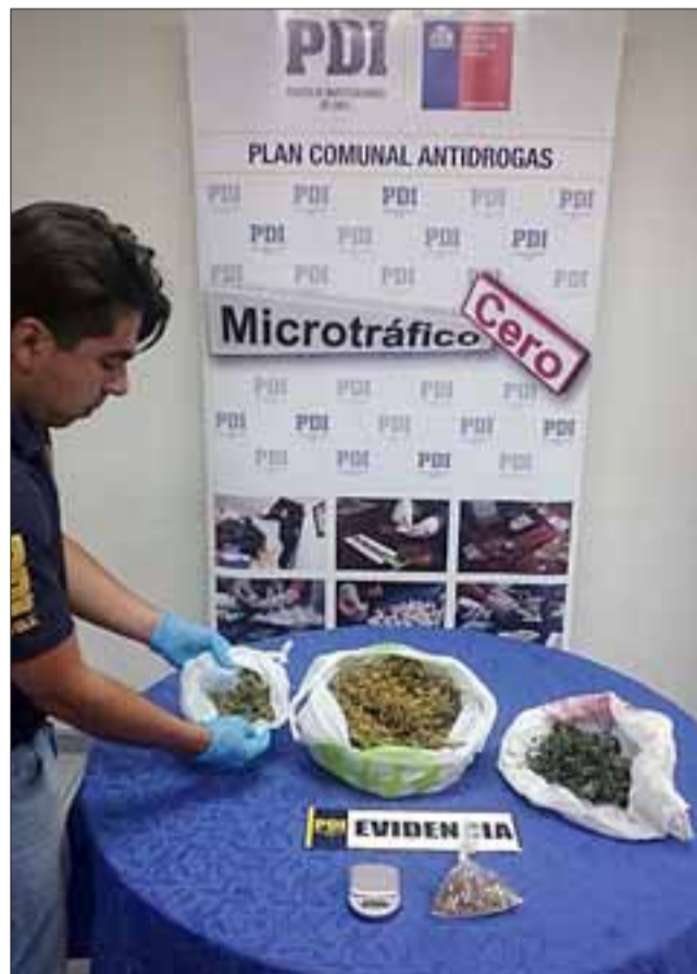
Efectivos de la Brigada Microtráfico Cero de la PDI allanó una vivienda la comuna de Llay Llay incautando marihuana a granel y plantas de cannabis sativa. A raíz de este procedimiento resultaron dos personas detenidas formalizadas por microtráfico.

Las diligencias se efectuaron, tras denuncias de vecinos de calle Ignacio Carrera Pinto en Llay Llay, advirtiendo a la policía el comercio de drogas a adictos del sector.