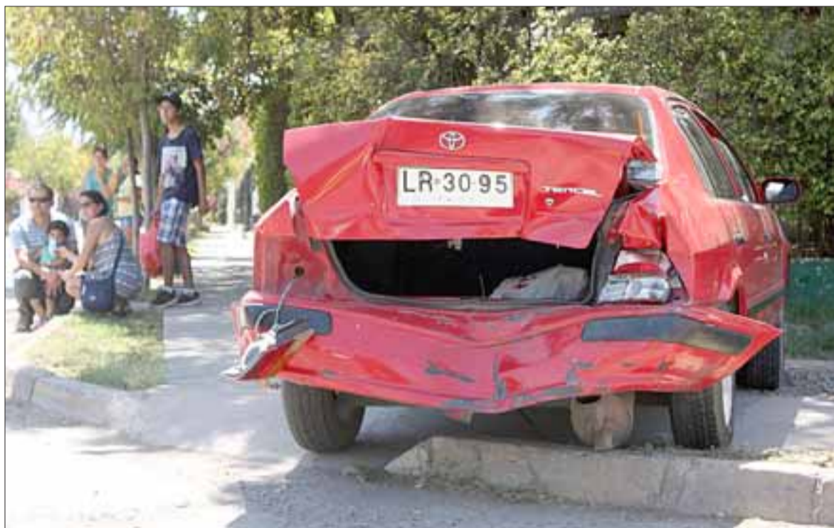
VIVOS DE MILAGRO. - Al fondo vemos, sentados en la acera, a una familia completa completamente asustada tras ser embestidos por otro vehículo cuando pretendían virar a una población desde Calle Encón.