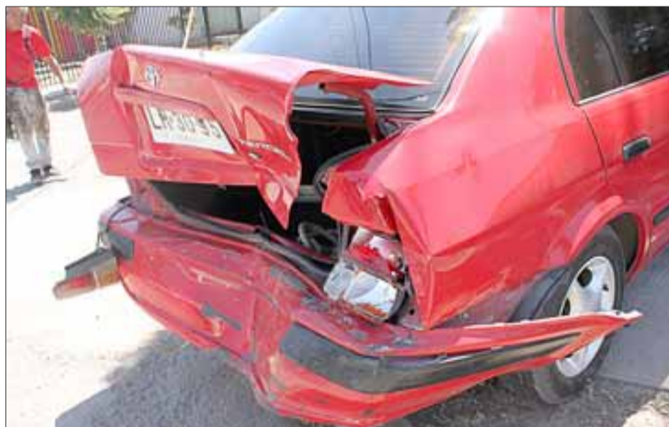
DAÑOS MATERIALES. - Así quedó la parte trasera del Tercel rojo patente LR 3095, luego que fuera colisionado por atrás.