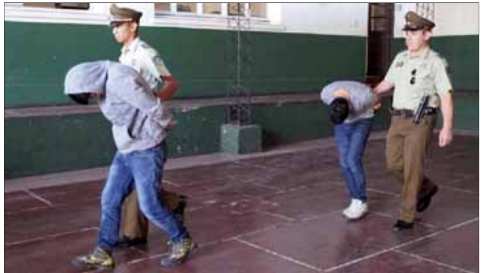
Dos antisociales, uno de ellos con cinco órdenes de detención vigentes, fueron arrestados por Carabineros al ser sorprendidos robando especies desde el interior del local de una empresa de telefonía situada en el centro de la ciudad.

Este último delincuente registrada cinco órdenes de detención vigentes, una de ellas para entrar a cumplir una condena de 541 días por