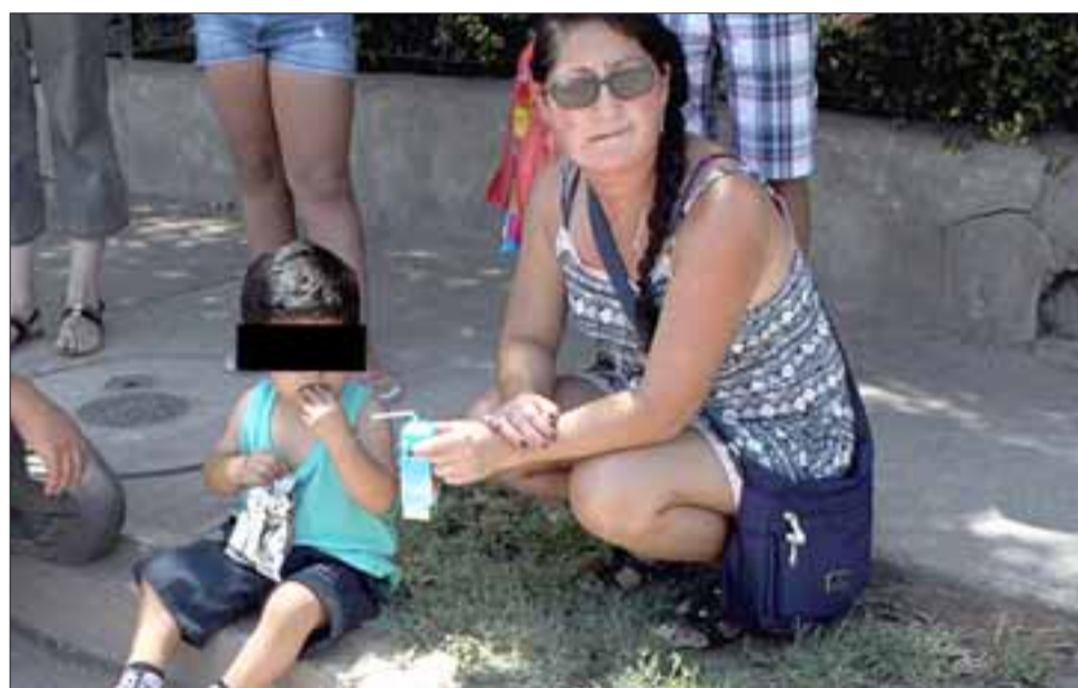
NIÑO Y SUS PAPÁS A SALVO. - El pequeño fue tranquilizado y puesto a salvo tras la colisión vehicular.