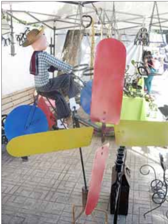
BICICLETA VOLADORA. - Esta veleta de viento, es ideal para alegrar lo más alto de cualquier vivienda, también nos indica la dirección del viento y hasta su velocidad.