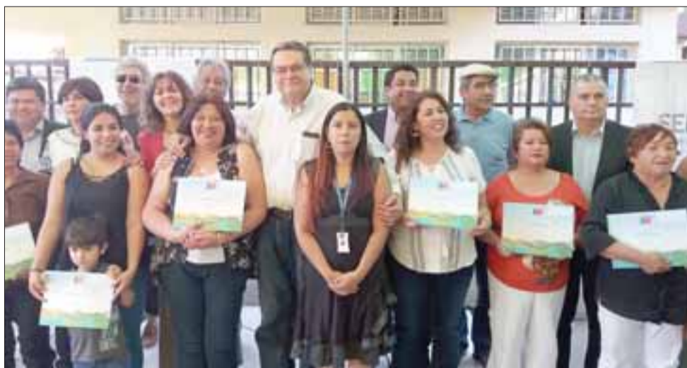
Parte de los beneficiarios que podrán optar a una vivienda nueva o usada o construir en el sitio que estimen conveniente.