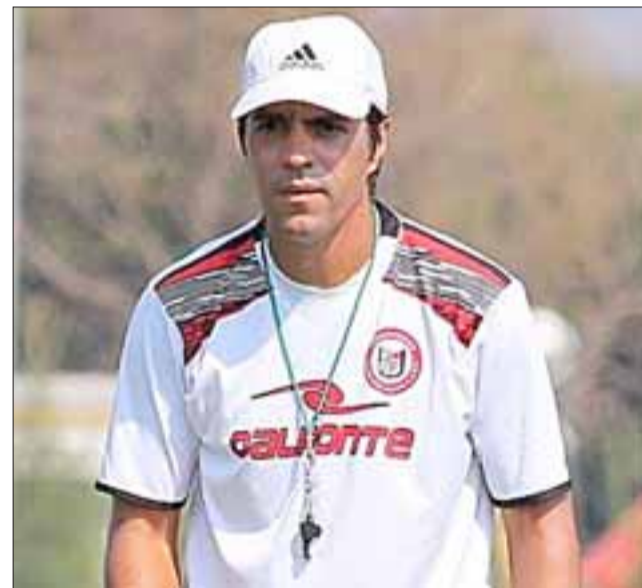
El técnico mostró su certeza que luego vendrán los triunfos para su equipo.