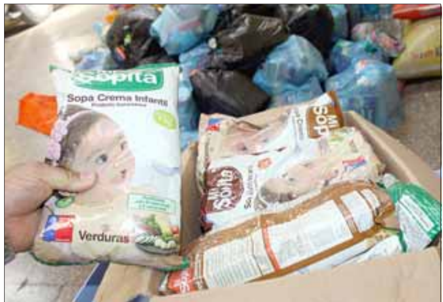
TOTAL SOLIDARIDAD.- Los vecinos de Llay Llay no escatimaron esfuerzos ni recursos para nuestros hermanos del sur.