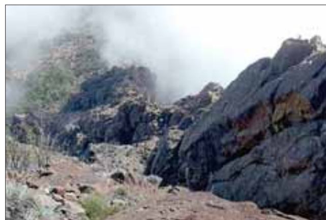
El rescate de los excursionistas se vio complicado por un incendio forestal generado por los mismos afectados que encendieron una fogata para ser localizados.

Sepúlveda agregó que la principal misión de los equipos bomberiles fue el rescate de los cuatro excursionistas y disponer el traslado del herido hasta un centro asistencial. El oficial descartó que se haya reque-