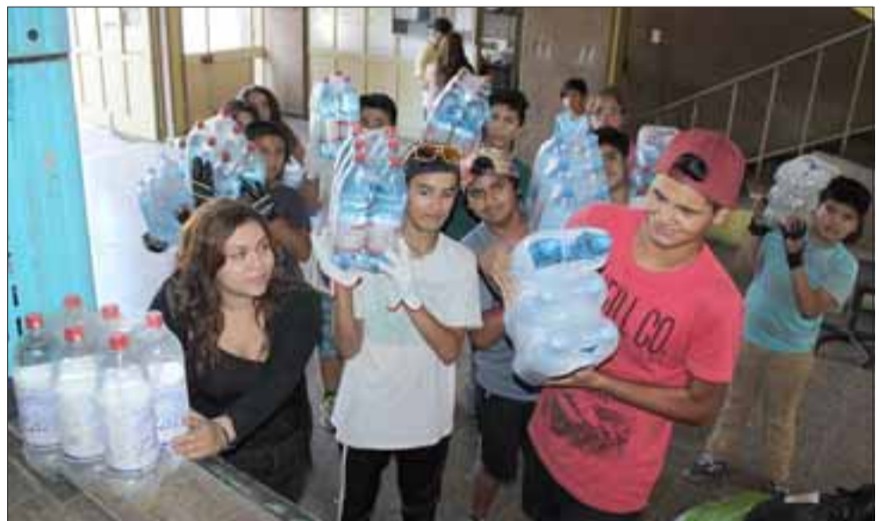
TONELADAS DE AGUA.- Fueron más de tres semanas de recibir y seleccionar los donativos que cada llayllaíno llevó al cuartel de Bomberos.