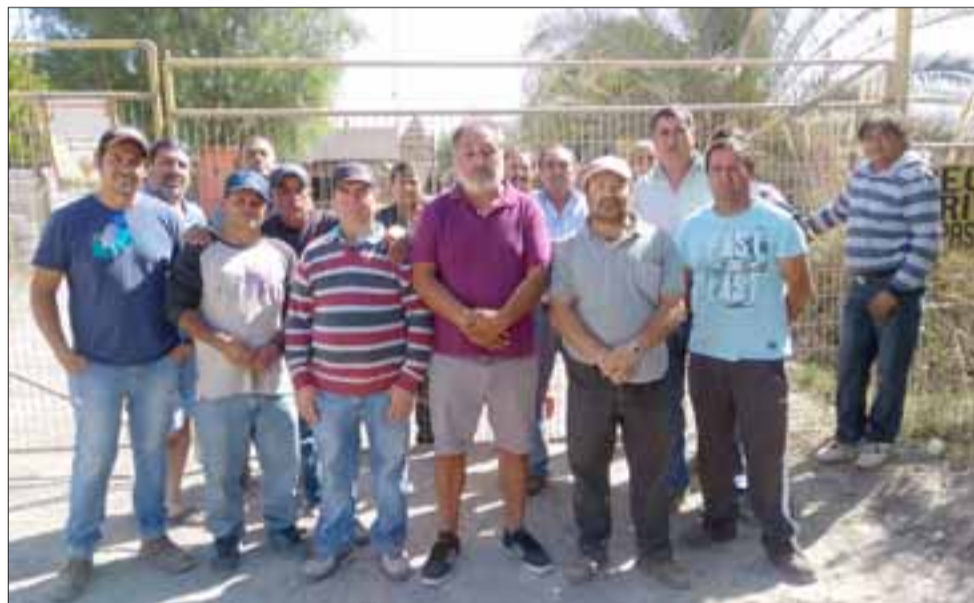
Trabajadores de Áridos Tres Esquinas viven en la incertidumbre respecto de su futuro laboral y económico.