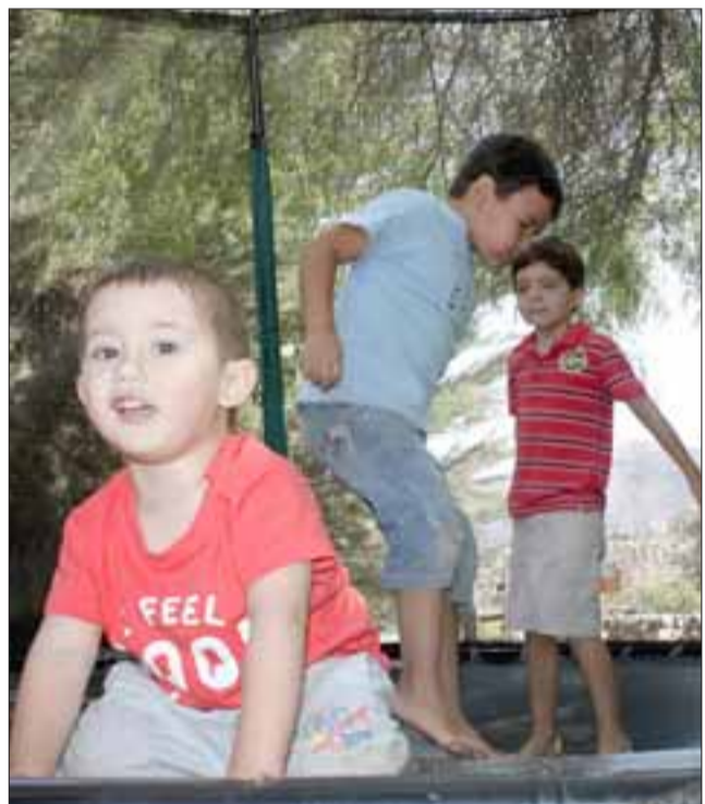
JUEGOS INFANTILES.- También hay espacio para que los pequeñitos se den el gusto jugando.