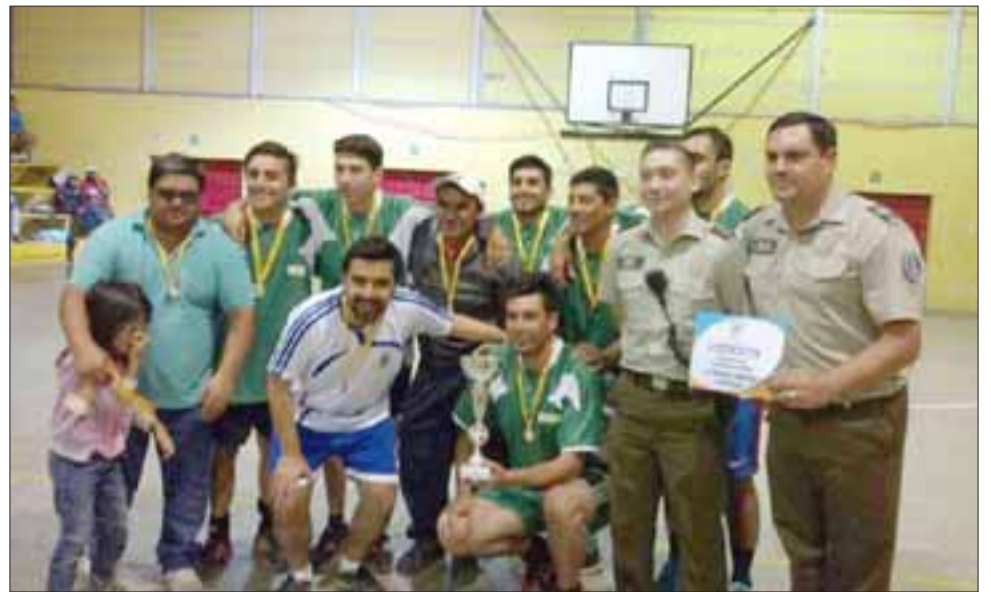
El representativo de Población Los Copihues se tituló flamante campeón en el Primer Campeonato Comunitario de Babu Fútbol.

La gran final de este primer campeonato se vi-