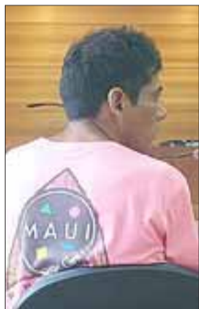
El detenido acababa de recuperar su libertad solo días antes de volver a ser sorprendido y detenido en pleno hurto.

Antisocial acababa de salir en libertad tras cumplir condena por otro hurto.