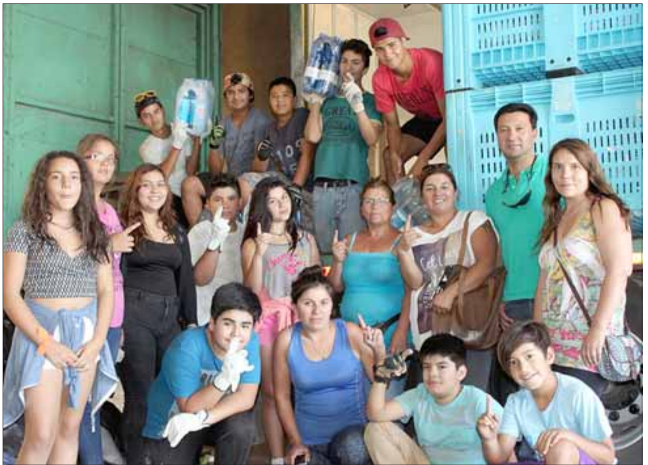
CADETES AL FRENTE.- Aquí tenemos a gran parte de los cadetes involucrados en esta tarea solidaria de casi un mes de duración.

«Somos unos doce cadetes, tenemos entre 11 y 17 años de edad, hay mucha voluntad de trabajar por los hermanos del sur, agradezco a los chiquillos y a tantos vecinos que llegaron al cuartel para dejar su donativo. La ciudad en la que entregaremos estos productos es Vichuquén, que es una comuna de la zona central de Chile, ubicada en la