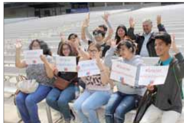
Comunidad sorda de todo el país espera ansiosa el primer Festival de Viña donde podrán disfrutar del humor a través de la lengua de señas.

“La mayoría de los chilenos hemos crecido con este festival. Sin embargo un gran número de compatriotas -las personas sordas- nunca han podido participar de este espectáculo veraniego porque la transmisión televisiva no ha contado con lengua de señas para permitir su inclusión. Esta es una buena noticia para cerrar las actividades de verano, es una señal potente y tenemos la esperanza de que en lo sucesivo este festival será transmitido íntegramente con el apoyo en lengua de señas. Esperamos que este año también avance rápido la discusión de un pro-