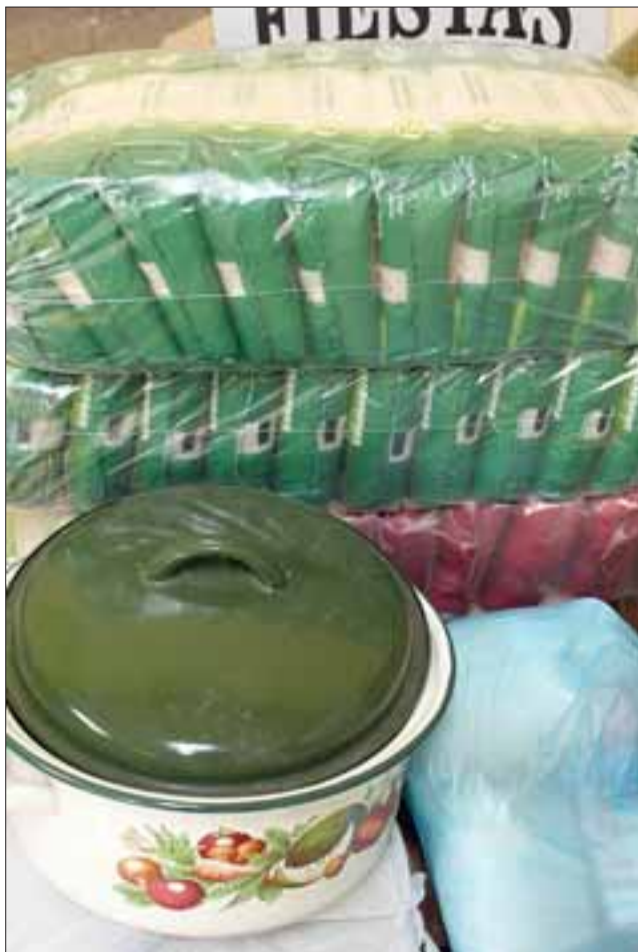
¡ASÍ SE HACE!.- Bolsas de arroz, utensilios de cocina y mucho cariño, es lo que recibieron estos vecinos en el sur tras la campaña solidaria llayllaína.