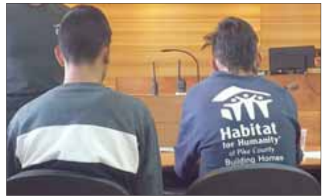
Ambos delincuentes fueron formalizados y dejados en prisión preventiva ya que solo cuatro días antes, el lunes pasado, habían sido dejados en libertad al ser sorprendidos portando un arma de fuego.

El delincuente que recibió los balazos fue R.O.N.C. en cuyo poder se encontró el celular del carabinero y el