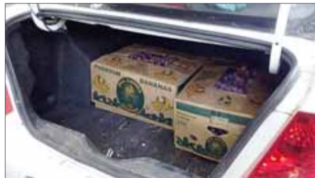
Carabineros detuvo a dos sujetos por el robo de uvas de exportación. Los frutos fueron hallados al interior de este vehículo utilizado por los imputados.