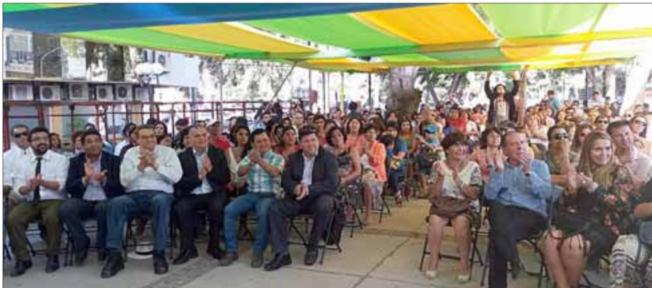
Alrededor de 100 personas participaron en la entrega de subsidios habitacionales donde participó el gobernador, SERVIU, alcaldes y autoridades locales.