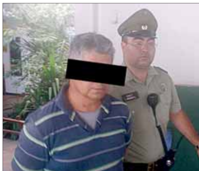
El imputado L.P.F. , de 52 años, padre del presunto autor del disparo, fue detenido por Carabineros de Santa María.