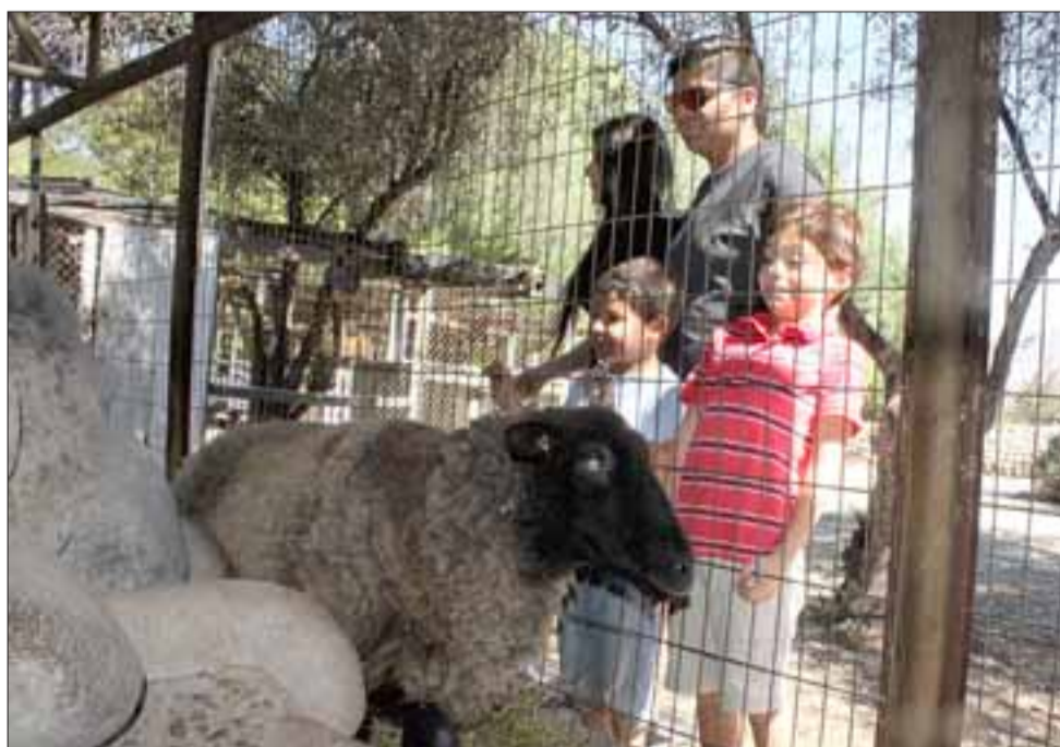
GRANJA EDUCATIVA.- Los animalitos de la granja son el deleite de los más chicos, también hay cerditos, un pony y muchas gallinas.