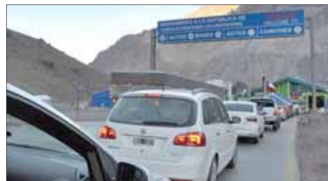
A la fecha, desde el primero de enero y hasta el domingo 12 de febrero, son más de 320 mil los turistas que han ingresado por Los Libertadores.

Agregó que "cerca del 90% de estos turistas extranjeros son argentinos, quienes llegan al país a tra-