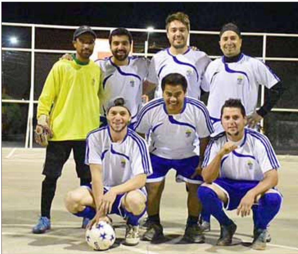
La Municipalidad de Llay Llay se alzó con el segundo lugar en una apretada final con Los Copihues

vió el día viernes 17 de febrero en el Gimnasio Municipal, obteniendo la copa del Primer Lugar el equipo de Pobl. Los Copihues, quien se enfrentó a I. Municipalidad de Llay Llay, quienes quedaron en el segundo lugar. Por su parte el tercer lugar lo obtuvo el equipo de Carabineros y el cuarto lugar la Pobl. Juan Cortés.