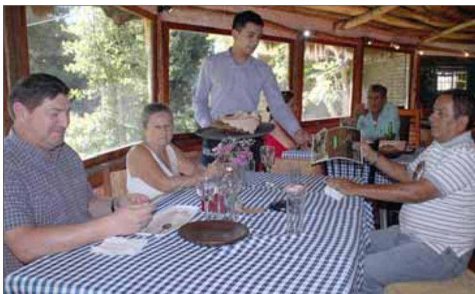
BUEN APETITO.- Familias enteras han preferido este restaurante tradicional durante más de 20 años. Esta casa del sabor está ubicada en Quebrada Herrera s/n.

tradicional de Puro Campo. «Nuestra Cocina es de lo más variada, ofrecemos el Plato Puro Campo; pastel de choclo; parrilladas a la