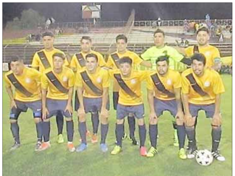
Unión Delicias de San Felipe logró clasificar al cuadro final de la Copa de Campeones.