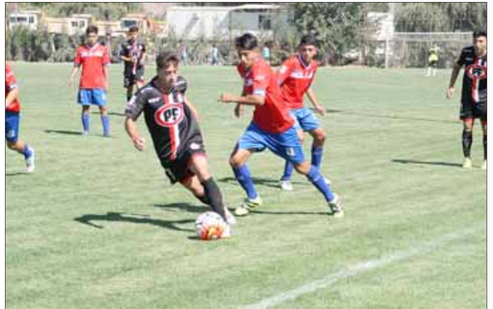
Un inicio ganador frente a La Calera tuvieron los cadetes del Uní en el torneo de Fútbol Joven.