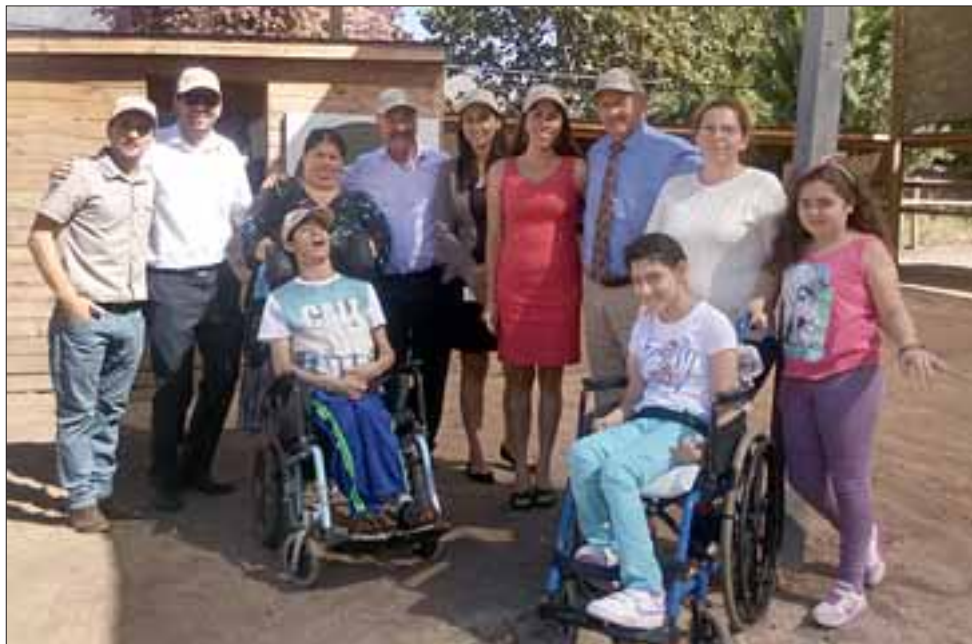
Alumnos de la Escuela Sagrado Corazón y de la Casa Azul, están asistiendo a terapias que son financiadas por el municipio gracias al Fondo de Apoyo a la Educación Pública.