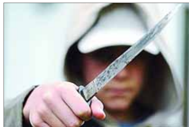
El precoz delincuente de 16 años de edad habría intimidado con una cuchilla a los dos adolescentes que sufrieron el robo de sus teléfonos celulares, siendo detenido por Carabineros. (Foto Referencial).

Posteriormente, ambas víctimas reconocieron al detenido como el autor del robo con intimidación, logrando la recuperación de uno de los móviles sustraídos.