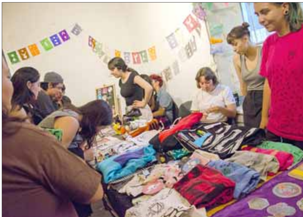
LA FERIA.- Otros músicos invitados también aprovecharon para realizar su tradicional feria, para variar un poco.