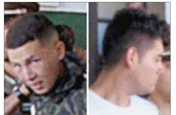
Se aprehendió a F.A.P.J., D.A.R.C., C.E.H.O. y J.L.M.M., quienes la mañana del mismo día fueron llevados al Juzgado de Garantía donde se desarrolló la audiencia de control de la legalidad de la detención.

Respecto a lo encontrado y recuperado por Carabineros, hizo presente que "hay especies que habían sido denunciadas como robadas y estamos verificando la sustracción de las otras, pero eventualmente el hallazgo podría configu-