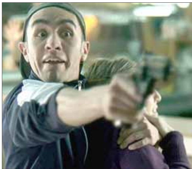
DESEQUILIBRANTE. - Este secuestrador conocerá toda la furia de nuestro personaje principal de la película.