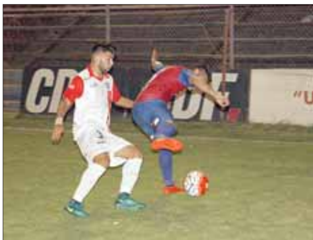
Tras una fecha libre, en el puerto de la cuarta región el Uní volverá a la competencia de la B.