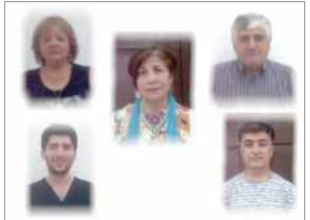
Hoy se hace la entrega de certificados a quienes cumplieron con los requisitos de asistencia y habilitación en el curso 'Dicción y Oratoria', dictado por el Departamento de Cultura de la I. Municipalidad.