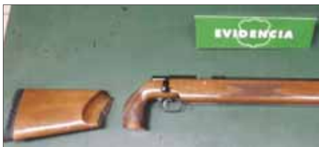
Entre las especies que fueron recuperadas se cuentan un data show, teléfonos celulares, una cámara de video, mochilas, un equipo intoxilyzer, un medidor de glicemia y prendas de vestir.