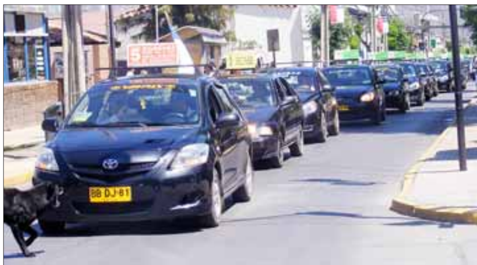
Dirigentes del Consejo Superior y Federación de Líneas de Taxis Colectivos de San Felipe, expresaron su disconformidad por tratarse de un plan inconsulto a todos los involucrados.

"Nosotros necesitamos tener antecedentes válidos, en que va a consistir la co-