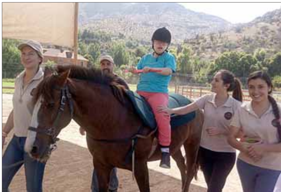
En total son 30 los menores que se están beneficiando de este convenio entre la municipalidad y la Fundación Equiendo.

«Hay diferentes beneficios de esta terapia, por