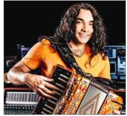
El carismático Alexítico, líder de 'La Noche', será uno de los atractivos de la jornada del jueves 23 de febrero.

día sábado 25 de febrero, se presentará la banda «Dulce Locura», para dejar en el bailable a «Los Súper Charros» de Los Ángeles, actividades que estarán acompañadas de stand de comidas y artesanías, además de juegos infantiles para los niños. Todo pensado en un ambiente familiar como ha sido característico en las actividades organizadas por la Municipalidad de San Esteban.