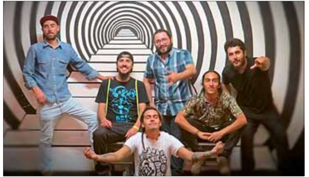
La banda 'Latimba', el sonido rumbero del valle de Aconcagua, será la encargada de cerrar la noche del miércoles.