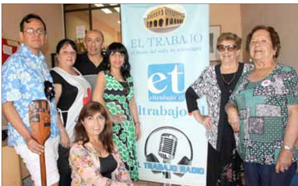
CAMARADERÍA.- Personeros de nuestro medio y al lado de sus Invitados Especiales, posaron para nuestras cámaras durante la actividad.