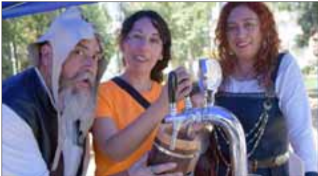
LA CERVEZA DEL VIKINGO. - Este es el stand de la hidromiel, o cerveza vikinga, es fabricada por estos artesanos capitalinos de Cinco Patas.