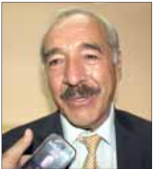
Patricio Freire, alcalde de nuestra comuna.