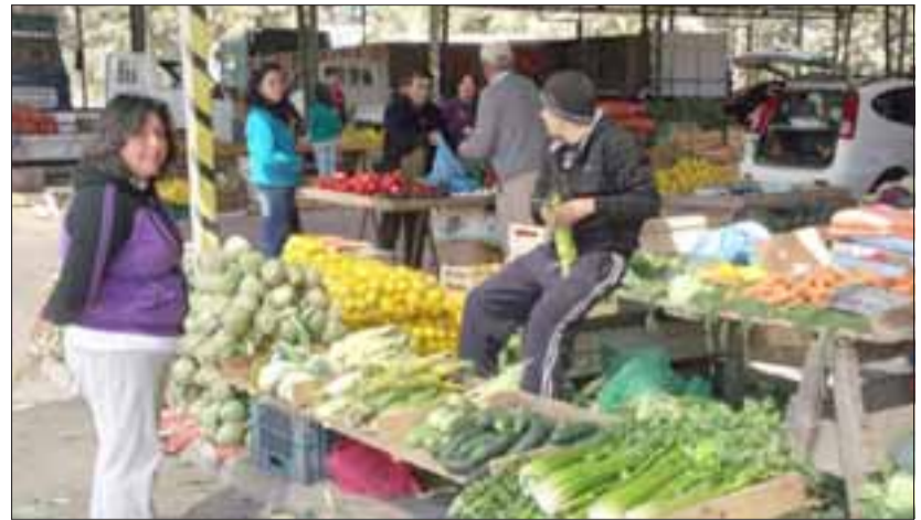
Hoy lunes reciben su correspondiente certificación, 198 locatarios pertenecientes a las provincias de San Felipe y Los Andes. (Foto Referencial).

En la región durante 2016 el FDFL benefició a 18 ferias libres y 1.747 puestos,