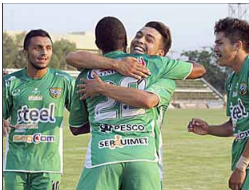
Vuelven los abrazos. - El equipo andino al fin encontró el camino y de a poco acumula puntos para zafar del descenso.