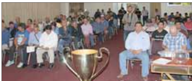
El sábado pasado en Valparaíso se realizó el Concejo de Presidentes donde se realizó el sorteo para determinar el cuadro final de La Orejona.

Poniendo especial énfasis en que no se toleraran actos de violencia y que no les temblará la mano a la hora de aplicar castigos a los clubes que incurran en actos de indisciplina, el sábado pasado se realizó la reunión extraordinaria de Presidentes de Arfa Quinta región, en la cual se llevó a cabo el sorteo para determi-