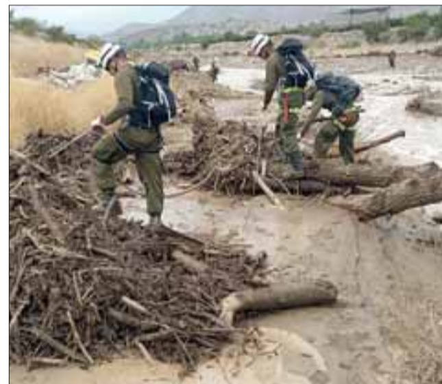
Más de cuatro kilómetros de ribera han sido recorridos por los equipos de búsqueda intentando hallar el cuerpo del malogrado exmilitar.