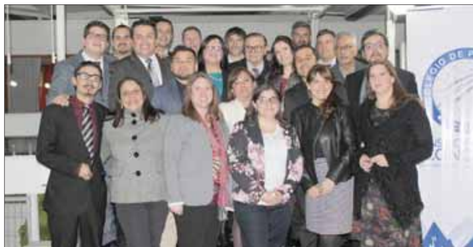
Consejo Regional Aconcagua del Colegio de Periodistas de Chile.

"La razón que esgrimió la concejala para impedir que nuestra colega interviniere en la sesión, fue su condición de funcionaria en calidad de honorarios, que la desliga de responsabilidad administrativa.