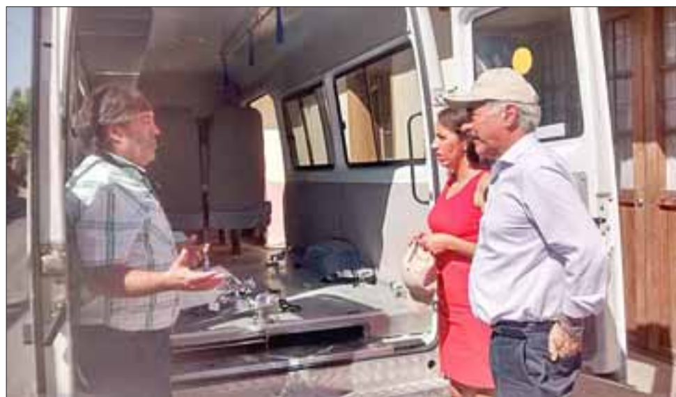
Modificaciones sustanciales al vehículo, tanto en el recambio y aumento del número de butacas para la comodidad de los escolares, son las mejoras que beneficiarán a 45 alumnos de la Escuela Especial Sagrado Corazón.

“Nuestro furgón, con el transcurso del tiempo, ya estaba deteriorado. Sin embargo, gracias al aporte de la Municipalidad pudimos realizar estas mejoras, lo que les otorga mayor seguridad a los alumnos. Este es un beneficio importante para nosotros, ya que realiza una gran cantidad de viajes durante