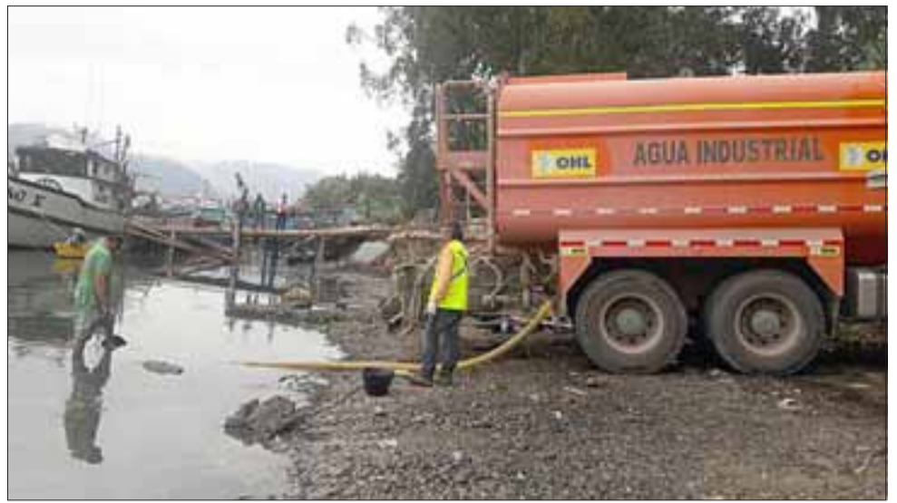
Tanto el personal como la maquinaria pesada prestaron apoyo para que las brigadas de Bomberos en tierra y el despliegue aéreo pudieran realizar de buena forma su labor de combatir el fuego en los incendios del sur del país.

La empresa multinacional OHL ha estado a cargo de las obras, las comprenden un tramo de 24 kilómetros con una inversión de 144 millones de dólares y la