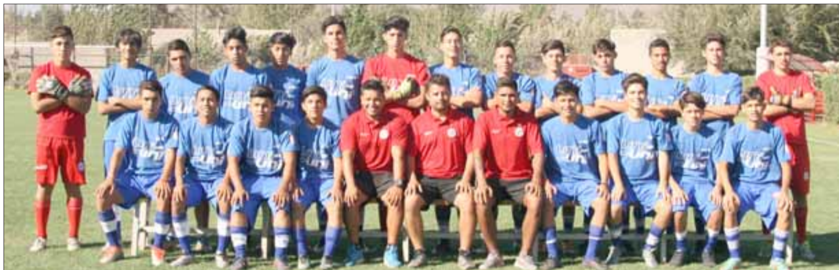
Los partidos de las series U15 y U16 (en la imagen) del Uní con Colo Colo fueron aplazados para pasado mañana.

La medida fue atendida a raíz del duelo que embarca a las canteras albirrojas por la reciente muerte del