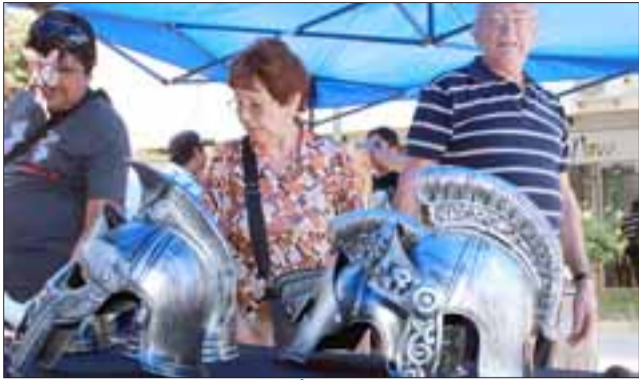
ASOMBROSAS ARTESANÍAS. - Impresionantes artesanías y yelmos de fantasía adornaron muchos stands de la feria, para asombro de los sanfelipeños.