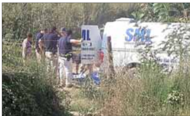
Personal Servicio Médico Legal retiró el cuerpo de la mujer.

Finalmente la tarde del domingo en el sector del callejón El Molino en San Ra-