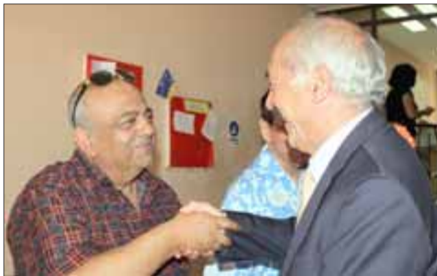
NADIE FALTÓ.- También el gerente comercial de Diario El Trabajo atendió a las autoridades y visitas especiales durante la actividad.