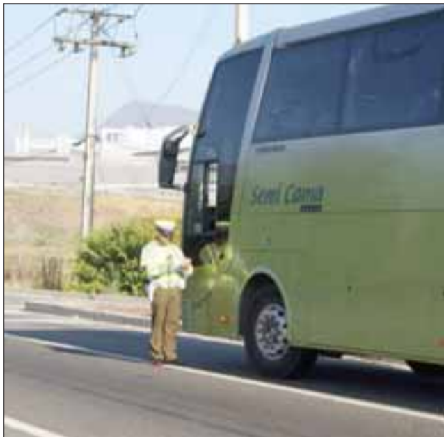
Los controles policiales se han extendido al transporte público.