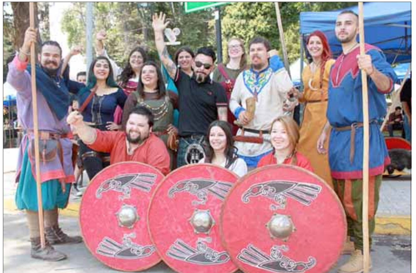
CUERVOS DE ODÍN. - Aquí tenemos a Los Cuervos de Odín, de Viña del Mar, personajes medievales que llegaron a combatir sus interminables guerras a San Felipe.