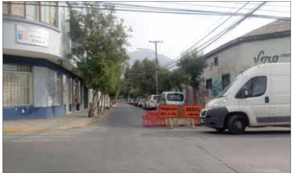
Para el día 10 de marzo, se abrirán de manera parcial los cruces de O'Higgins con Coimas y Salinas; proyectándose la apertura completa para el día 21 de marzo.

Para el día 10 de marzo, se abrirán de manera parcial los cruces de O'Higgins con Coimas y Salinas; pro-