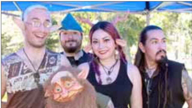
Duendes, hadas y elfos del bosque, fueron los personajes que abandonaron por un día su Mundo, para visitarnos amablemente.

La primera Feria Medieval San Felipe 2017, organizada por Jorge Gaete y en coordinación con la Oficina Municipal de Cultura, se realizó con gran éxito en el centro de nuestra ciudad desde las 11:00 y hasta altas horas de la noche este sábado en nuestra Plaza de Armas.