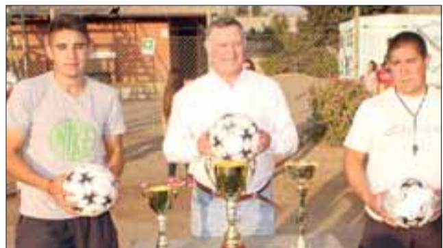
Escuelas de fútbol de los sectores de Lo Campo, El Mirador, La Pirca, Panquehue Centro y Escorial, estuvieron realizando sus clínicas deportivas, con el fin de lograr instancias de nivel formativo en niños de distintas edades.