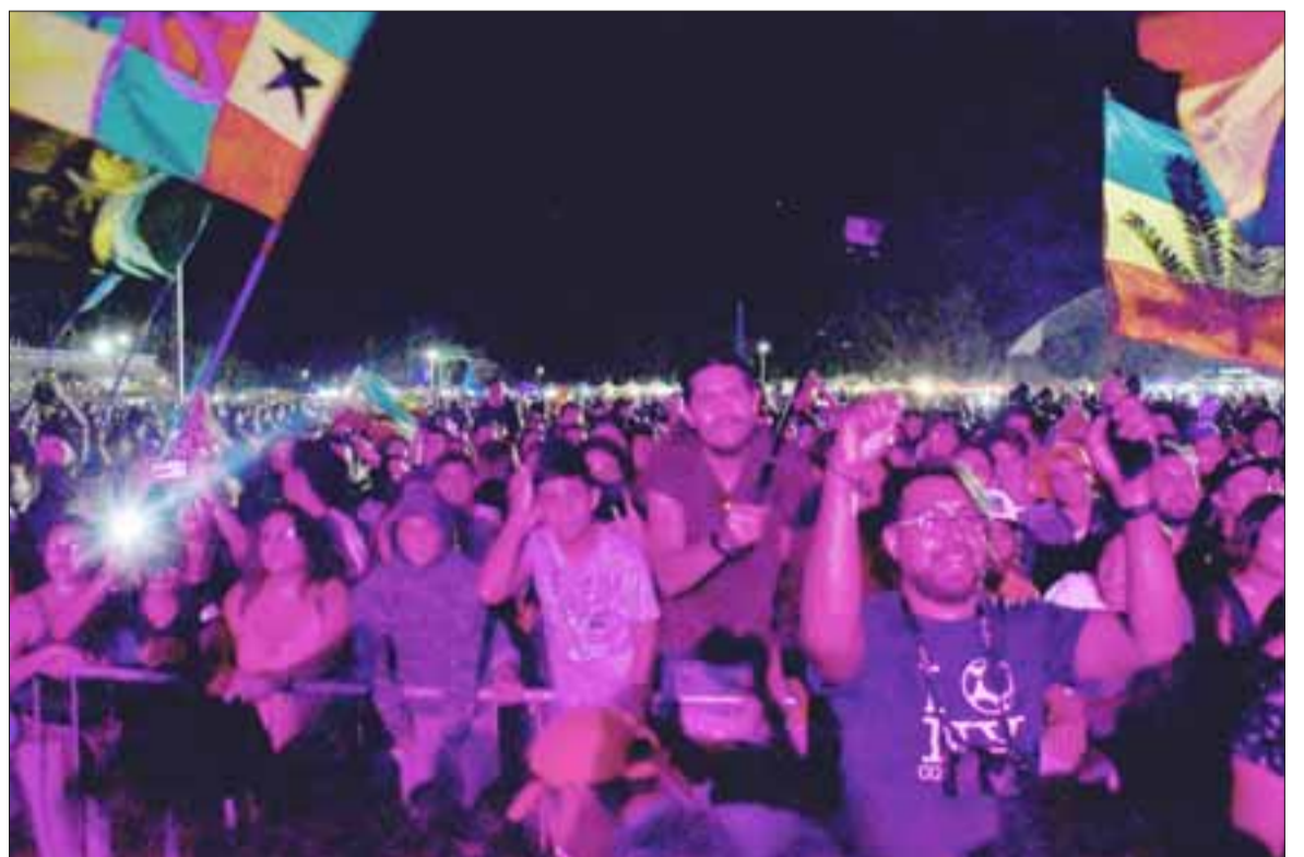
Primer Festival de la Canción Violeta al Viento, que se desarrolló durante el fin de semana en la comuna de Llay Llay, al cual acudieron más de trece mil personas en los dos días.