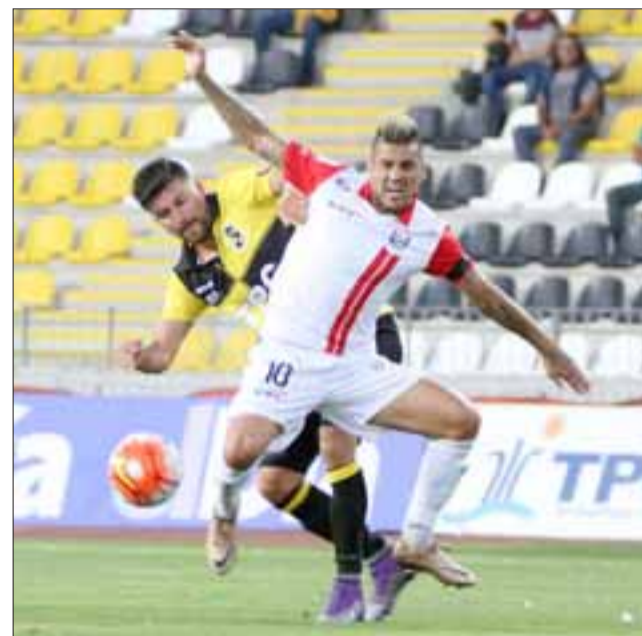
El equipo sanfelipeño consiguió un empate con gusto a poco ante Coquimbo Unido.