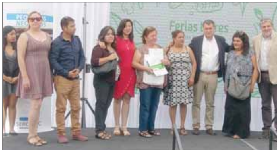
Gobernador de la Provincia de San Felipe, Eduardo León Lazcano, acompañó certificación de casi 200 feriantes del Valle de Aconcagua que participaron del programa de Sercotec ‘Capacitación y elaboración de una Plan de Desarrollo Estratégico de Ferias Libres’.