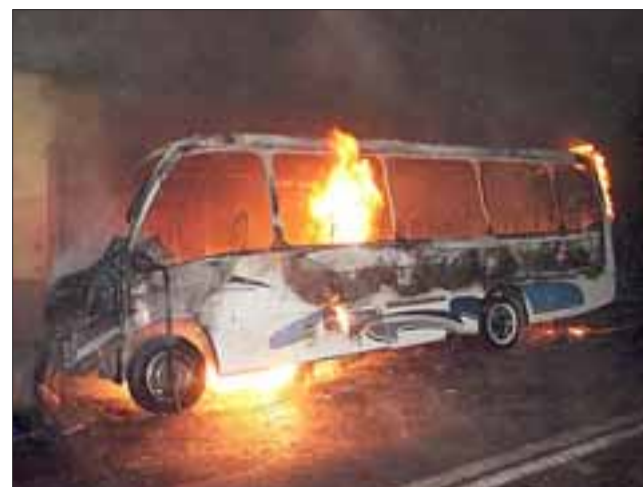
Un agresivo incendio vehicular se desató la madrugada de este domingo en Calle Brasil.