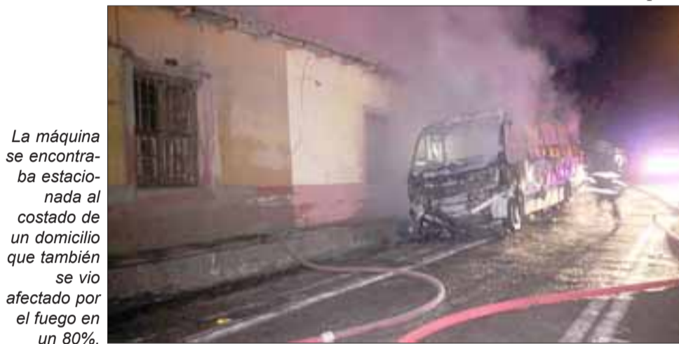
La máquina se encontraba estacionada al costado de un domicilio que también se vio afectado por el fuego en un 80%.