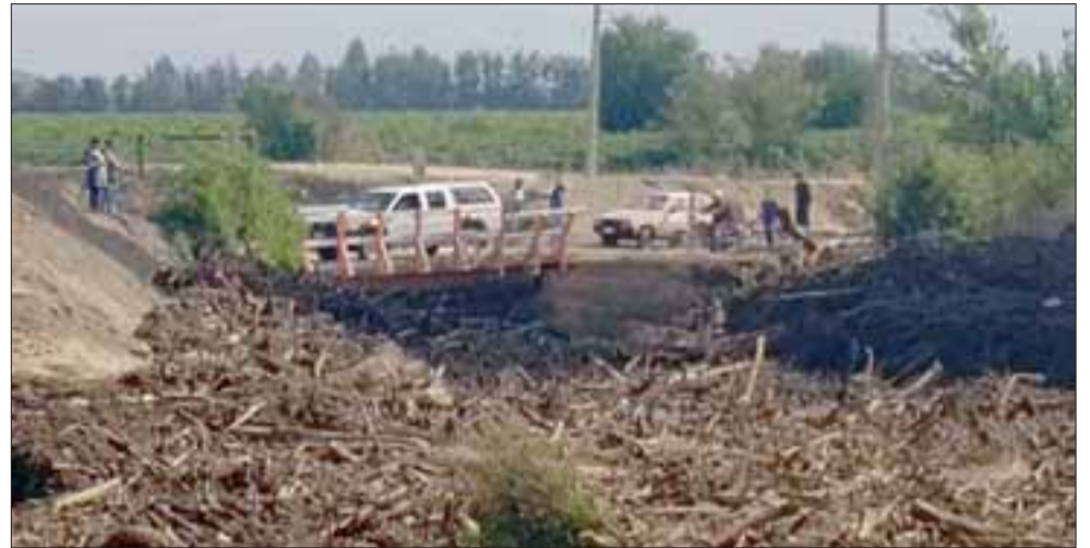
Producto del monitoreo se constató que algunos badenes quedaron inhabilitados producto de la crecida de los esteros, sin embargo se normalizó la situación volviendo a los flujos normales.