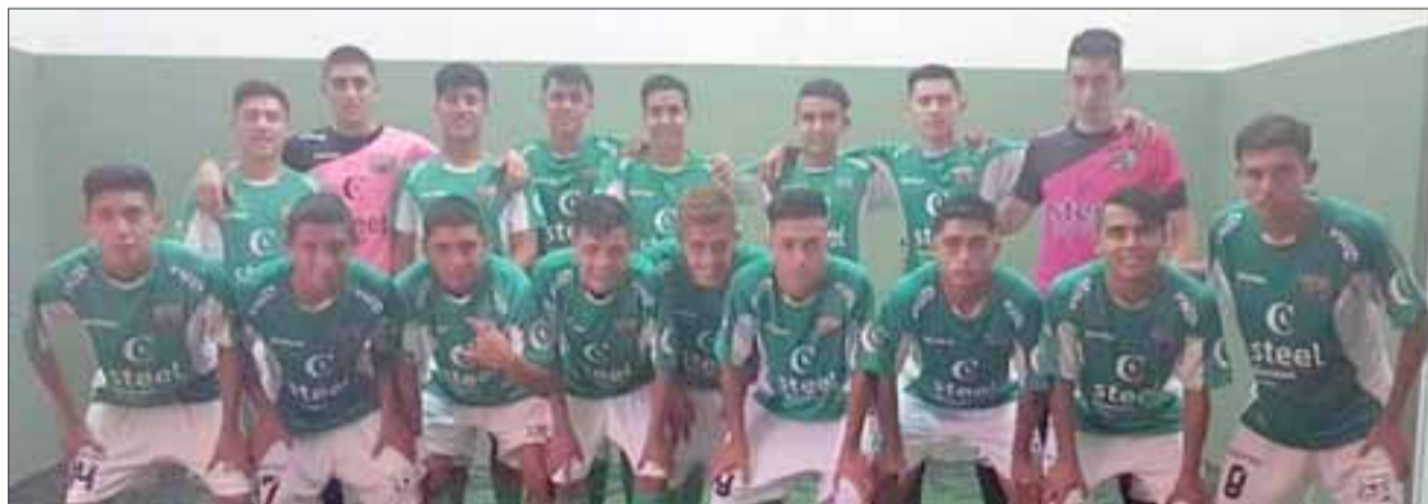
Un sonado triunfo de 2 a 1 sobre San Luis consiguió el equipo U19 de Trasandino.