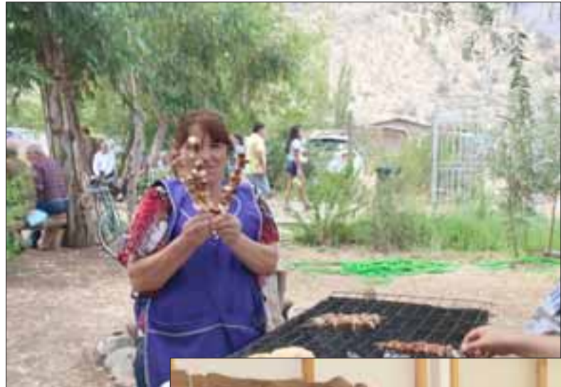
Con alegría y entusiasmo durante los vecinos del sector Los Patos en la comuna de Putaendo, desarrollaron una entreteneda 'choquerada artística' en la cual inauguraron su propio museo comunitario.