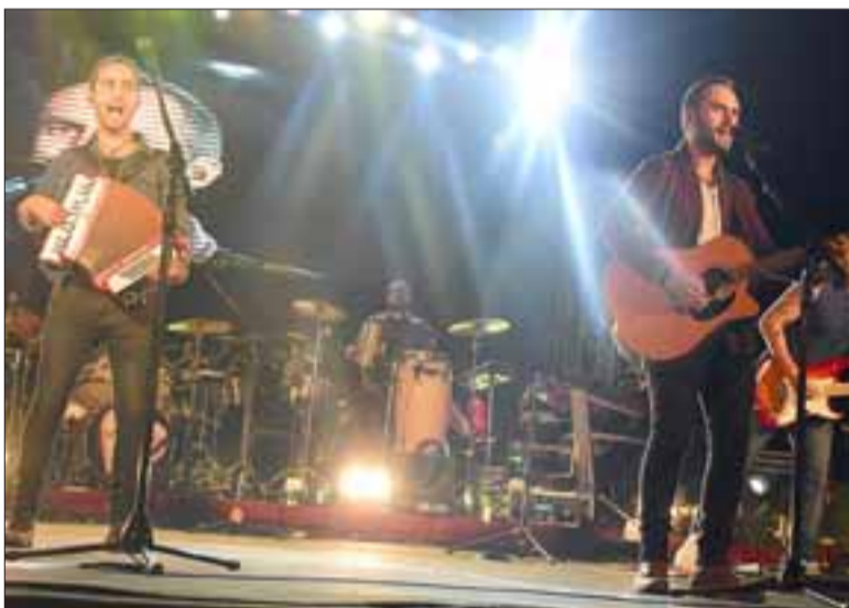
La noche finalizó con la presentación de Los Vásquez, quienes hicieron bailar y cantar al público.