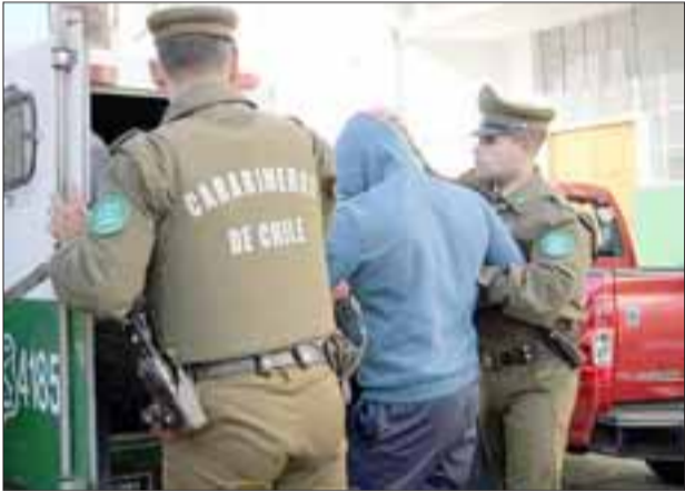
El imputado fue detenido por Carabineros por el delito de porte de arma blanca.