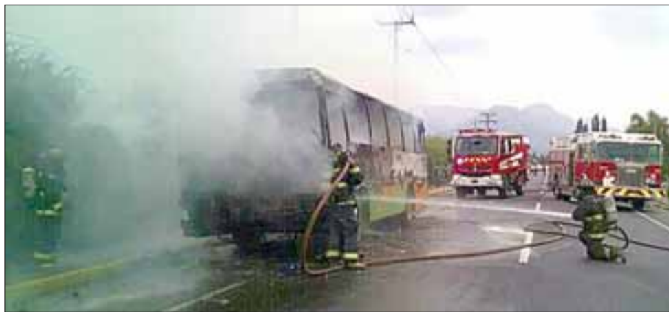
Un bus que transportaba trabajadores temporeros de origen haitiano se incendió en la carretera San Martín, generando alarma entre los testigos del hecho.

Afortunadamente ninguno de los pasajeros ni el conductor resultaron heridos, quedando el procedimiento a cargo de Carabineros de la Tenencia de Rinconada.