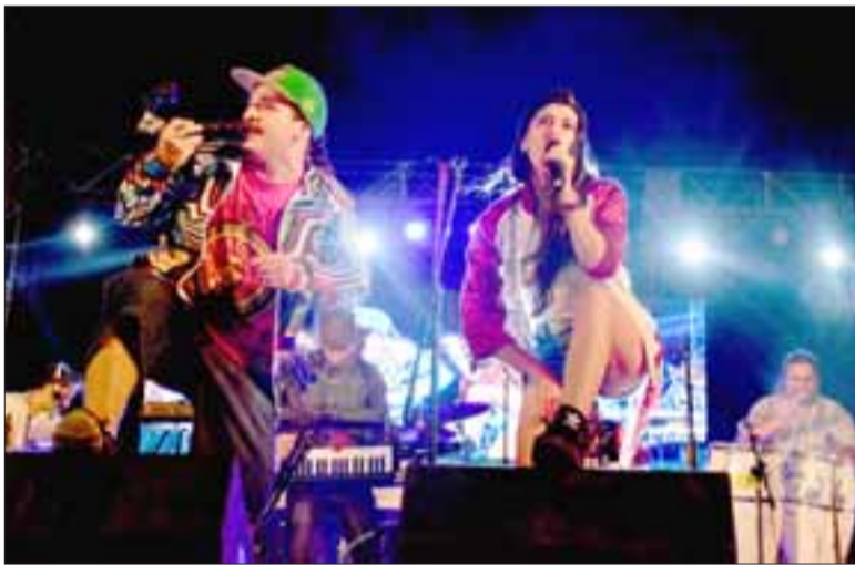
Presentaciones de bandas locales, ballet folclórico de la comuna, la presentación de los 6 seleccionados del festival.