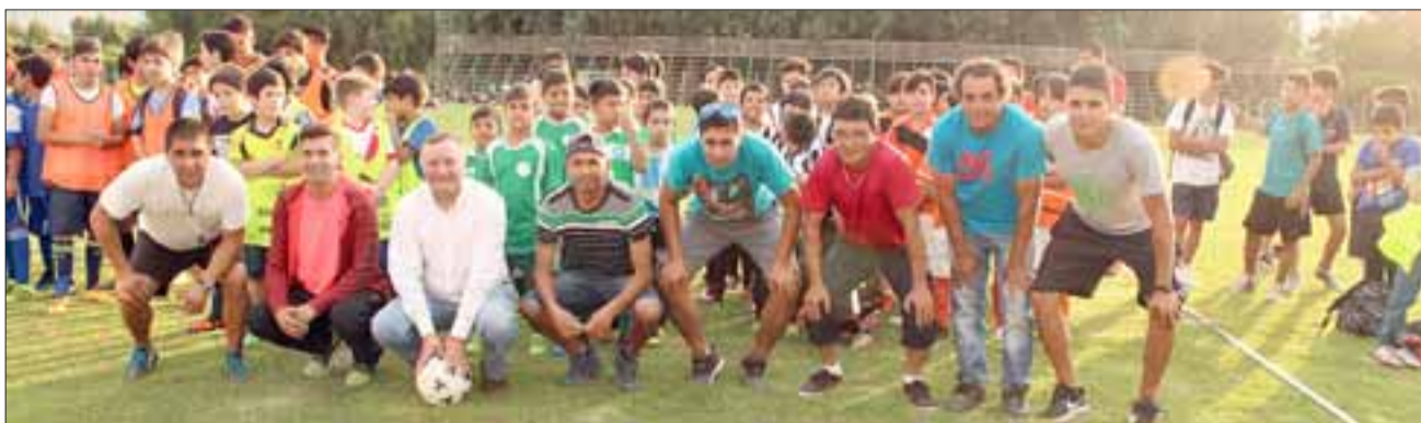
Con una masiva jornada de carácter formativa-deportiva, las escuelas de fútbol de la comuna de Panquehue, sellaron sus actividades del verano.

Por lo tanto al realizar un balance, podemos ver que el trabajo que estuvimos desarrollando durante