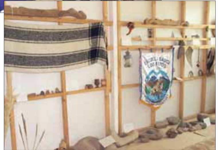
Primer museo comunitario que existe en la comuna, mediante la recolección de elementos pertenecientes a instituciones como el ex colegio, el Club de Rodeo, el Club Deportivo San Martín y colecciones particulares que fueron donadas para esta interesante iniciativa.