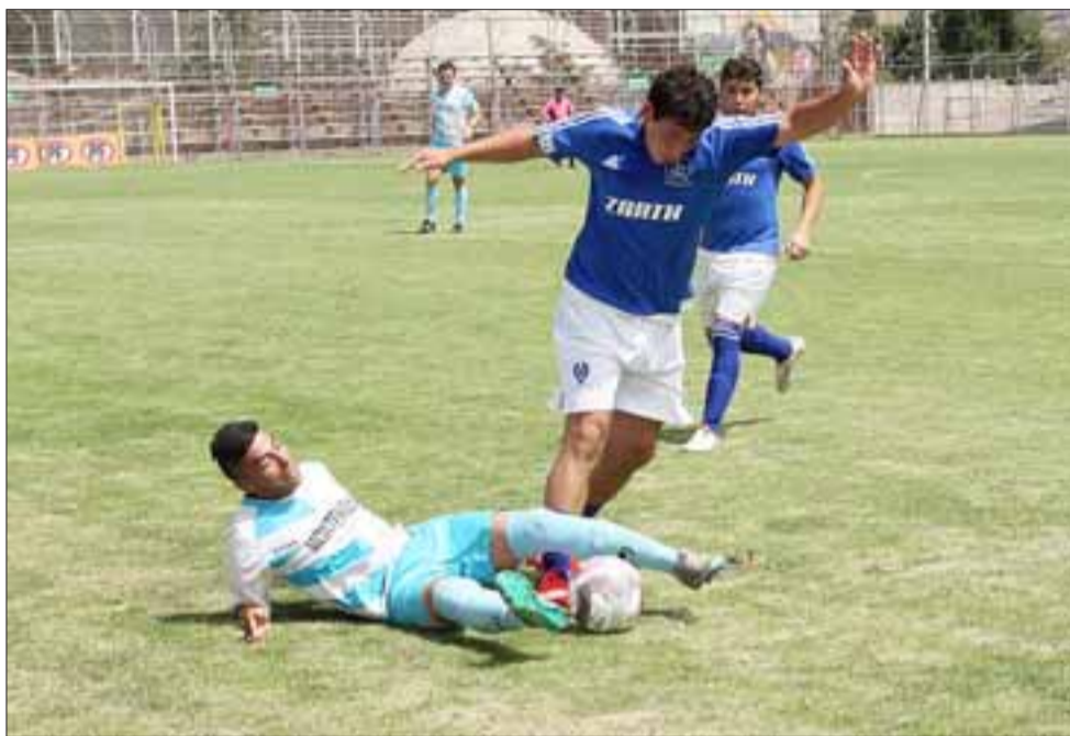
Un debut a gran nivel tuvo el monarca de San Felipe, Juventud La Troya, al golear a los porteños de Montevideo por 4 a 0.

Caupolicán 0 (Unión Del Pacífico) – Almendral Alto 4 (Santa María)