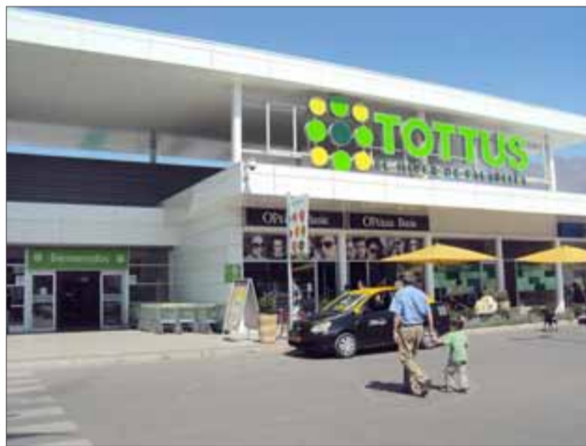
El supermercado Tottus se ubica en avenida O'Higgins 1150 en San Felipe, lugar en que el imputado fue detenido por Carabineros.