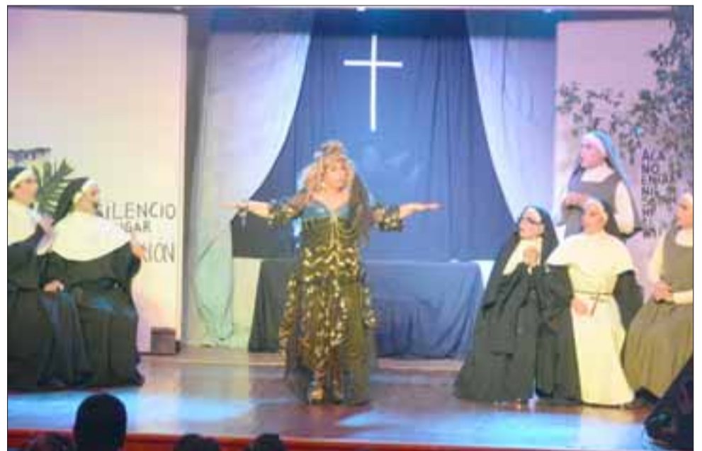
SIEMPRE VERO.- Mano de Monja es una de las obras más conocidas de esta actriz chilena, montaje desarrollado por Compañía El Baúl.

Según indicó el funcionario municipal, la idea también es involucrar a todos los aconcagüinos que quieran proponer sus ideas y talentos a favor de nuestra cultura local.