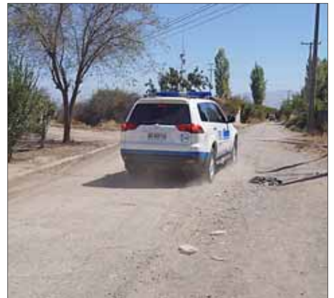
Personal de la PDI se constituyó en el lugar para realizar los peritajes preliminares a los restos e iniciar algunas diligencias tendientes a resolver el verdadero puzle policial.

Es por ello que la fiscalía instruyó a la PDI una serie de diligencias, sobre todo en cuanto a cotejar las denuncias por presuntas des-