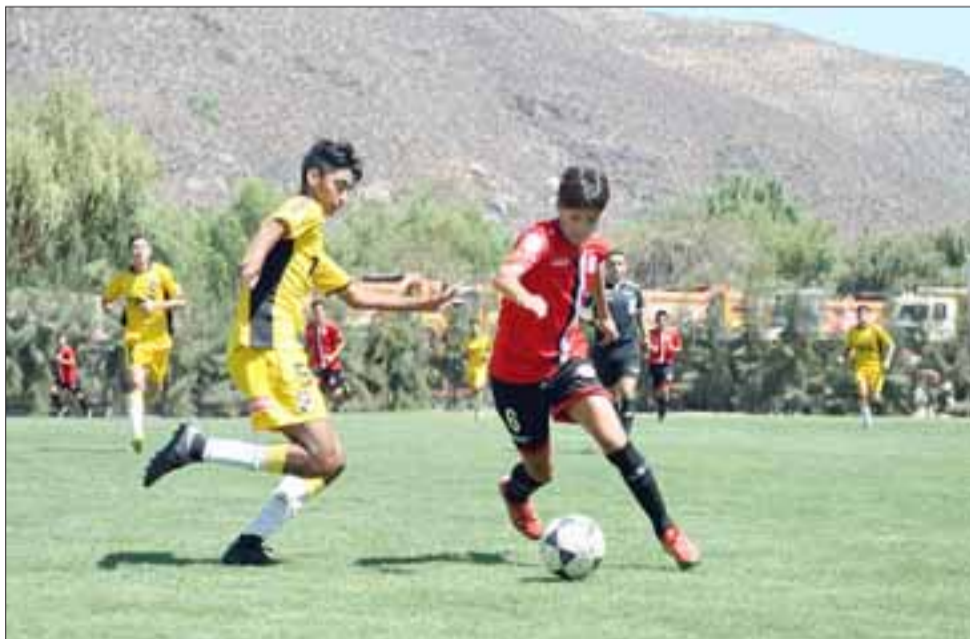
Los equipos juveniles del Uní solo lograron vencer en una serie a sus similares de Coquimbo Unido.