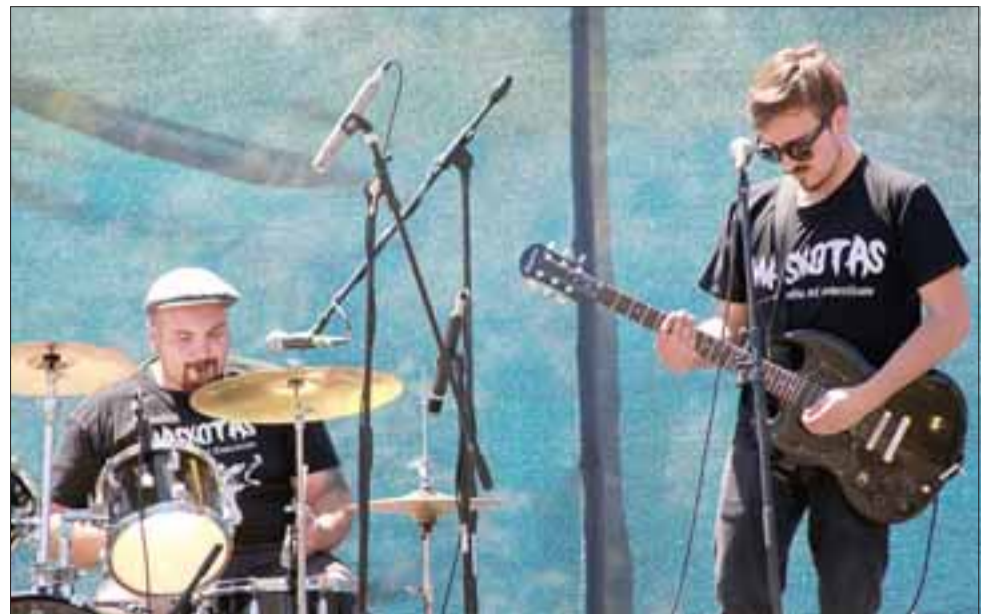
MASKOTAS.- Ellos son Banda Maskotas, con músicos andinos y sanfelipeños, quienes alegraron la mañana del sábado.

En un entorno bello y lleno de hermosa vegeta-