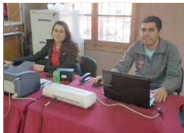
La Municipalidad de San Felipe espera superar los 12 mil 532 permisos vendidos el año 2016.

De ahí entonces que formuló un llamado a la comunidad sanfelipeña a apoyar a su municipio. “Esperamos un gran respuesta desde ya. Sobre todo los primeros días, para evitar que haya largas esperas durante los últimos días. El horario de atención será de 9 a 18 ho-