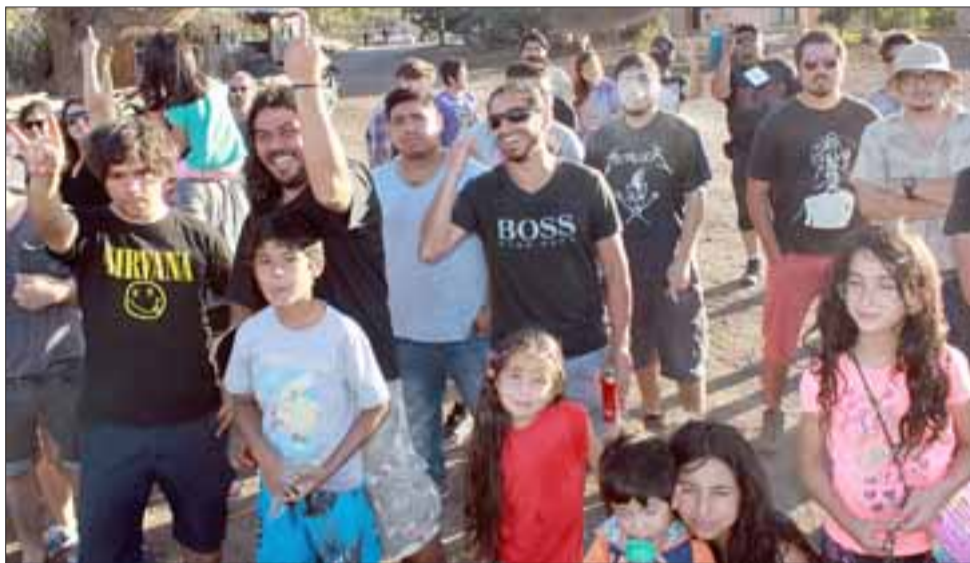
POCA GENTE.- Poca fue la asistencia a este concierto, pese a que las bandas locales lo dieron todo en el escenario.

ción, agua de vertiente y stands que amenizaron con jugos naturales de fruta, frutas con chocolate, pizzas, hamburguesas y fajitas veganas, una exquisita selección de bocadillos dulces y la venta de accesorios para instrumentos musicales a cargo de Riff.