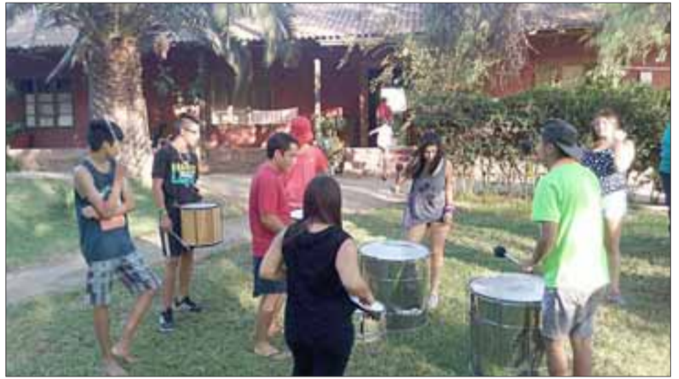
Un centenar de niñas y niños pudieron disfrutar de una alternativa de aprendizaje y diversión durante estas vacaciones.