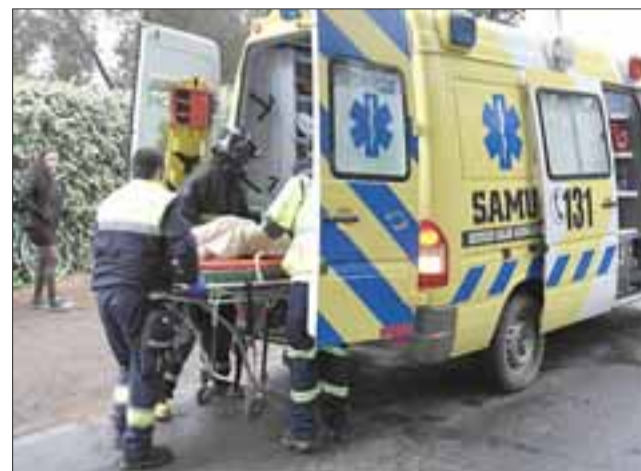
Personal del Samu trasladó al vecino de Panquehue herido por arma de fuego hasta el servicio de urgencias del Hospital San Camilo de San Felipe.

Hasta el cierre de esta nota, el Hospital San Camilo informó que el paciente se encuentra internado en la