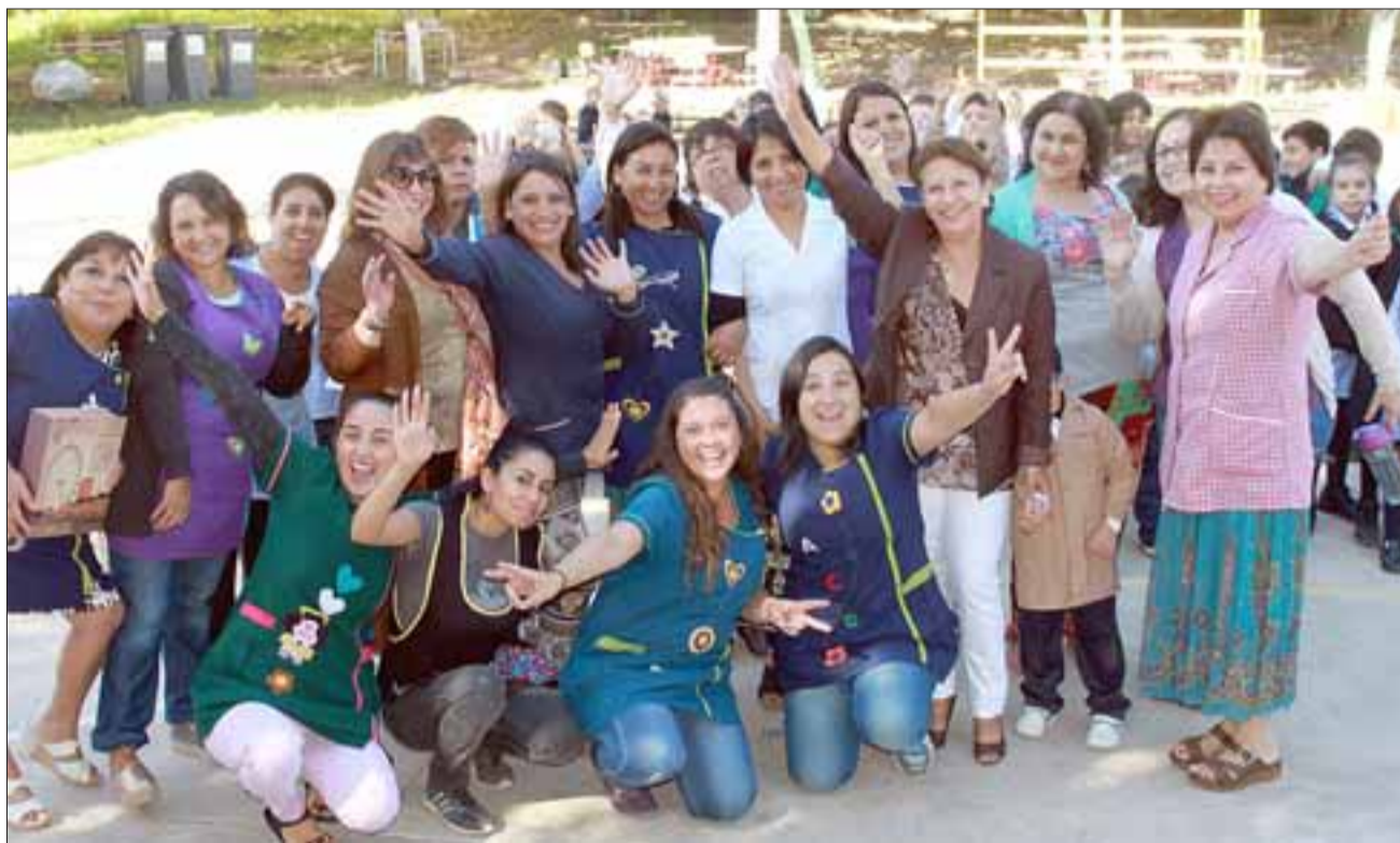
BELLAS Y REGALONAS. - Las profesoras y asistentes de educación de Escuela Mateo Cokjlat, de Tierras Blancas, posaron alegremente para las cámaras de Diario El Trabajo en su día.

Desde entonces las movilizaciones de las mujeres comenzaron a ser más notorias, especialmente luego de 1909, cuando las Mujeres Socialistas en Estados Unidos conmemoraron por primera vez el Día Nacional de la Mujer el 28 de febrero, con una manifestación de más de 15.000 personas que salieron a la calle a reivindicar igualdad de salarios, reducción de la jornada laboral y el derecho a voto, sin embargo, la fecha no se oficializó hasta 1975,