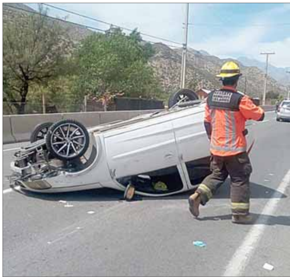
Al lugar de la emergencia concurrió una unidad de la Primera Compañía de Bomberos de Los Andes y personal de Carabineros.

cia concurrió una unidad de la Primera Compañía de Bomberos de Los Andes y