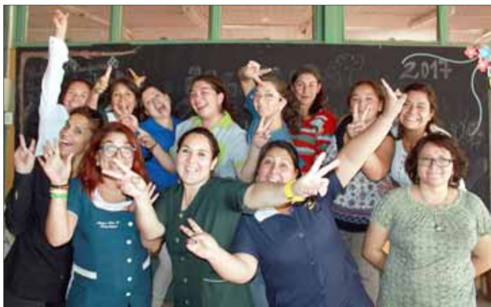
CHICAS DE POSTAL. - En el otro extremo de nuestra comuna, en Bellavista, fueron las damas de la Escuela Carolina Ocampo las que se tomaron unos minutos del recreo para regalarnos esta Postal.