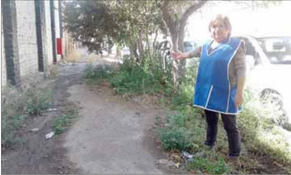
Basura, maleza, veredas sin pavimentar, barro, deterioran notablemente la calidad de vida de los vecinos del sector.

Finalmente insistieron en la necesidad de podar los árboles que están muy frondosos y contribuyen a la oscuridad, además de los otros problemas que afectan a los vecinos de calle 5 de Abril.