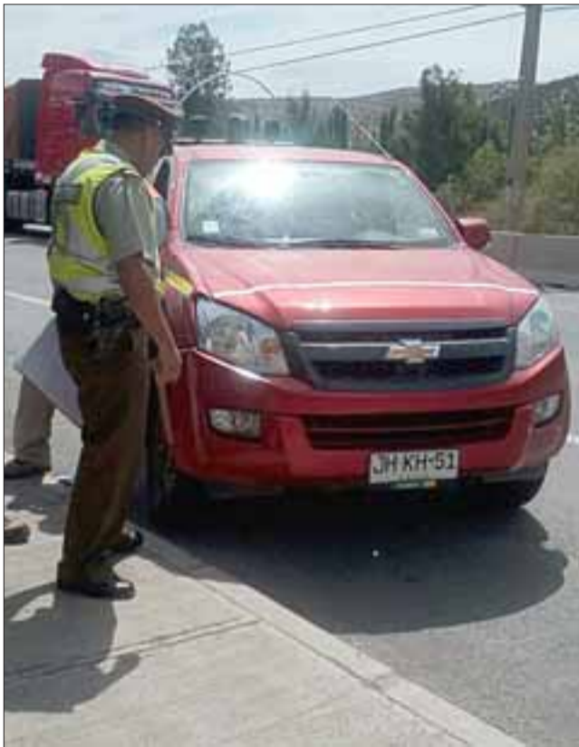
Con lesiones de carácter leve resultaron los dos ocupantes de un automóvil que la tarde del martes volcó de campana en la ruta internacional.

LOS ANDES.- Con lesiones de carácter leve resultaron los dos ocupantes de un automóvil que la tarde del martes volcó de campana en la ruta internacional. El accidente se produjo cerca de las 13:40 horas, cuando el automóvil marca Chevrolet modelo Corsa, matrícula ZJ 37-49 se desplazaba de oriente a poniente por esa ruta y al llegar al kilómetro 8 perdió el control y se salió de la pista colisionado en el costado a la camioneta Chevrolet D Max, matrícula JH KH 51 que iba en sentido opuesto.