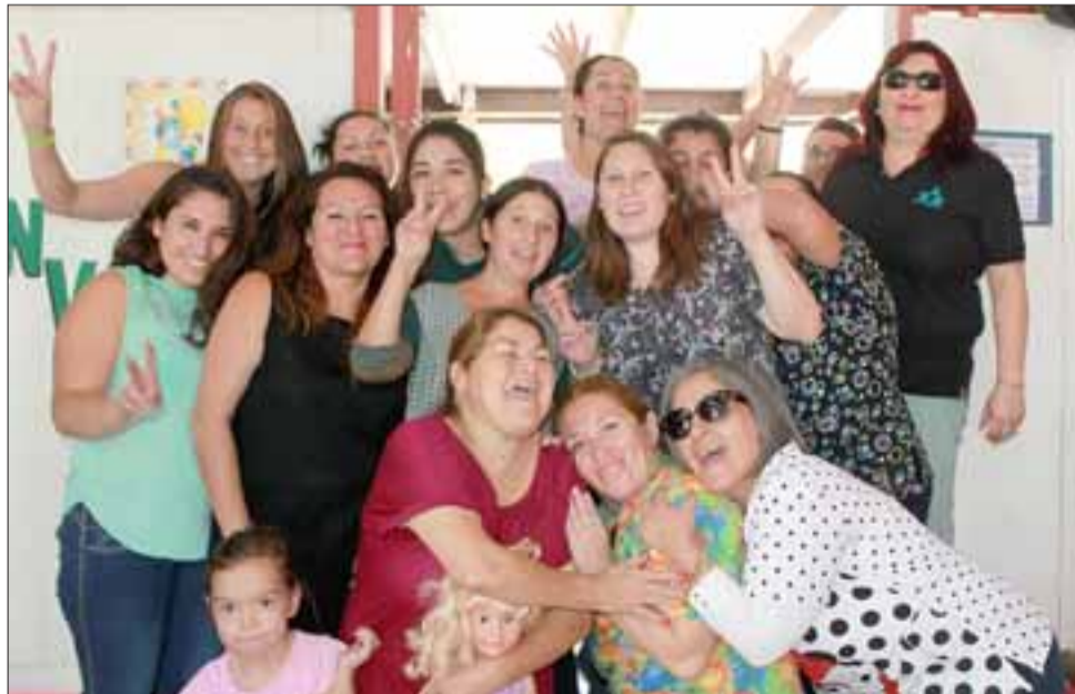
DESAYUNO ESPECIAL. - Pero en la Escuela San Rafael en cambio, el director dispuso ofrecer a las profesoras y asistentes un saludable y ameno desayuno.