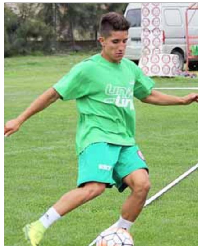
El joven jugador del Uní cuenta con pasaporte canadiense, lo que le permite integrar sin problemas el combinado U23 de ese país.