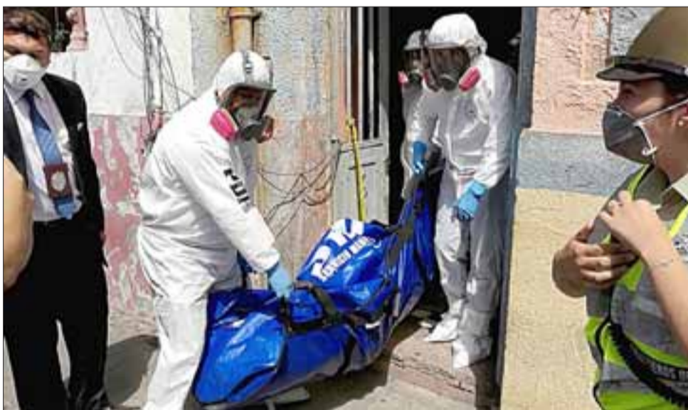
Horas antes de la conmemoración del Día Internacional de la Mujer, el cuerpo de la joven fue hallado dentro del archivo municipal en calle Prat de San Felipe.