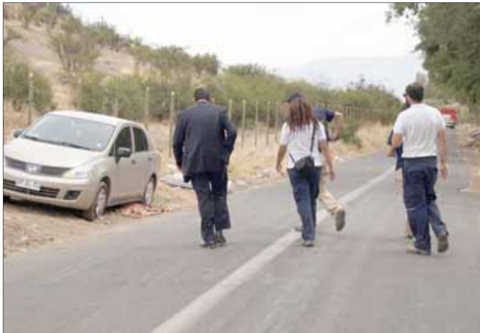
Personal de la PDI durante la reconstitución de escena realizada este martes en el sector calle Los Olmos.