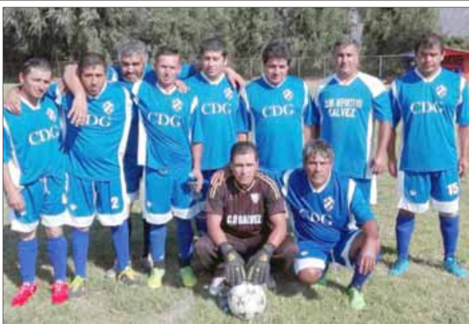
Deportivo Gálvez quedó en el grupo A-2 en la zona alta de El Amor a la Camiseta.