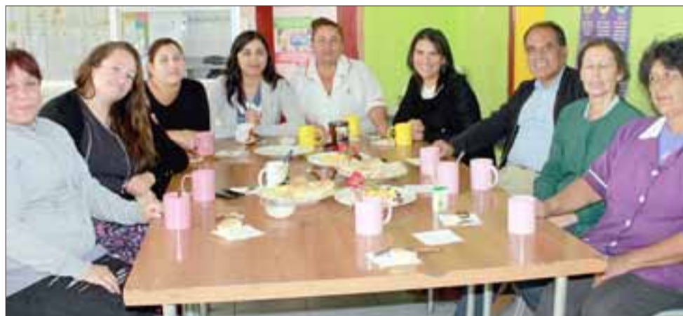
EL ASIEN TO. - En la Escuela José Bernardo Suárez, de El Asiento, las féminas educadoras también hicieron una breve pausa en su día. Algunas apoderadas se unieron al momento.