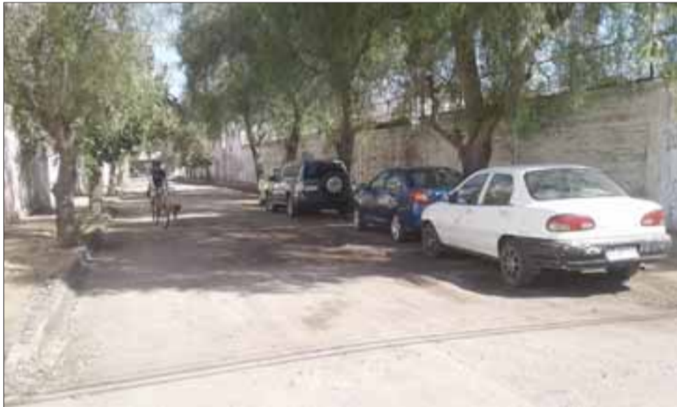
Esta es la calle que está sin pavimentar y que es ocupada constantemente como motel. Es la cuadra que va desde Molina a la Avenida Riquelme.