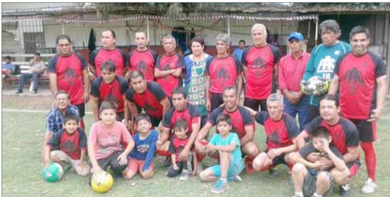
Pedro Aguirre Cerda fue el mejor de principio a fin en el campeonato central de la Liga Vecinal.

Resultados fecha final: Tsunami 2 – Pedro Aguirre Cerda 1; Resto del Mundo 2 – Aconcagua 2; Andacollo 2 – Unión Esfuerzo 2; Barcelona 3 – Hernán Pérez Quijanes 2; Unión Esperanza 5 – Los Amigos 1; Carlos Barrera 6 – Villa Los Álamos 1; Santos 6 – Villa Argelia 0.